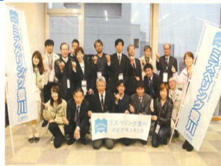
ミズベリング恒例の記念撮影