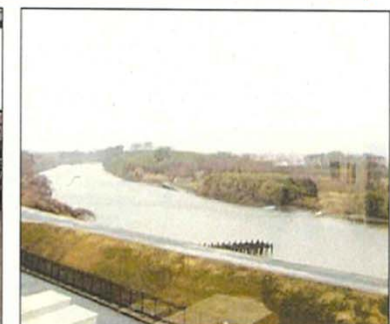
豊川の見える会場でたくさんの方に参加いただきました。