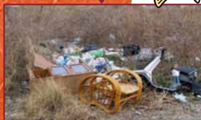
ますますゴミが増える