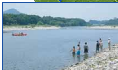
いつまでもきれいな水辺