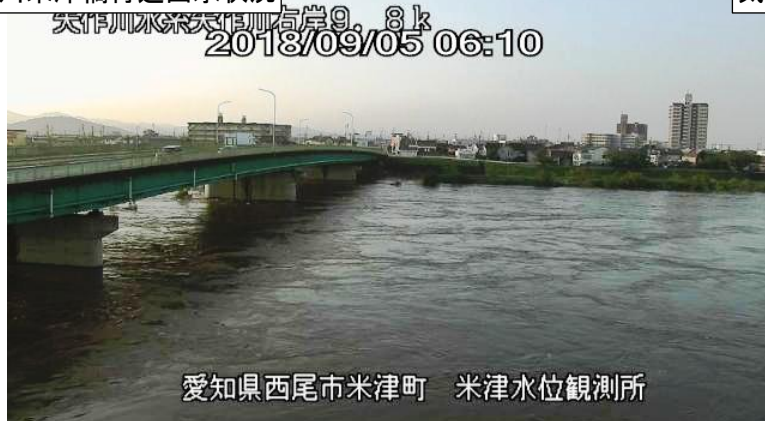
矢作川米津橋付近出水状況