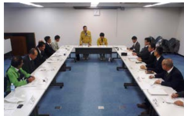
意見交換会の様子（名四国道事務所）