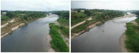
6/26 葵大橋上流 (31.8kp) 7/24 葵大橋上流 (31.8kp)