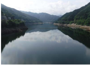
矢作ダム 7月24日 貯水率 48.5% 放流量 8.6m 3 /s