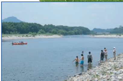
いつまでもきれいな水辺