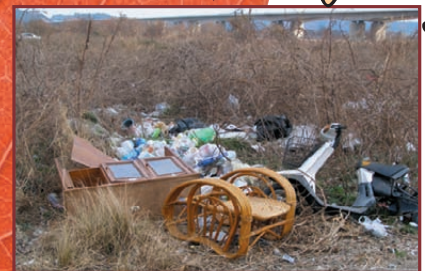
ますますゴミが増える