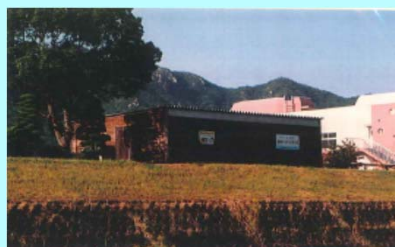
市民団体による活動拠点の整備事例（佐波川）

※ 河川管理者から河川管理施設の維持、除草等の委託を受けることも可能となります。委託先については、公募等の適正な手続きを経て選定を行う予定です。