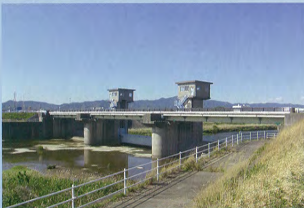
現在の豊川放水路