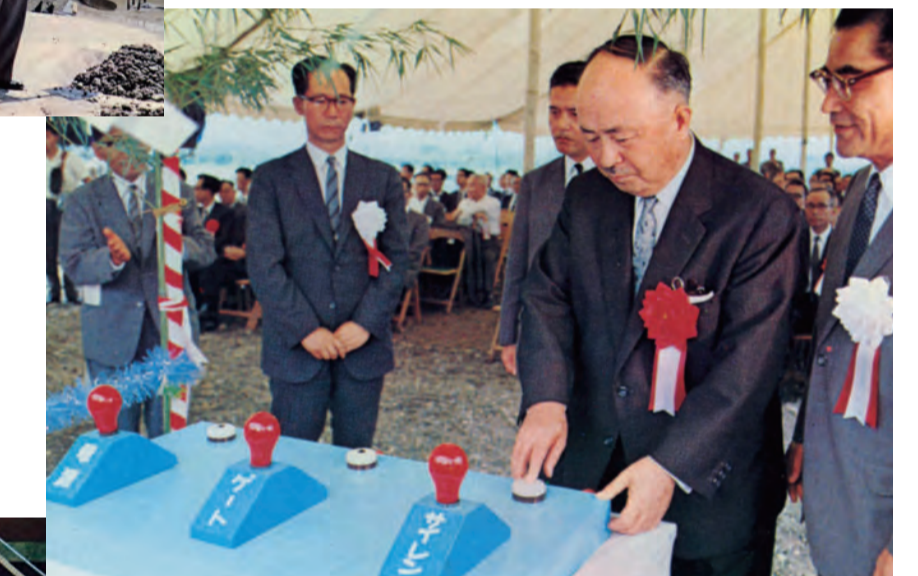
昭和40年7月の通水式