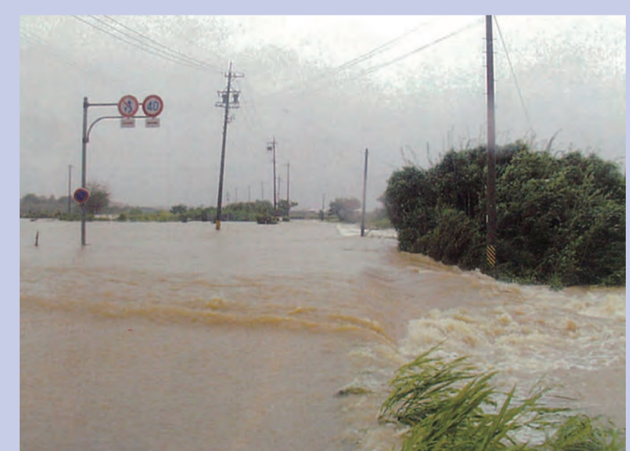
豊橋市三上町で洪水が堤内地に浸水