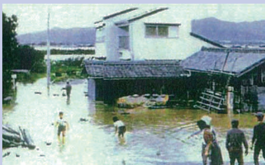
豊橋市石巻小野田町の床上浸水