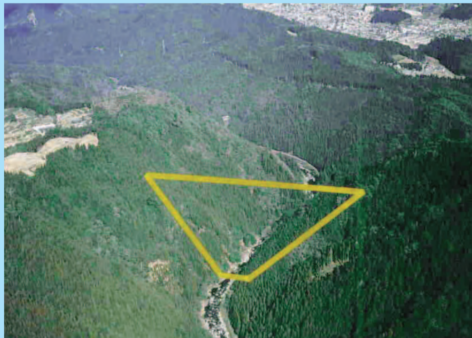
設楽ダム建設予定地