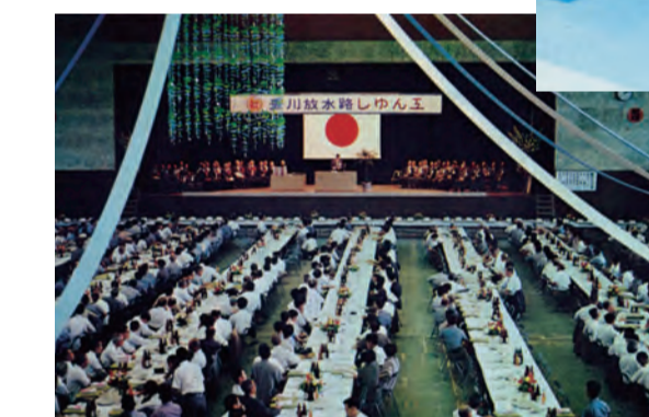
昭和40年7月の竣工式