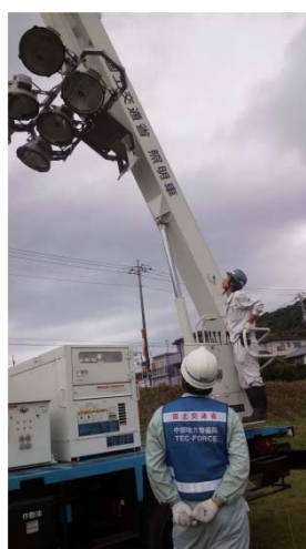
排水ポンプ車や照明車の操作訓練状況