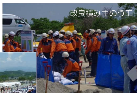
改良積み土のう工