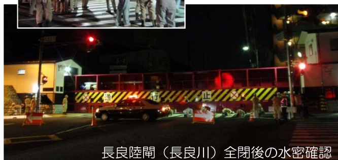
長良陸閘（長良川）全閉後の水密確認