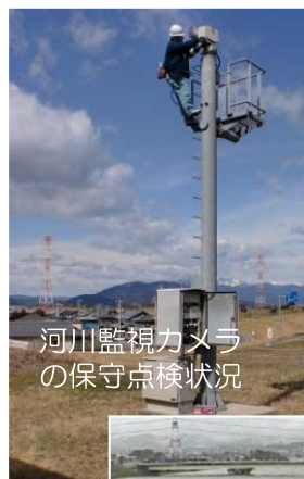
河川監視カメラの保守点検状況

各河川事務所では、多くの河川管理施設が老朽化にともなう更新時期を迎えています。このような実態を踏まえ、河川維持管理計画や長寿命化計画等の計画を基にそれぞれの施設の状況に応じた点検を実施し、施設の機能維持に努めています。