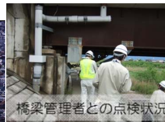
橋梁管理者との点検状況