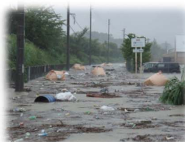
台風第15号 平成23年9月：庄内川