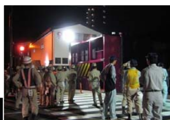
陸閘の操作訓練及び施設点検の状況

各河川事務所は、河川管理施設や災害対策車両等の操作訓練等の水防技術講習会を開催し、出水期へ備えています。