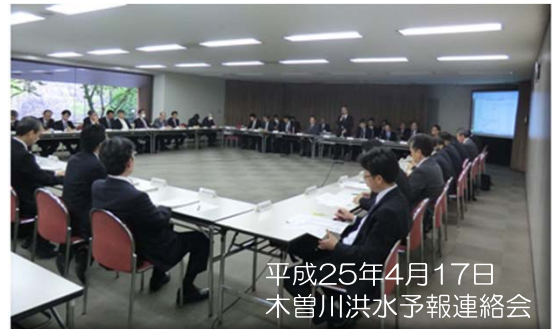
平成25年4月17日 木曾川洪水予報連絡会

水防活動に必要な重要水防箇所※や水防資機材の整備状況、水防警報の連絡系統、既往洪水での出水状況、河川改修の状況等の情報を共有するため、各河川事務所は出水期を前に、県水防担当事務所や水防管理団体などの関係機関とで構成する連絡会を開催しています。