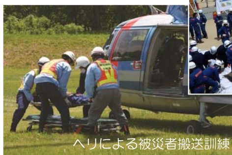
ヘリによる被災者搬送訓練