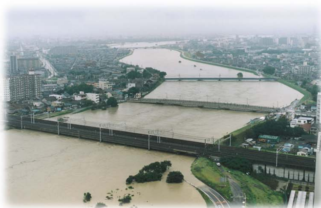
東海豪雨 平成12年9月：庄内川・新川

～ 中部地方整備局は、管内の水防団や関係機関と合同で水防訓練や巡視、連絡会議など行い、出水に備えます ～