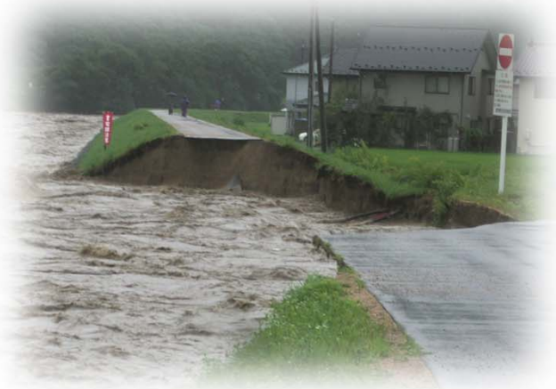
梅雨前線豪雨 平成18年7月：天竜川