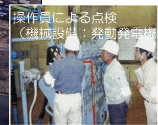
操作員による点検 (機械設備：発電発電機)