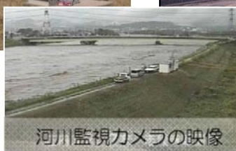
河川監視カメラの映像

河川管理施設以外の施設（許可工作物）についても、当該施設の管理者が施設を良好な状態に保つことが必要であり、施設が適切に維持管理されるよう指導等を行っています。