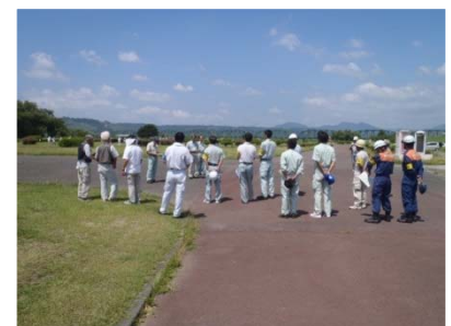
各種団体との安全パトロール