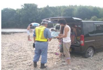
安全利用の呼びかけ

各河川事務所は、河川利用者の水難事故を未然に防止するため、警察や消防、自治体、河川協力団体等と連携し、共同でのパトロールなどを実施しています。