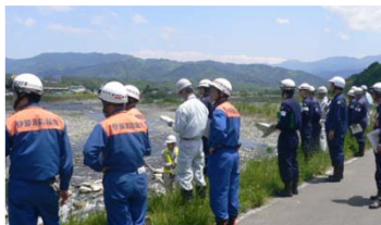
重要水防箇所の合同巡視