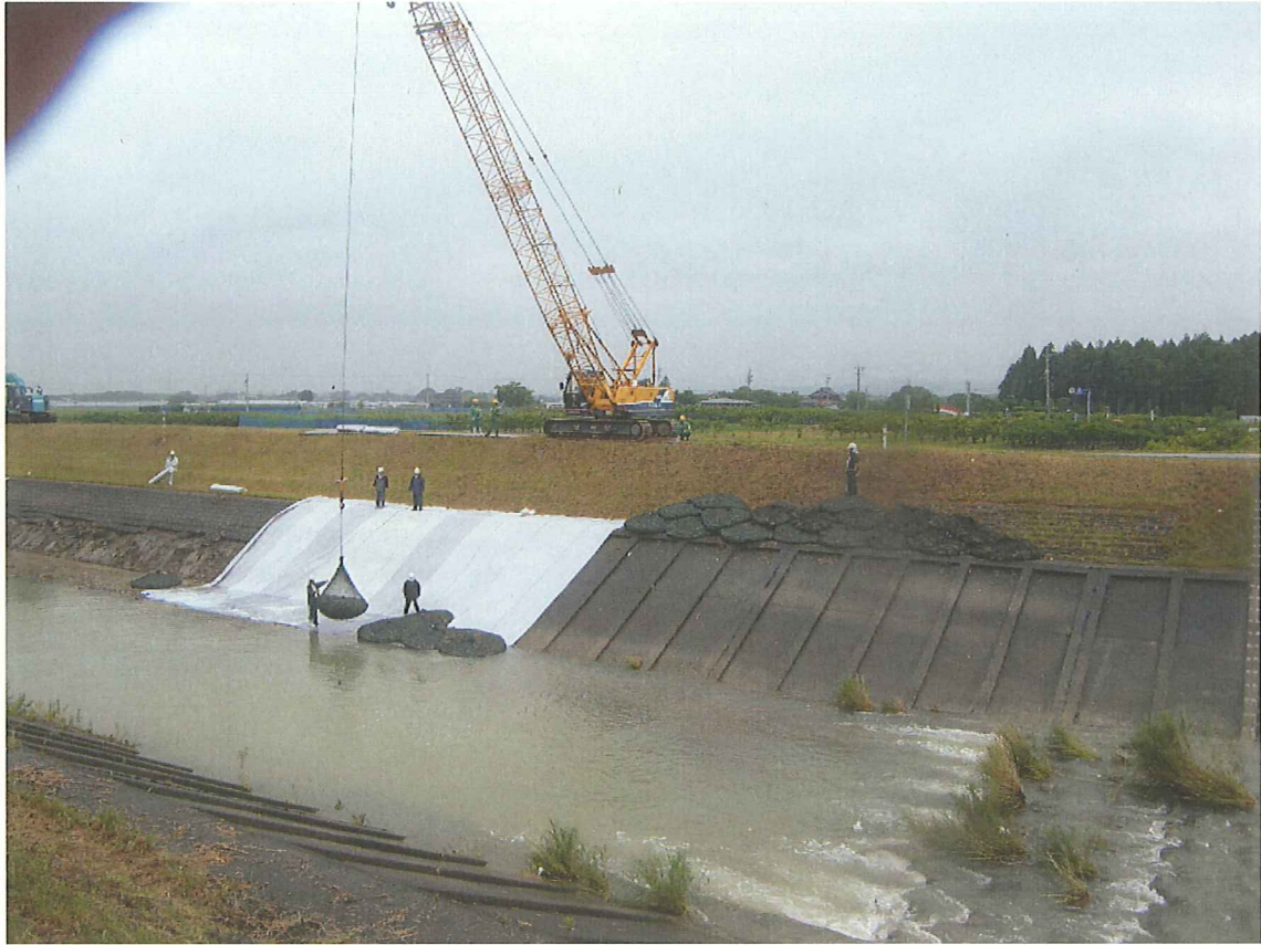
写真-2 応急復旧の状況