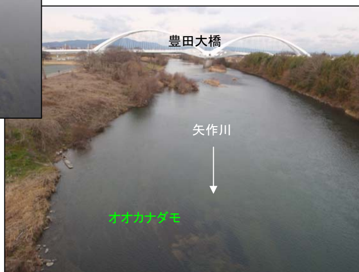
オオカナダモ繁茂状況 (久澄橋から上流を望む)