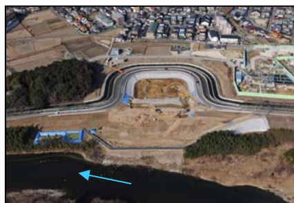
安永川樋門整備(豊田市)