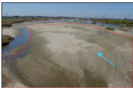
上町地区河道掘削(西尾市)