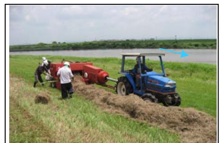
堤防維持管理工事