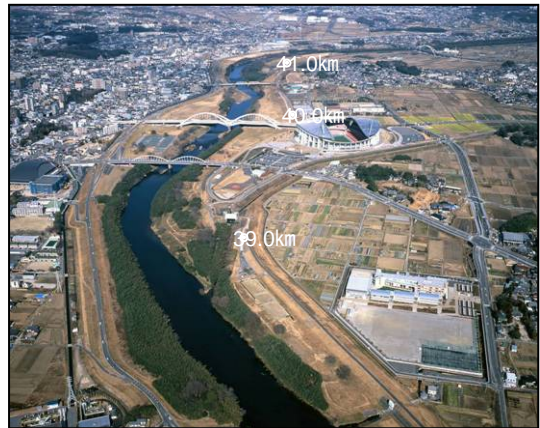
豊田市役所付近から上流を望む