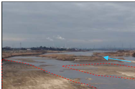
上町地区河道掘削(西尾市)