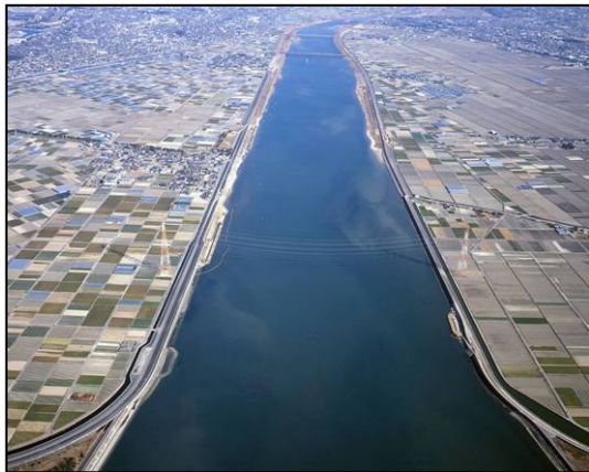
河口から上流を望む