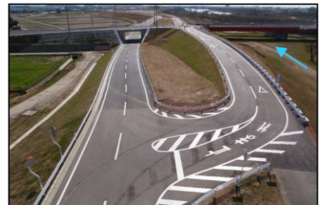
堤防リフレッシュ工事(岡崎市)