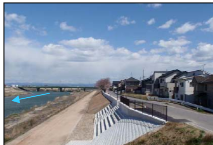
米津地区堤防整備(西尾市)