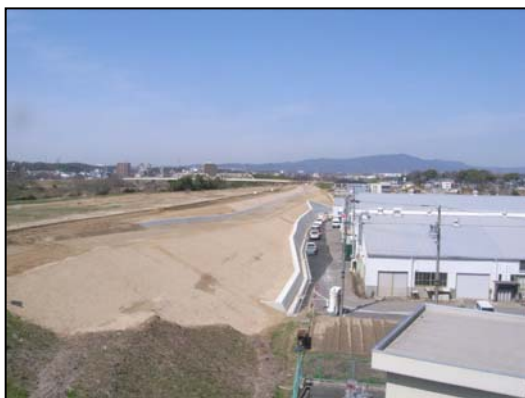
千石築堤工事(豊田市)