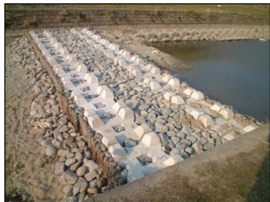
鹿乗川床止補修工事(碧南市)