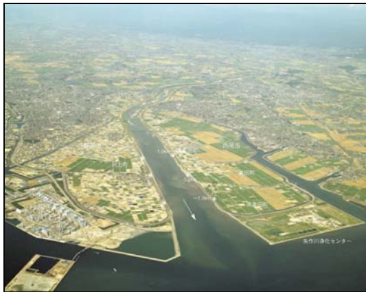
河口から上流を望む