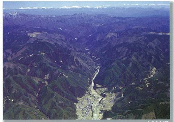
矢作川上流 上村川 かみむらがわ