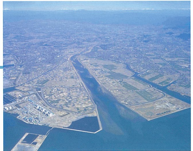
河口から上流を望む