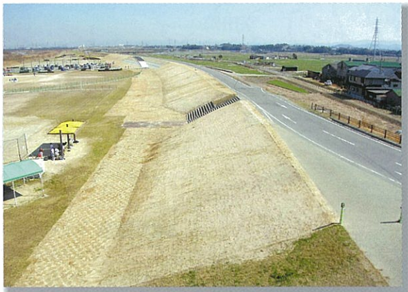
上町築堤工事 (西尾市上町地区)