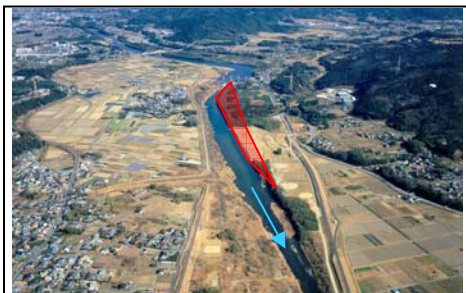
一鍬田地区河道掘削(新城市)