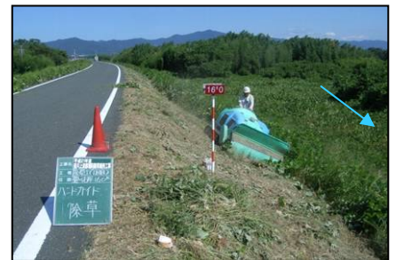
堤防維持管理工事