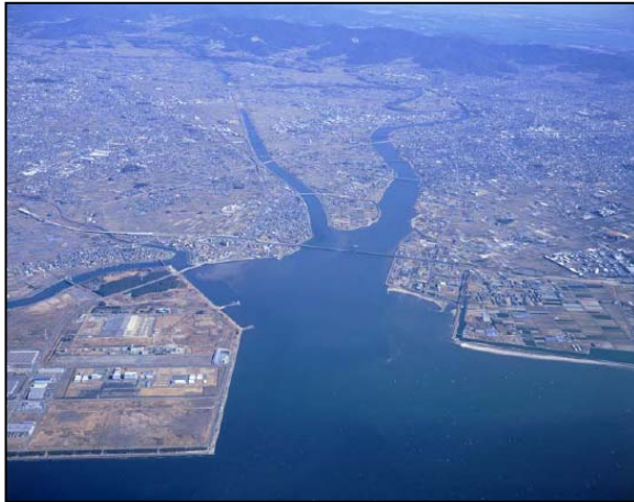
河口から上流を望む