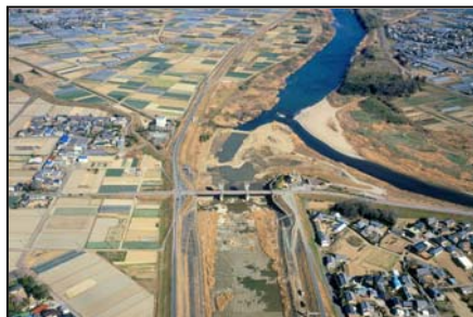
放水路分流堰耐震補強(豊川市)