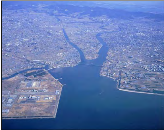
河口から上流を望む