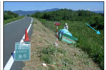
堤防維持管理工事