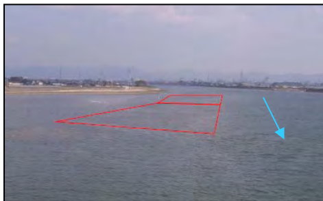
豊川河口部干潟造成(豊橋市)