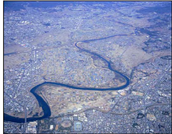
豊橋市役所付近から上流を望む