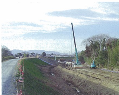
大村弱小堤対策(止水矢板施工状況)(豊橋市)