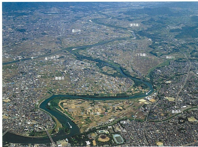
豊橋市役所付近から上流を望む