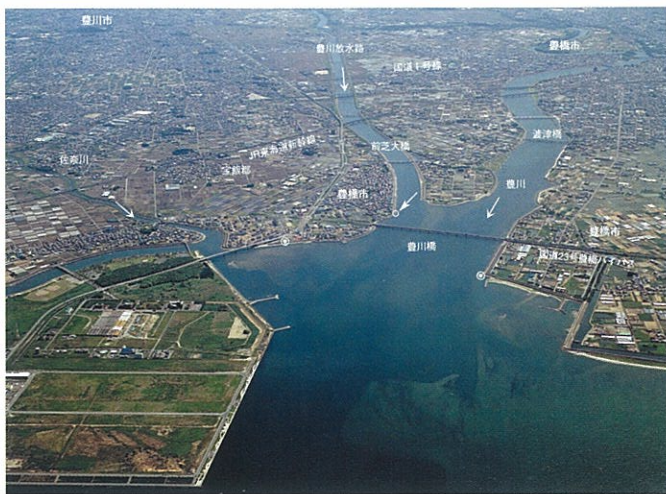
河口から上流を望む