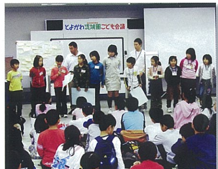
とよがわ流域圏子ども会議