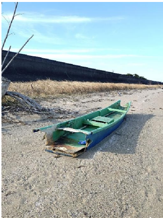
右岸河口にR7年流れ着いた和船➡