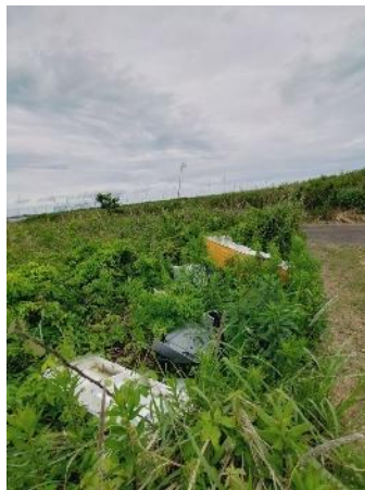
R8年2月から放置されてい冷蔵庫 だいふ草で覆われて来た。 右岸1.2km