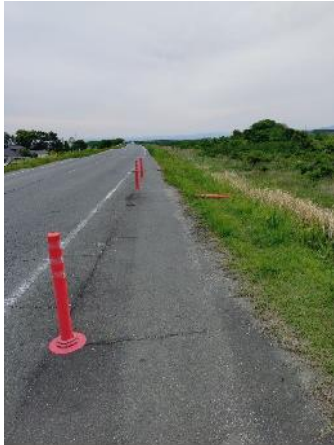
5.4-5.6km右岸赤いポールが折れていた。