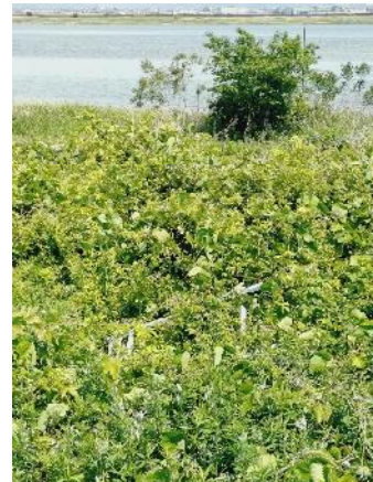
右岸1.0-1.2km付近アルミの柵が草に埋もれている。