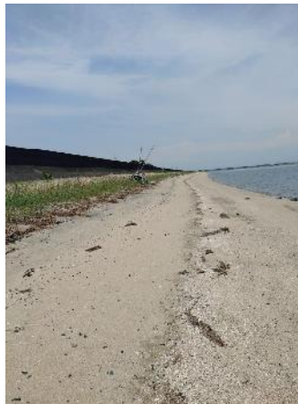
1年ぶりに撤去されたのか、その姿を見ることができなかった。