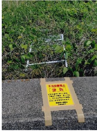
1.0km付近 クサに大分埋もれてしまった柵。