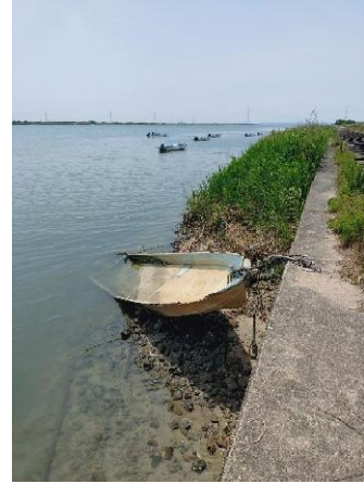
使用されていないと思われる漁船。