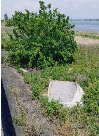
右岸1.2-1.4kmベットのマットレスの不法投棄