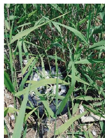
右岸2.0kmタイヤが草に埋もれている。