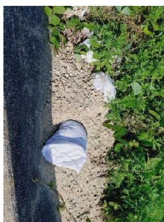
右岸1.4km土砂?コンクリート片の様な不法投棄があった。