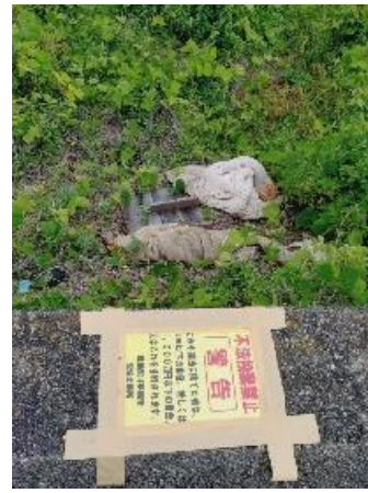
左岸0.6km、木製のパレットや布団などが不法投棄されていた。