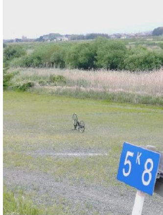
5.8km桜堤駐車場にオブジェの様なものが有った。