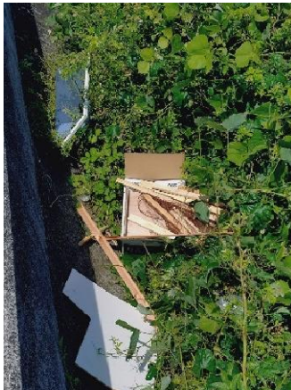
右岸0.8km付近廃材などの産廃が不法投棄されていた。