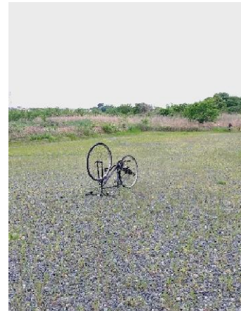
近づいてみると自転車が逆さまに立ててあった。