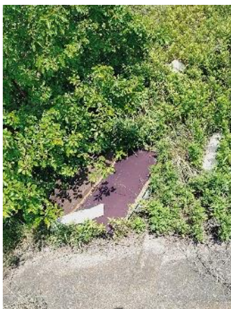
右岸1.2-1.4kmベッドの架台の様なものが不法投棄されていた。