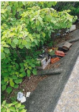
左岸0.8kmプラスチック製のコンテナBOXの不法投棄