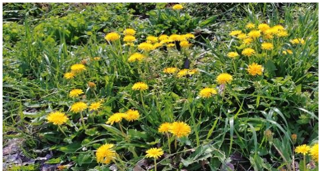
① 河川敷公園に広がるニホンタンポポ

生態系のくずれがないとほっとします。やはり西三河を代表するこの大河は「自然を守る母」であってほしいと思います。