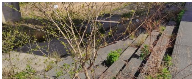
②コンクリートの階段にも自生する樹木 種類は不明