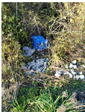
左岸6.0kmコンクリート瓦礫が、 不法投棄されていた。