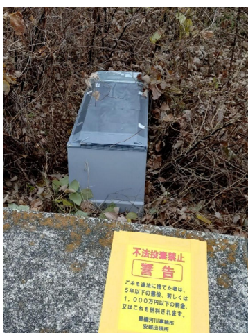
右岸1.5-1.6kmに大型冷蔵庫の不法投棄があった。