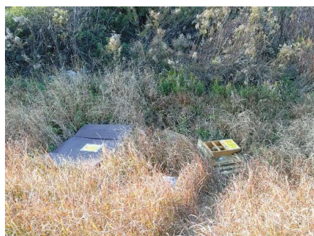
左岸3.6km付近に家具やベットのマットの不法投棄が見られた。 ベットマットの不法投棄が目立つ。