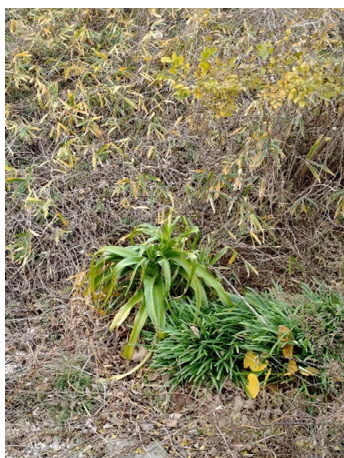
夏の間、暑さで弱っていた外来のインドハマユウであるが 冬になり周りの草が枯れてはっきり確認で切るようになった。