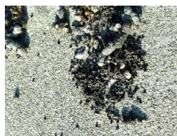
拡大してみると、アケビのタネがたくさん含まれていた