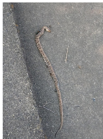
右岸側(上塚~中畑橋)でマムシを見つけた。 頭をたたかれ、既に死んでいた。 マムシがいるという事は自然の多様性が かなり高いと感じた。