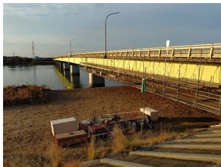
棚尾橋周辺のあちこちで工事が始まった。 維持管理のために仕方ない事ではあるが、特に左岸側は 堤防道路が通行止めになり、車が通れない状況である。