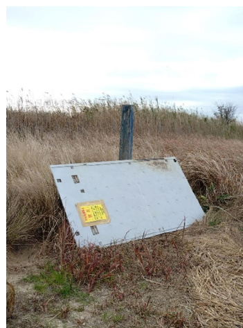
左岸0.2-0.4kmに板状の不法投棄物がそのまま残っている。