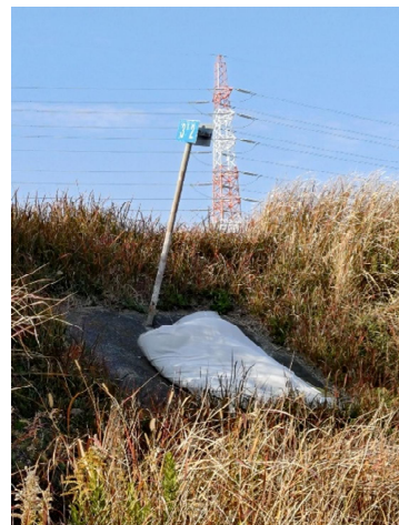
右岸3.2km付近に布団が捨てられていた