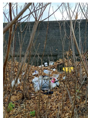
左岸0.8-1.0km付近に不要投棄あり、このほか周辺にタイヤなども多数見られる。