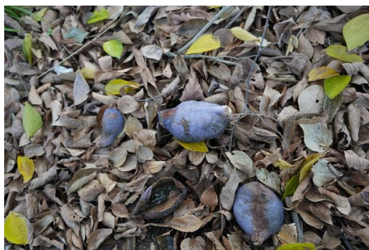
100m程離れたところにアケビの実が落ちていた。 アケビの蔓はよく見かけるが、矢作川で身を見るのは初めてである。