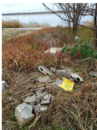
左岸1.6-1.8km付近にコンクリート や石材の不法投棄が見られた。