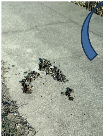
高水敷きのコンクリートで、タヌキのため糞を見つけた。 3-4回分ある様である。