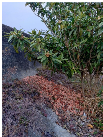
右岸側 1.2km・0.6kmの2か所に大量のニンジンが不法投棄されていた。これも産業廃棄物として適切に処理して欲しいものである。