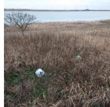
右岸 1.2~1.4km付近 数か所にわたって点在