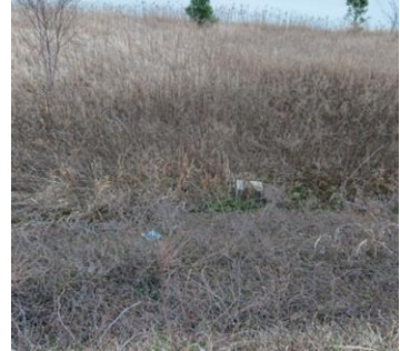
2.1km付近に多少ゴミあり