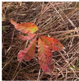
河口では珍しいミズナラ