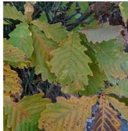
河口では珍しいフモトミズナラ