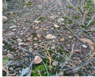
周囲とは違った地質