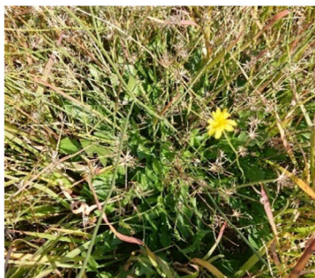
種が判明したエダウチニガナ