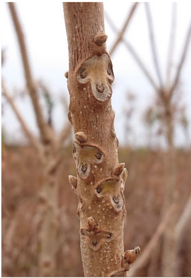
葉の落ちた痕(葉痕)が羊の顔に見えるオニグルミ