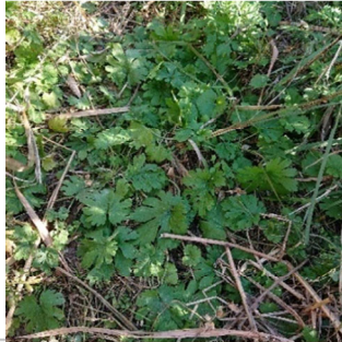
種不明のフウロウの仲間

河口部でのミズナラ・フモトミズナラは報告はおそらくないと思われる。 これまで名前のわからなかった黄色い花の名前を専門家に問い合わせるところ、まだ愛知県でも数例しか発見されていない外来種エダウチニガナであることが分かった。 また、新に外来と思われる不明種のフウロウを見つけた。