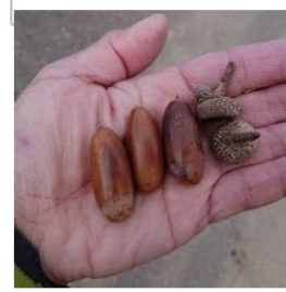
大きなフモトミズナラのドングリ