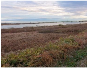
周辺と違った空間

中畑橋と棚尾橋の間に、前から、気になっていた他と違った空間は、かつて三河線の鉄橋跡地であることが分かった。ここだけ、植物があまり大きくなり、地質も大きな砂利が混じり周辺とはかなり違っていた。 過去の空撮の写真と照らし合わせると三河線の跡地であることが見えてきた。 線路は撤去されているが畑の中には、まだ面影が残っていた。