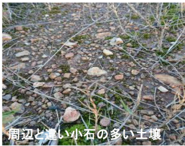
周辺と違い小石の多い土壌

少し前から、気になっていたが、草刈りをしていないのに背丈の低い植物しか生えていない場所がある。周辺はセイタカアワダチソウが繁茂しているが、なぜかここだけシナダレスズメガヤシしか生えていない。近づいてみると他と土壌と違ってすることに気づいた。名鉄三河線の橋梁のなごりなのか？また土手を歩く楽しみができた。