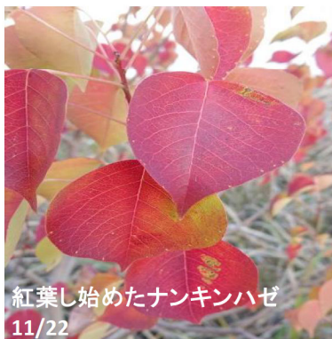
紅葉し始めたナンキンハゼ 11/22