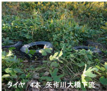
タイヤ 4本 矢作川大橋下流