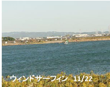
ウインドサーフィン 11/22

左岸側(西尾市)の高水敷には立派なスポーツエリアが整備されていて非常に素晴らしいと感じた。二枚目の写真は右岸側から撮った写真である。左岸側の河川敷には親水しやすい場所があり、駐車スペースもあるためたくさんの方がウインドサーフィンを楽しんでいた。右岸側にも是非欲しいと感じた。