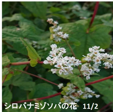
シロバナミゾソバの花 11/2