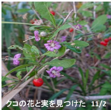
クコの花と実を見つけた 11/2