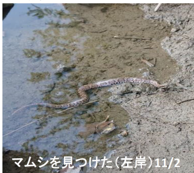
マムシを見つけた(左岸)11/2