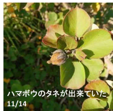
ハマボウのタネが出来ていた 11/14