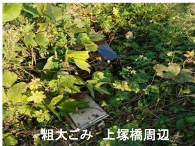
粗大ごみ 上塚橋周辺