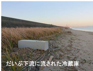
だいが下流に流された冷蔵庫