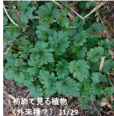
初めて見る植物 (外来種?) 11/29