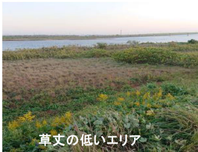
草丈の低いエリア