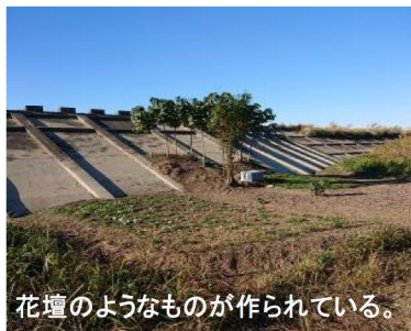
花壇のようなものが作られている。

草木の冬枯れが始まり隠れていた不法投棄物が目立つようになってきている。10月にも見られた冷蔵庫は、大潮の満潮時には浮き上がるよう下流側に移動していた。また、大型TVは撤去していただいたのか、11月は見当たらなかった。