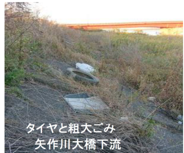
タイヤと粗大ごみ 矢作川大橋下流