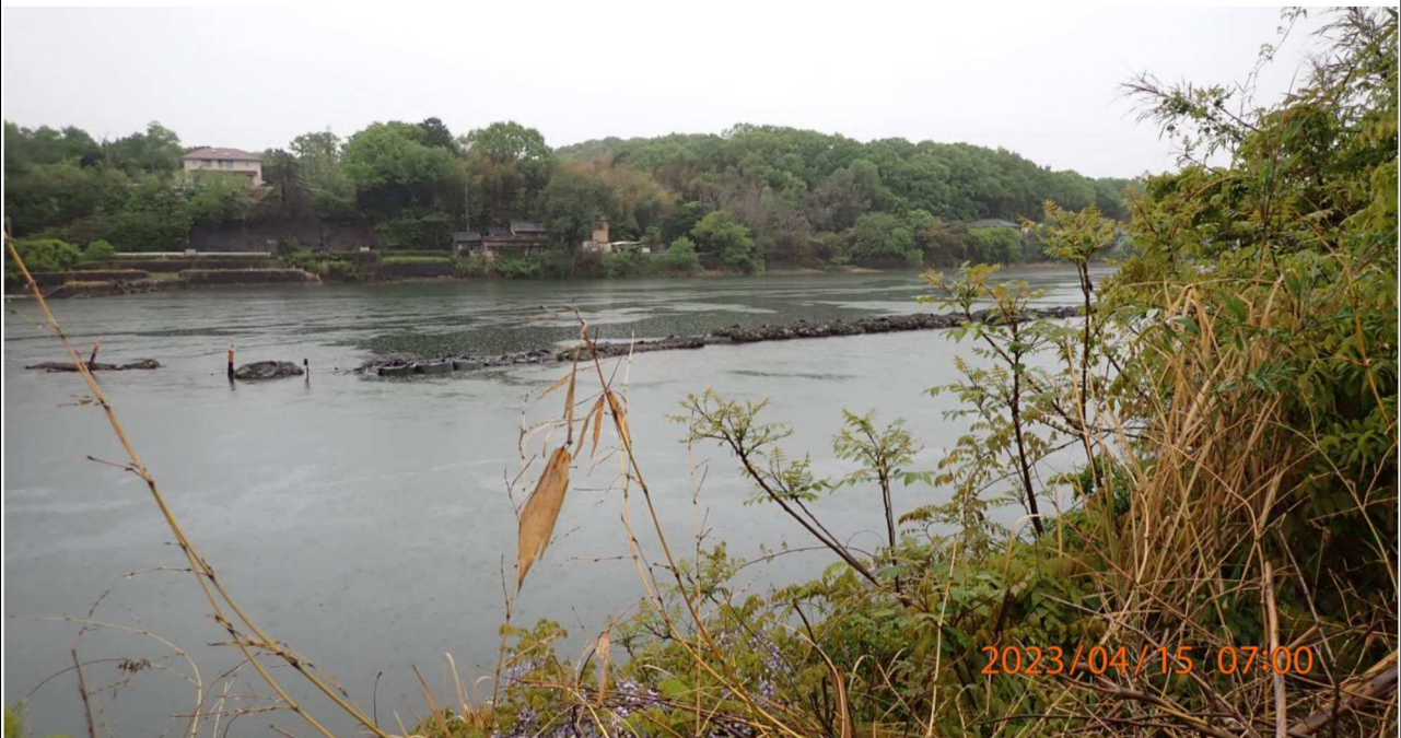
右岸35.0km付近より下流を撮影。