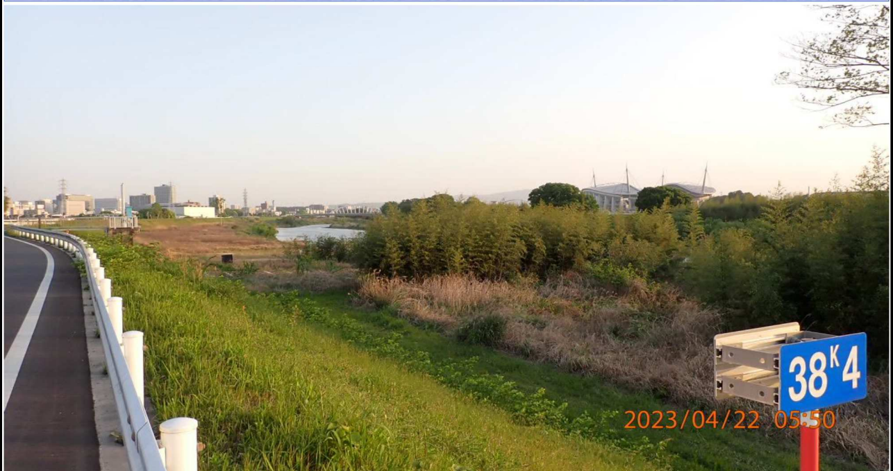
右岸38.4km付近より上流を撮影。