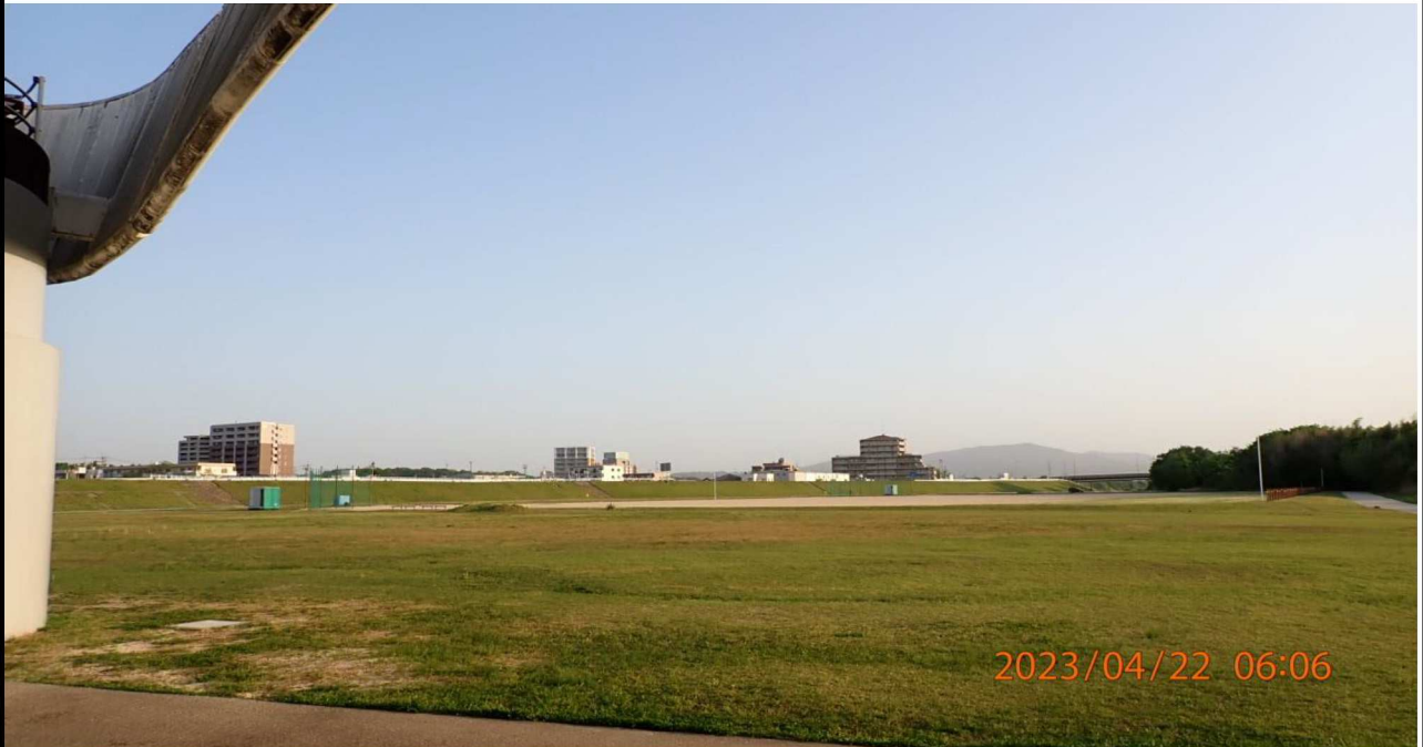
豊田大橋付近の様子（7）豊田大橋下より白浜公園（上流側）を撮影。