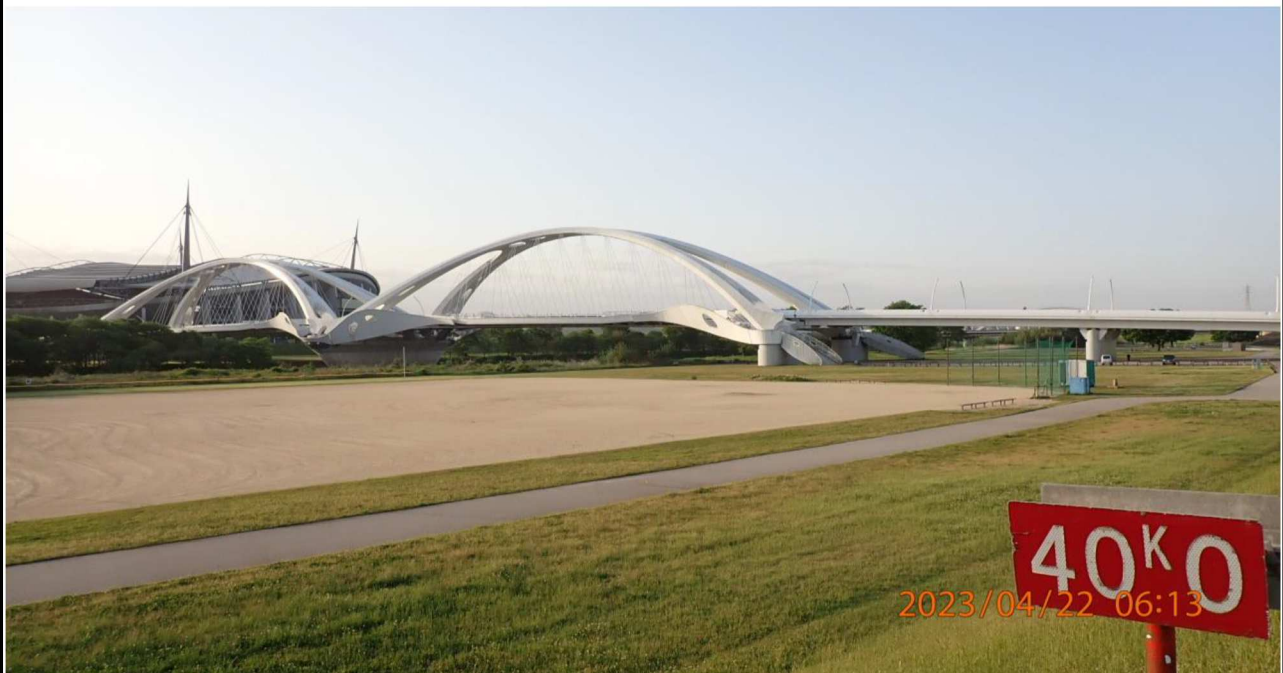
右岸40km付近より下流を撮影。河川敷はどこも緑でいっぱいでした。