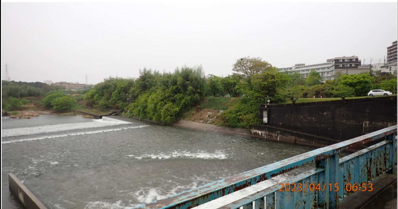
水源橋付近の様子（8）水源橋中央より下流（右岸側）を撮影。