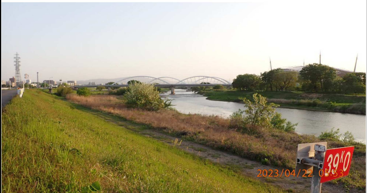
右岸39.0km付近より上流を撮影。遠方には久澄橋、豊田大橋が見える。