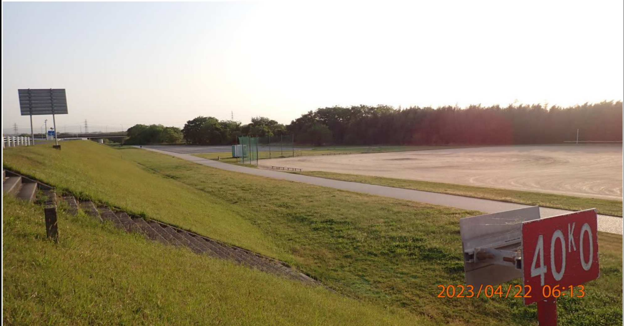
右岸40km付近より上流を撮影。