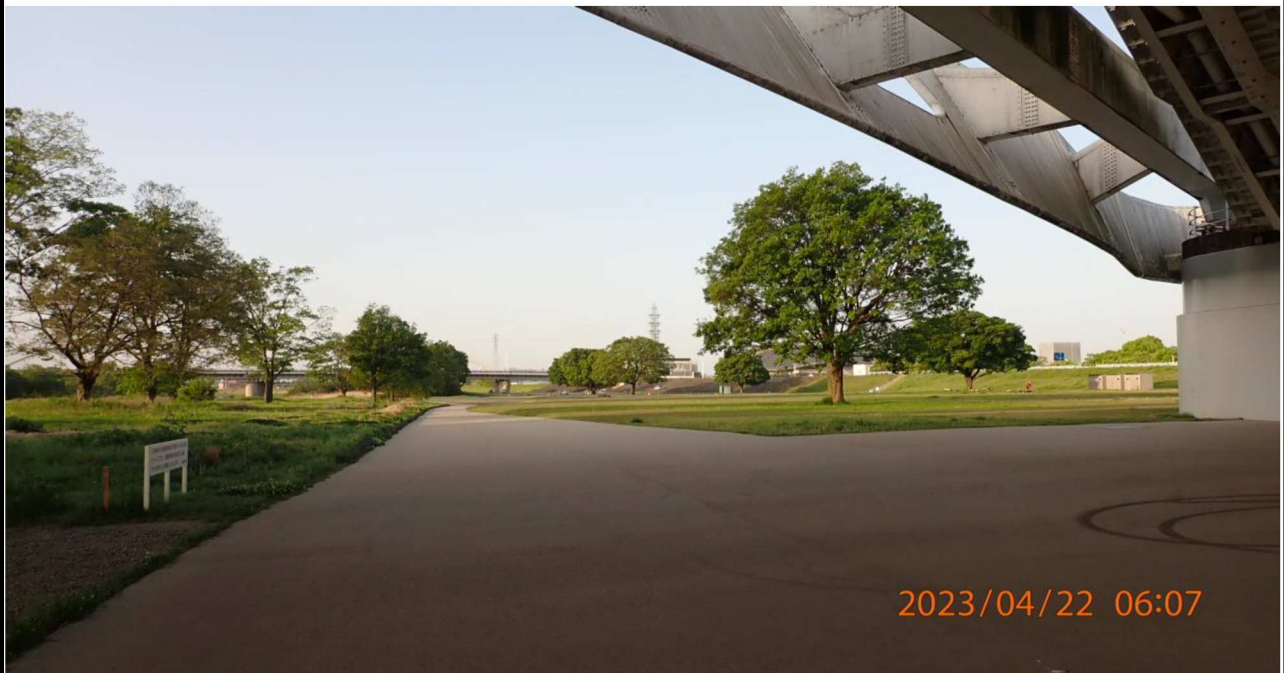
豊田大橋付近の様子（8）豊田大橋下より白浜公園（下流側）を撮影。