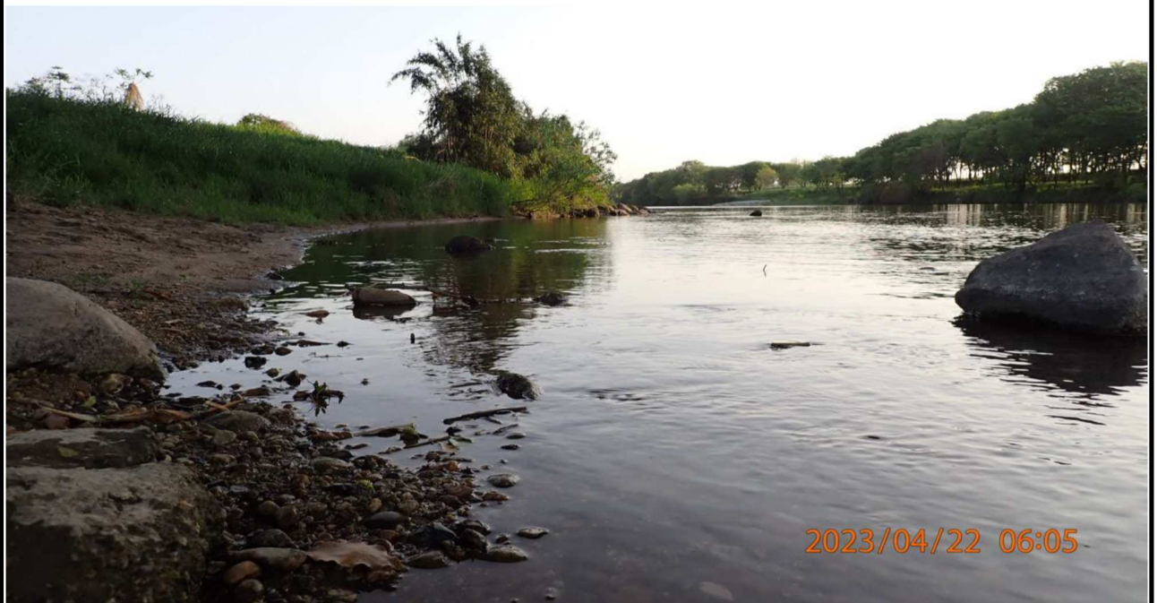
豊田大橋付近の様子（6）豊田大橋下より上流を撮影。