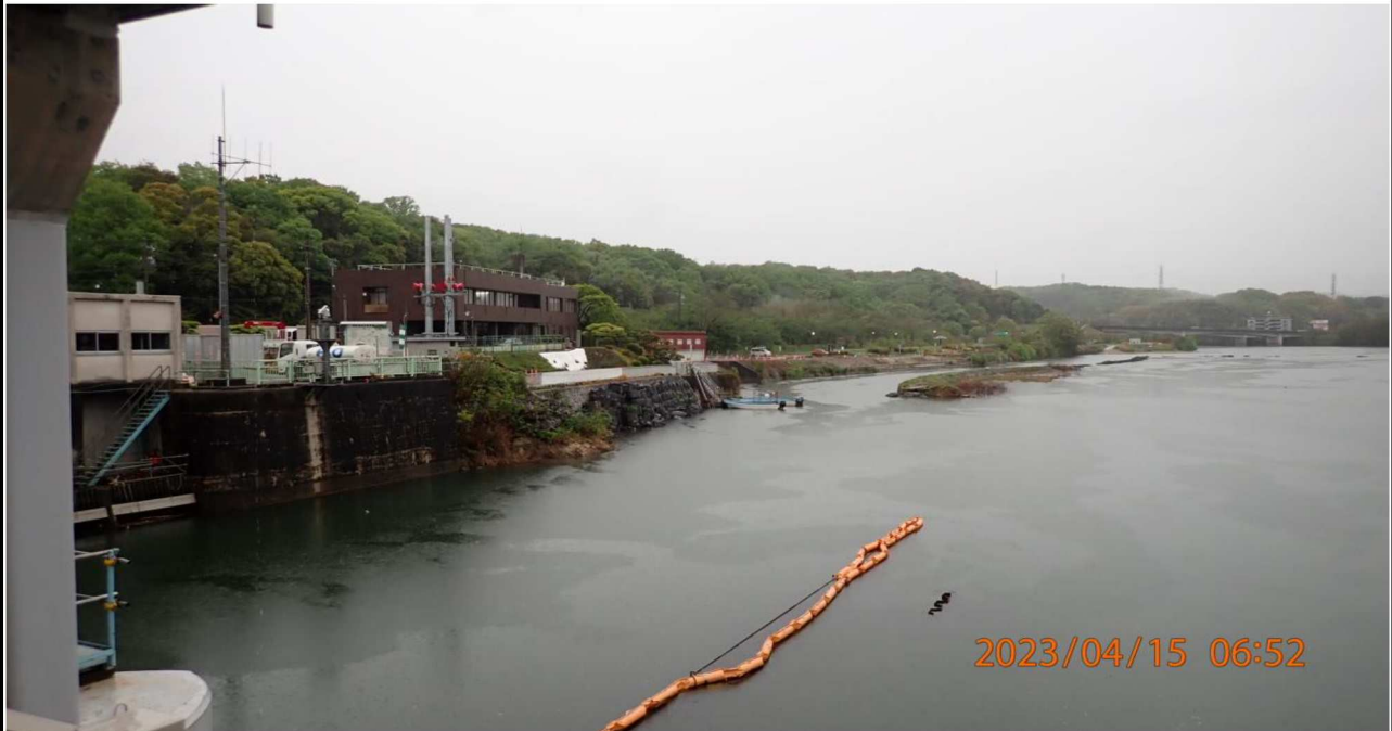
水源橋付近の様子（5）水源橋中央より上流（右岸側）を撮影。