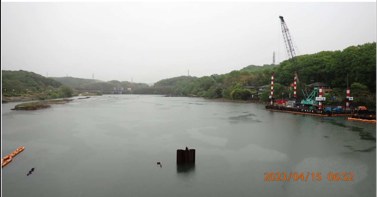
水源橋付近の様子（4）水源橋中央より上流を撮影。