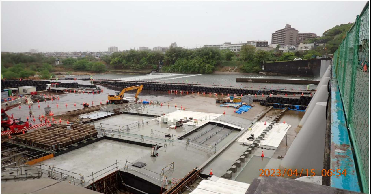
水源橋付近の様子（9）水源橋左岸より右岸（下流側）を撮影。