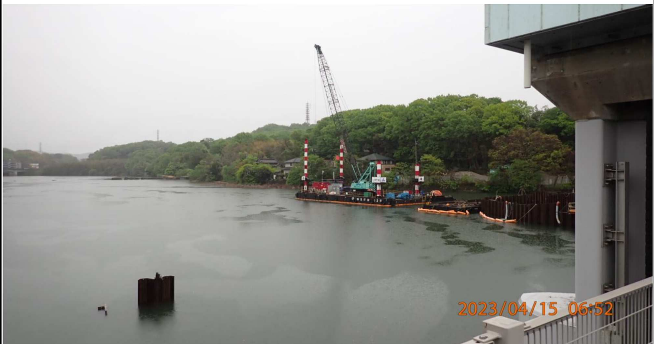
水源橋付近の様子（6）水源橋中央より上流（左岸側）を撮影。