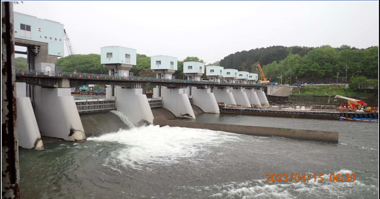
水源橋付近の様子（1）右岸より雨天の水源橋を撮影。