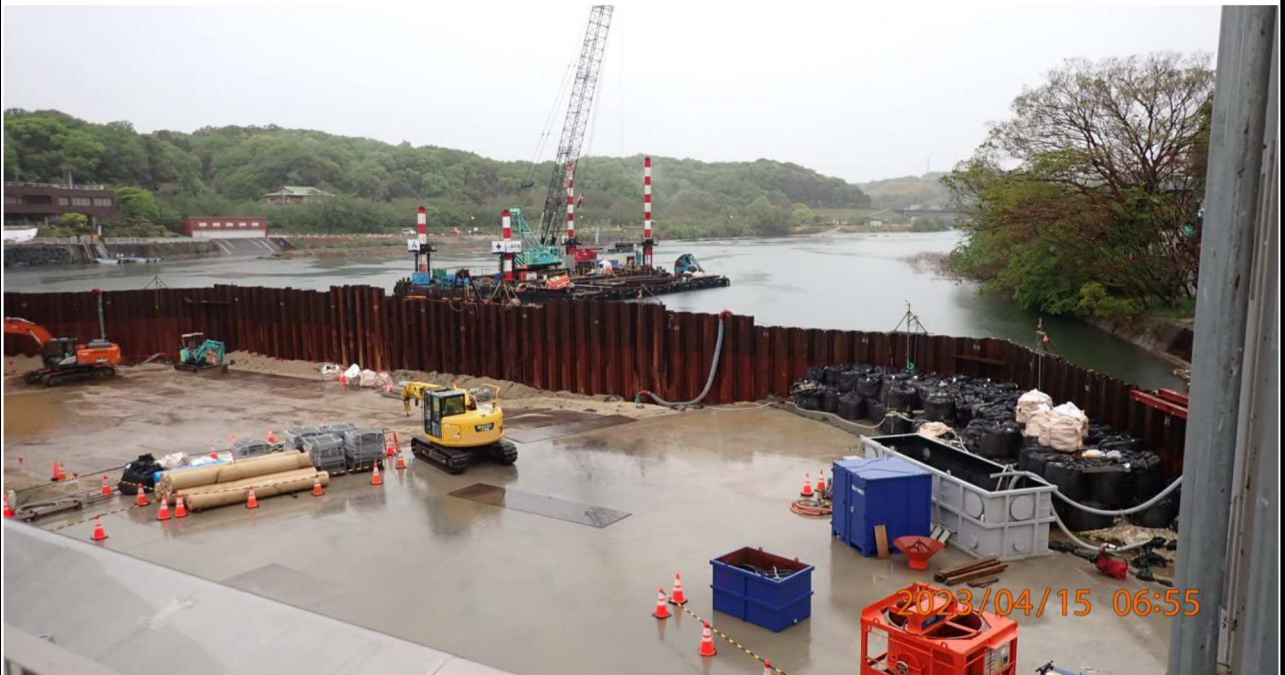
水源橋付近の様子（10）水源橋左岸より右岸（上流側）を撮影。 左岸は上流、下流共に大掛かりな工事が行われていた。