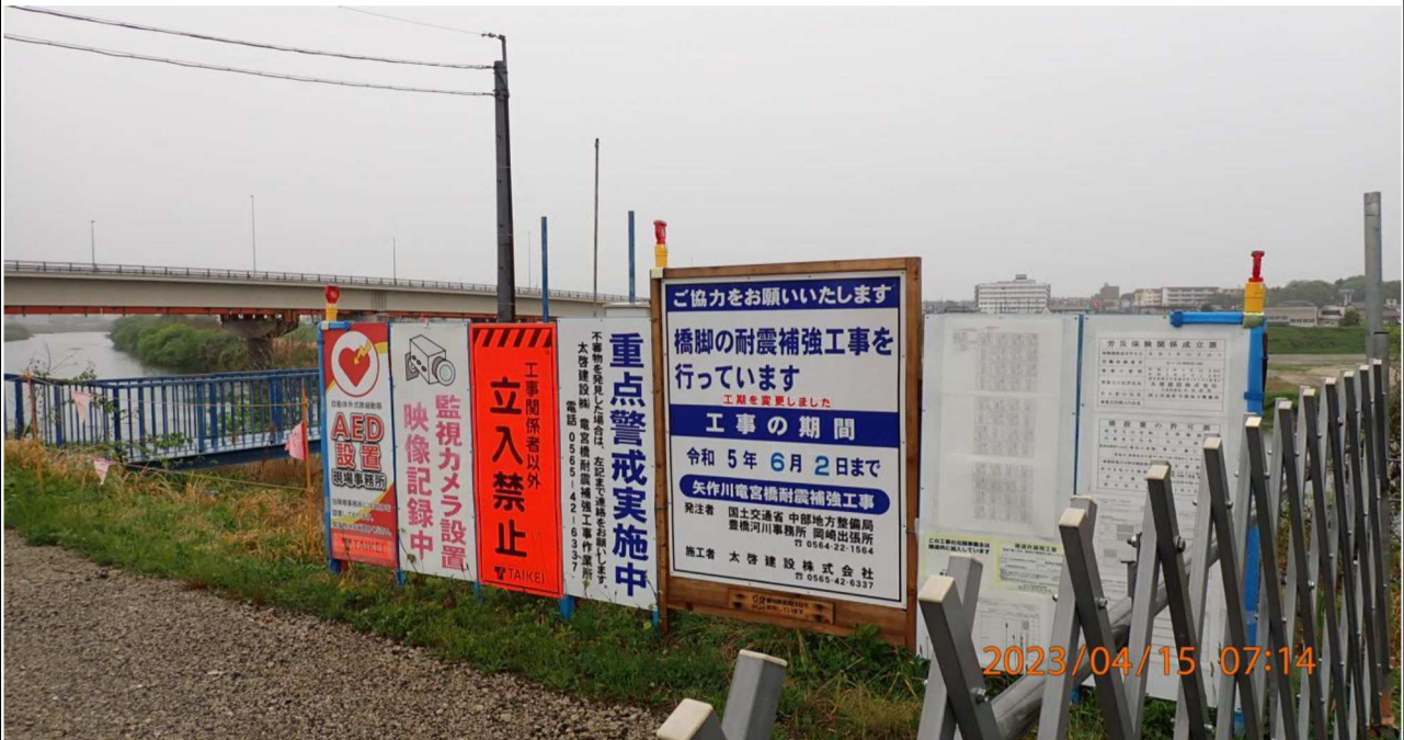
右岸37.6km付近の様子（1）竜宮橋付近は工事中。