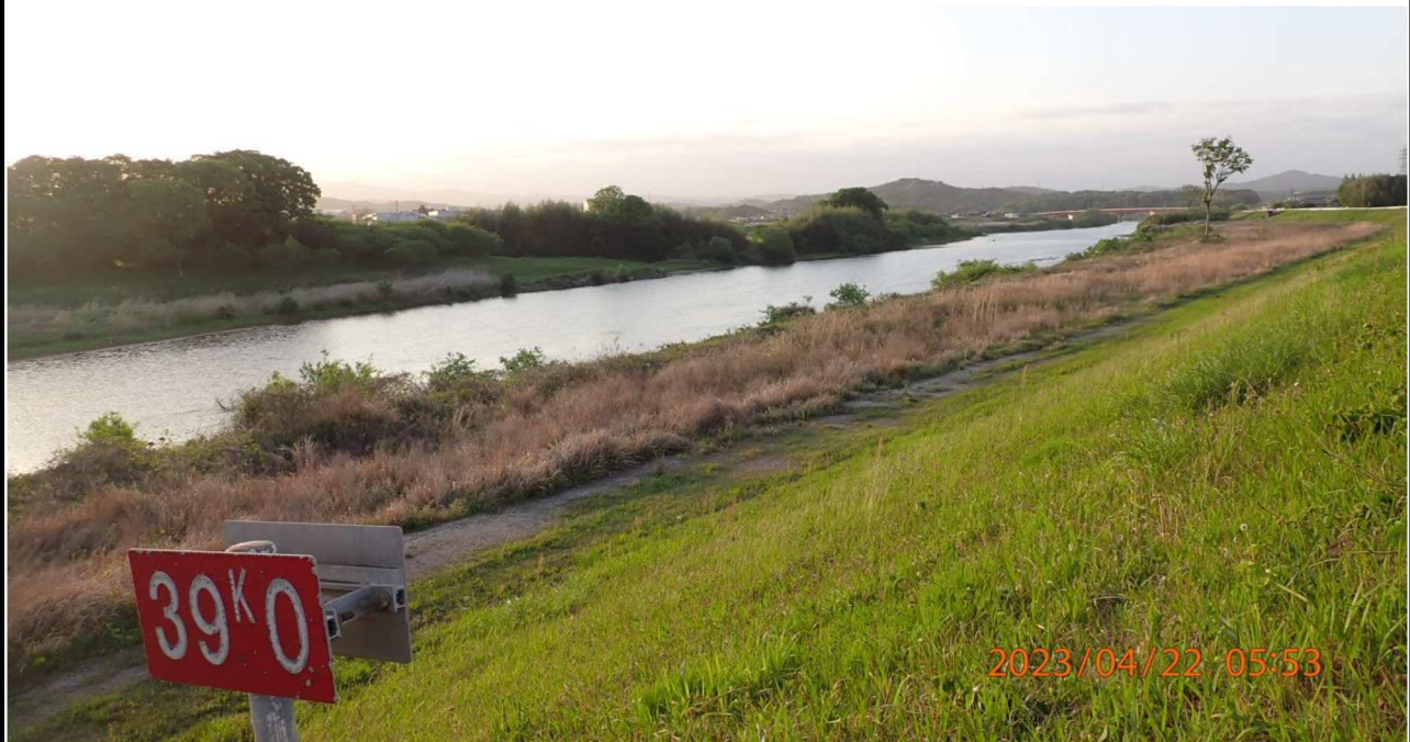
右岸39.0km付近より下流を撮影。