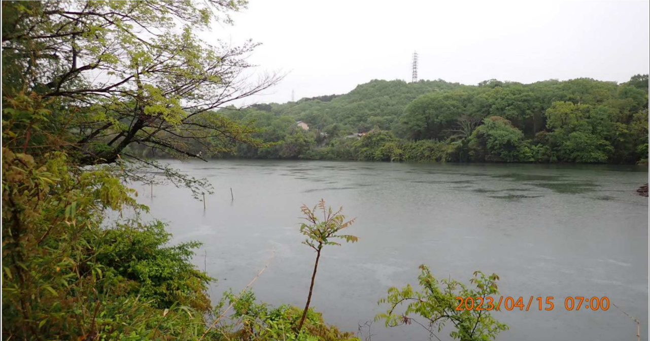
右岸35.0km付近より上流を撮影。