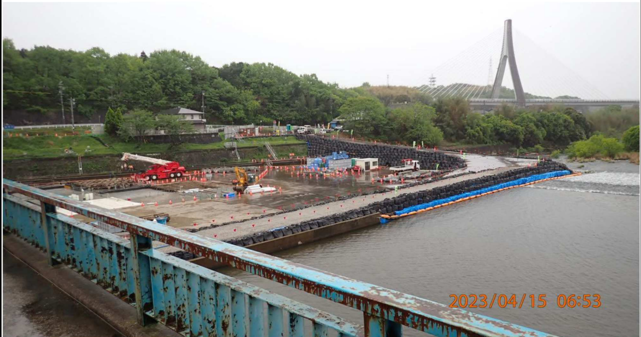
水源橋付近の様子（7）水源橋中央より下流（左岸側）を撮影。 大掛かりな工事の様子が見える。