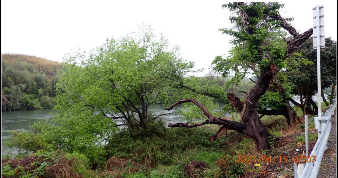
右岸36.0km付近の様子（4）木々の緑が映えている。