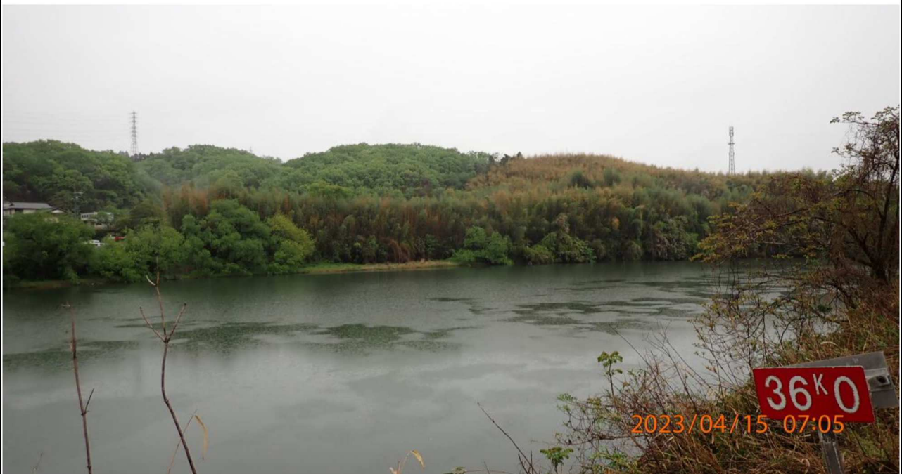
右岸36.0km付近の様子（2）右岸より下流を撮影。