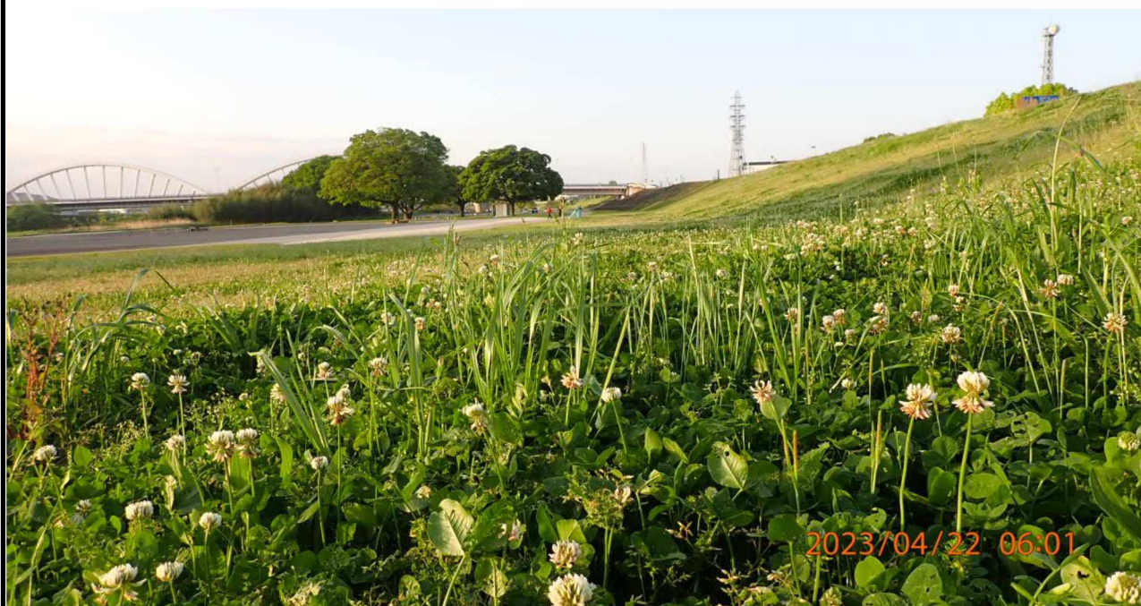
豊田大橋付近の様子（3）豊田大橋右岸より下流を撮影。