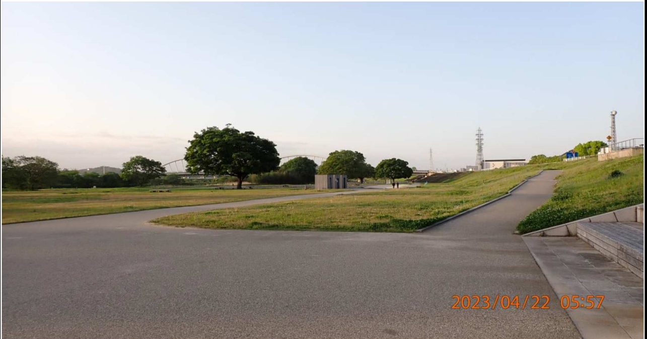
豊田大橋付近の様子（1）豊田大橋右岸より白浜公園（下流側）を撮影。