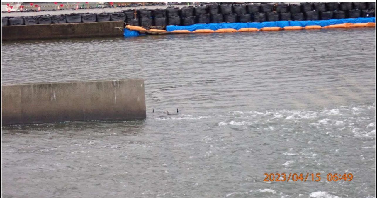
水源橋付近の様子（2）水鳥たちが餌を求めて潜っていた。