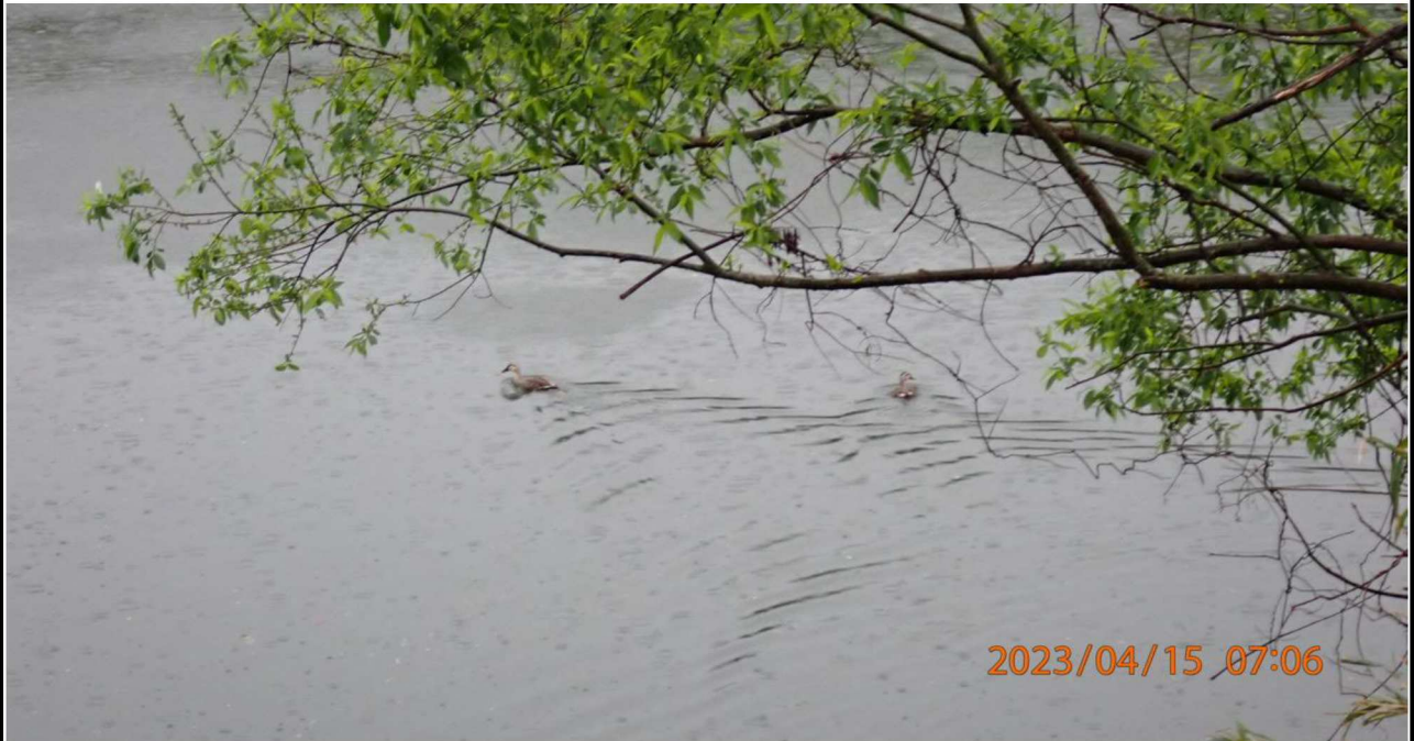
右岸36.0km付近の様子（3）水鳥たちの様子。