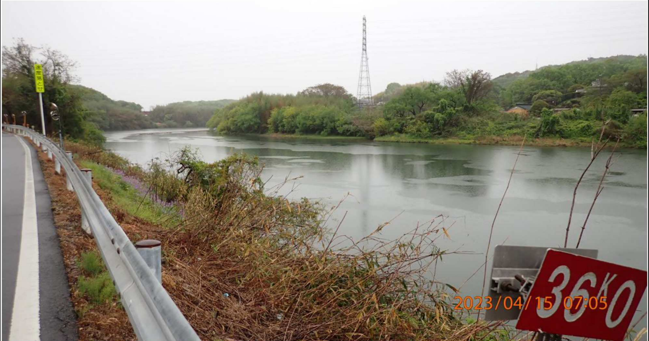
右岸36.0km付近の様子（1）右岸より上流を撮影。