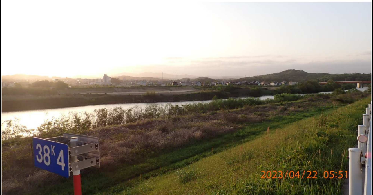
右岸38.4km付近より下流を撮影。