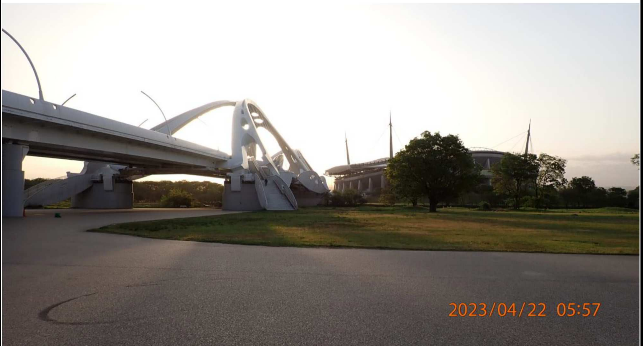
豊田大橋付近の様子（2）豊田大橋右岸より対岸を撮影。