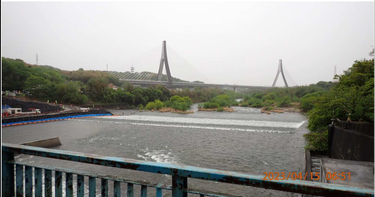
水源橋付近の様子（3）水源橋右岸より下流を撮影。