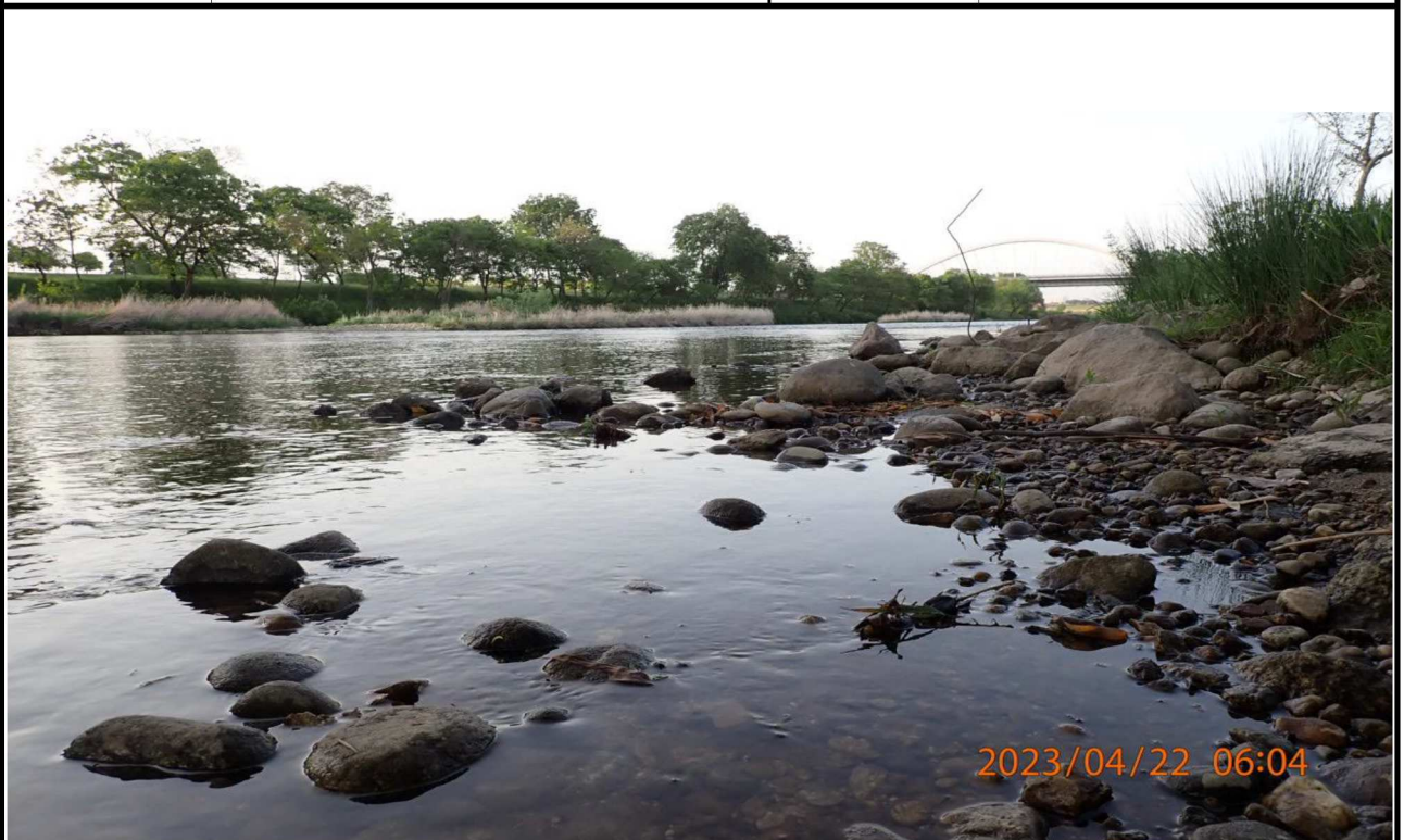
豊田大橋付近の様子（5）豊田大橋下より下流を撮影。