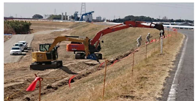
④堤防内側斜面の整備を続ける重機(18.8Km)