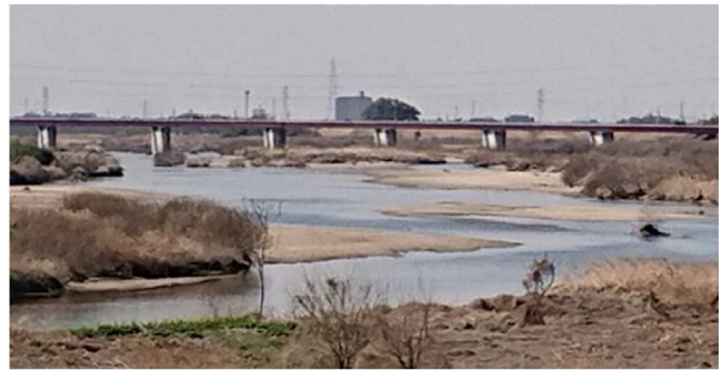
①穏やかな流れの美矢井橋付近の矢作川

一方、堤防内側の斜面では工事が続いています。重機を使って、斜面を削っています。年度末までに仕上げる必要があるのでしょうか。いずれにしても、利便性の高い工事になってほしいです。新しい年度には、どんな計画があるのでしょうか。