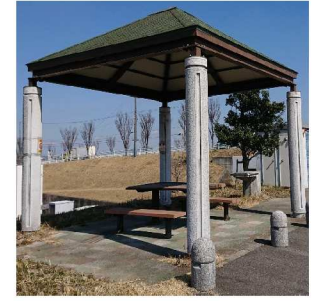
③道路に書かれた歩行距離の表示と休憩所