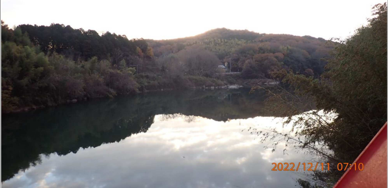
鵜の首橋付近の様子（2） 右岸37.2km付近の鵜の首橋より下流を撮影。