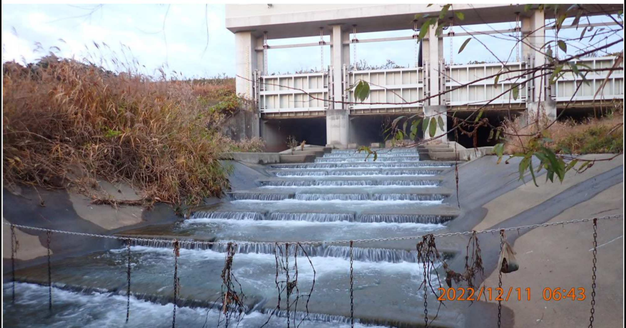
明神樋門付近の様子（4） 右岸34.4km付近 樋門からの流入地点より樋門を撮影。