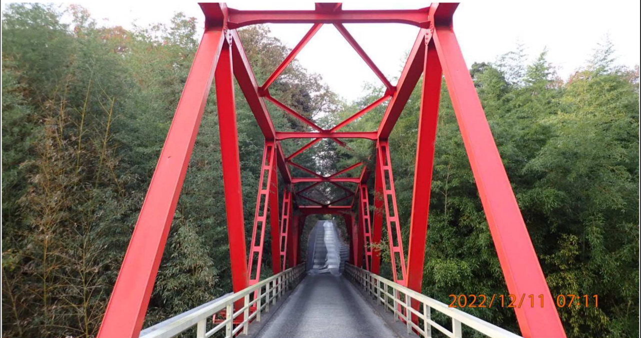
鵜の首橋付近の様子（4） 左岸37.2km付近の鵜の首橋より右岸を撮影。