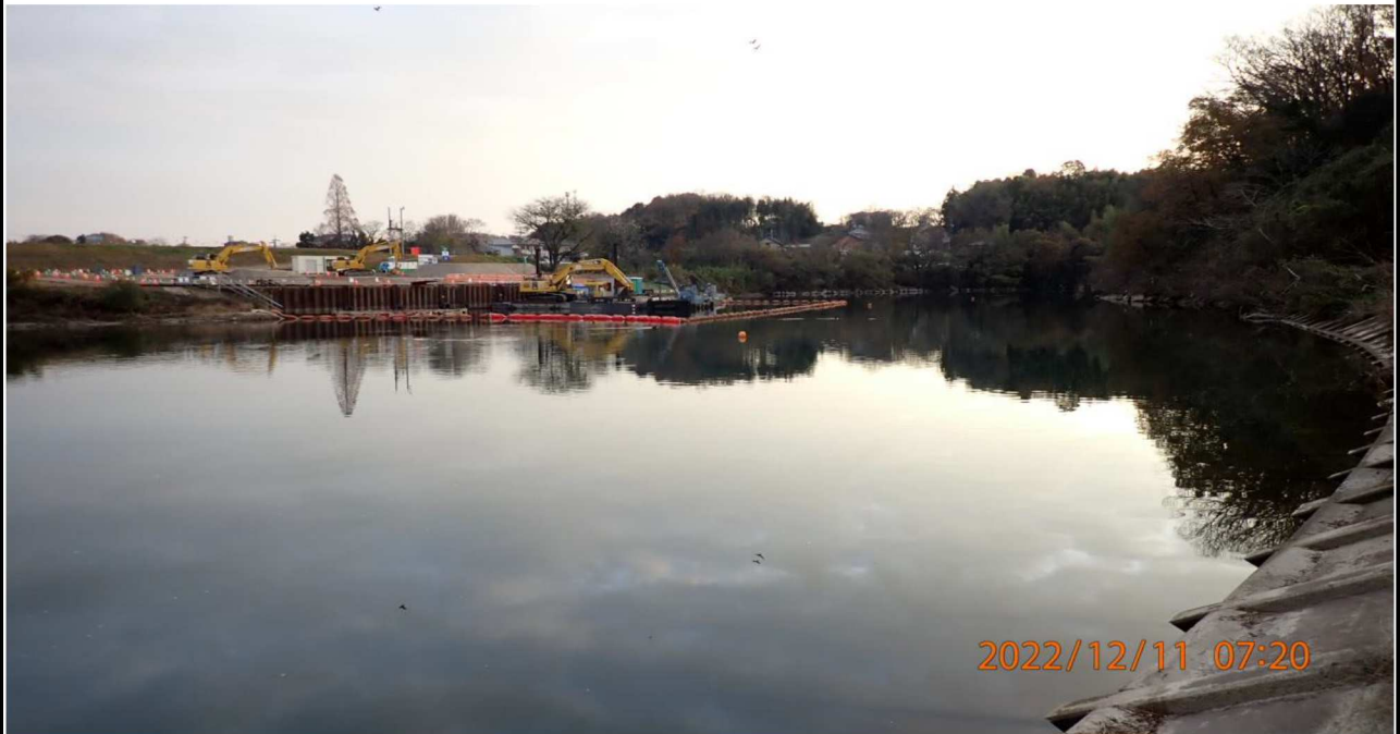
右岸37.6km付近より下流を撮影。 対岸に工事の様子が見える。