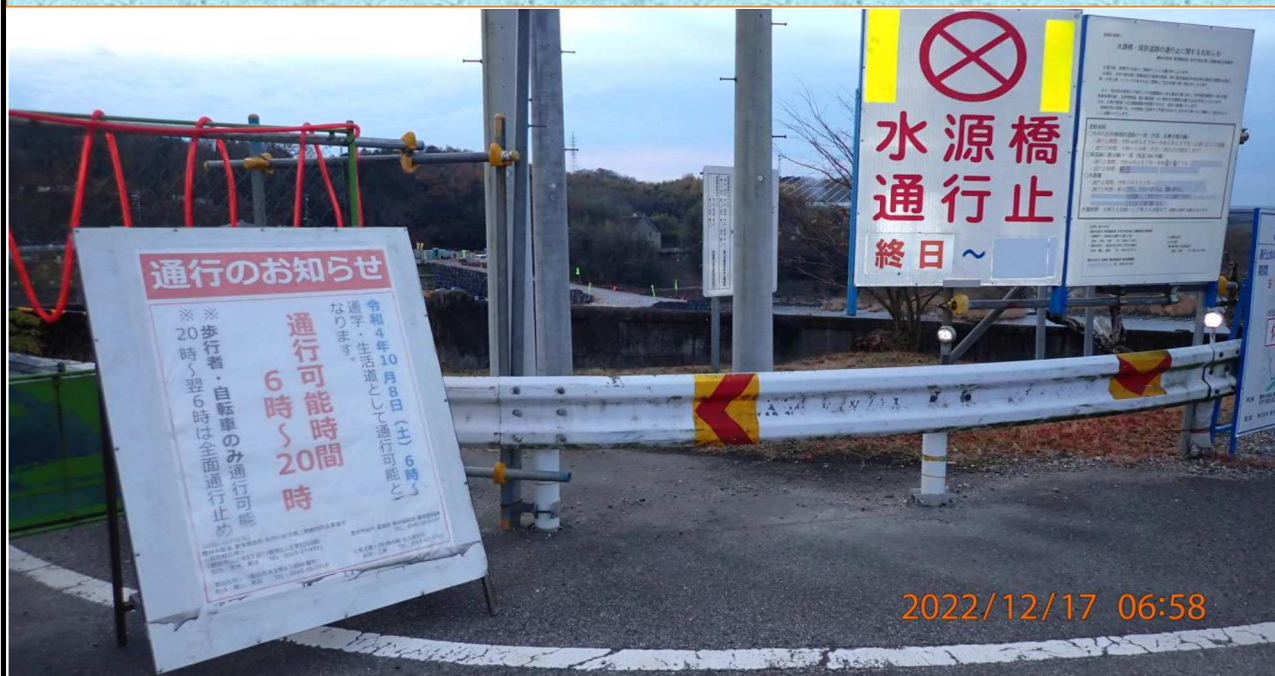
水源橋付近の様子（1） 右岸34.6km付近の水源橋看板を撮影。