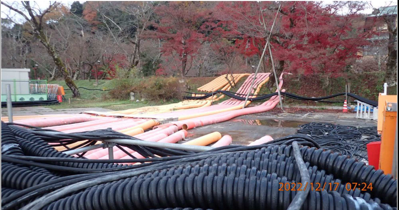
水源緑地付近の様子（1）右岸35.0km付近の水源緑地を撮影。 揚水ホースの一部は役目を終えていた。