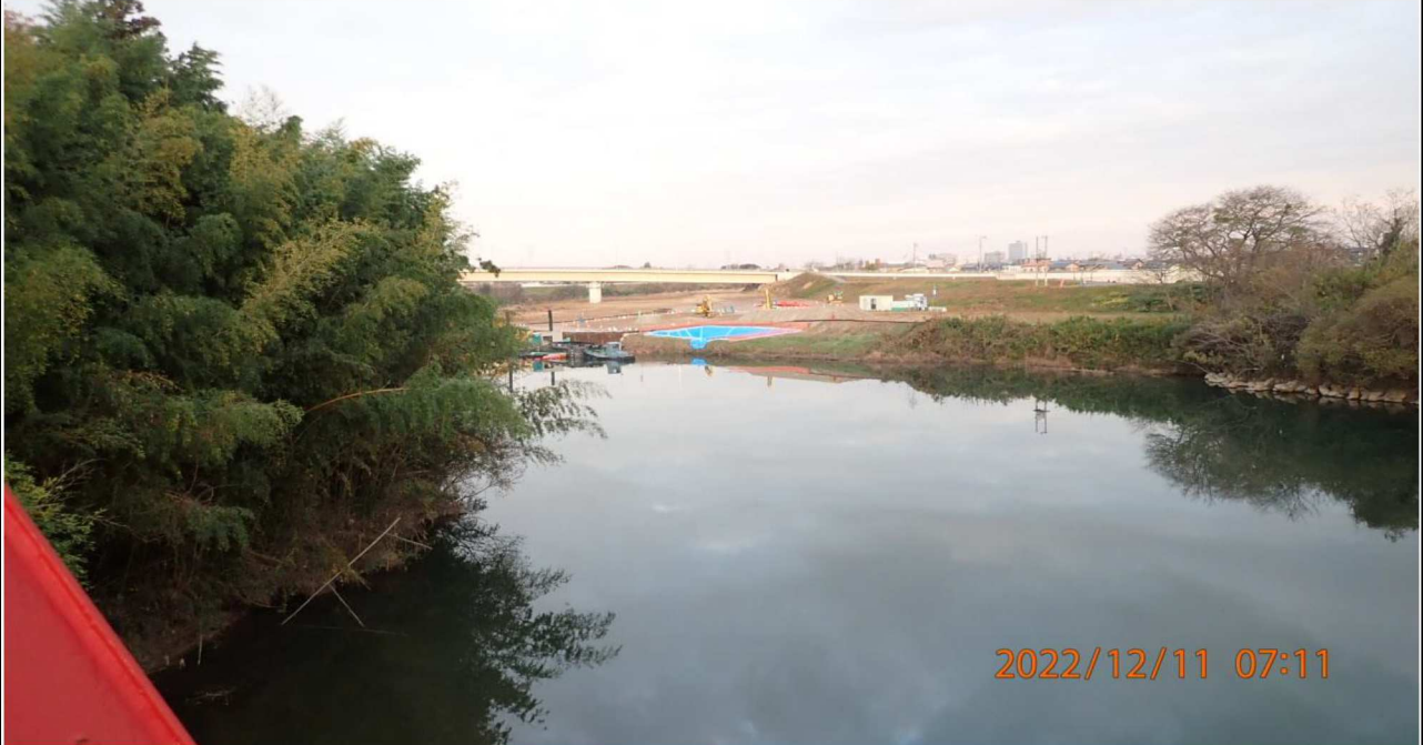
鵜の首橋付近の様子（3） 右岸37.2km付近の鵜の首橋より上流を撮影。