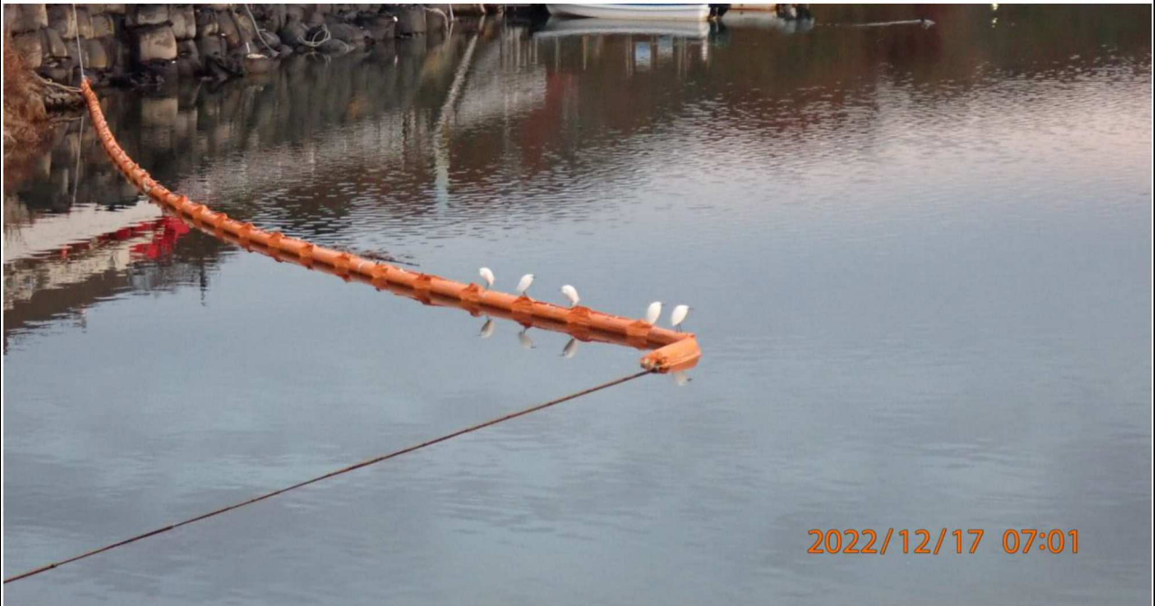
水源橋付近の様子（6） 水源橋中央付近より上流を撮影。水鳥たちが休んでいた。