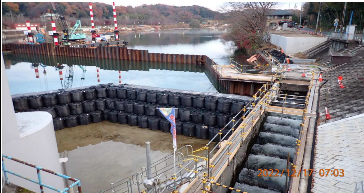
水源橋付近の様子（1 1） 水源橋左岸より上流を撮影。大きく堰き止められている。