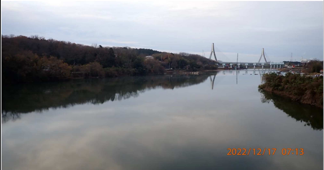
右岸35.2km付近の山室橋より下流を撮影。