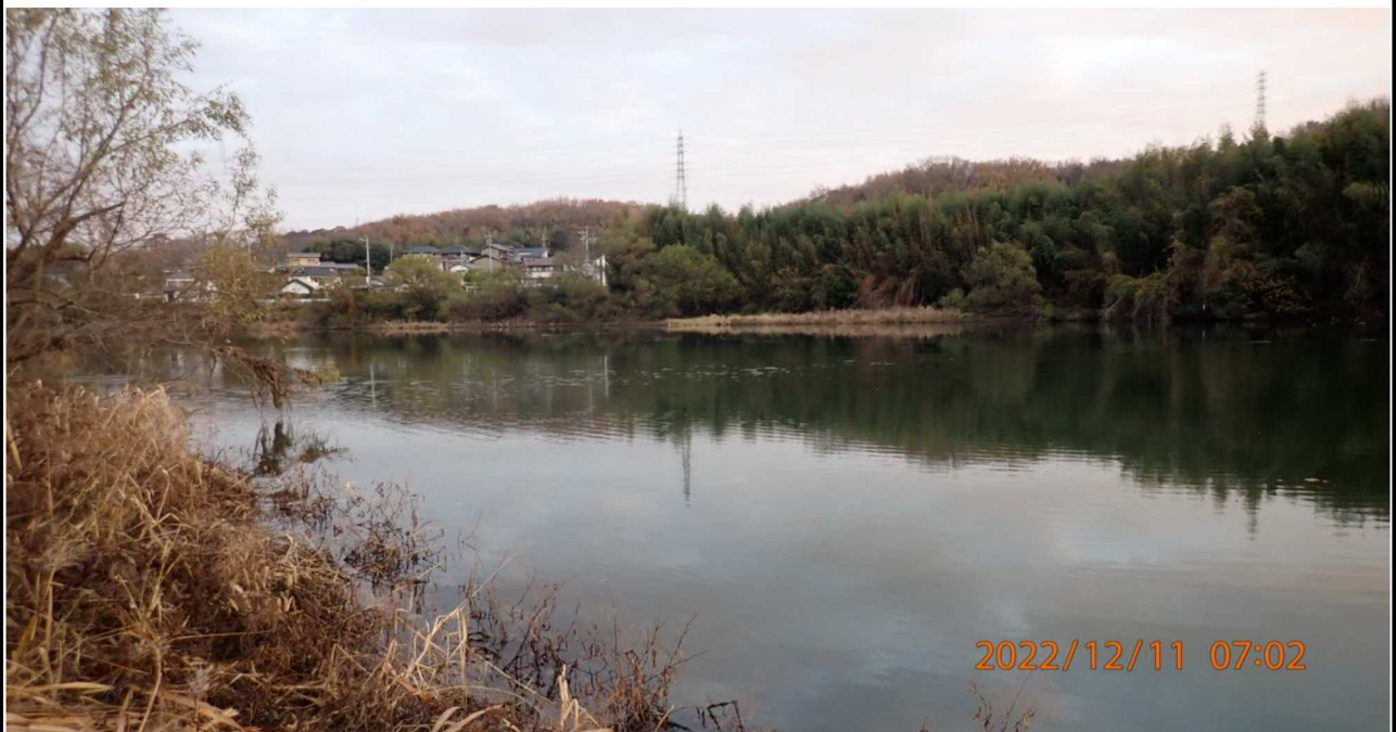
右岸35.8km付近より上流を撮影。