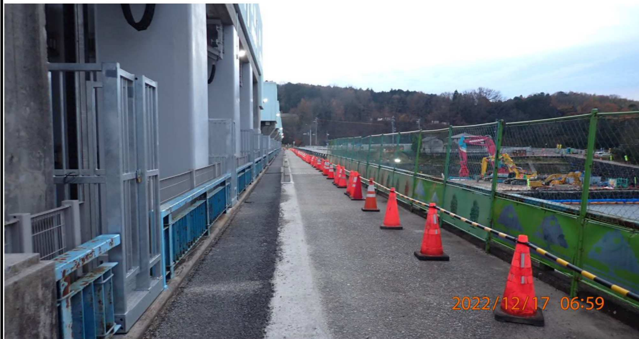
水源橋付近の様子（3） 水源橋右岸より左岸を撮影。