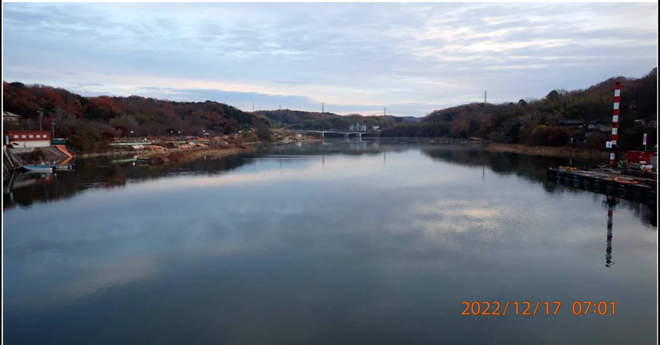
水源橋付近の様子（9） 水源橋中央付近より上流を撮影。