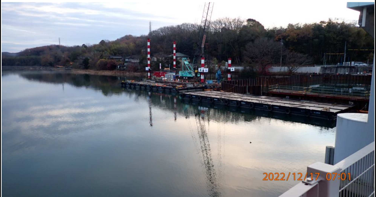
水源橋付近の様子（10） 水源橋中央付近より左岸を撮影。工事の様子が見える。