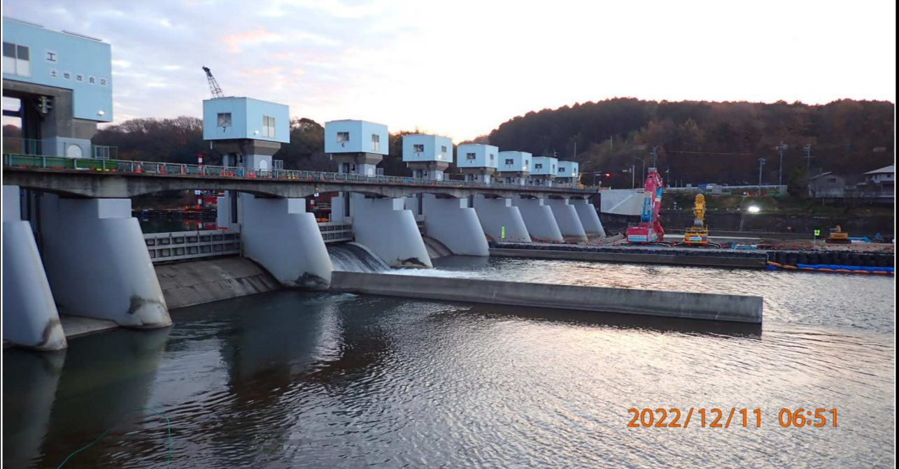
水源橋付近の様子（1） 右岸34.6km付近 水源橋を撮影。