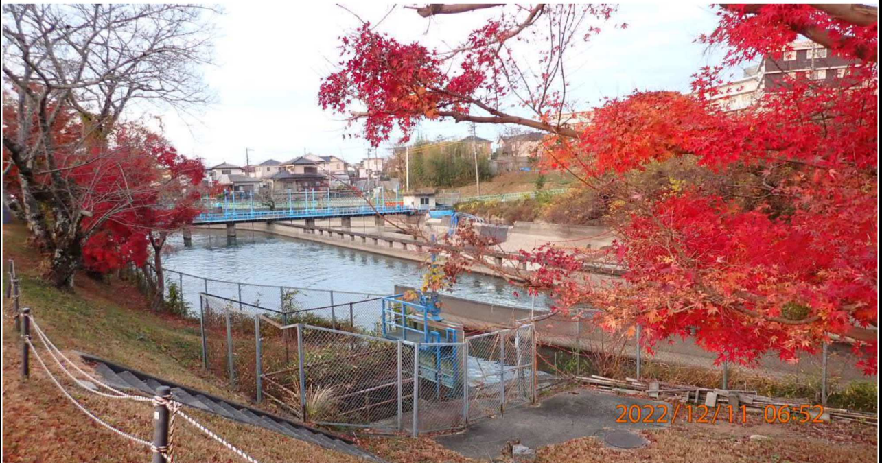
水源橋付近の様子（2） 右岸34.6km付近 明治用水を撮影。