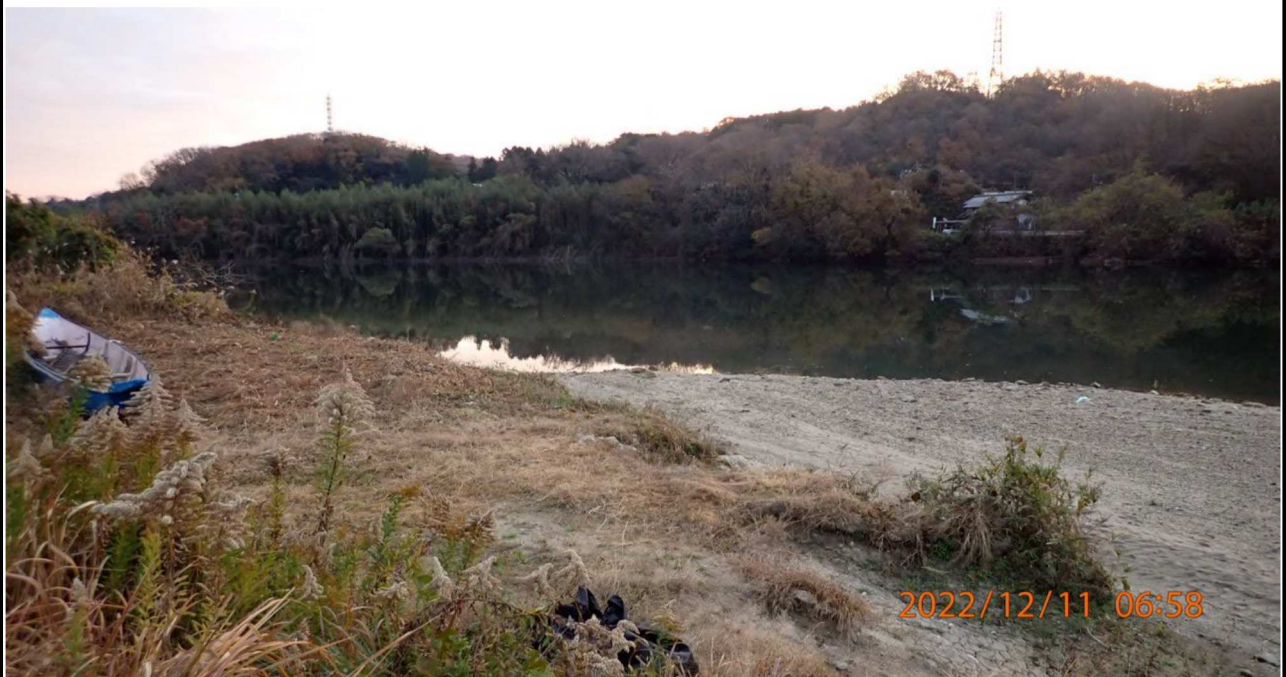
水源橋付近の様子（6） 右岸35.2km付近より上流を撮影。