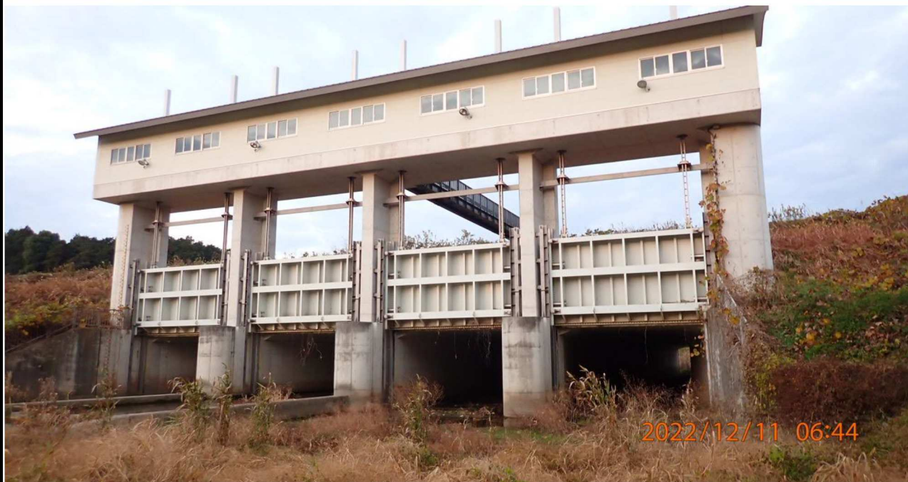
明神樋門付近の様子（5） 右岸34.4km付近 樋門全景。