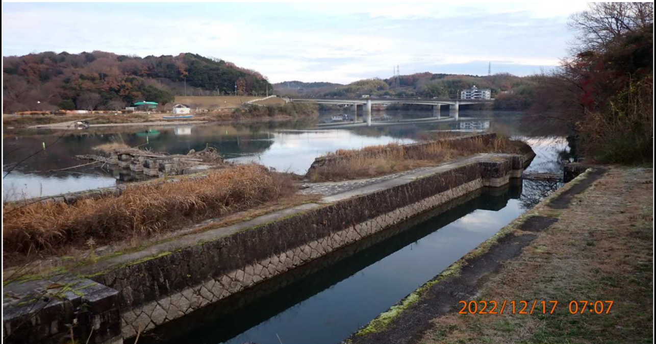
右岸35.0km付近より上流を撮影。