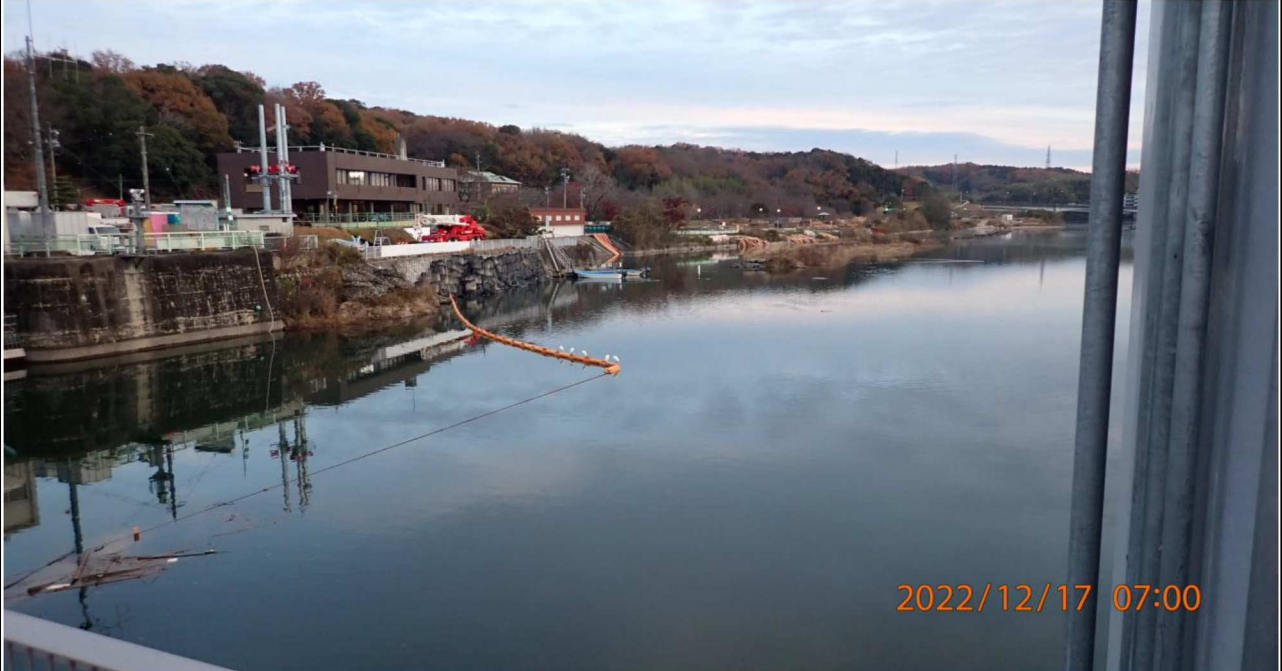
水源橋付近の様子（5） 水源橋中央付近より上流を撮影。