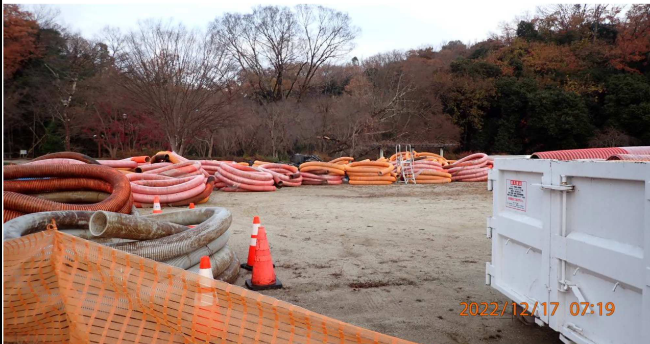
水源緑地付近の様子（3）右岸35.0km付近の水源緑地を撮影。 緑地内の資材置き場には役目を終えた多くのホースがあった。