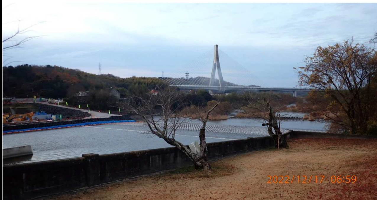
水源橋付近の様子（2） 右岸34.6km付近の水源橋より下流を撮影。