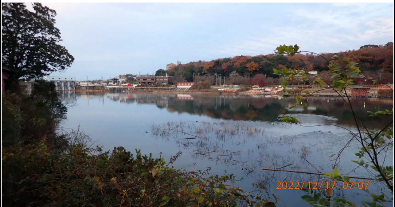
右岸35.0km付近より下流を撮影。