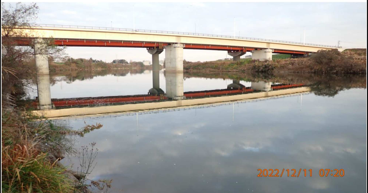
右岸37.6km付近より上流を撮影。 水面は穏やかで竜宮橋が映っている。