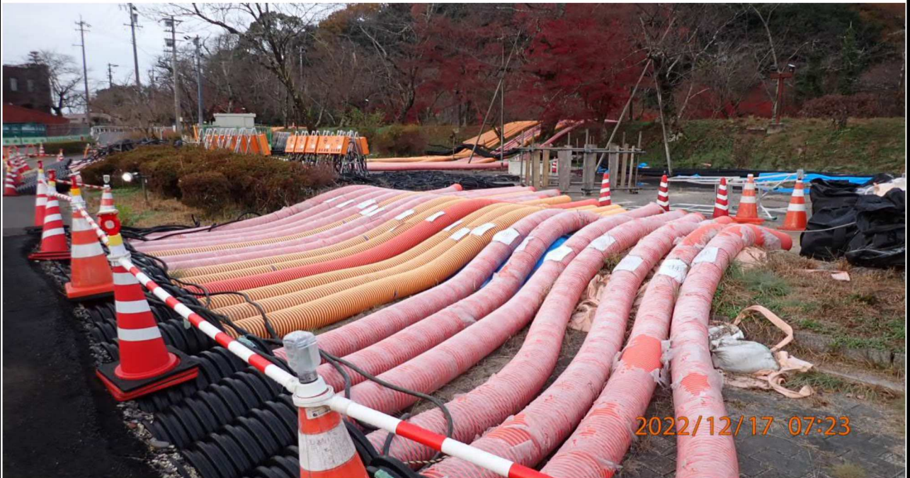
水源緑地付近の様子（2）右岸35.0km付近の水源緑地を撮影。 これらのホースは明治用水手前で止まっている。