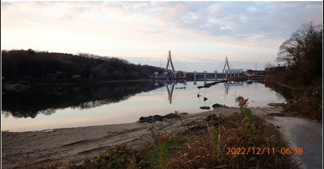
水源橋付近の様子（5） 右岸35.2km付近より下流を撮影。