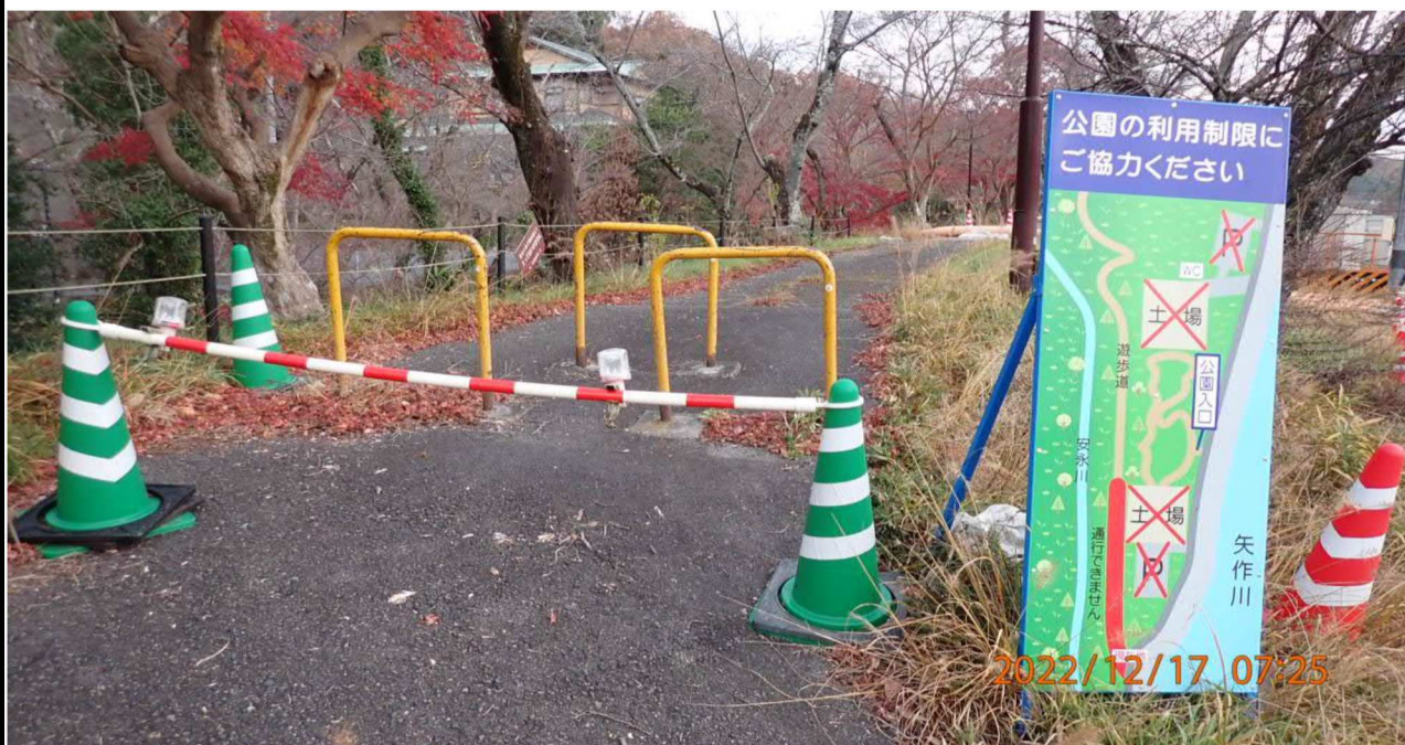
水源緑地付近の様子（3）右岸35.0km付近の水源緑地を撮影。 公園が解放されるにはまだ時間がかかるようだ。