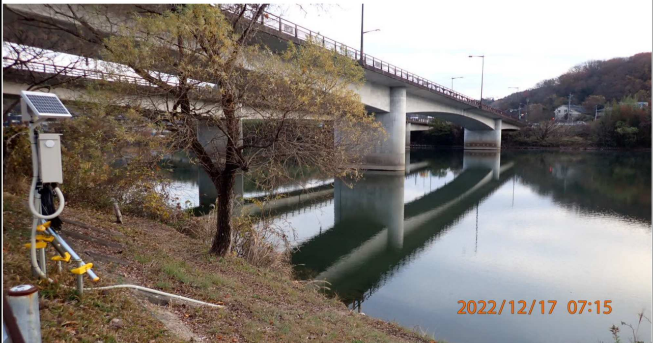
右岸35.2km付近より山室橋を撮影。