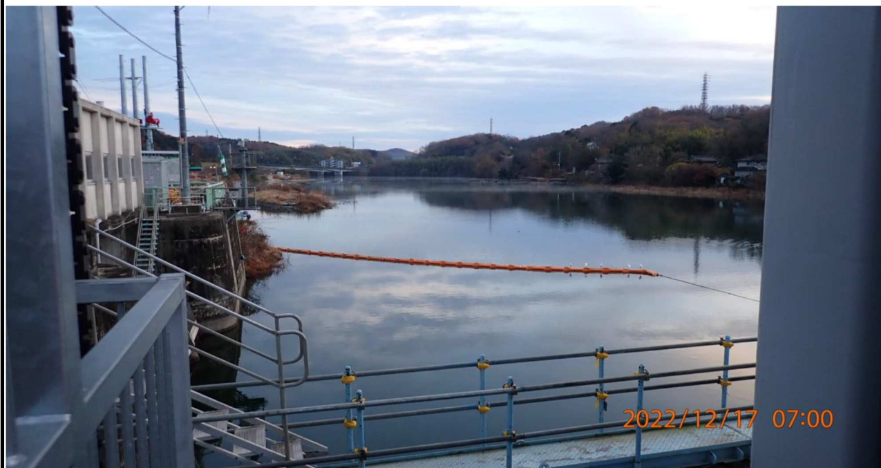
水源橋付近の様子（4） 水源橋右岸より上流を撮影。