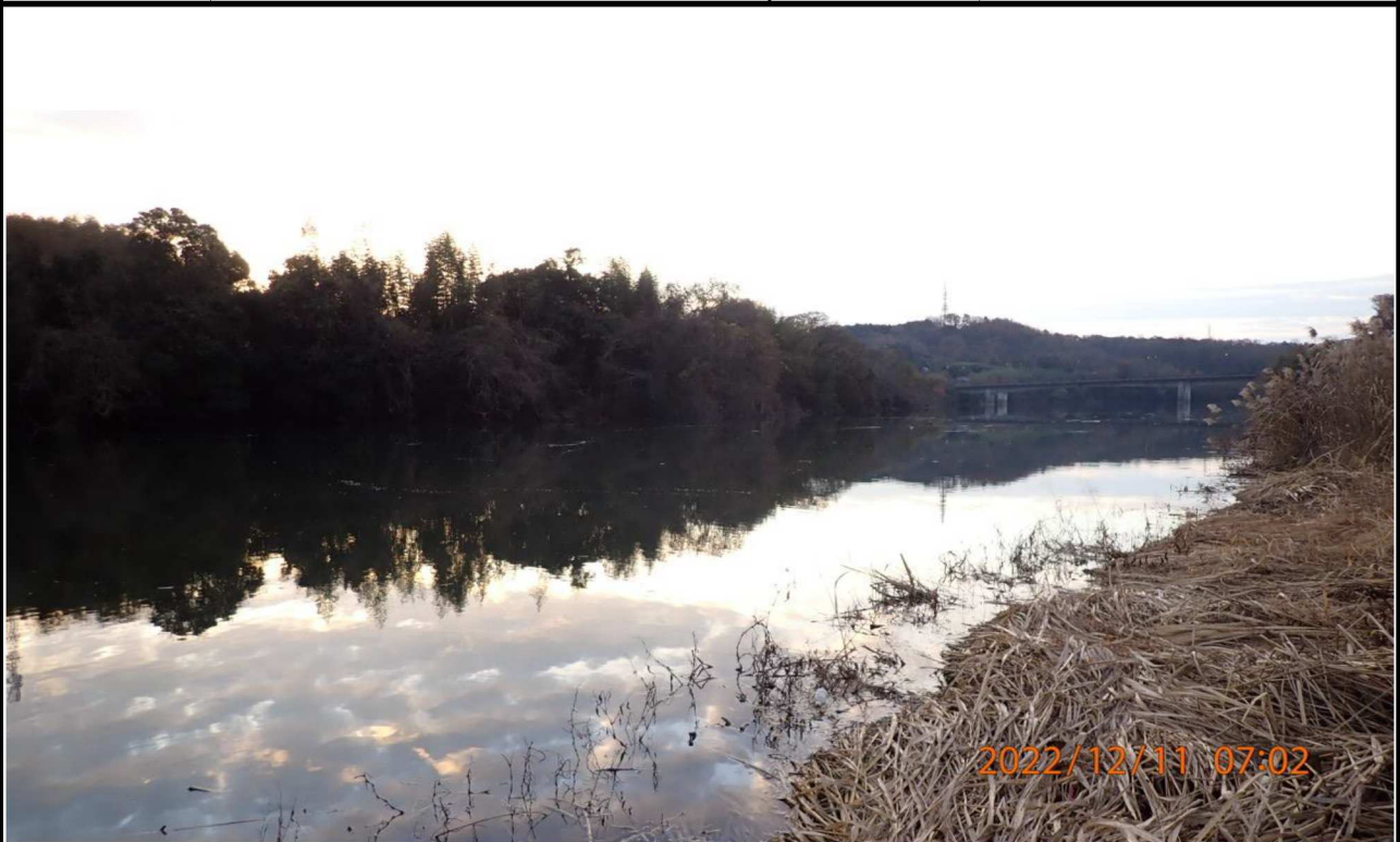
右岸35.8km付近より下流を撮影。