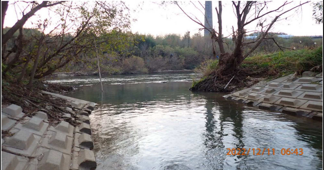
明神樋門付近の様子（3） 右岸34.4km付近 樋門からの流入地点を撮影。