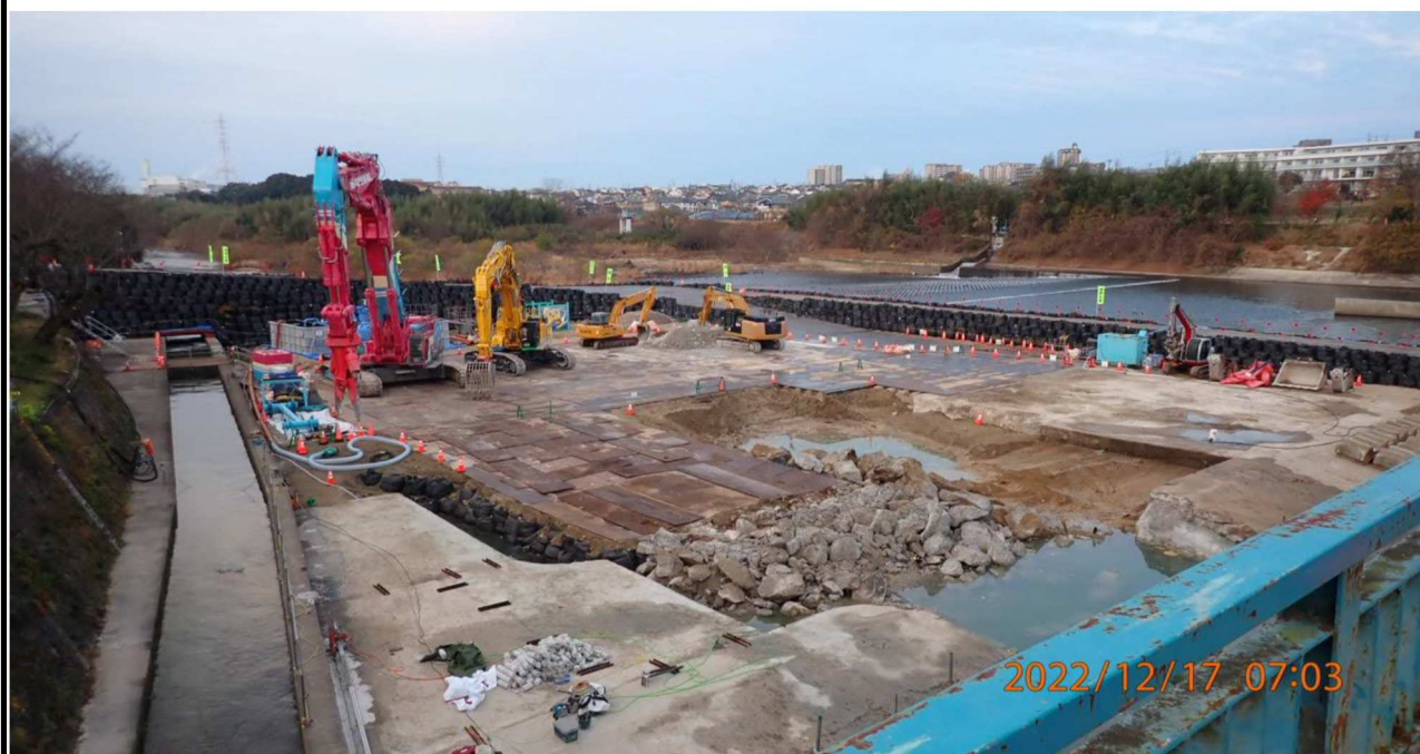
水源橋付近の様子（8） 水源橋左岸より下流を撮影。大掛かりな工事が行われている。