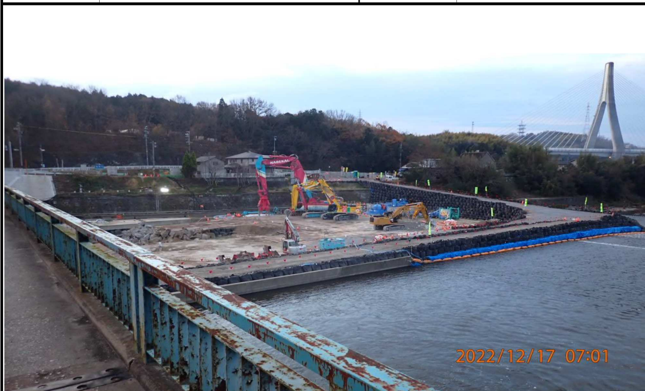
水源橋付近の様子（7） 水源橋中央付近より下流を撮影。左岸に工事の様子が見える。