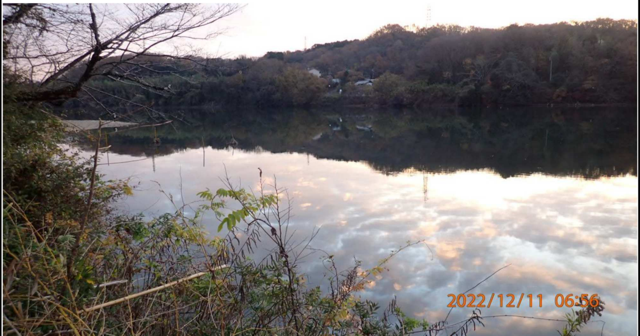
水源橋付近の様子（4） 右岸35.0km付近より上流を撮影。