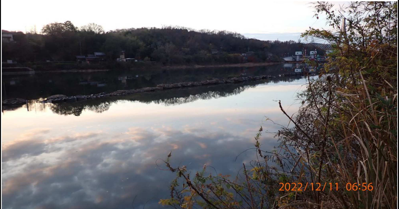
水源橋付近の様子（3） 右岸35.0km付近より下流を撮影。