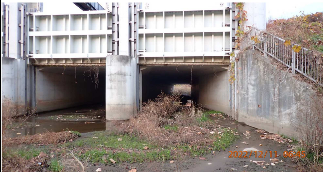
明神樋門付近の様子（6） 右岸34.4km付近 樋門の一部は水位が見られなかった。