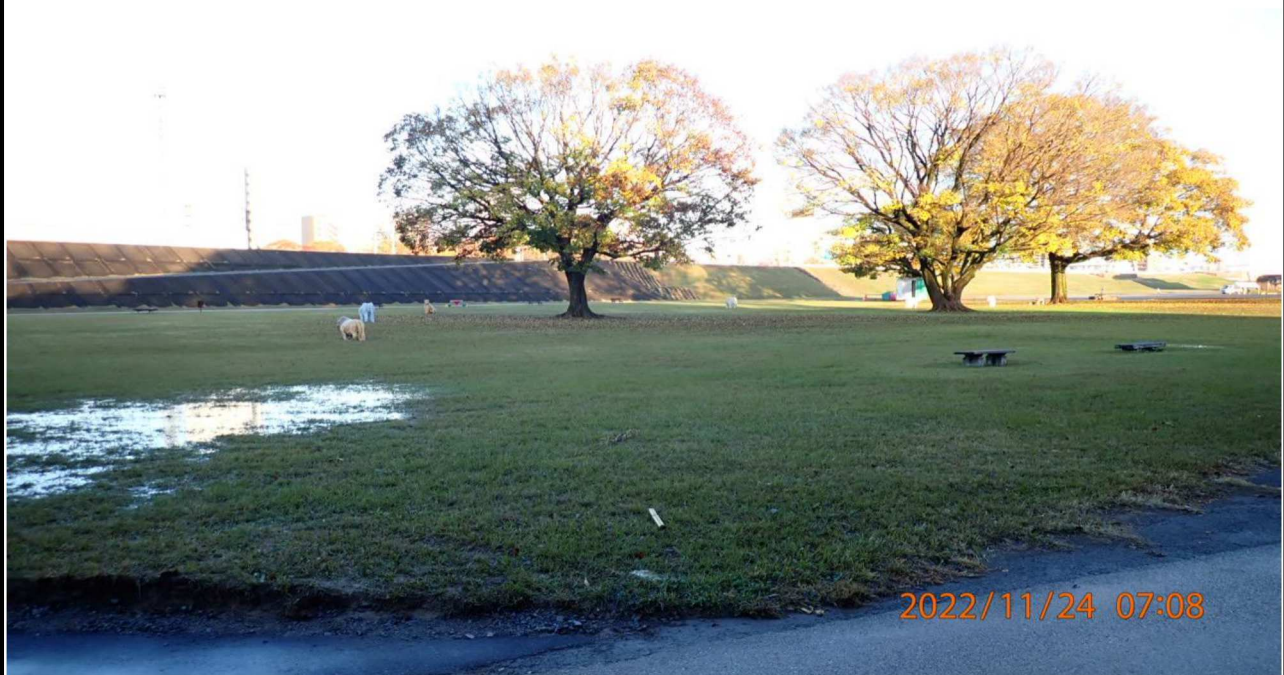
豊田大橋付近の様子（2） 右岸39.6km付近より下流方面を撮影。