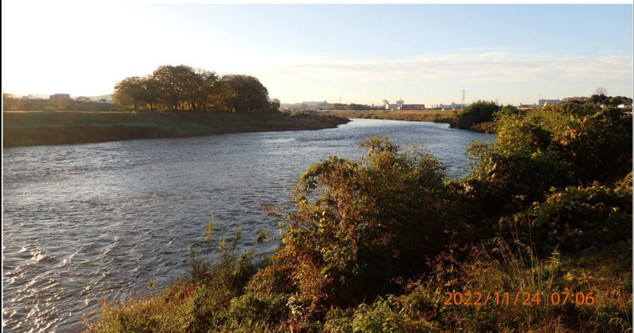
久澄橋付近の様子（2）