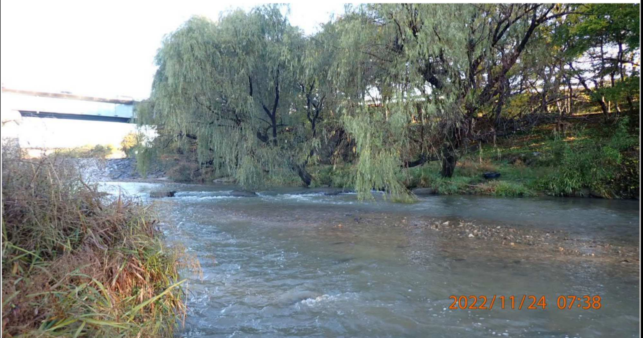
籠川合流点付近を撮影（4） 右岸41.6km付近より籠川上流を撮影。