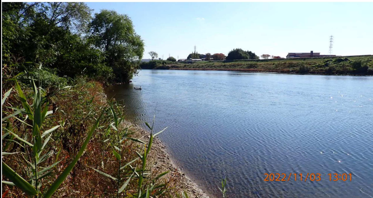
加茂川水門付近の様子（3） 左岸38.8km付近より下流を撮影。