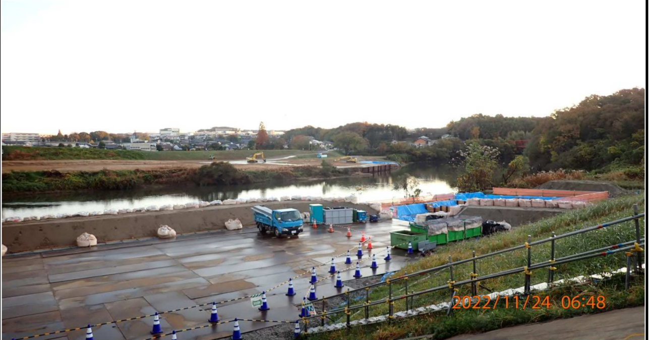
竜宮橋河川敷工事の様子（1） 右岸37.6km付近より下流を撮影。