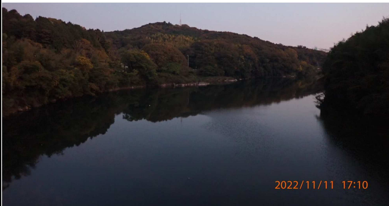
鵜の首橋付近の様子（3） 37.2km付近の鵜の首橋より下流を撮影。夕暮れの景色。