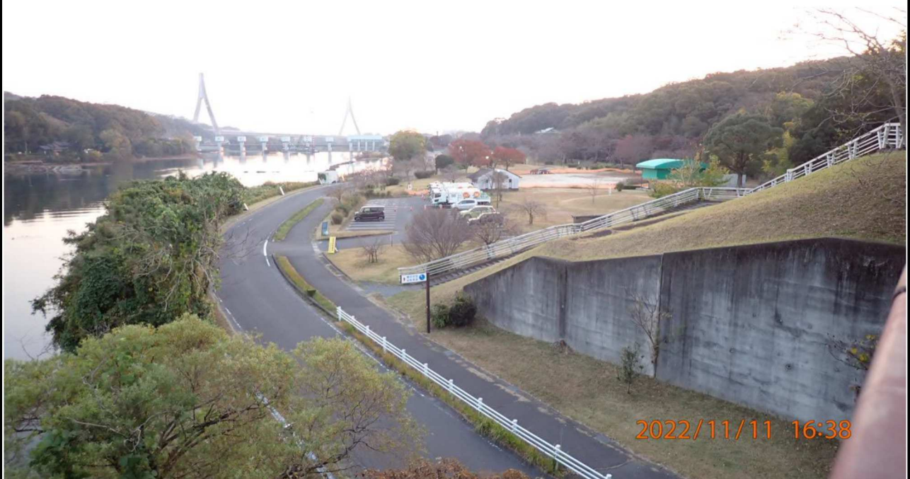
山室橋付近の様子（4）