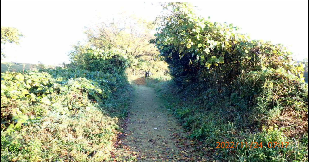
高橋付近の様子（2） 右岸40.4km付近の小路より上流を撮影。早朝は緑鮮やかで清々しい。