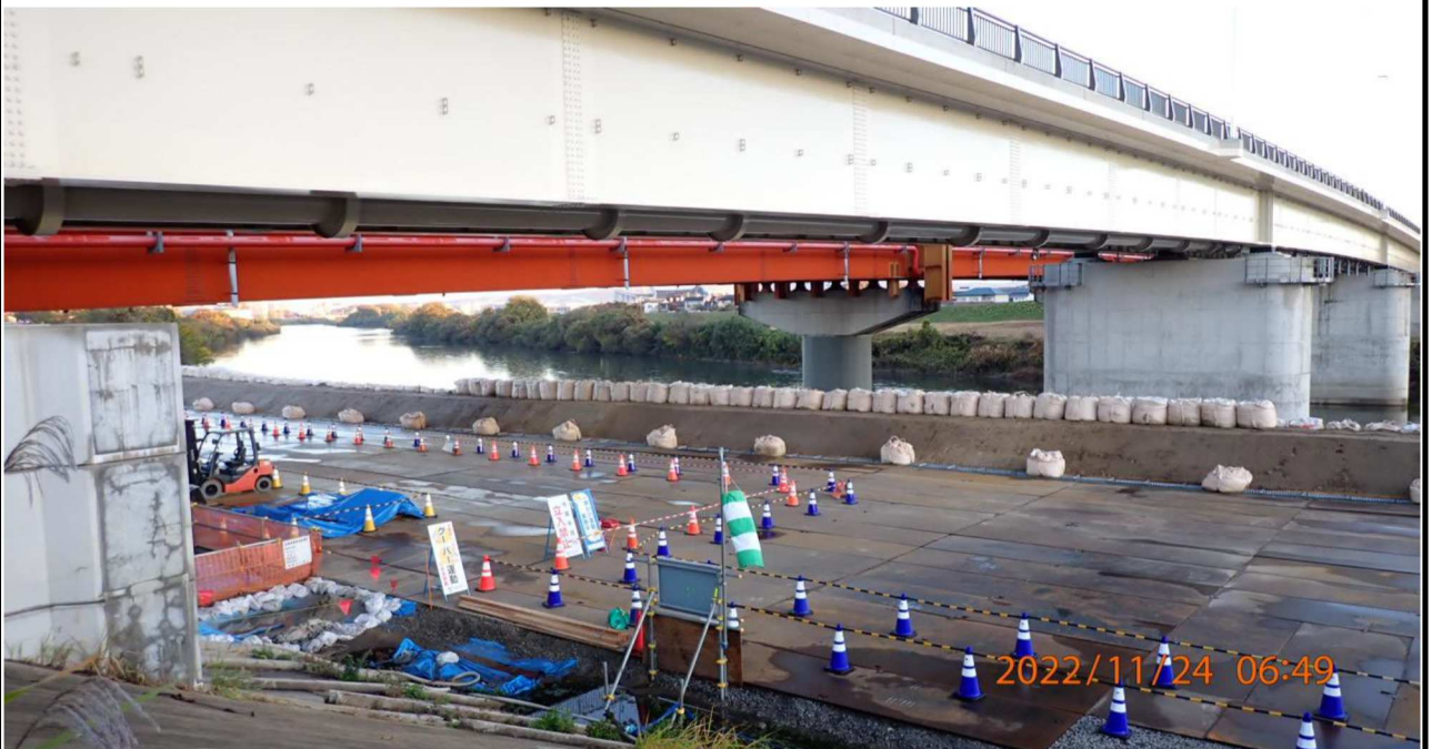
竜宮橋河川敷工事の様子（2） 右岸37.6km付近より対岸を撮影。