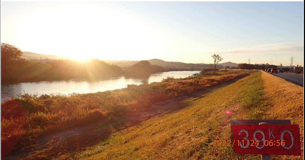
右岸39.0km付近より下流を撮影。