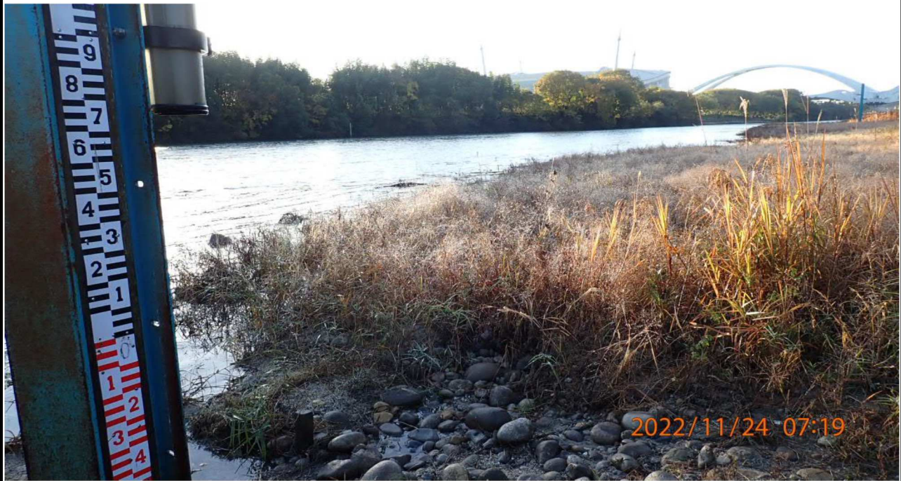
高橋付近の様子（3） 右岸40.5km付近の河川敷より下流を撮影。