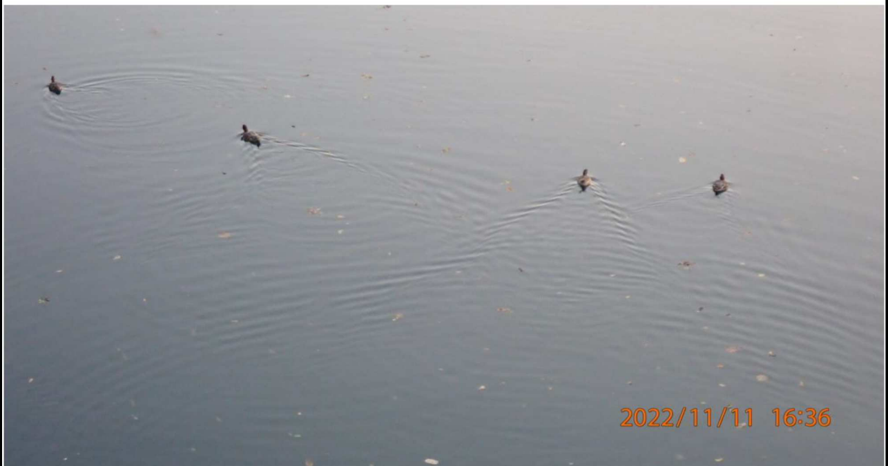
山室橋付近の様子（1） 左岸35.4km付近の山室橋から下流を撮影。水鳥が見えた。