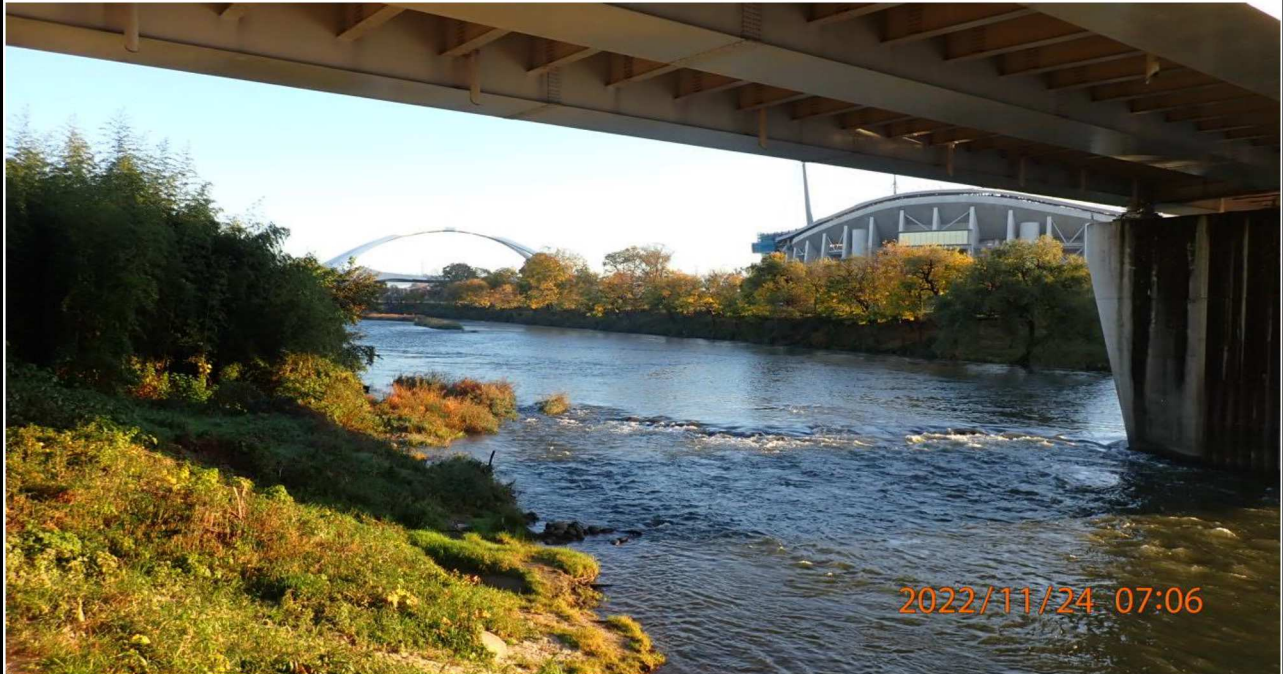
久澄橋付近の様子（1）