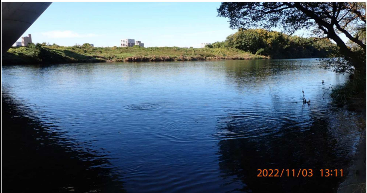
豊田大橋付近の様子（2） 左岸39.8km付近の豊田大橋下より上流を撮影。