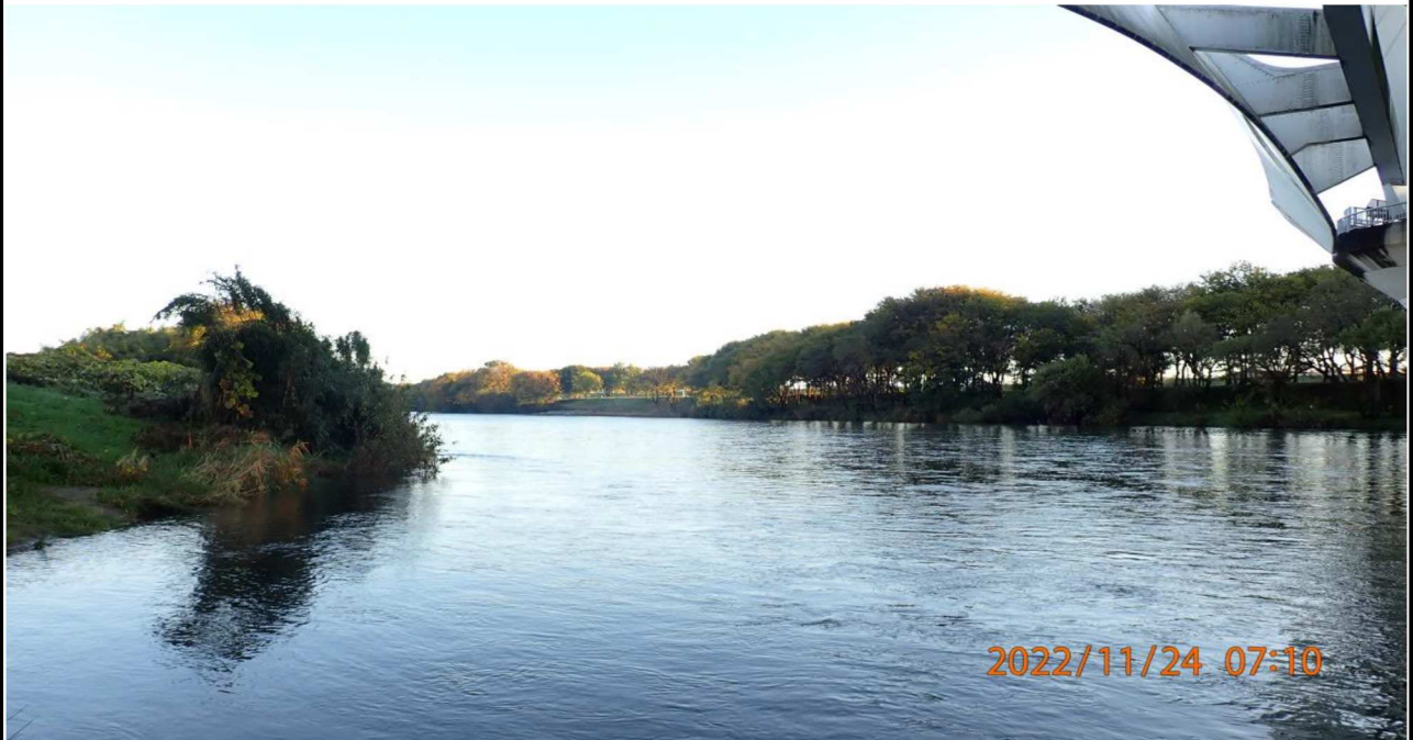
豊田大橋付近の様子（3） 右岸39.8km付近より上流を撮影。