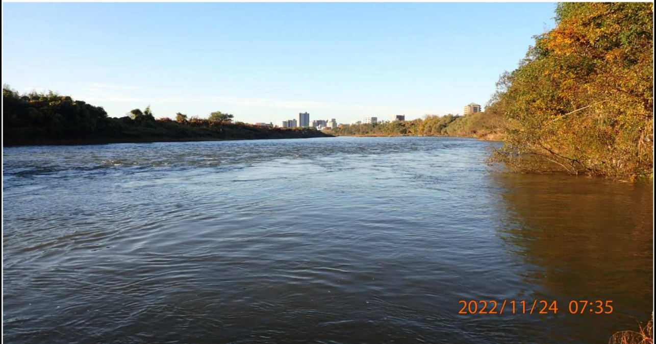
籠川合流点付近を撮影（1） 右岸41.6km付近より下流を撮影。