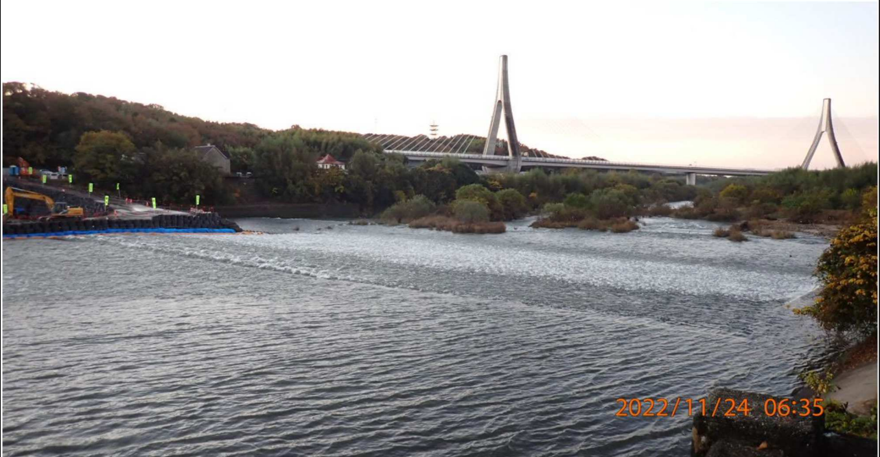
水源公園付近の様子（1） 水源橋より下流を撮影。