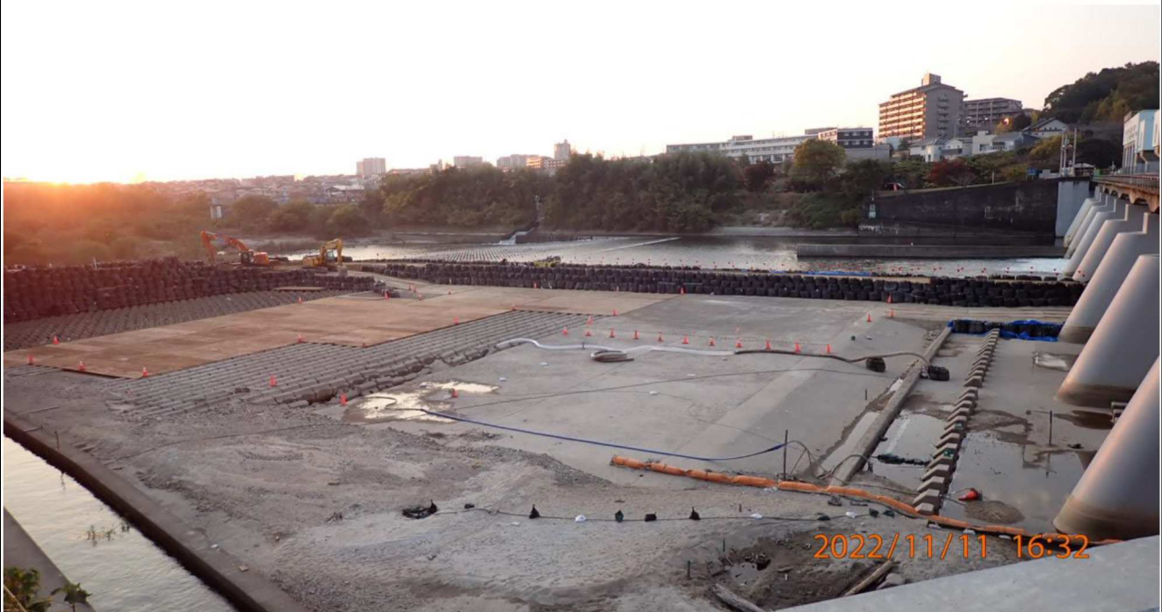
水源橋付近の様子（2） 左岸34.6km付近の水源橋より下流を撮影。