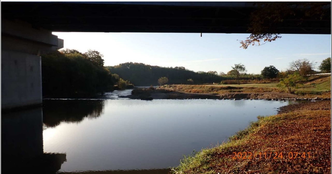
籠川合流点付近を撮影（6） 右岸41.6km付近より籠川下流を撮影。