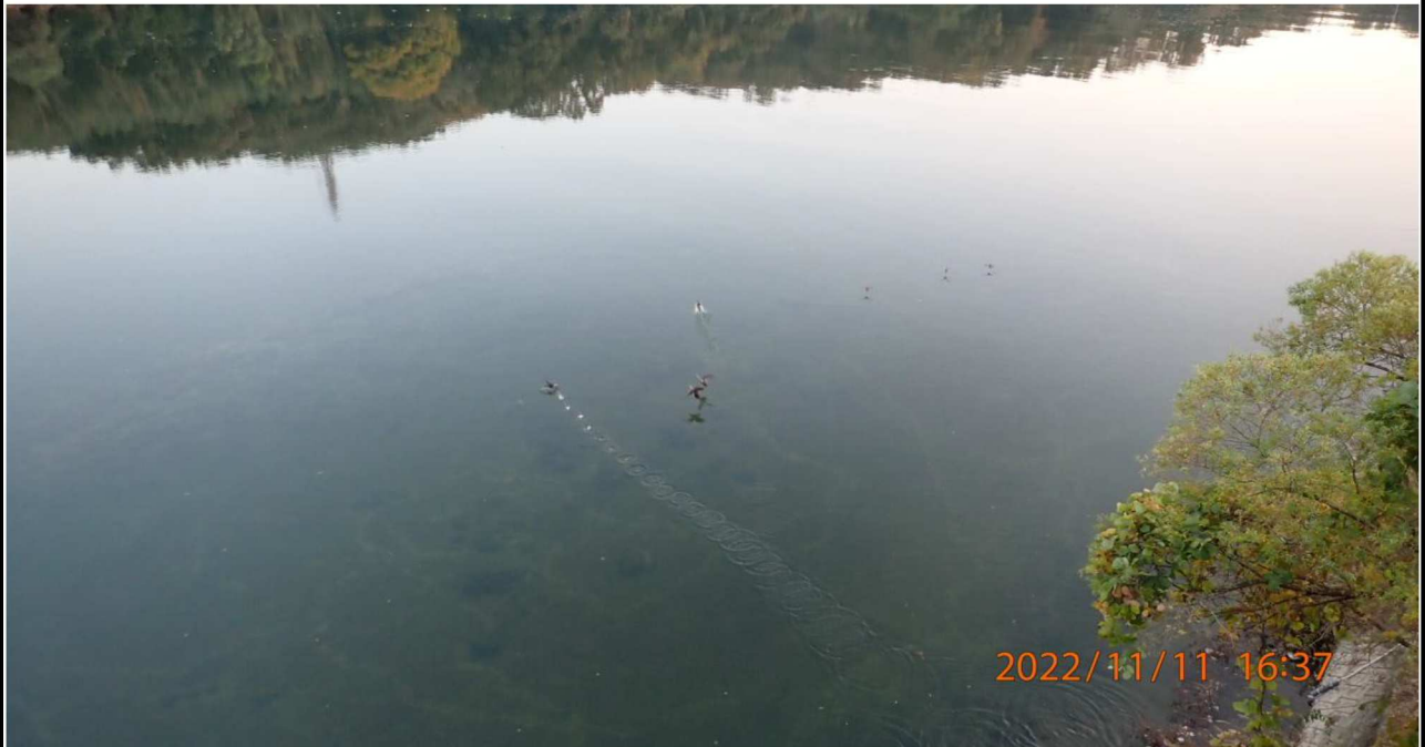
山室橋付近の様子（3）