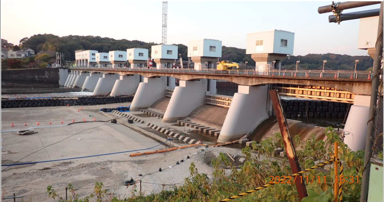
水源橋付近の様子（1） 左岸34.6km付近の水源橋を撮影。