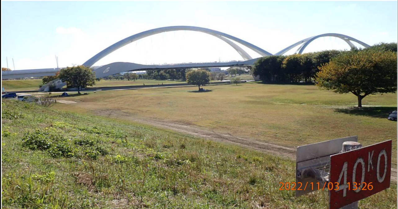
豊田大橋付近の様子（7） 左岸40.0km付近より下流側を撮影。