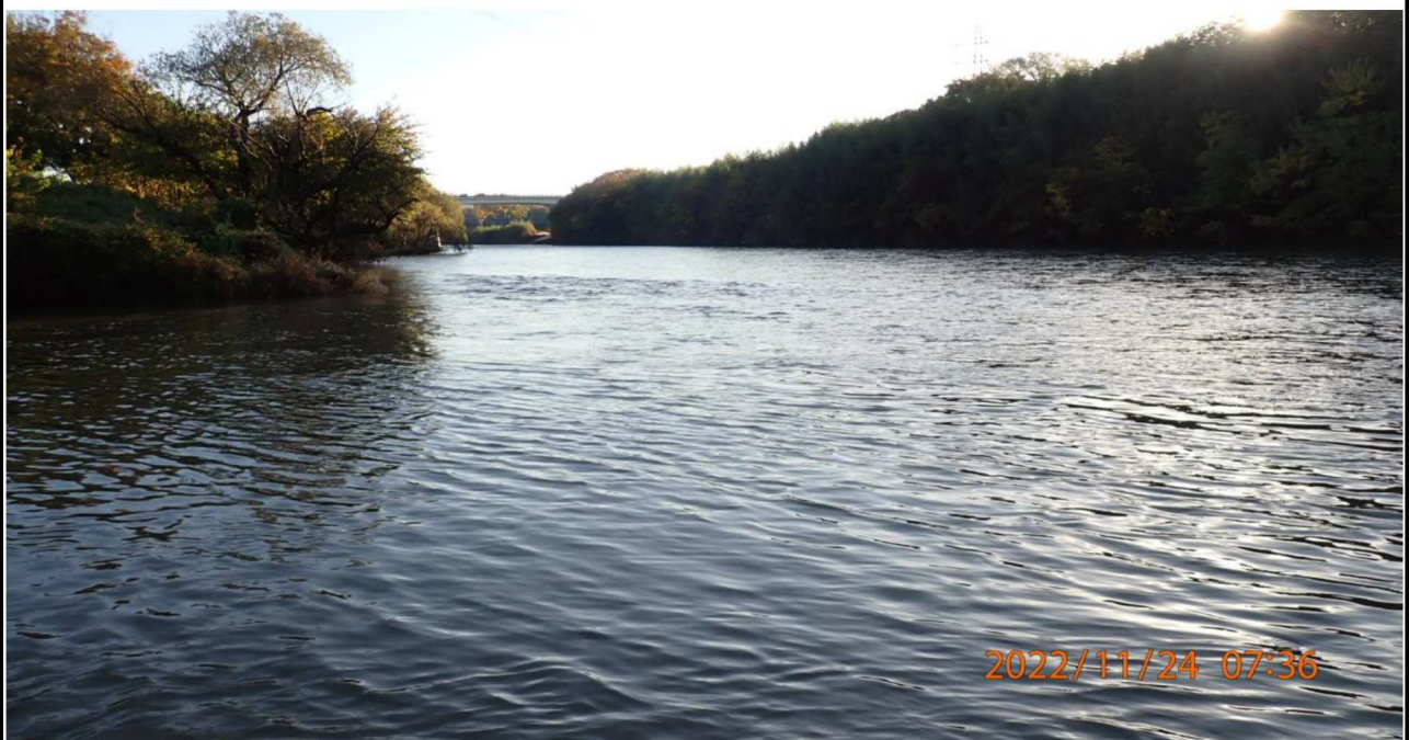
籠川合流点付近を撮影（2） 右岸41.6km付近より上流を撮影。