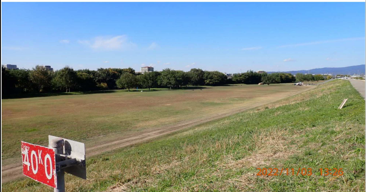
豊田大橋付近の様子（7） 左岸40.0km付近より上流側を撮影。