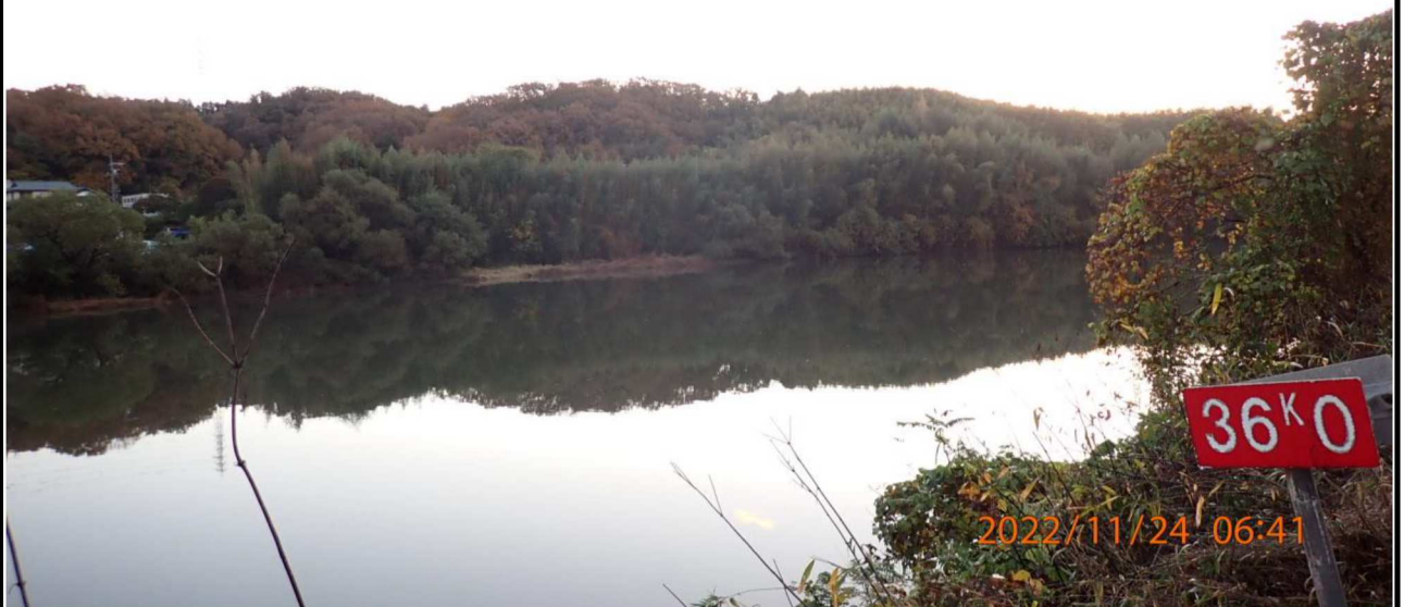
右岸36.0km付近より上流を撮影。