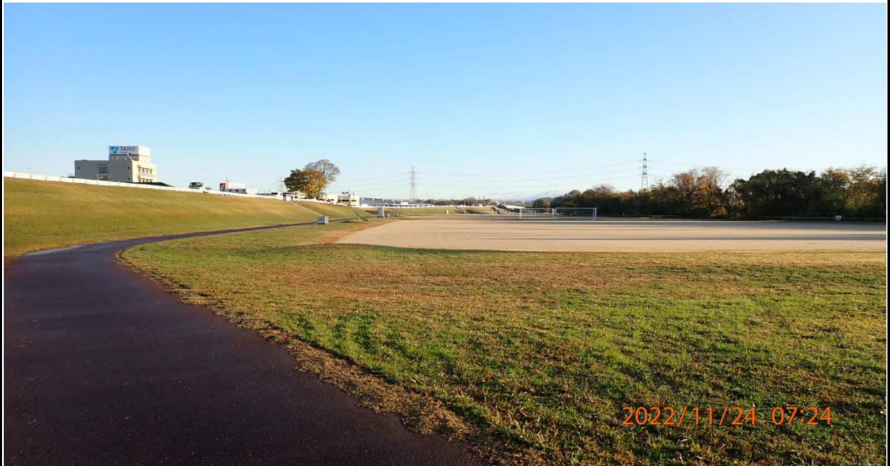
高橋付近の様子（5） 右岸41.0km付近の川端公園より上流側を撮影。