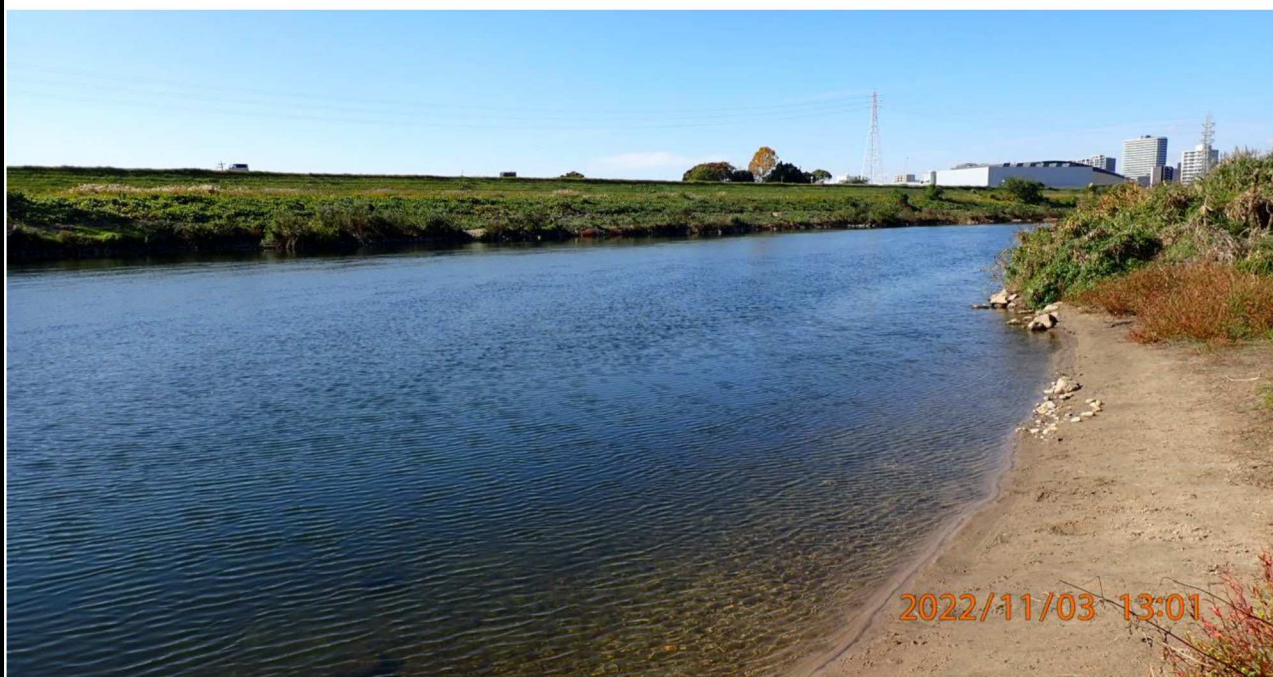
加茂川水門付近の様子（4） 左岸38.8km付近より上流を撮影。