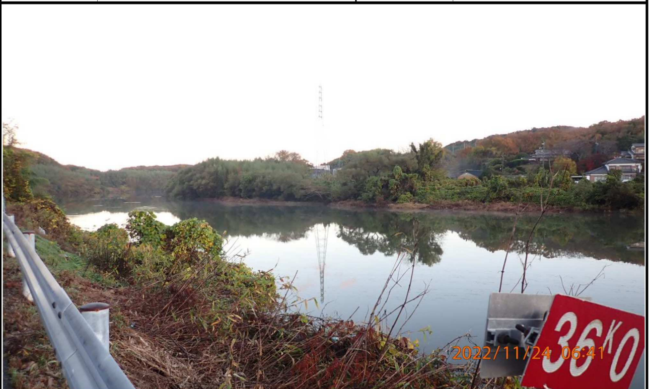
右岸36.0km付近より下流を撮影。