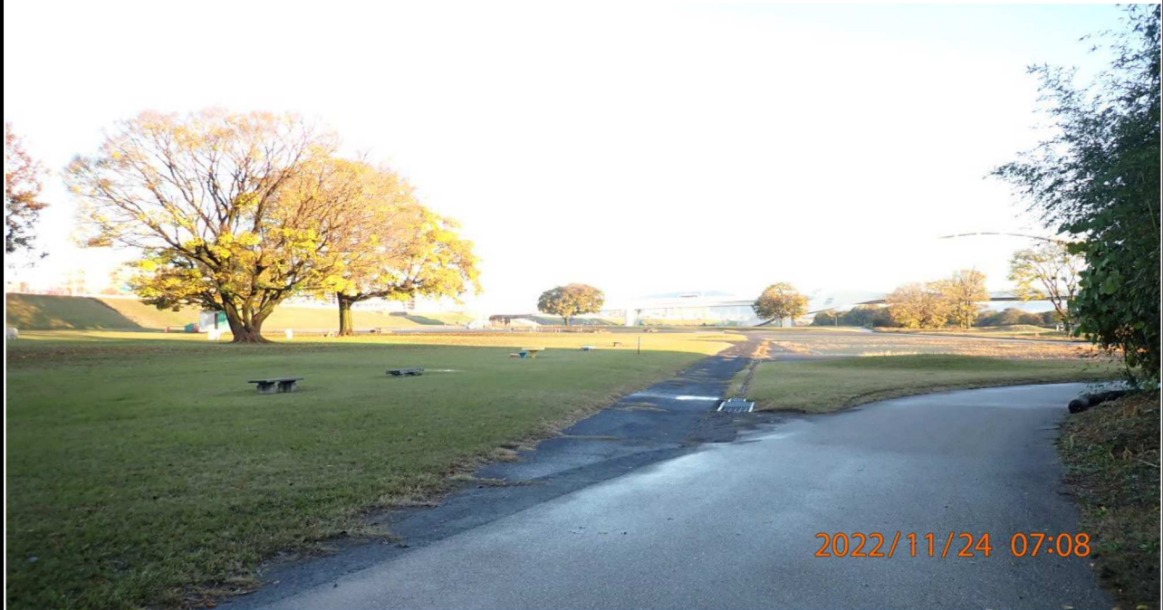
豊田大橋付近の様子（1） 右岸39.6km付近より下流方面を撮影。