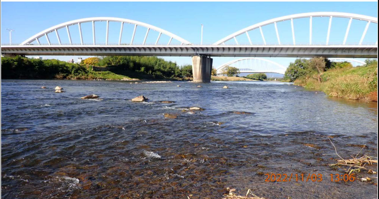
久澄橋付近の様子（2） 左岸39.4km付近より上流を撮影。