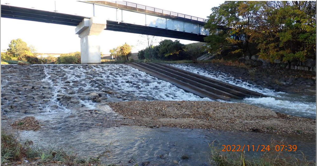
籠川合流点付近を撮影（5） 右岸41.6km付近より籠川上流を撮影。