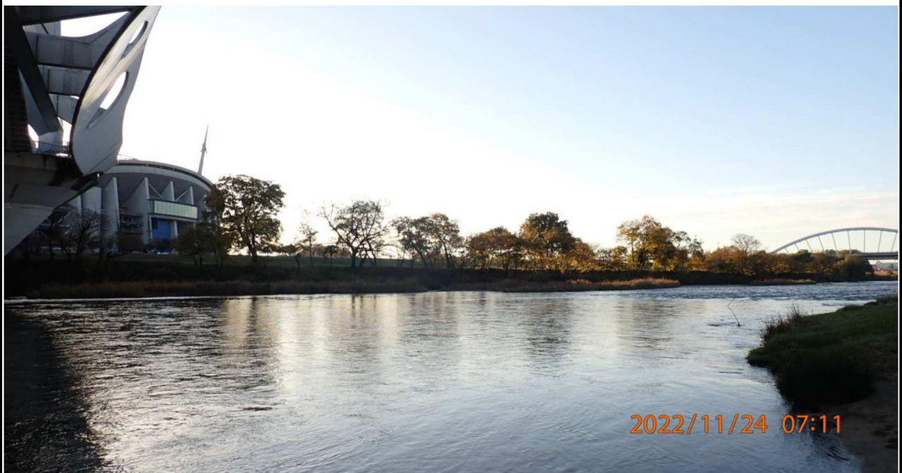
豊田大橋付近の様子（4） 右岸39.8km付近より下流を撮影。