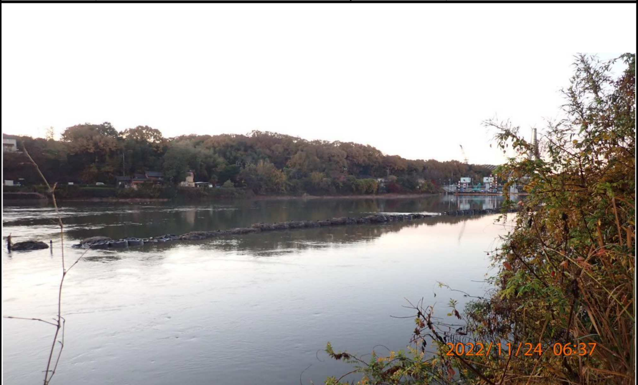
水源公園付近の様子（3） 右岸35.0km付近より下流を撮影。