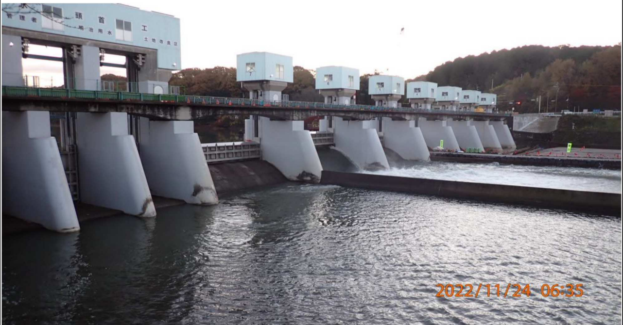
水源公園付近の様子（2） 水源橋を撮影。