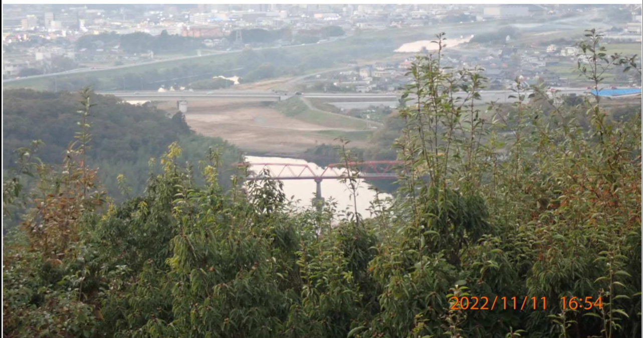
鵜の首橋付近の様子（2） 野見山展望台から上流を撮影。望遠側で鵜の首橋を捉えた。