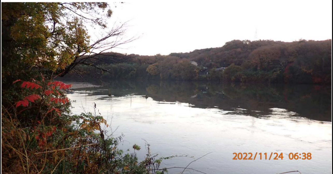
水源公園付近の様子（4） 右岸35.0km付近より上流を撮影。