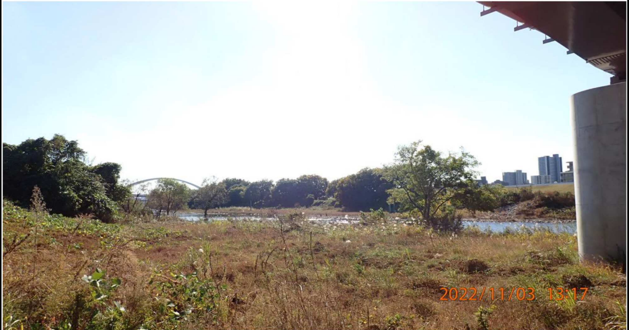
豊田大橋付近の様子（5） 左岸40.6km付近の高橋下より下流を撮影。