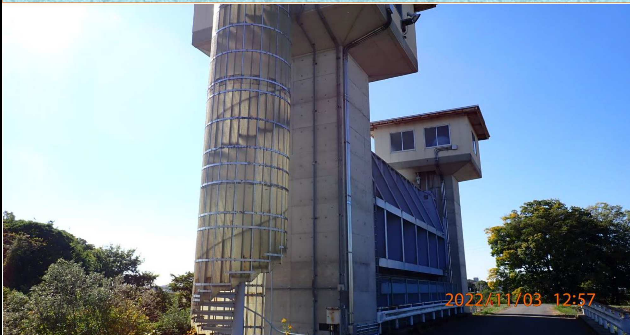
加茂川水門付近の様子（1） 水門の全景。