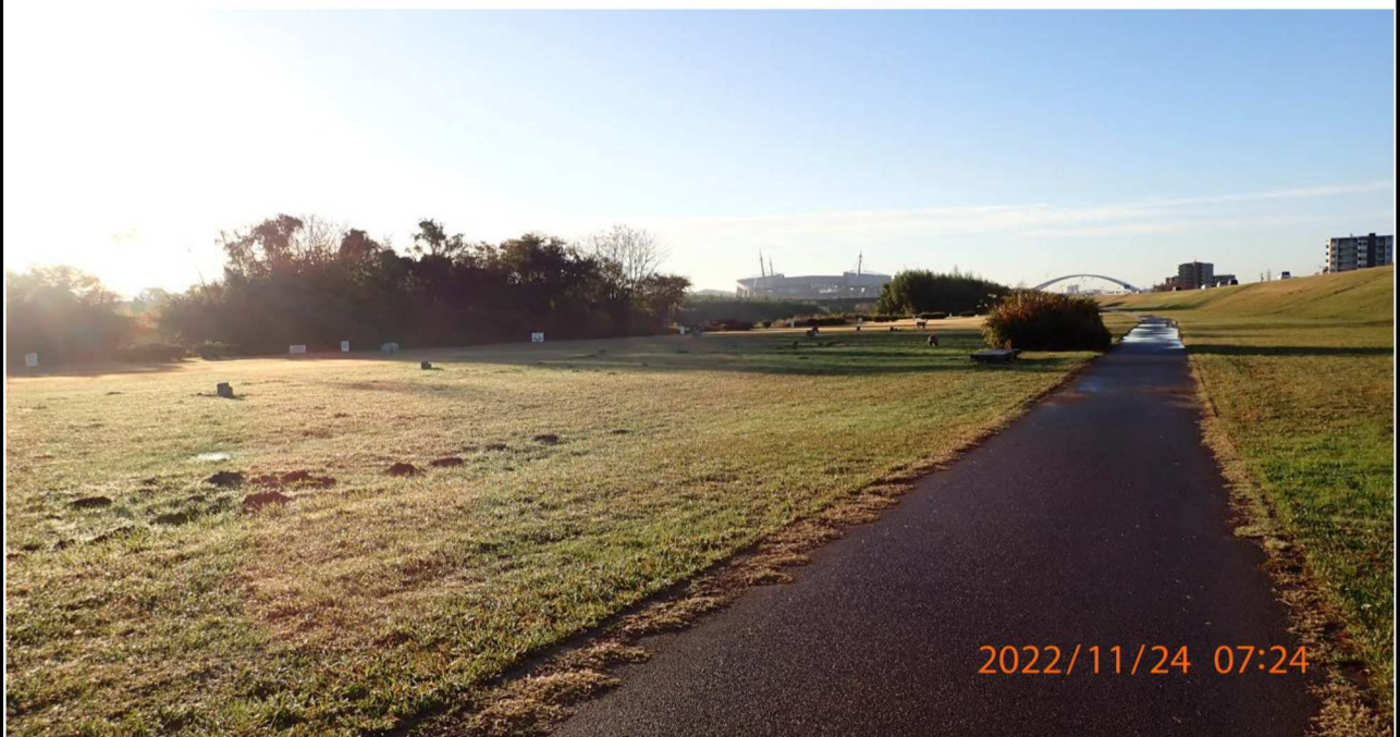
高橋付近の様子（6） 右岸41.0km付近の川端公園より下流側を撮影。