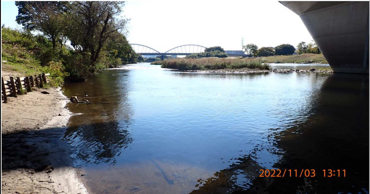
豊田大橋付近の様子（1） 左岸39.8km付近の豊田大橋下より下流を撮影。