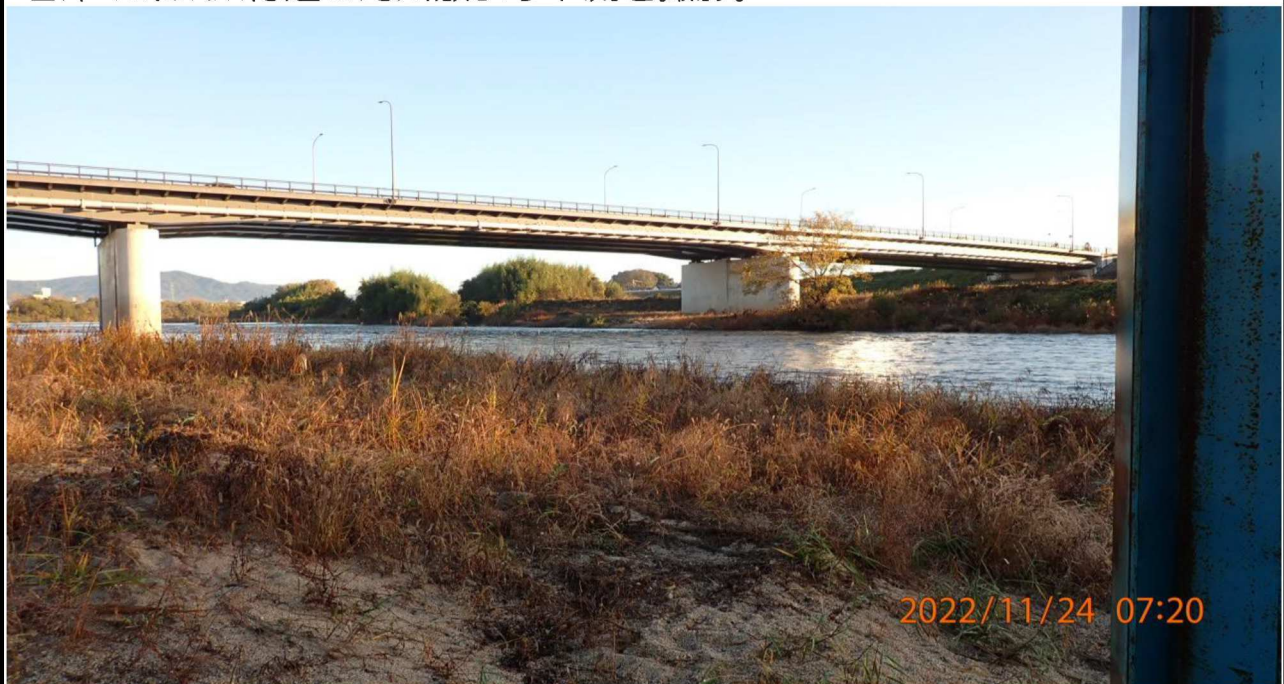
高橋付近の様子（4） 右岸40.5km付近の河川敷より上流を撮影。