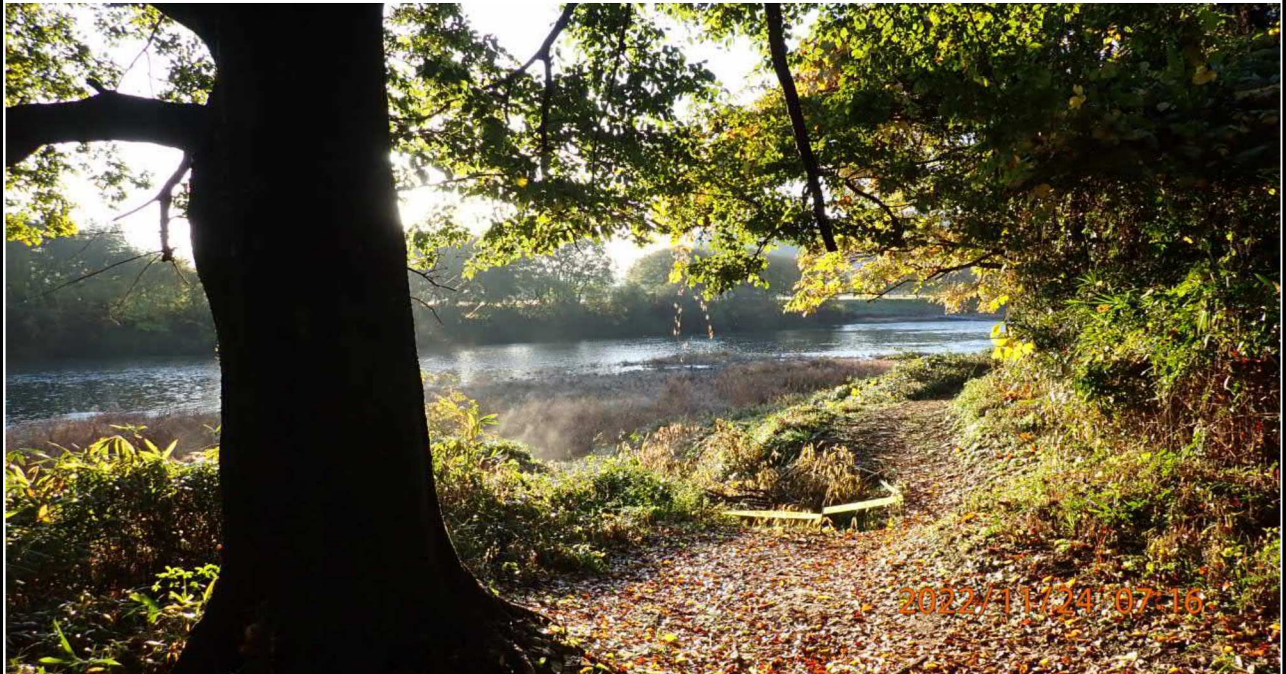
高橋付近の様子（1） 右岸40.4km付近の小路より下流を撮影