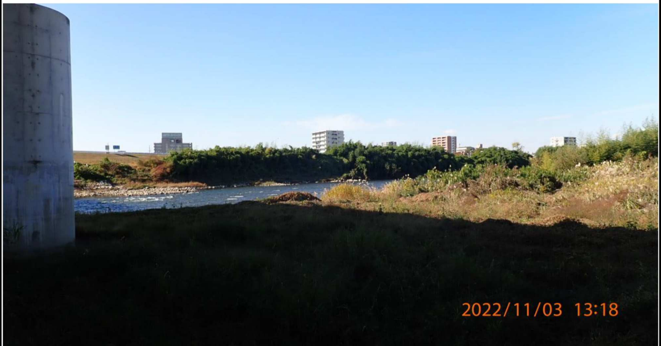
豊田大橋付近の様子（6） 左岸40.6km付近の高橋下より上流を撮影。