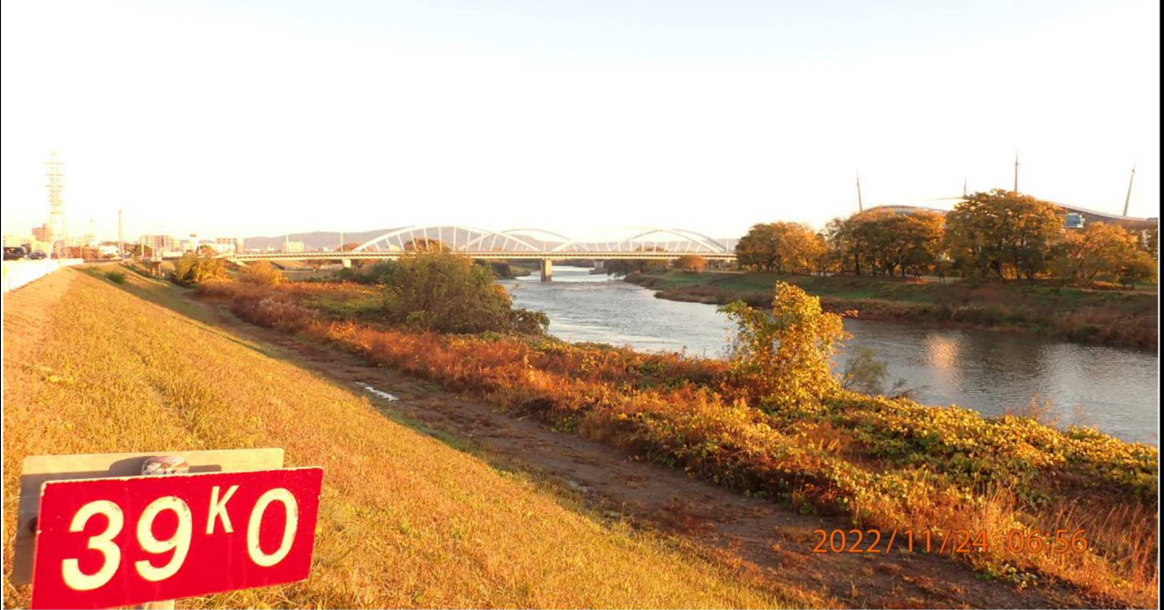
右岸39.0km付近より上流を撮影。