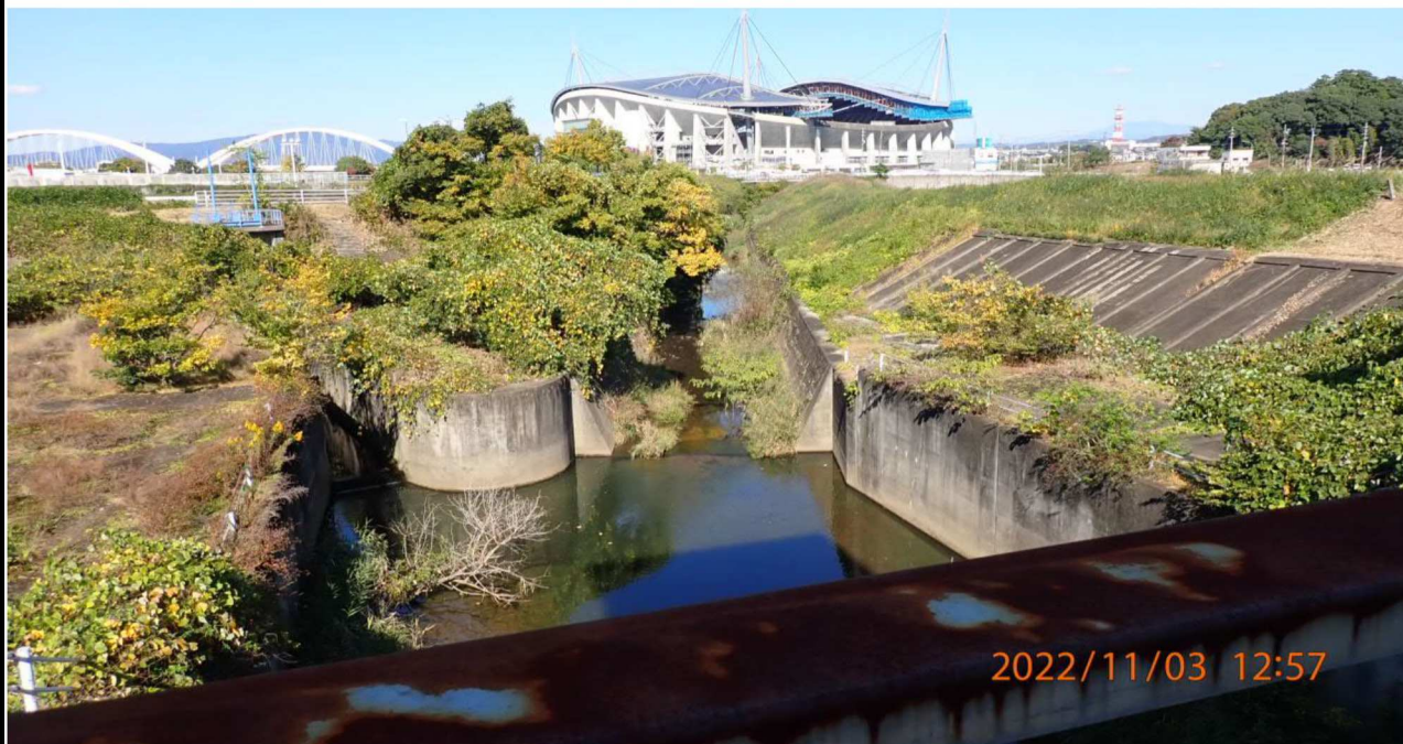
加茂川水門付近の様子（2） 水門より上流を撮影。