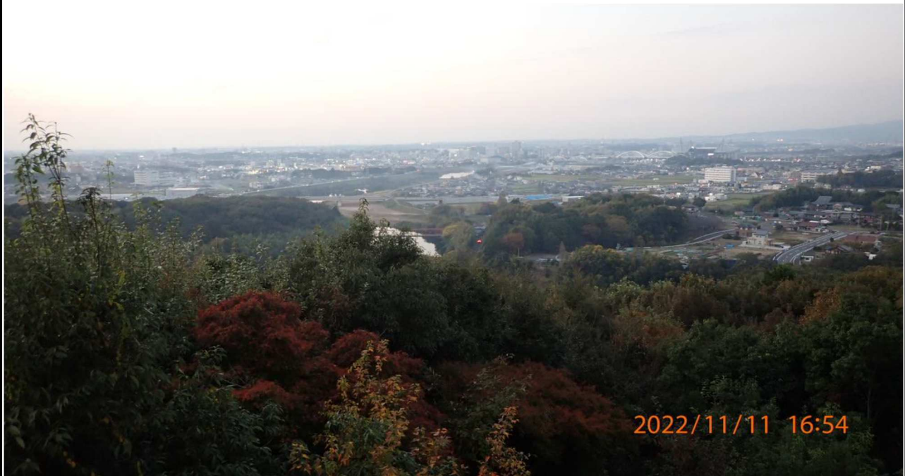
鵜の首橋付近の様子（1） 左岸37.2km付近の野見山展望台から上流を撮影。