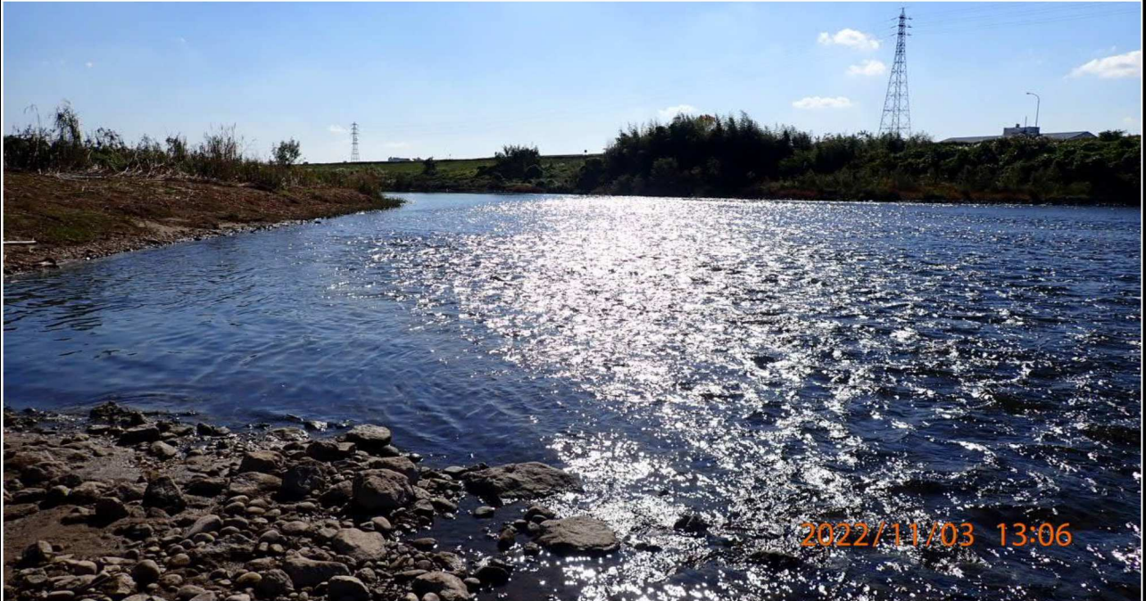
久澄橋付近の様子（1） 左岸39.4km付近より下流を撮影。