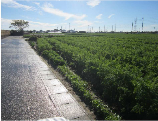
右岸堤内地に広がる人参畑