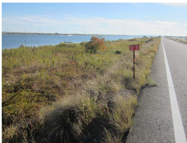
右岸2.0km地点、セイダカアワダチソウ群生