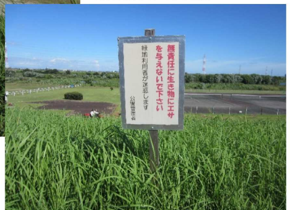
「無責任に生き物にエサを与えない」の看板