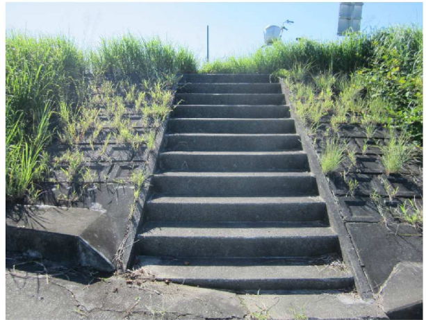
「矢作川西尾緑地の駐車場利用心得」の看板