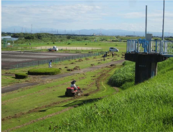
矢作川西尾緑地の維持管理のため草刈り撮影