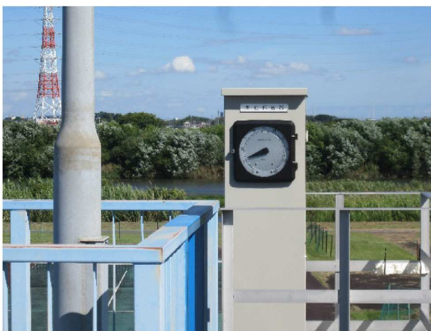
←水位伝送器 目盛りは0.1を指しています。