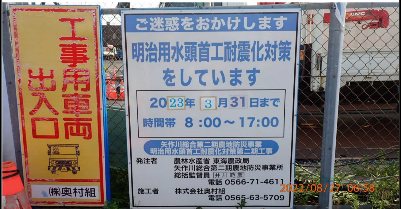
水源橋付近の様子（2）