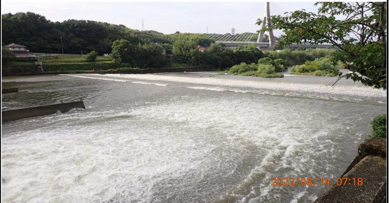
水源橋の様子（1） 前日の降雨により水量が多く流れも速い。