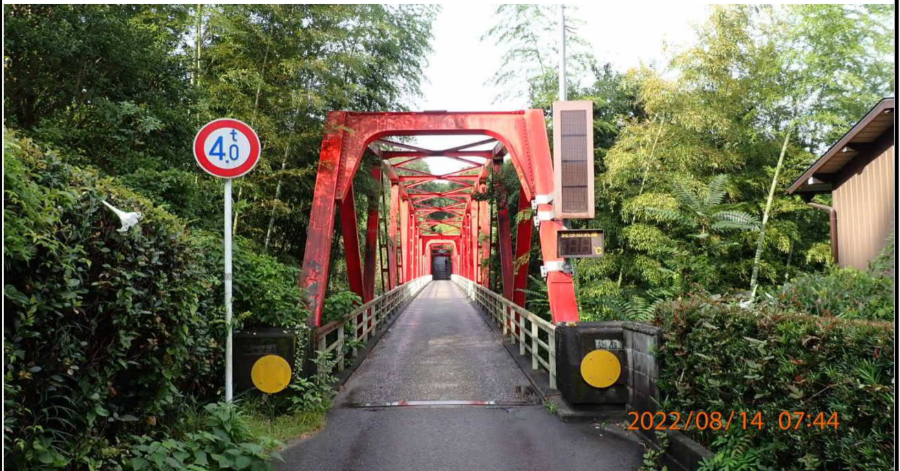
鶺の首橋付近の様子（6） 鶺の首橋入り口を撮影。