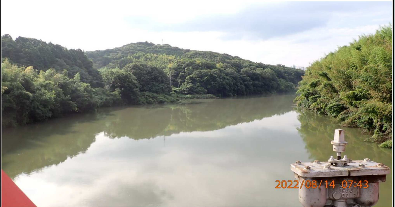
鵜の首橋付近の様子（3） 鵜の首橋より下流を撮影。