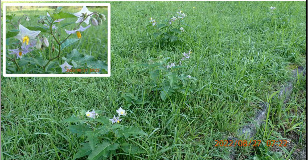
水源公園付近の様子（6）