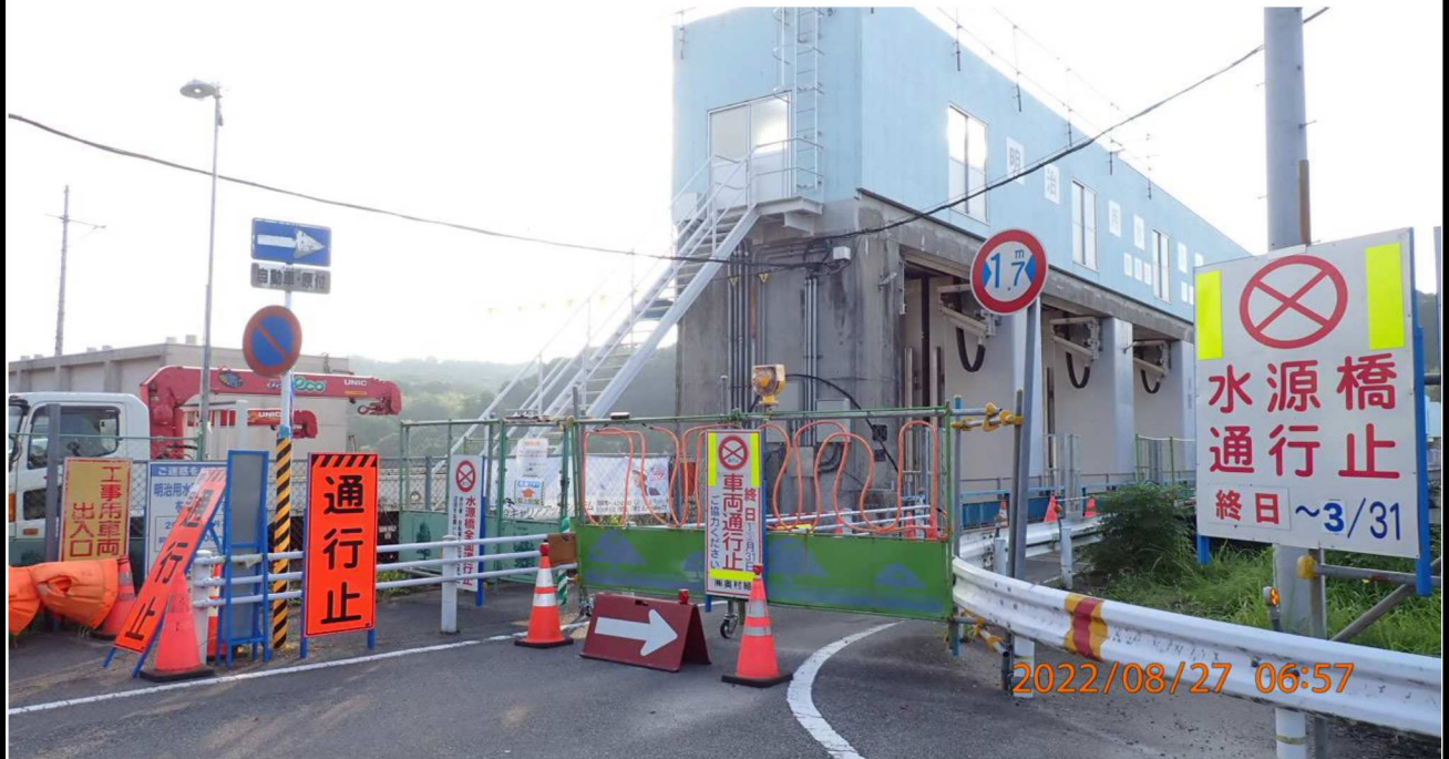
水源橋付近の様子（1）