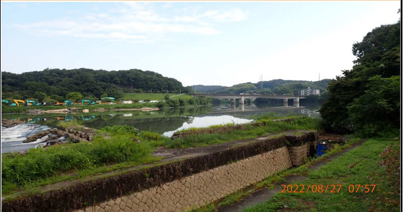
左岸35.0km付近の様子（1） 土嚢による堰き止めの様子が判る。