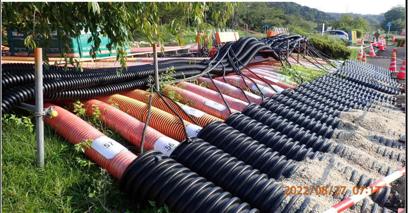
水源公園付近の様子（4）