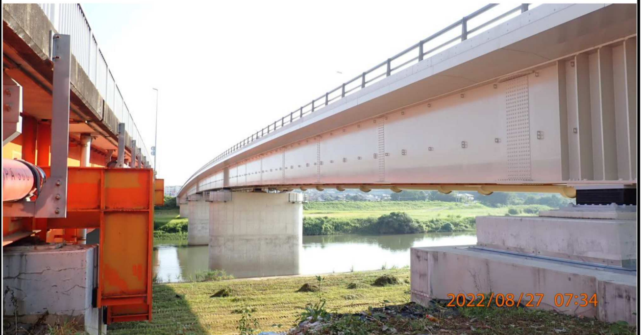
竜宮橋付近の様子（4） 左側が古い竜宮橋。