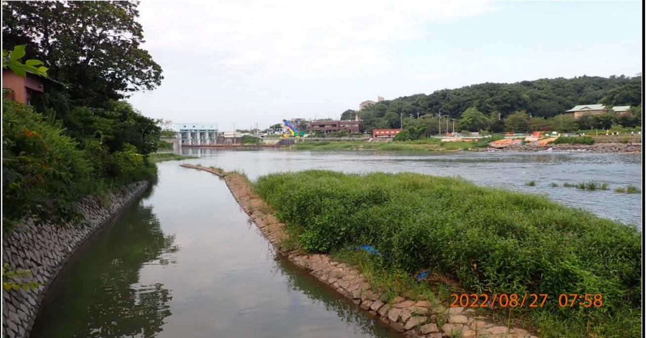
左岸35.0km付近の様子（3） 下流には水源橋が見える。