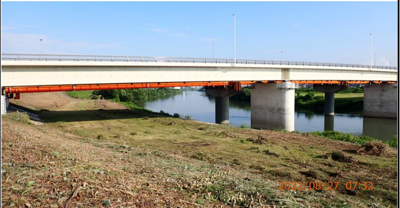
竜宮橋付近の様子（2）