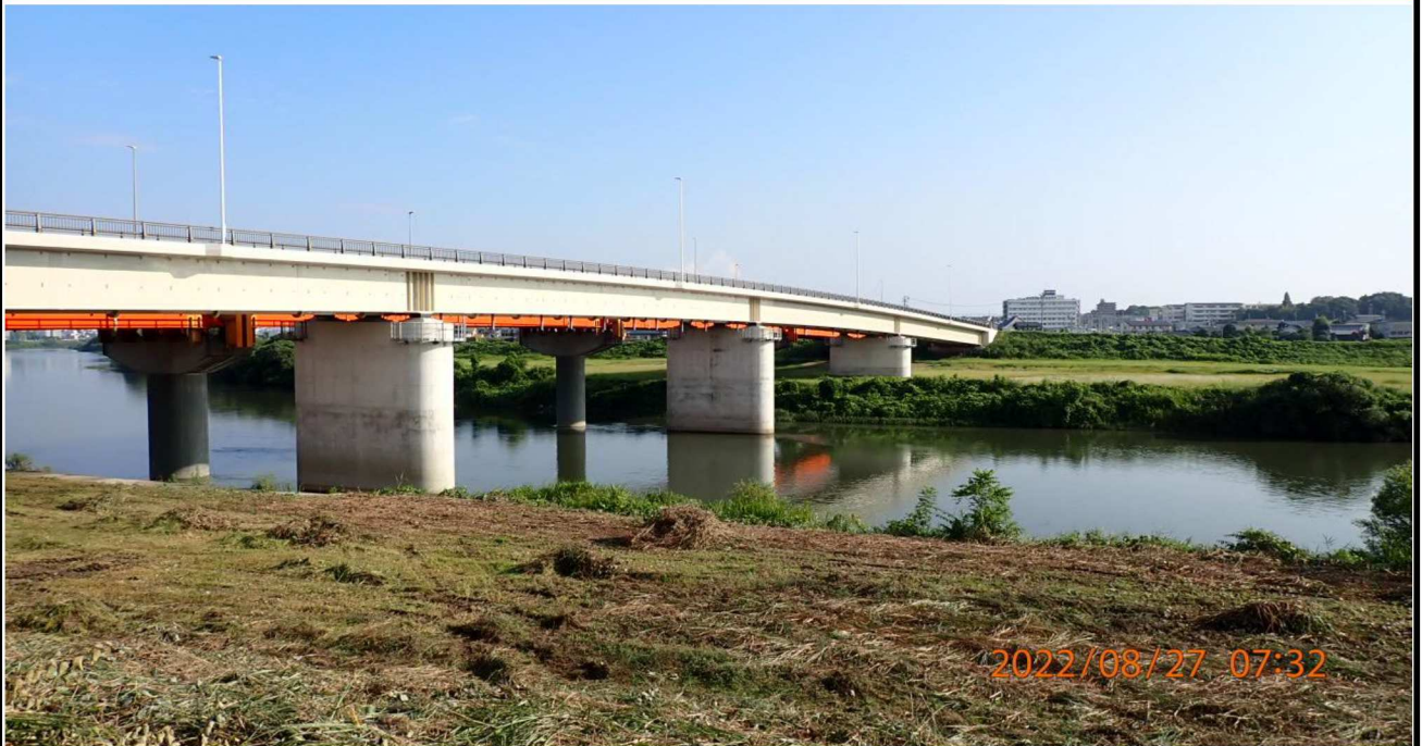
竜宮橋付近の様子（1） 草刈りが始まっていた。