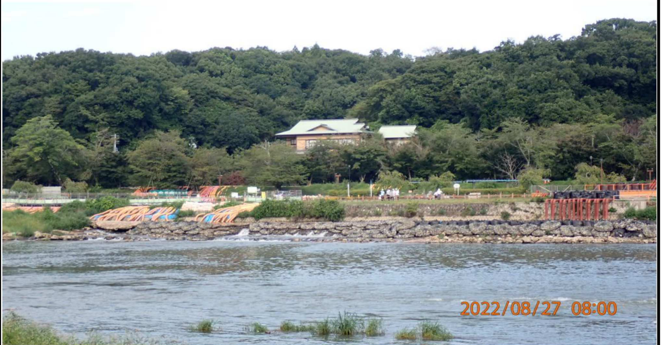
左岸35.0km付近の様子（4） 右岸の取水配管の様子が判る。 以上で8月の報告を終わります。