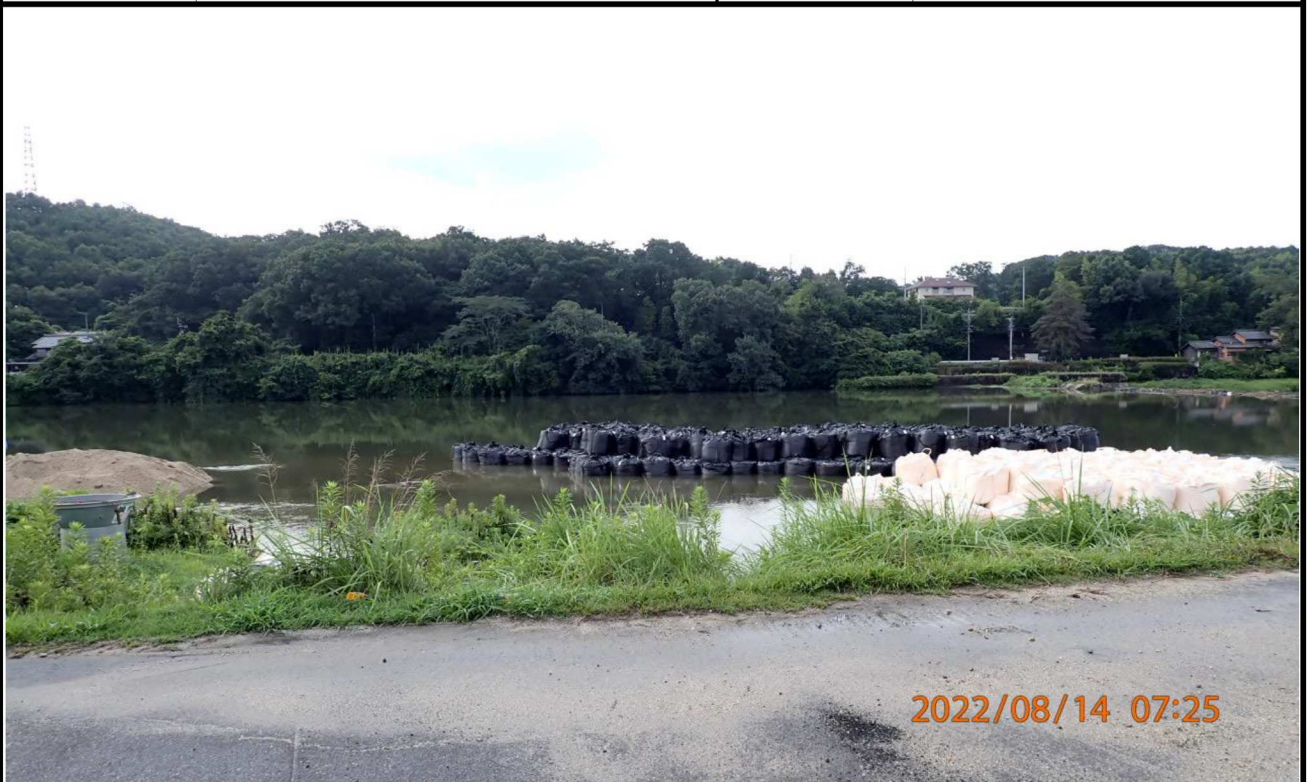
水源緑地付近の様子（3） 土嚢の作業場も水があふれていた。