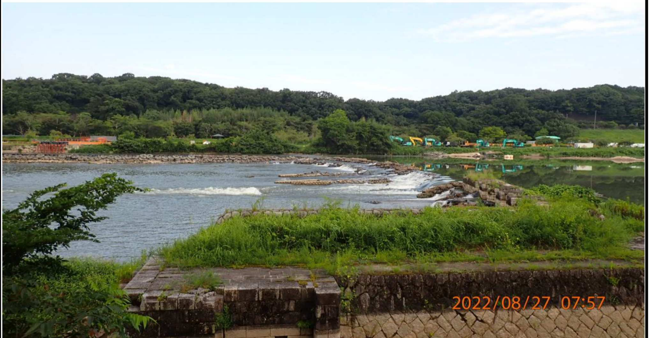
左岸35.0km付近の様子（2） 左岸より対岸を撮影。