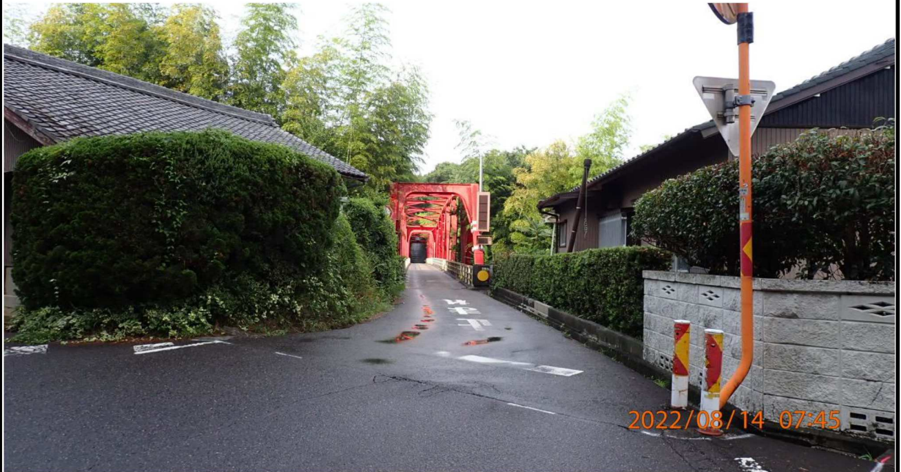
鶺の首橋付近の様子（5） 左岸より鶺の首橋入り口の様子。