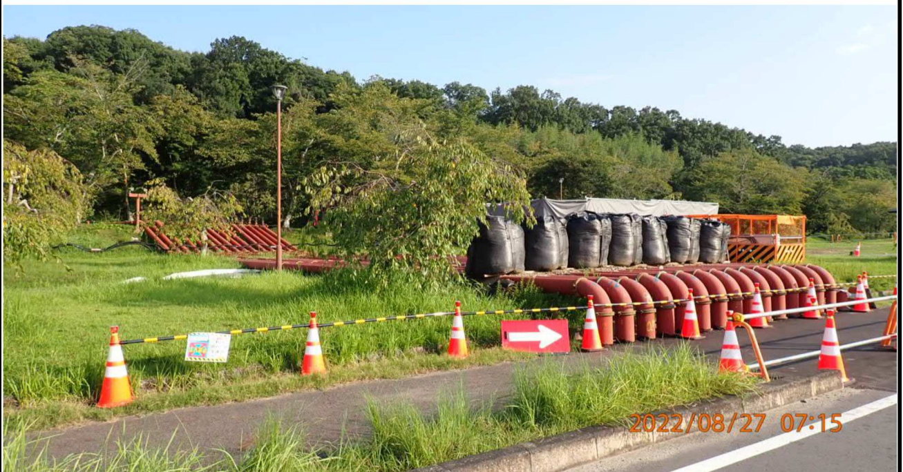
水源公園付近の様子（2）