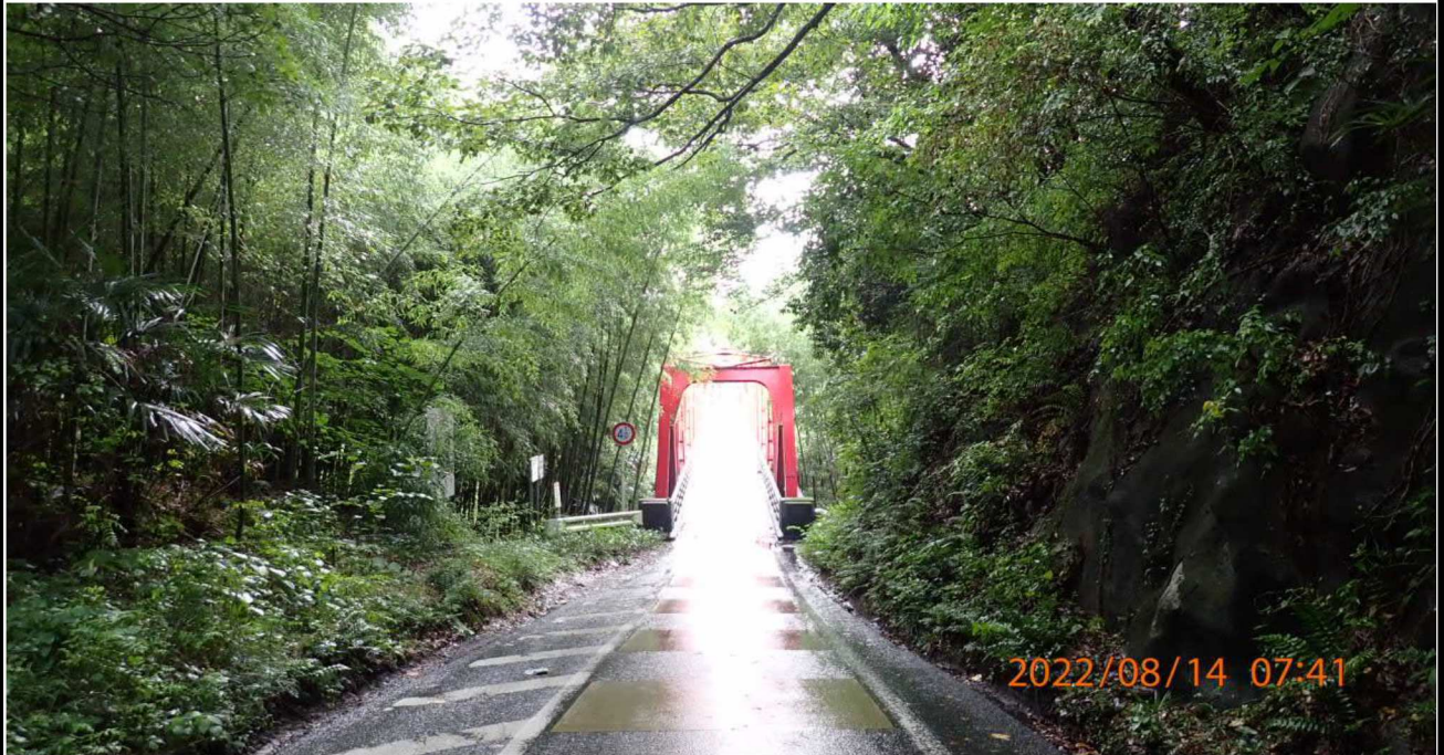
鵜の首橋付近の様子（1） 右岸37.2km付近より鵜の首橋入り口を撮影。