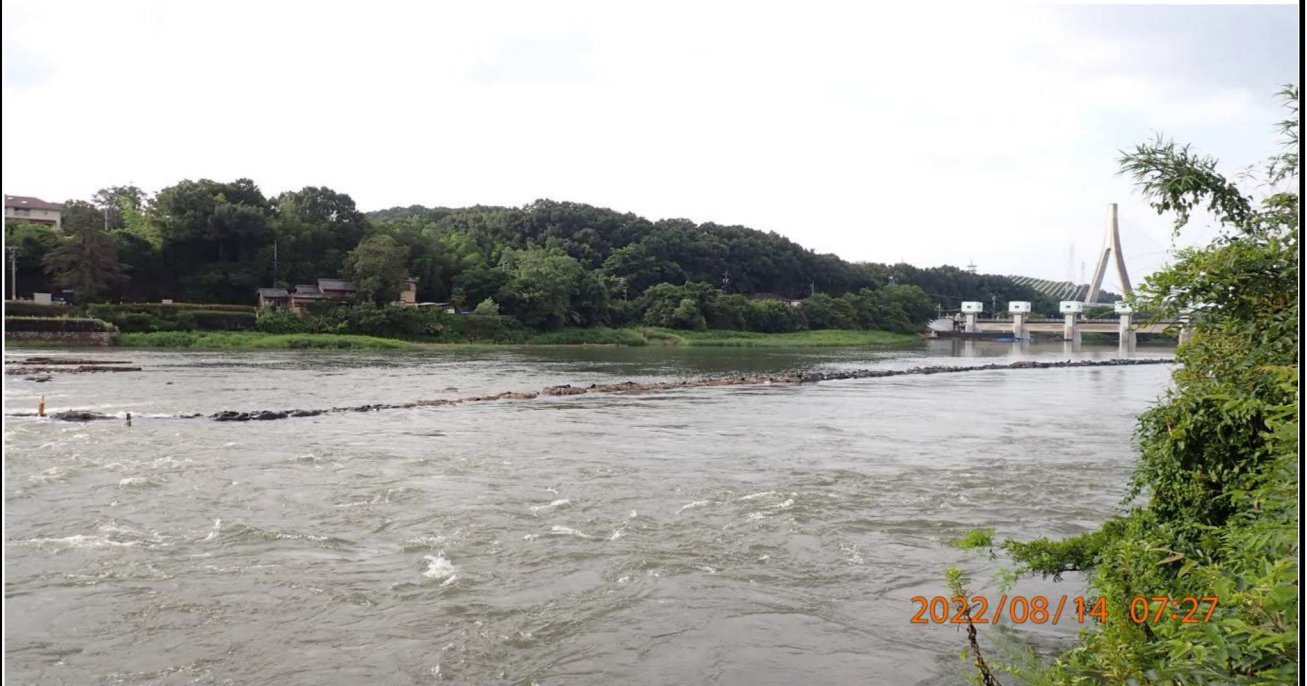
水源緑地付近の様子（1） 水量が多いのが判る。