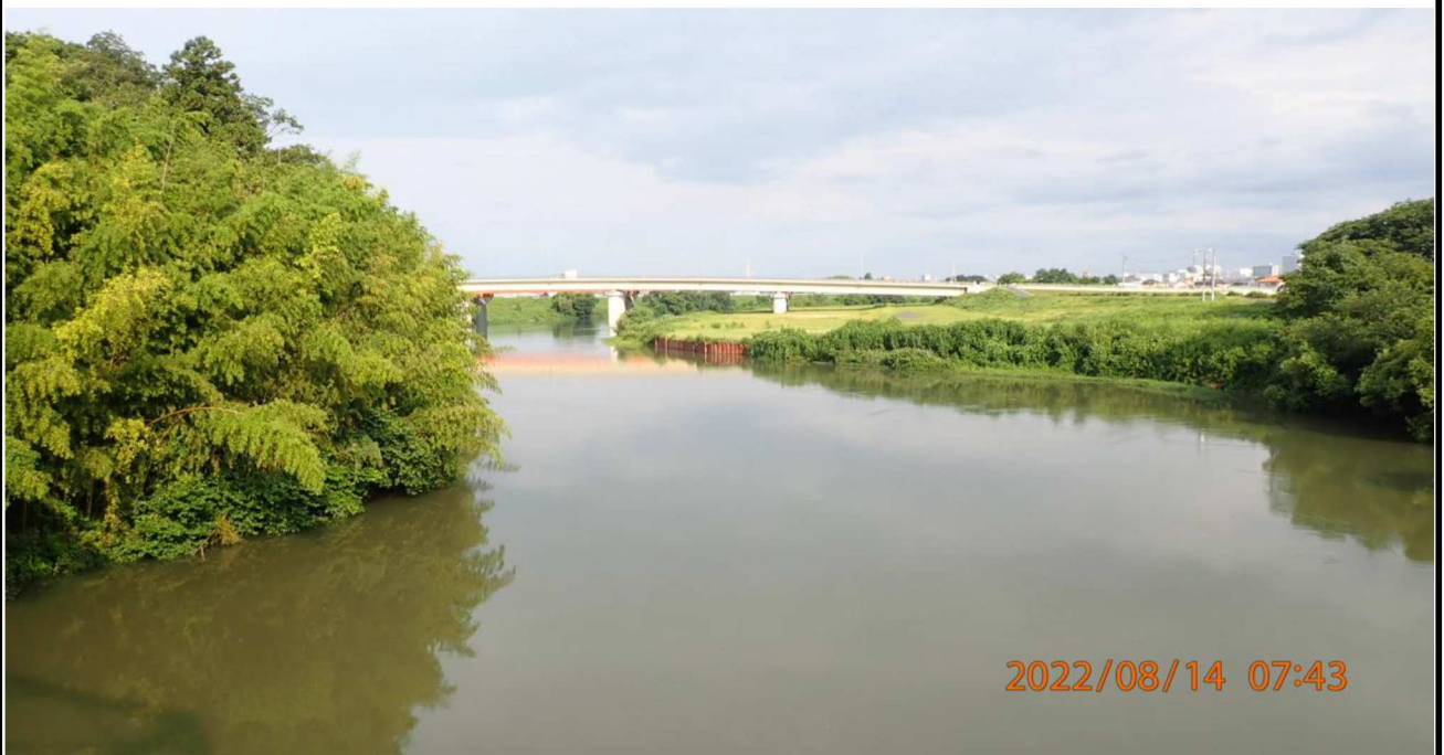
鵜の首橋付近の様子（4） 鵜の首橋より上流を撮影。