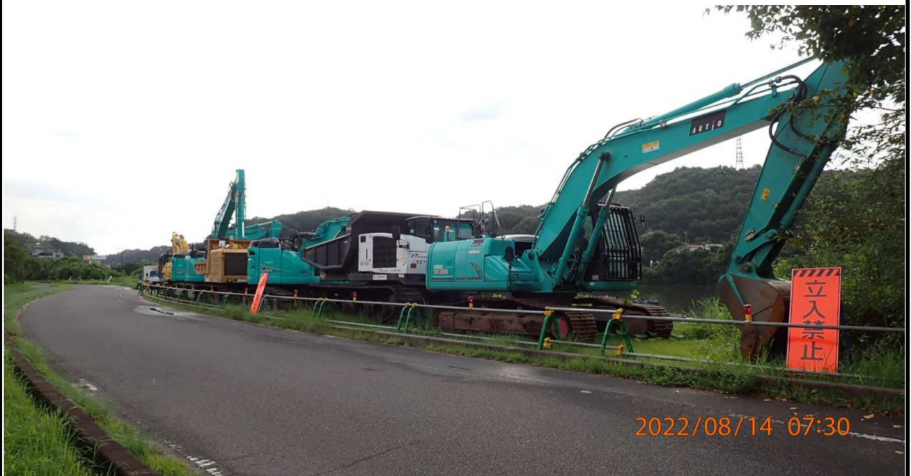
水源緑地付近の様子（4） 多くの重機が待機していた。