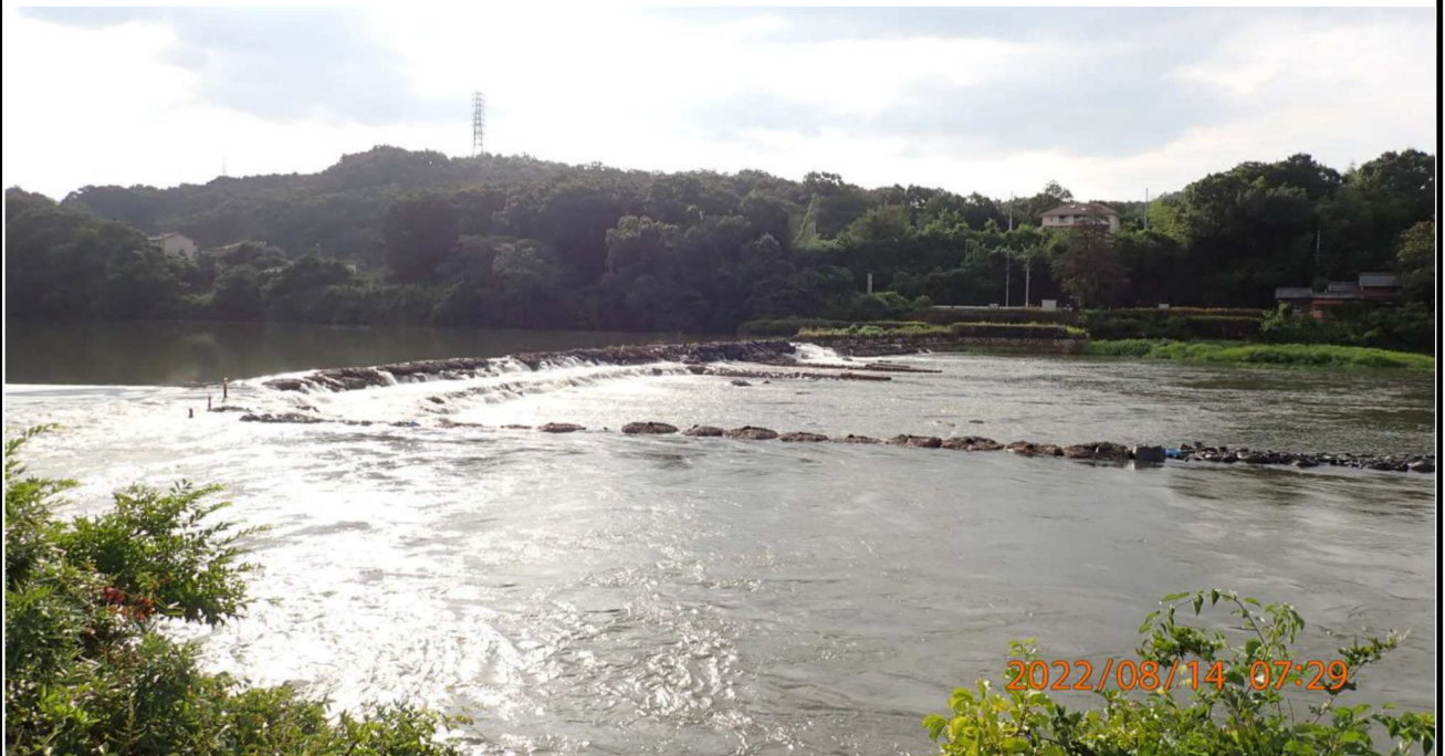
水源緑地付近の様子（2） 土嚢で作られたダムも水があふれている。