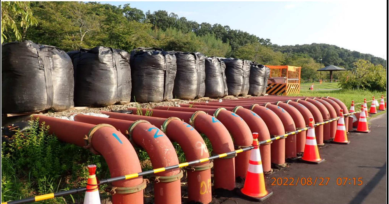
水源公園付近の様子（1）