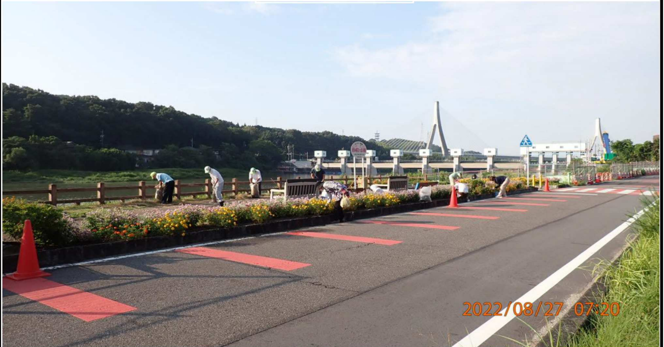
水源公園付近の様子（5）