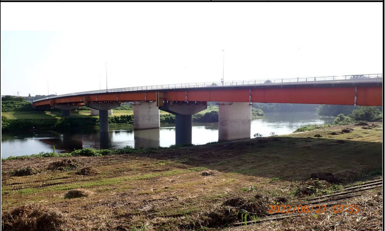
竜宮橋付近の様子（5）