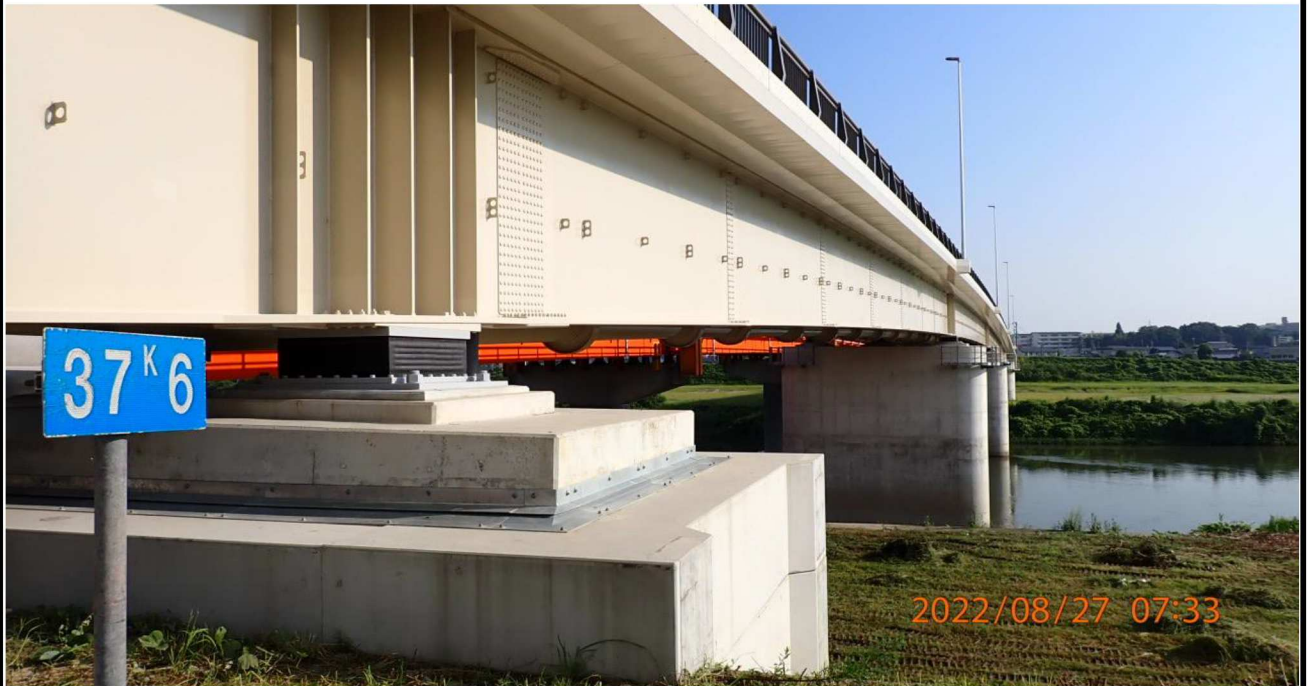
竜宮橋付近の様子（3） こちらは新しい竜宮橋。