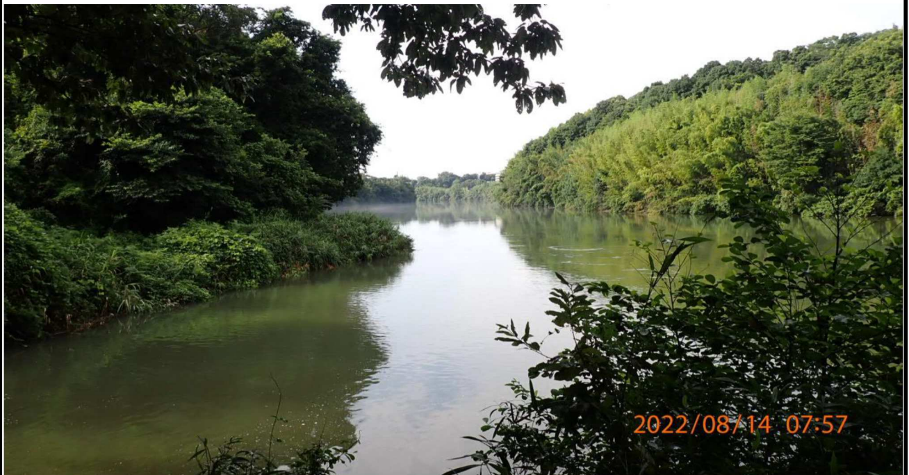
鵜の首橋付近の様子（7） 左岸36.6km付近より上流を撮影。