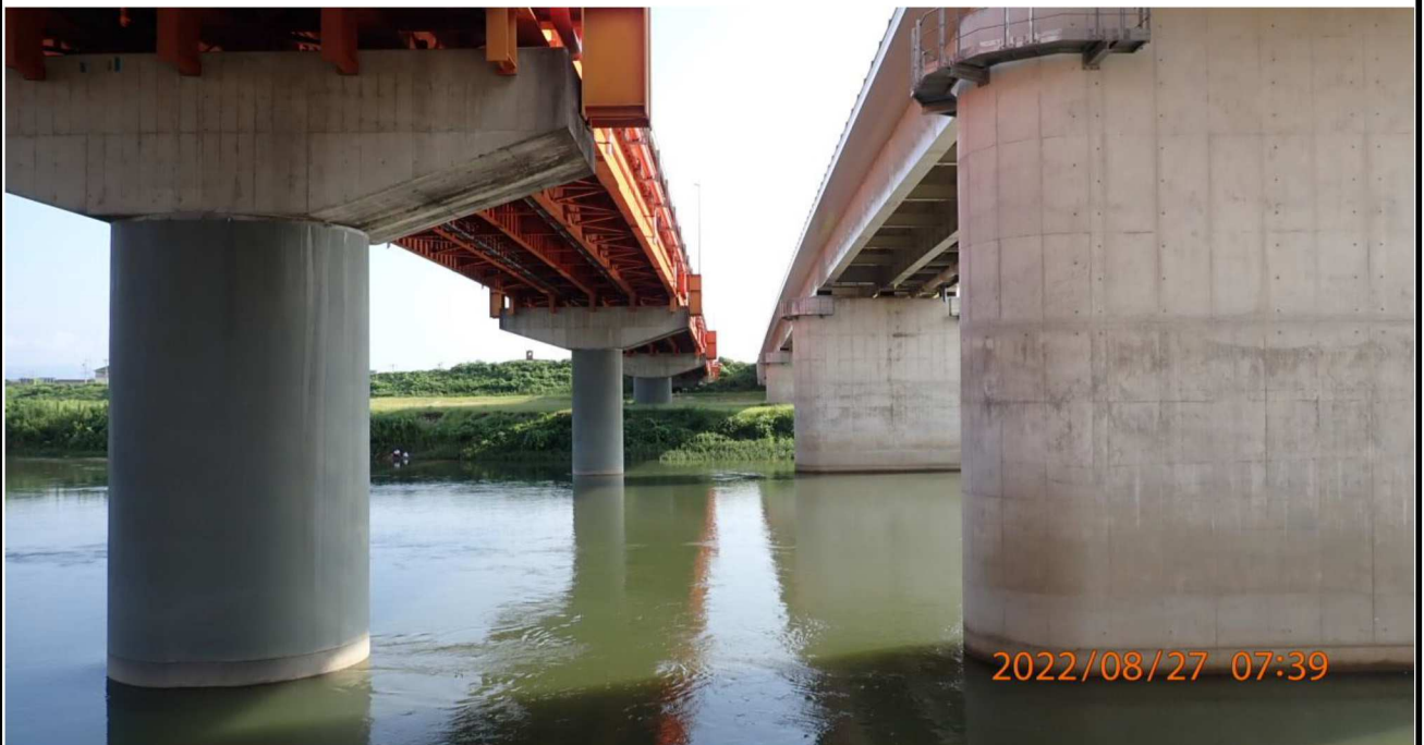
竜宮橋付近の様子（6） 右岸の河川敷から対岸を撮影