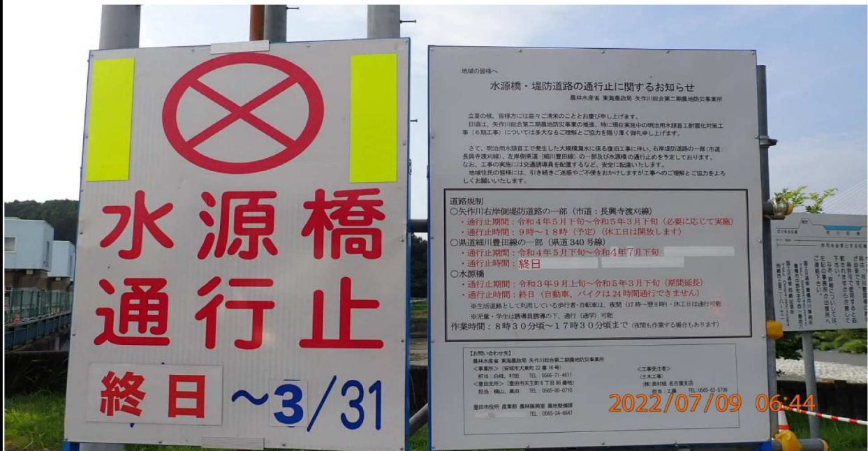
水源橋の様子 (4) 通行止が~3/31日とは？