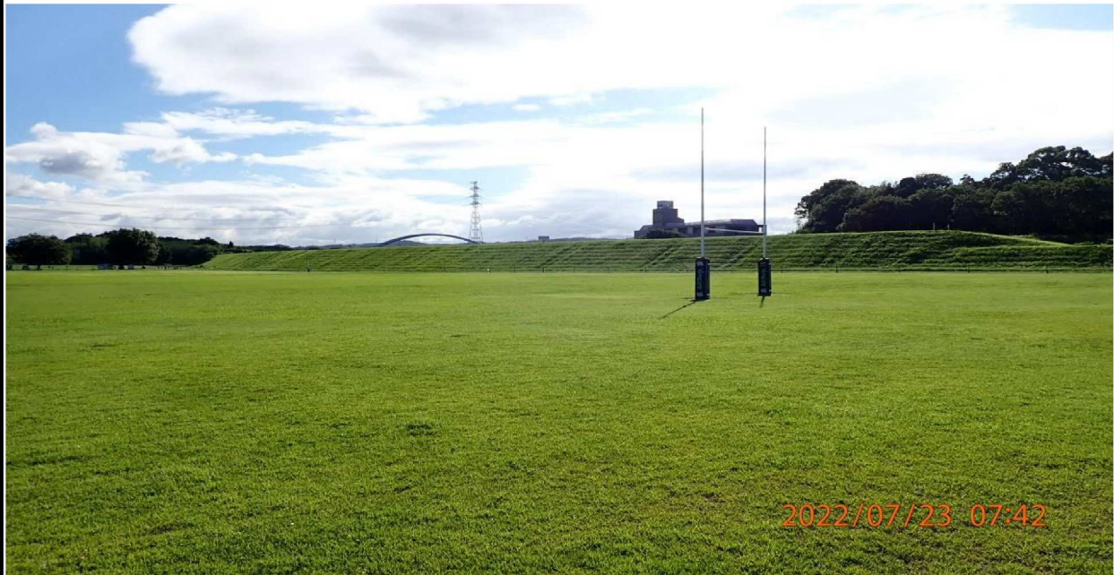
川田公園付近の様子（1） ラグビー場は綺麗に整備されていた。