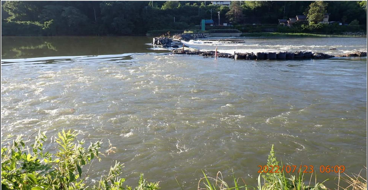
水源公園付近の様子（7） 対岸を撮影。手前（右岸）の水流が多い。