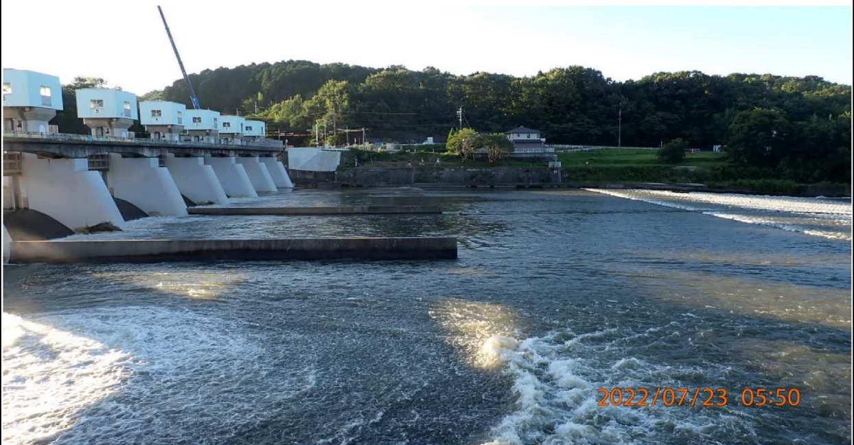
水源橋の様子（2）左岸側は通行止めとなっていた。 水量は豊富に見える。