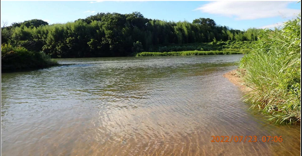
籠川合流付近の様子（3） 雨の影響で水量が多かった。