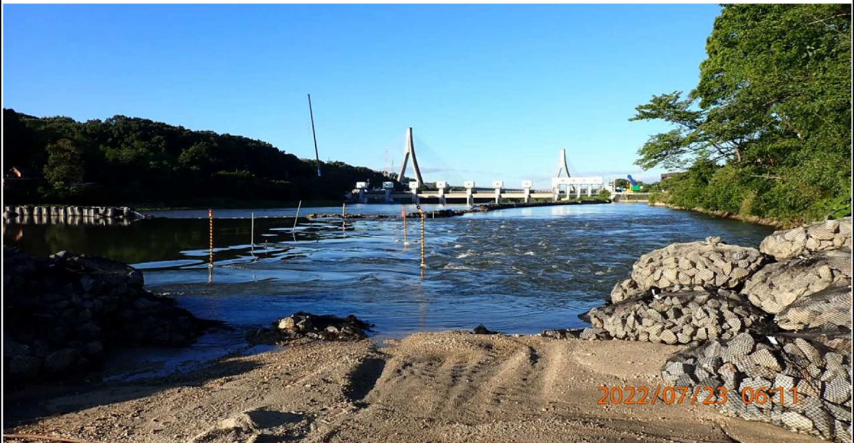
水源公園付近の様子（8） 水路が狭められ右側の水流は多くなってる。