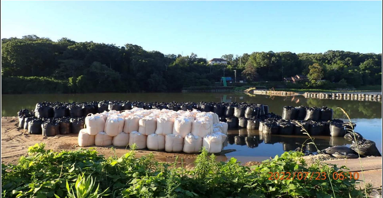
水源公園付近の様子（9） 河川敷に作られた土嚢作業場の様子。