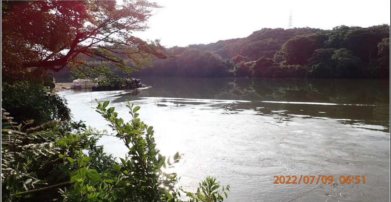
水源公園付近の様子（7） 右岸から上流を撮影。