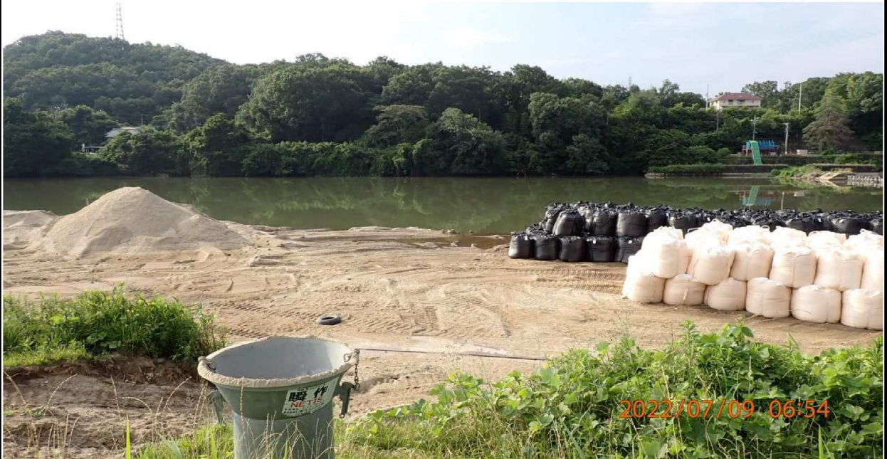
水源緑地付近の様子（9） 水流制限に使用する土嚢の作業場となっている。