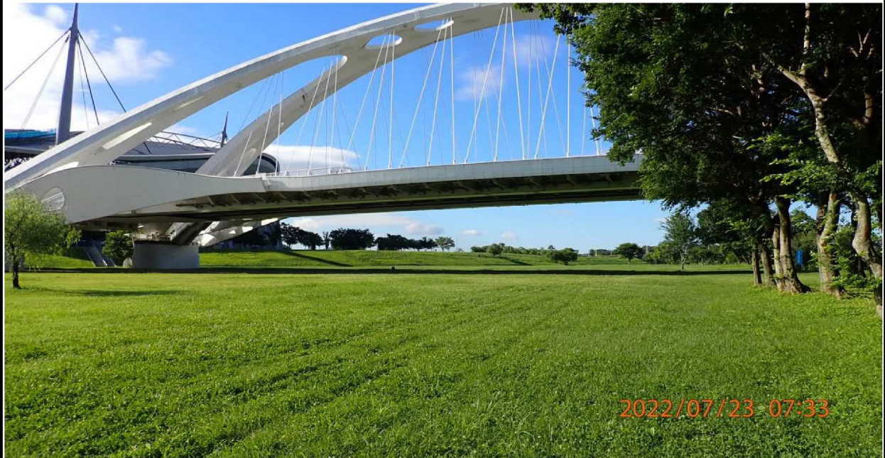
豊田スタジアム付近の様子（1） 左岸より上流側を撮影。芝生が整備されていて心地よく歩けた。