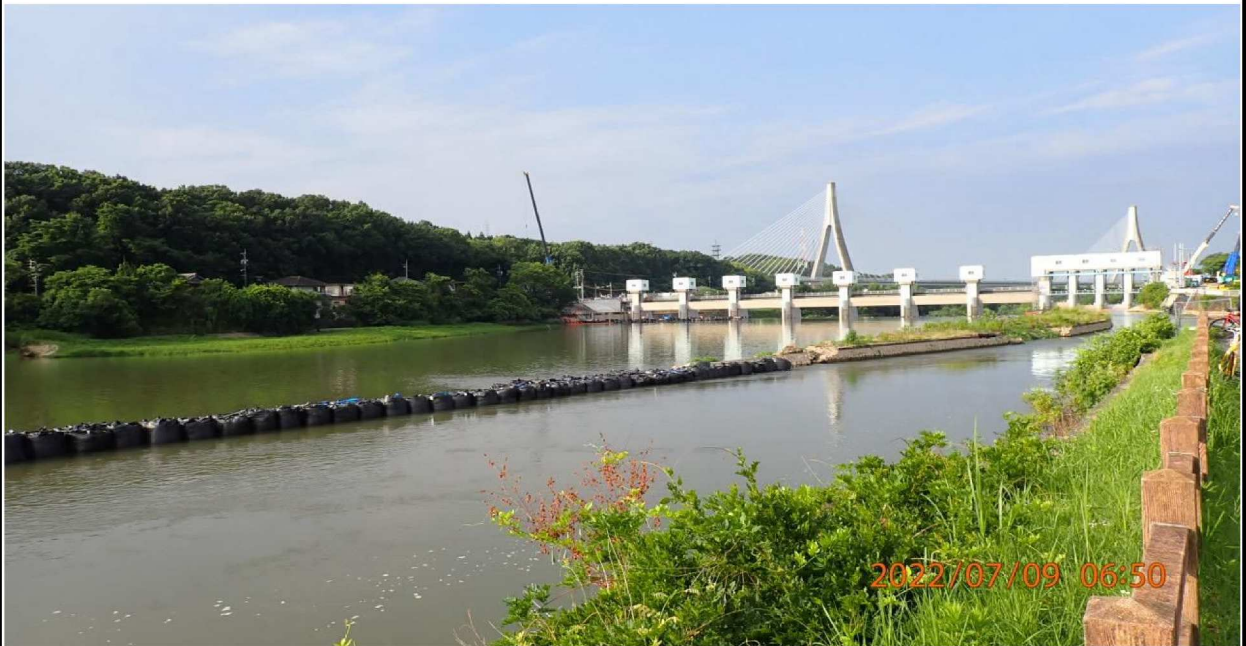
水源公園付近の様子（6）