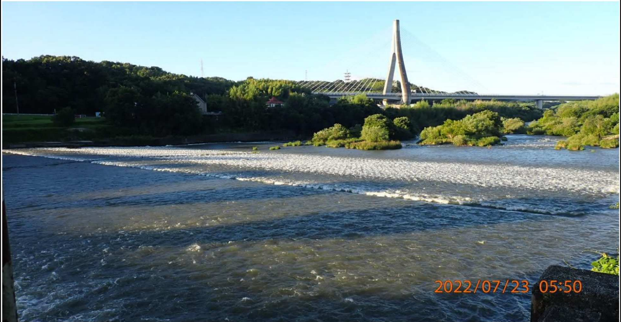
水源橋の様子（1） 右岸より下流を撮影。遠方には東海環状自動車の斜張橋が見える。