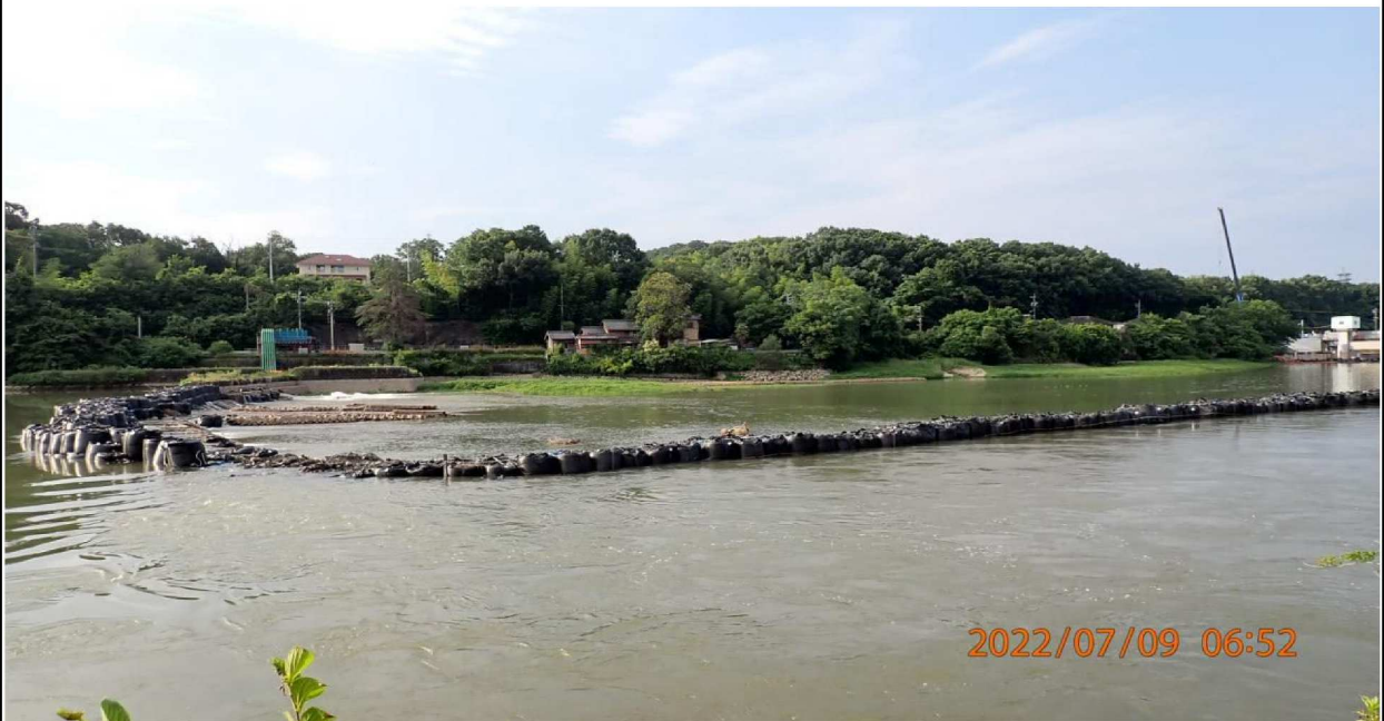
水源公園付近の様子（8） 右岸から下流を撮影。