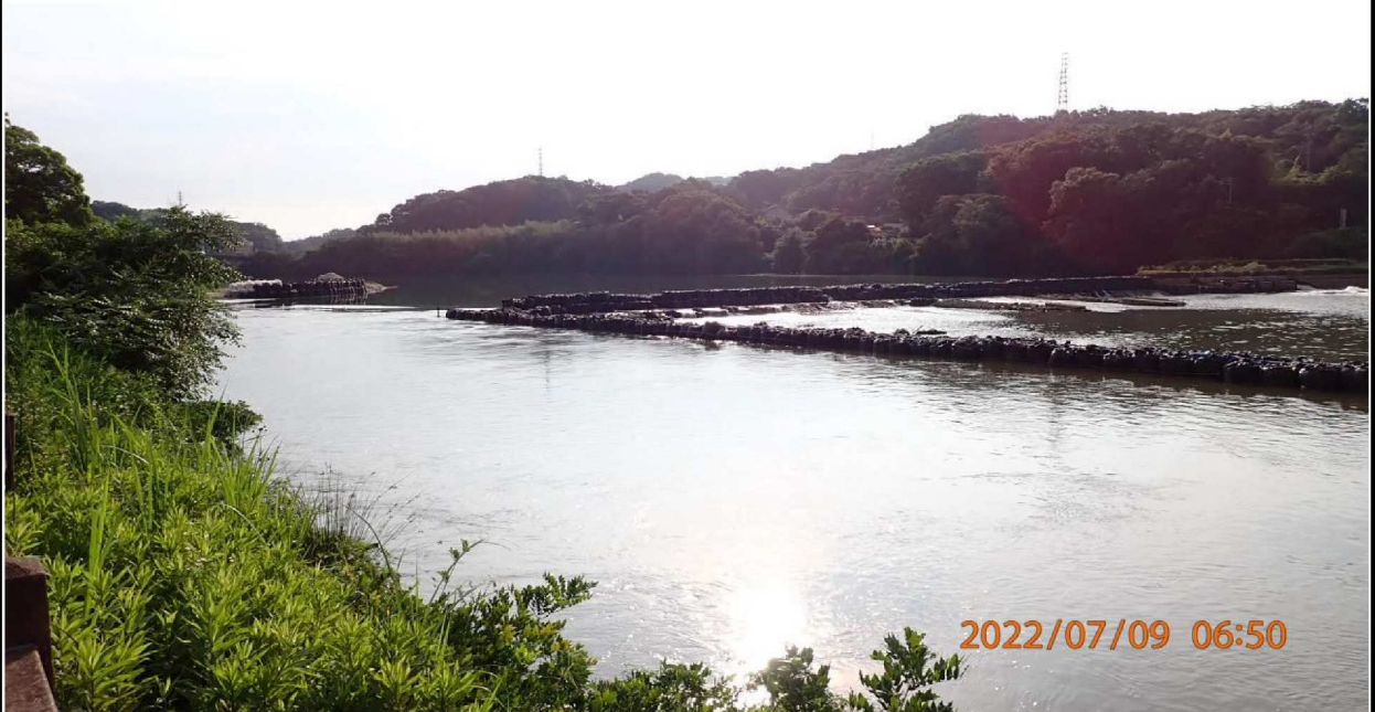
水源公園付近の様子（5） 流れを制御していることが判る。