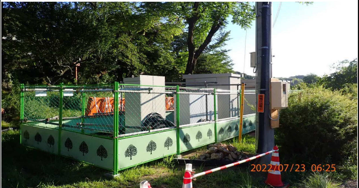
水源公園付近の様子（6） 新たに電柱が設置されて電力が確保されていた。