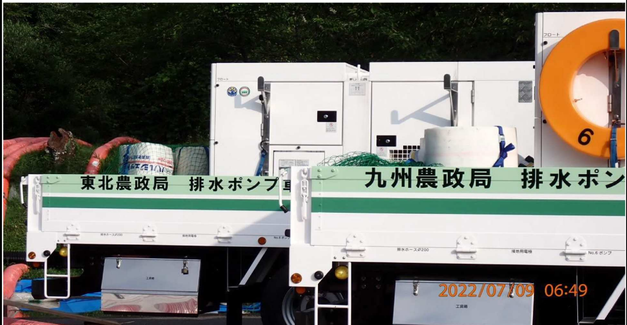
水源緑地付近の様子（4） 全国各地から支援が来ていた。