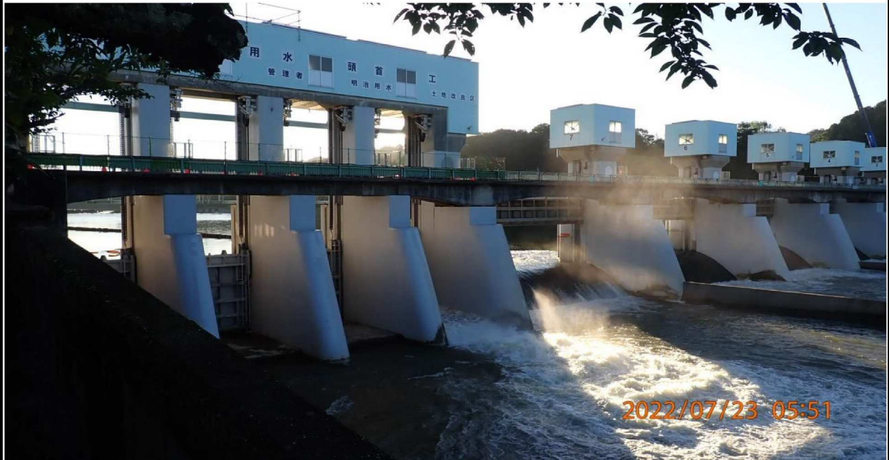
水源橋の様子（3） 激しい水流により霧が見える。