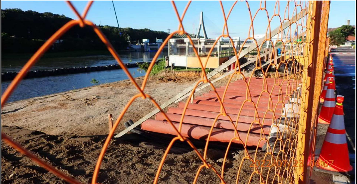
水源公園付近の様子（5） こちらではホースではなく鋼管による水路の設置が行われていた。