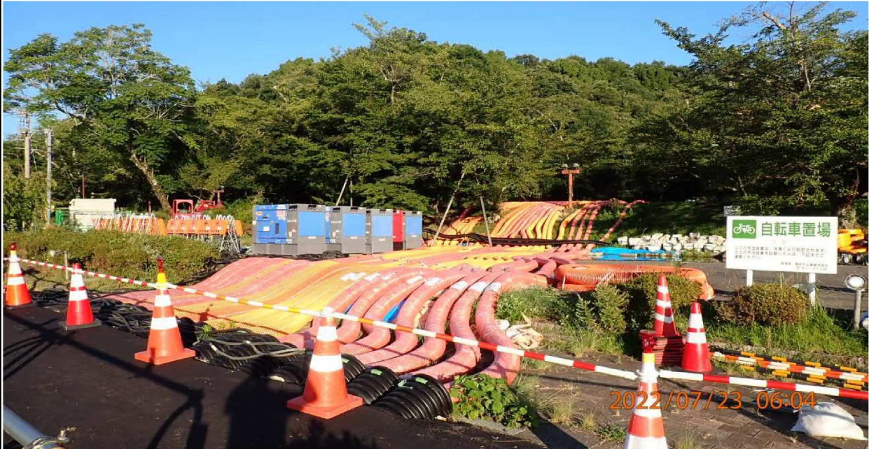
水源公園付近の様子（3） 月初は白いホースがオレンジの蛇腹ホースに替わっていた。