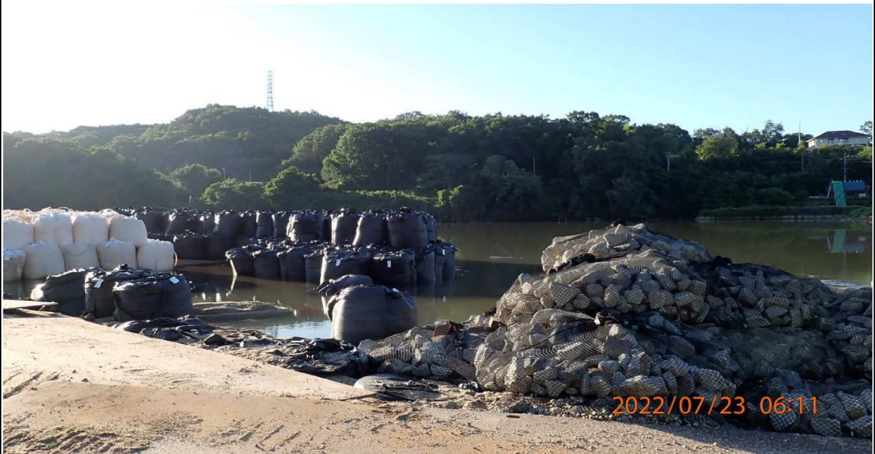
水源公園付近の様子（10） 土嚢と岩の袋が用意されている。