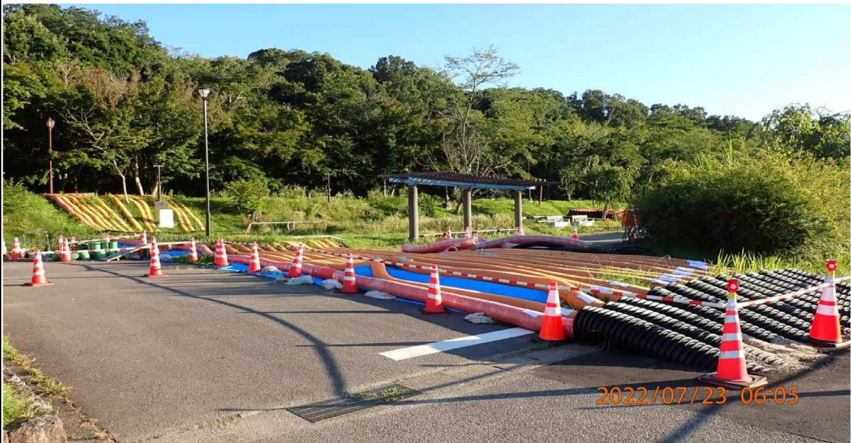
水源公園付近の様子（4） 近くには電柱が新たに設置されて