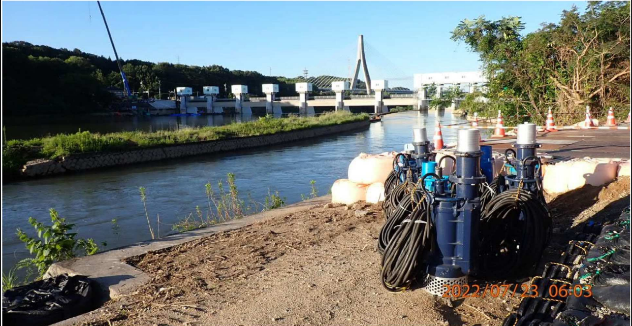
水源公園付近の様子（1） 工事の準備が行われていた。