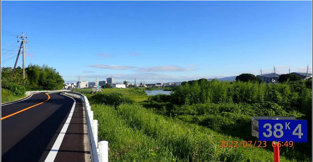
右岸38.4km付近より上流を撮影。 この辺りの堤防道路は新しく舗装されていた。