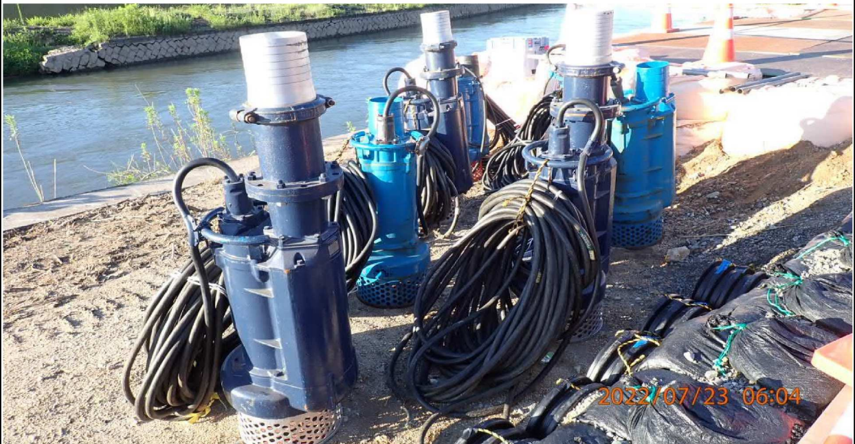
水源公園付近の様子（2） 大きなポンプが用意されていた。