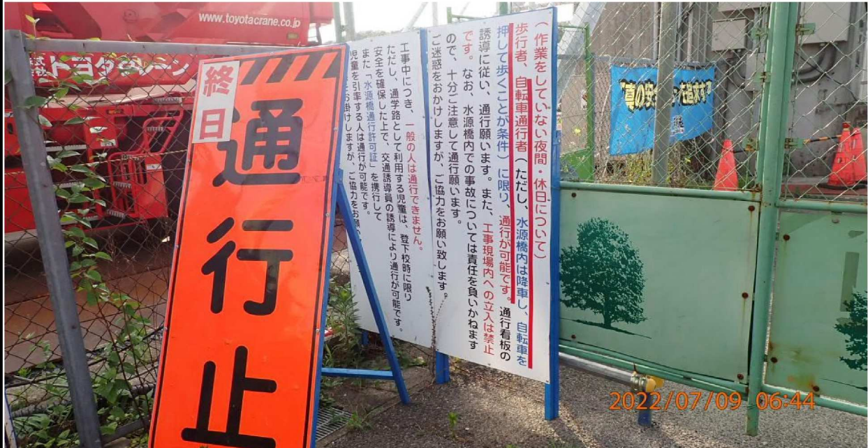
水源橋の様子 (3) 作業中以外は歩行者や自転車は通行できるようだ。