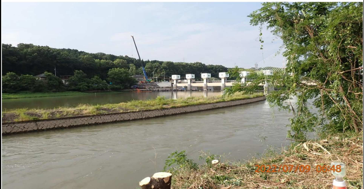
水源緑地付近の様子（2） 川の流りは制限されているようだ。