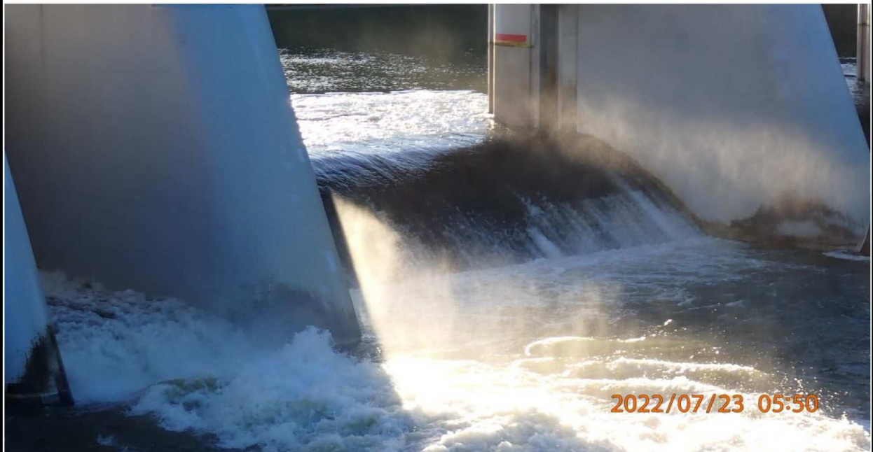
水源橋の様子（4） 勢いよく放水が行われている。