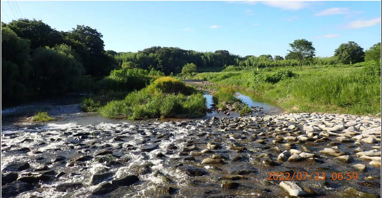
籠川合流付近の様子（1） 籠川から矢作川への合流を撮影。