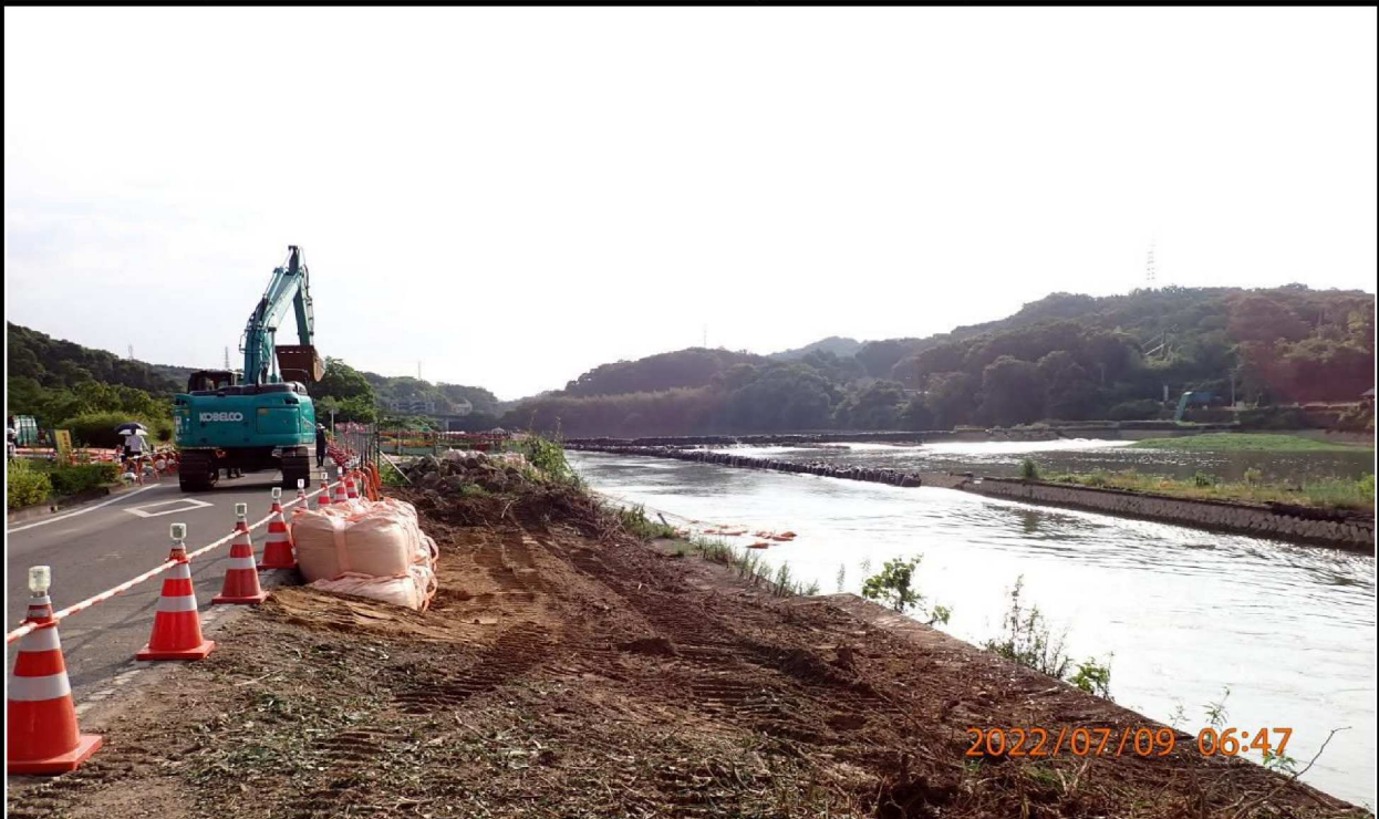
水源緑地付近の様子（1） この時間は重機により通行制限されていた。