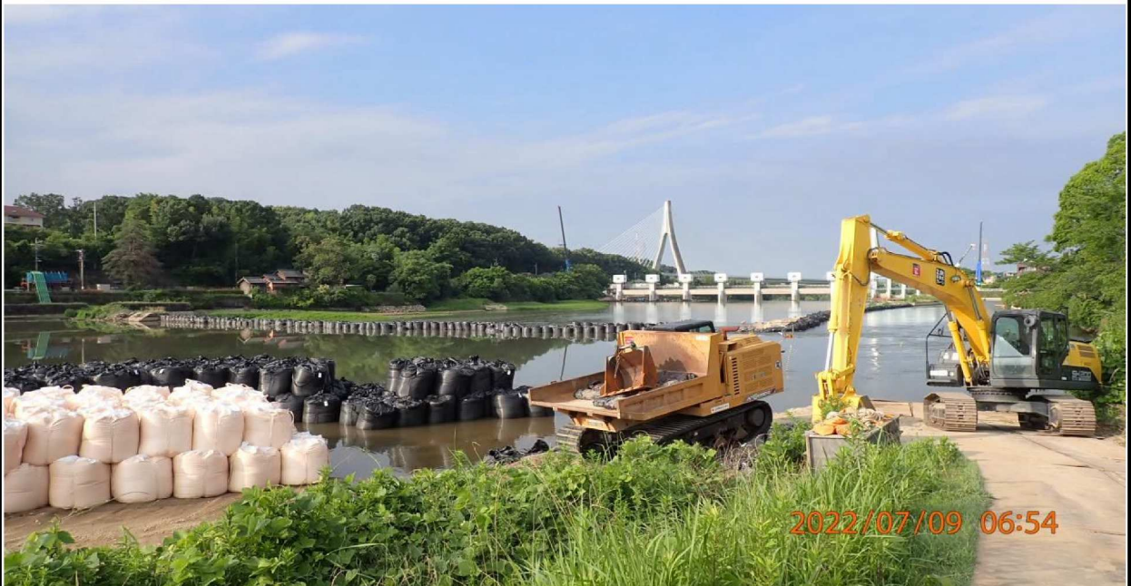
水源緑地付近の様子（10） 以前はラジコンボートやSUPなど、水辺で楽しむ人達が多く見られていた。