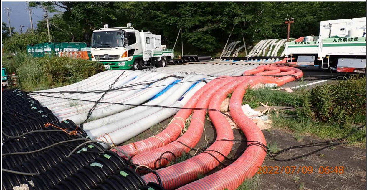
水源緑地付近の様子（3） 矢作川から明治用水へ多くのホースで汲み上げが行われている。