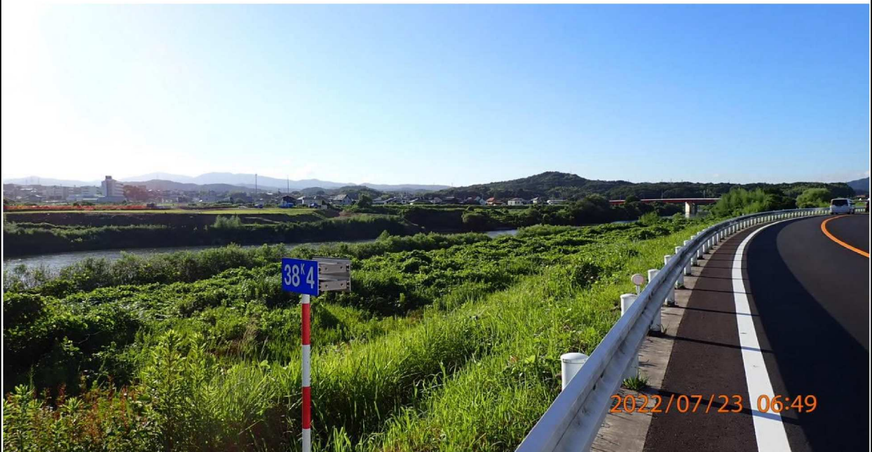
右岸38.4km付近より下流を撮影。