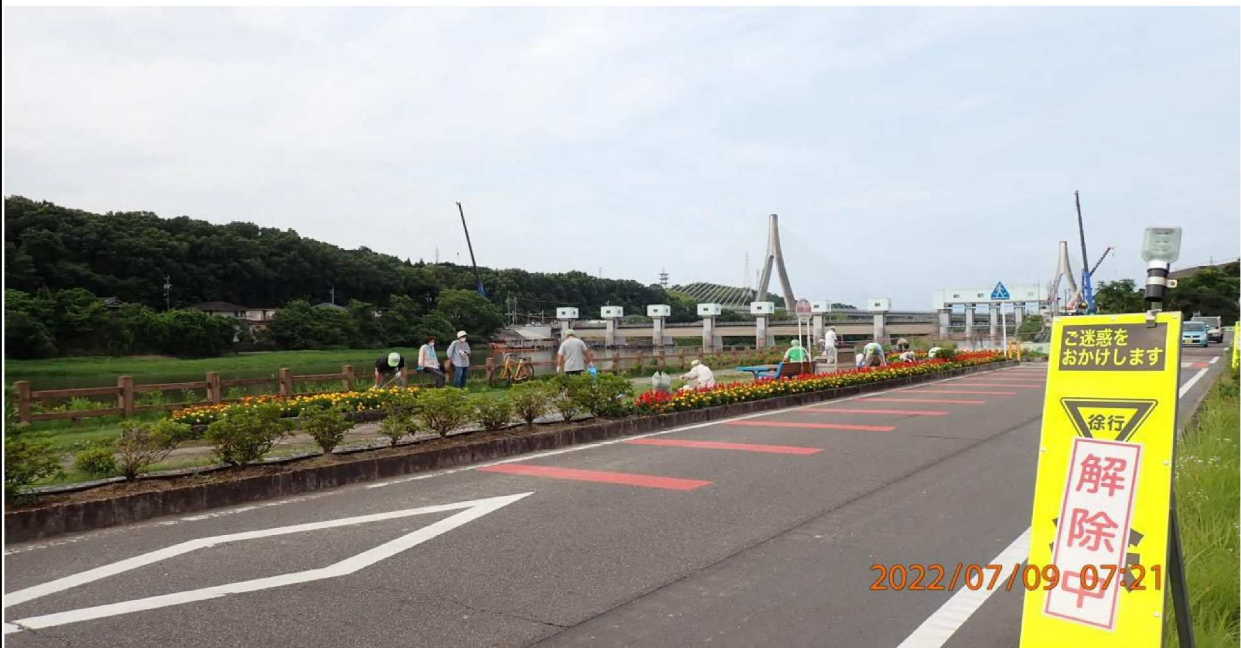
水源公園付近の様子（1 2）