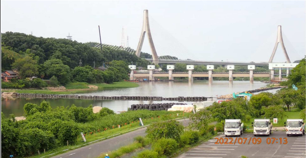
水源公園付近の様子（1 1） 山室橋右岸から水源橋を撮影。多くの土嚢で川が堰き止められている。