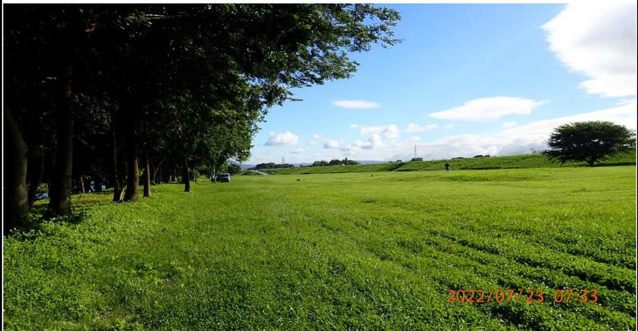
豊田スタジアム付近の様子（2） 左岸より上流側を撮影。晴れた青空も爽快であった。