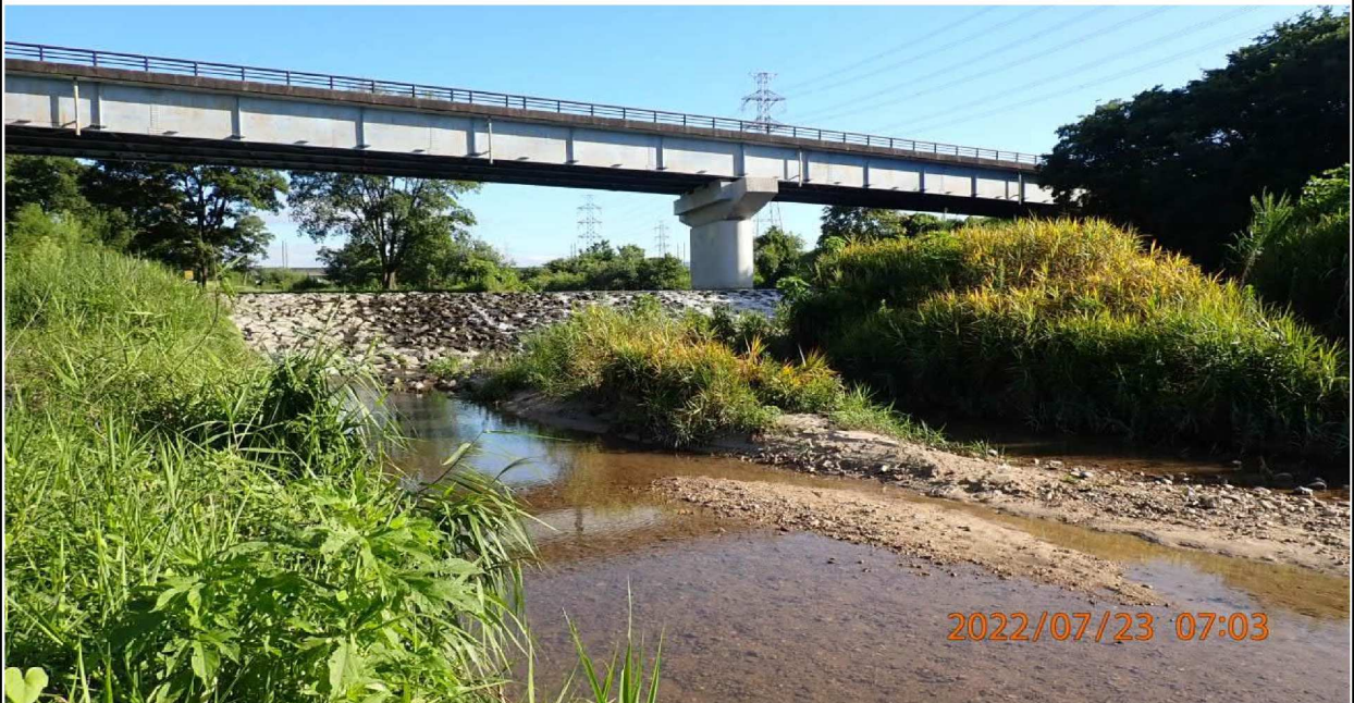
籠川合流付近の様子（2） 国道153（荒井橋）が見える。