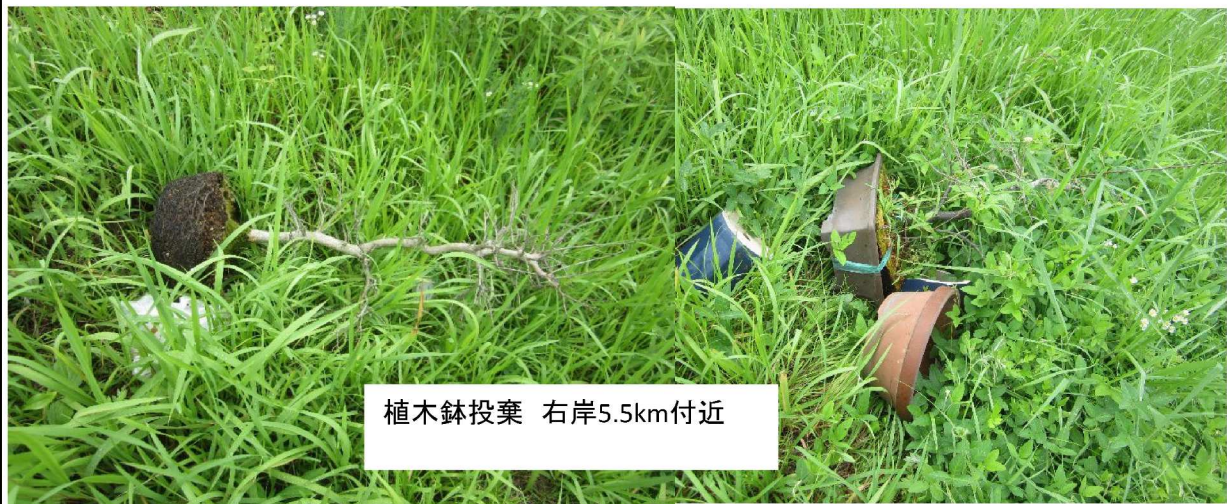
植木鉢投棄 右岸5.5km付近