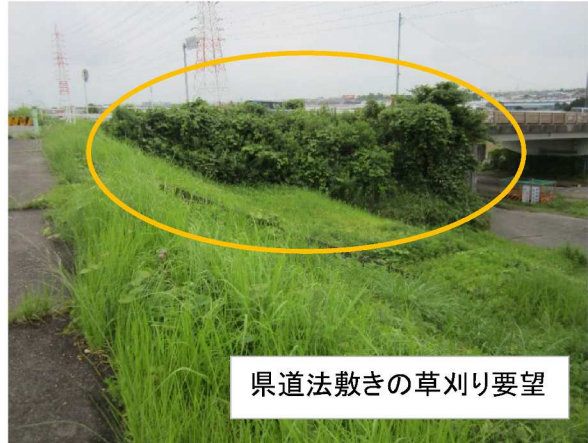
県道法敷きの草刈り要望