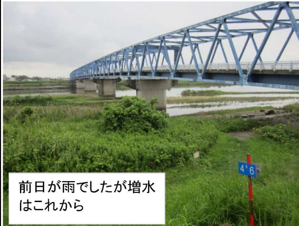
前日が雨でしたが増水はこれから