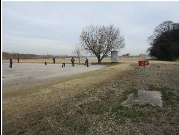
左岸5.0 km上流方向高水敷撮影