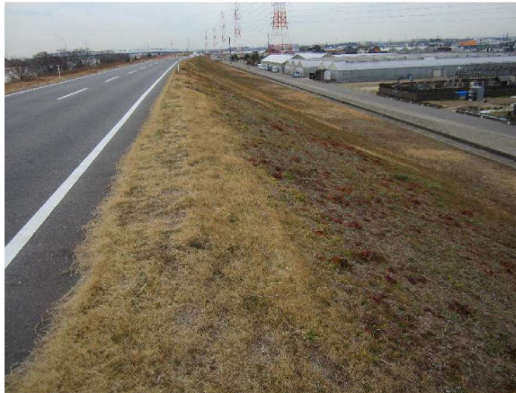
右岸5.6 km下流方向裏のり撮影