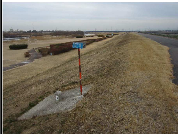
左岸5.8 km上流方向表のり撮影