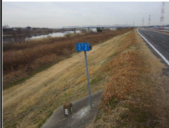
右岸5.2 km下流方向表のり撮影