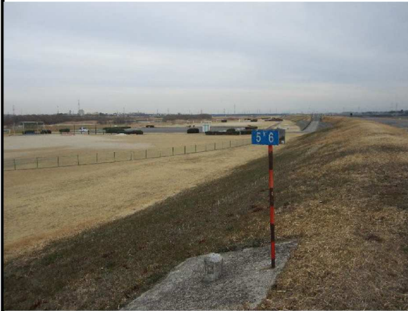
左岸5.6 km上流方向表のり撮影