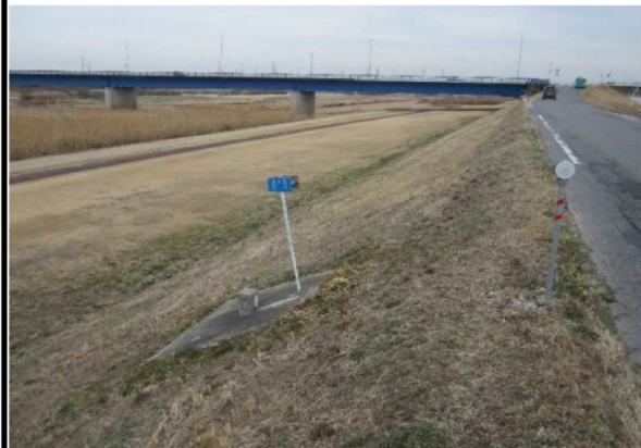
左岸6.8km上流方向表のり撮影