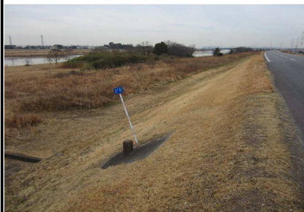
右岸5.8 km下流方向表のり撮影