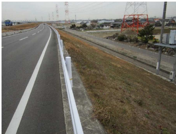
右岸5.4 km下流方向裏のり撮影