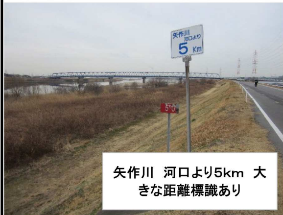
右岸5.0 km下流方向表のり撮影