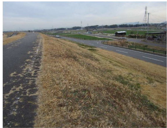
左岸5.6km上流方向裏のり