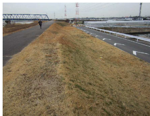
右岸4.8 km下流方向裏のり撮影