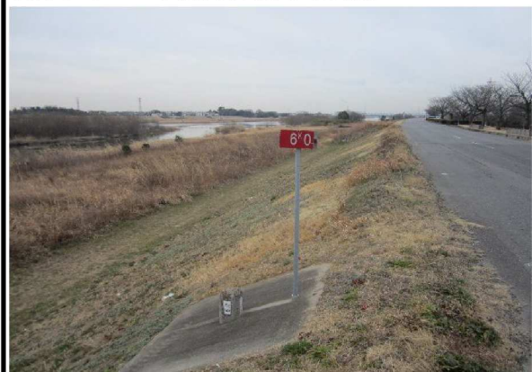
右岸6.0 km下流方向表のり撮影