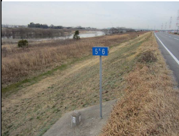
右岸5.6 km下流方向表のり撮影