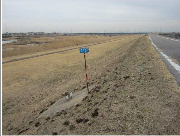
左岸6.2 km上流方向表のり撮影