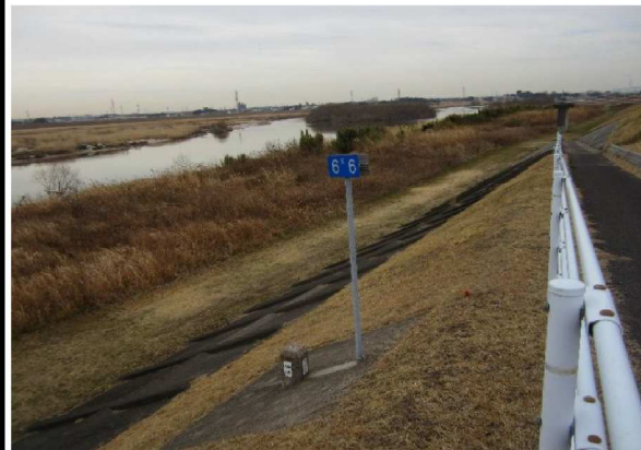
右岸6.6 km下流方向表のり撮影