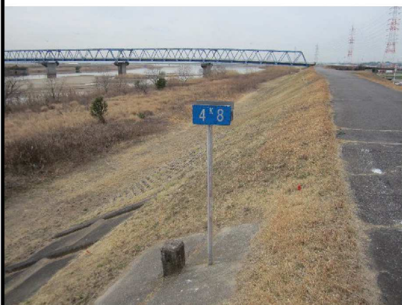
右岸4.8 km下流方向表のり撮影