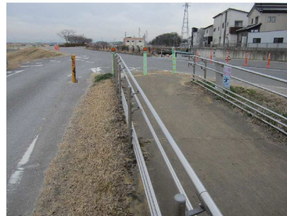
左岸5.2km上流方向裏のり