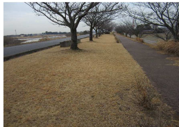
右岸6.0 km下流方向裏のり撮影