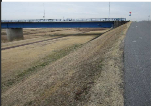
左岸6.9km付近上流方向表のり撮影