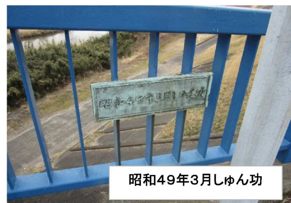
上塚橋の下流右岸側の橋名版

毎年砂が堆積するので中州が大きくなっている。大洪水が来る前に計画的な対策をしてほしい。