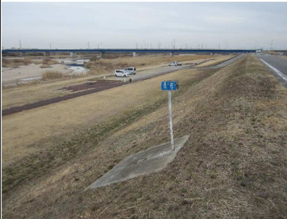
左岸6.6 km上流方向表のり撮影