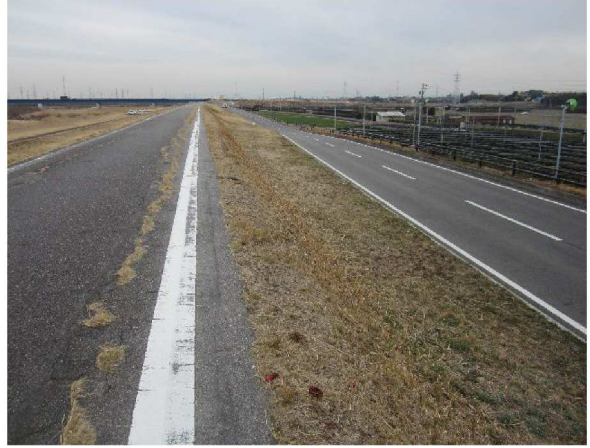
左岸6.4km上流方向裏のり