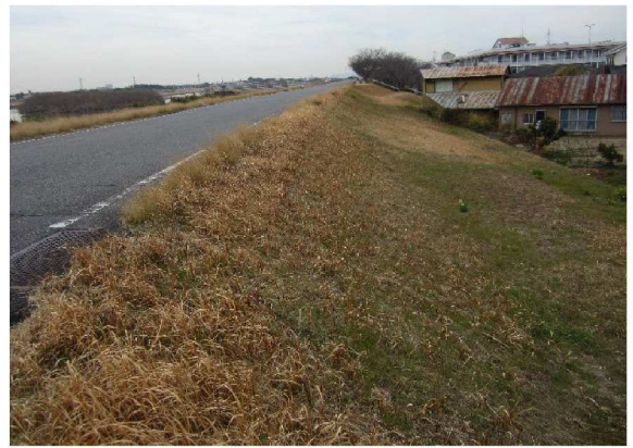
右岸6.6 km下流方向裏のり撮影