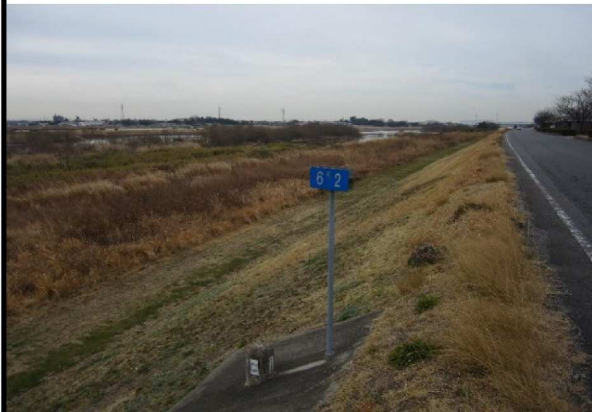
右岸6.2 km下流方向表のり撮影