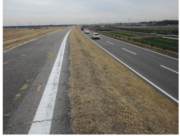
左岸6.2km上流方向裏のり