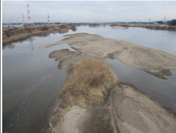
中畑橋の中央から川上を撮影