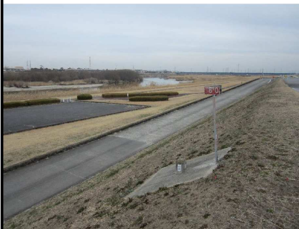
左岸6.0 km上流方向表のり撮影