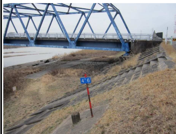
右岸4.6 km下流方向表のり撮影