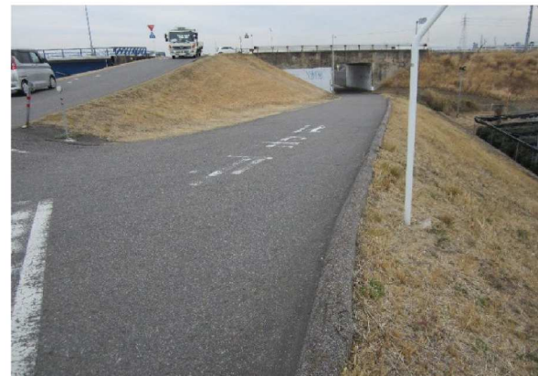
左岸6.9km付近上流方向裏のり