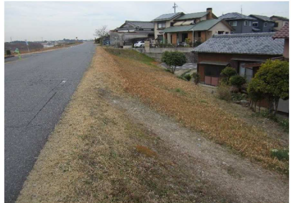
右岸6.8 km下流方向裏のり撮影