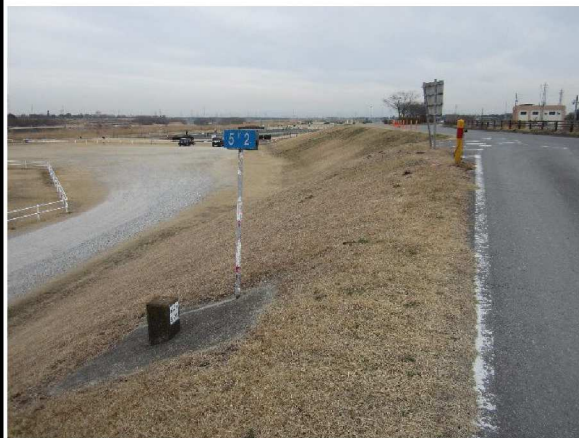
左岸5.2 km上流方向表のり撮影