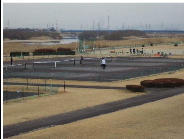
左岸5.4 km付近上流方向高水敷き撮影