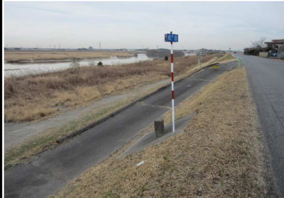
右岸6.8 km下流方向表のり撮影