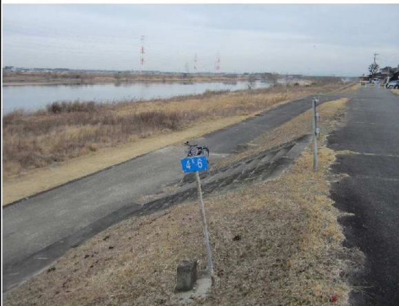
左岸4.6 km上流方向表のり撮影