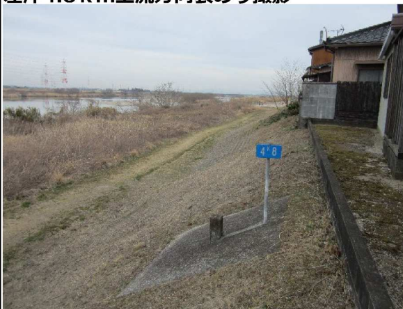
左岸4.8 km上流方向表のり撮影