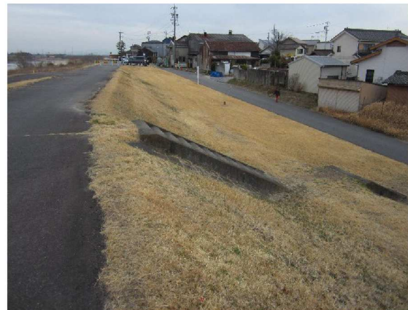
左岸4.6km上流方向裏のり撮影