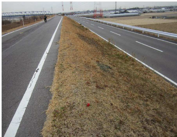
右岸5.0 km下流方向裏のり撮影