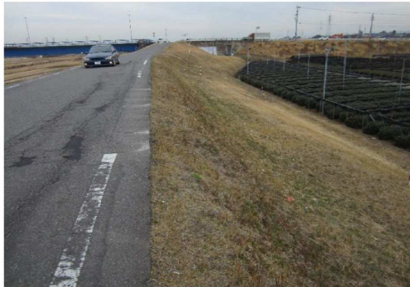
左岸6.8km上流方向裏のり