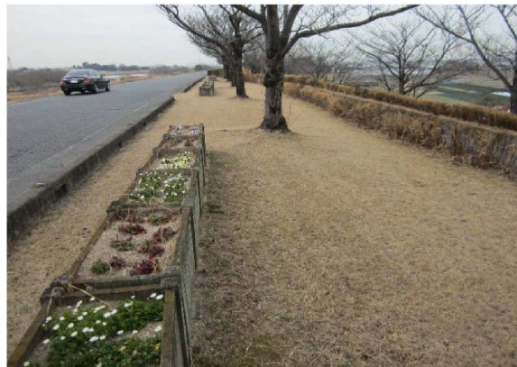
右岸6.2 km下流方向裏のり撮影