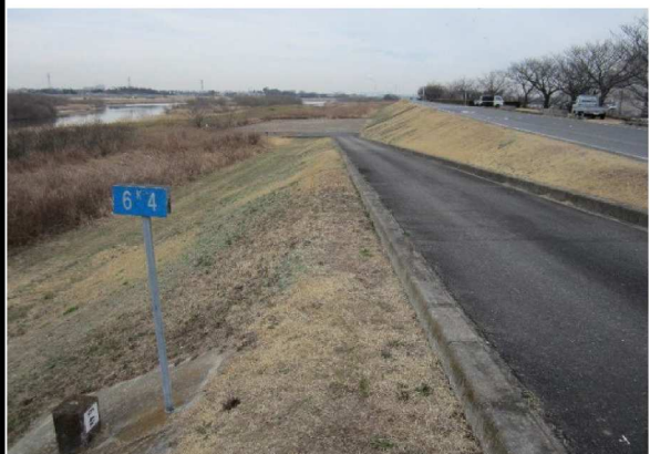
右岸6.4 km下流方向表のり撮影