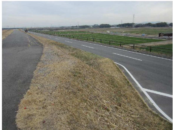
左岸5.8km上流方向裏のり