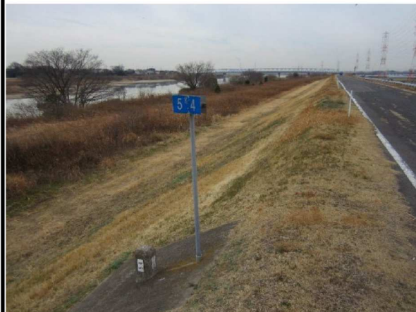
右岸5.4 km下流方向表のり撮影