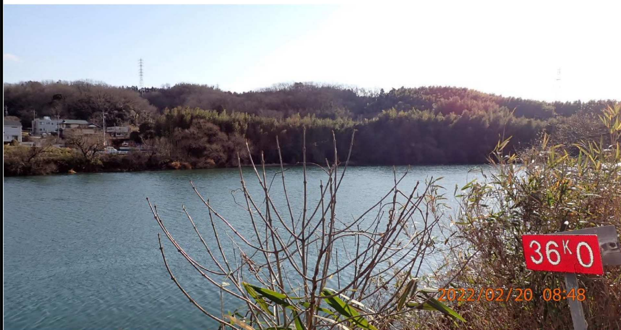
右岸36.0km付近より下流の様子。