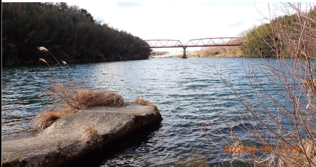
左岸37.2km付近より上流の様子。 遠方には鴉の首橋が見える。