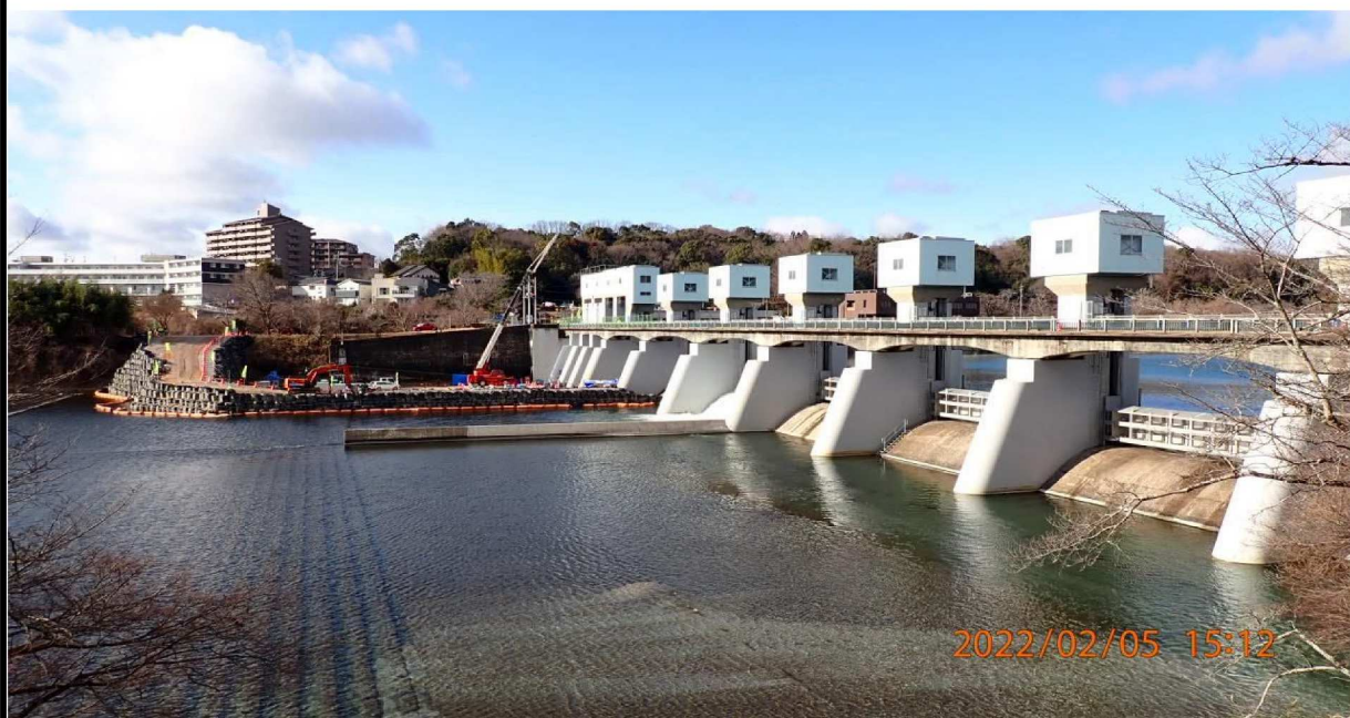
左岸からみた工事の様子。