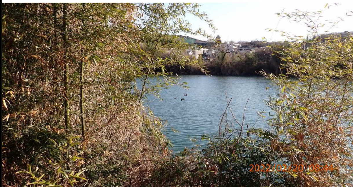
右岸36.4 km付近より上流の様子。