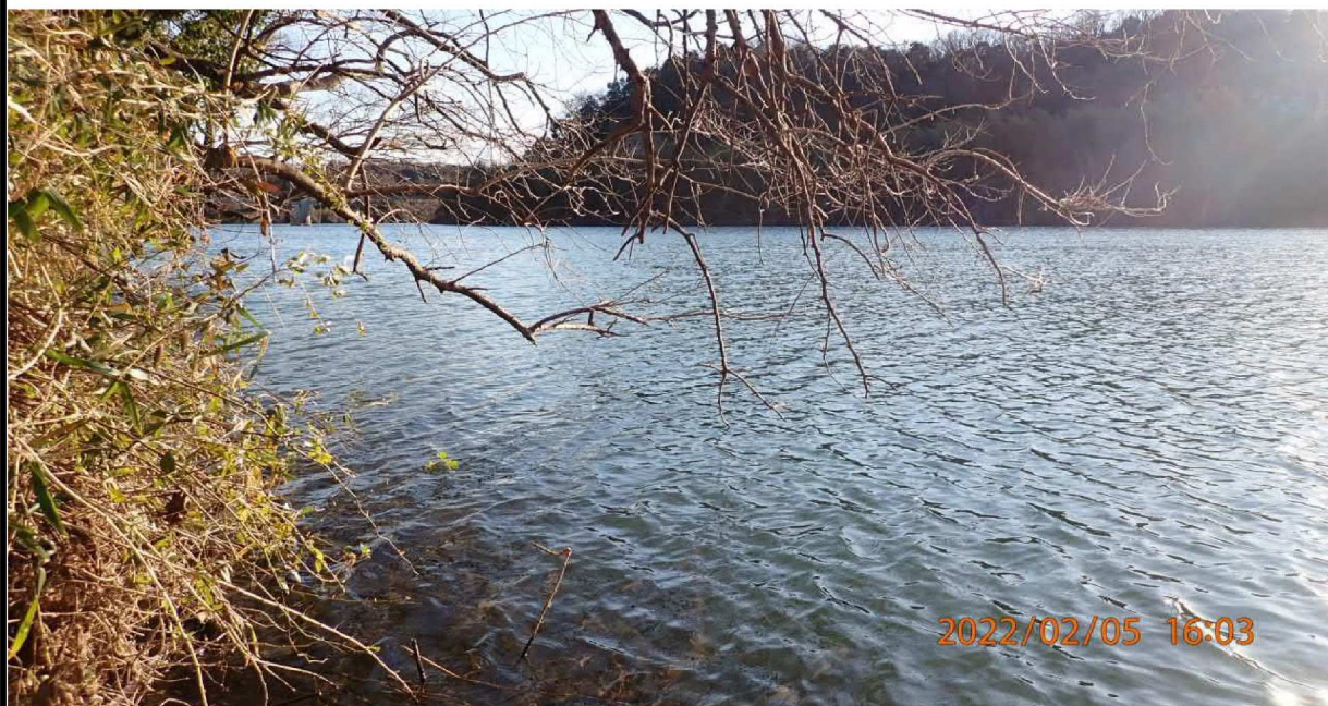
左岸36.4km付近より下流の様子。