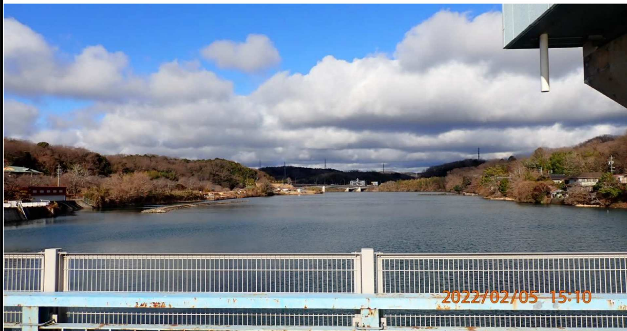
水源橋より上流を撮影。