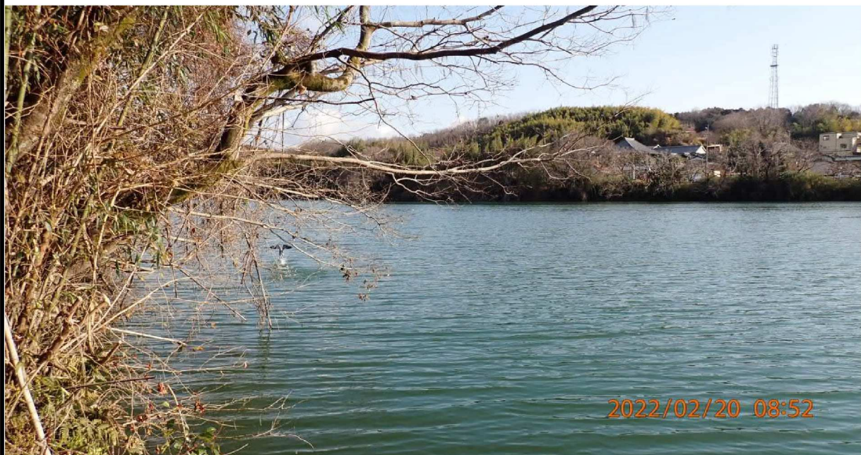
右岸36.4km付近より上流の様子。 飛び立つ水鳥が映った。