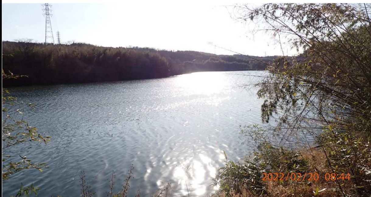
右岸36.4km付近より下流の様子。