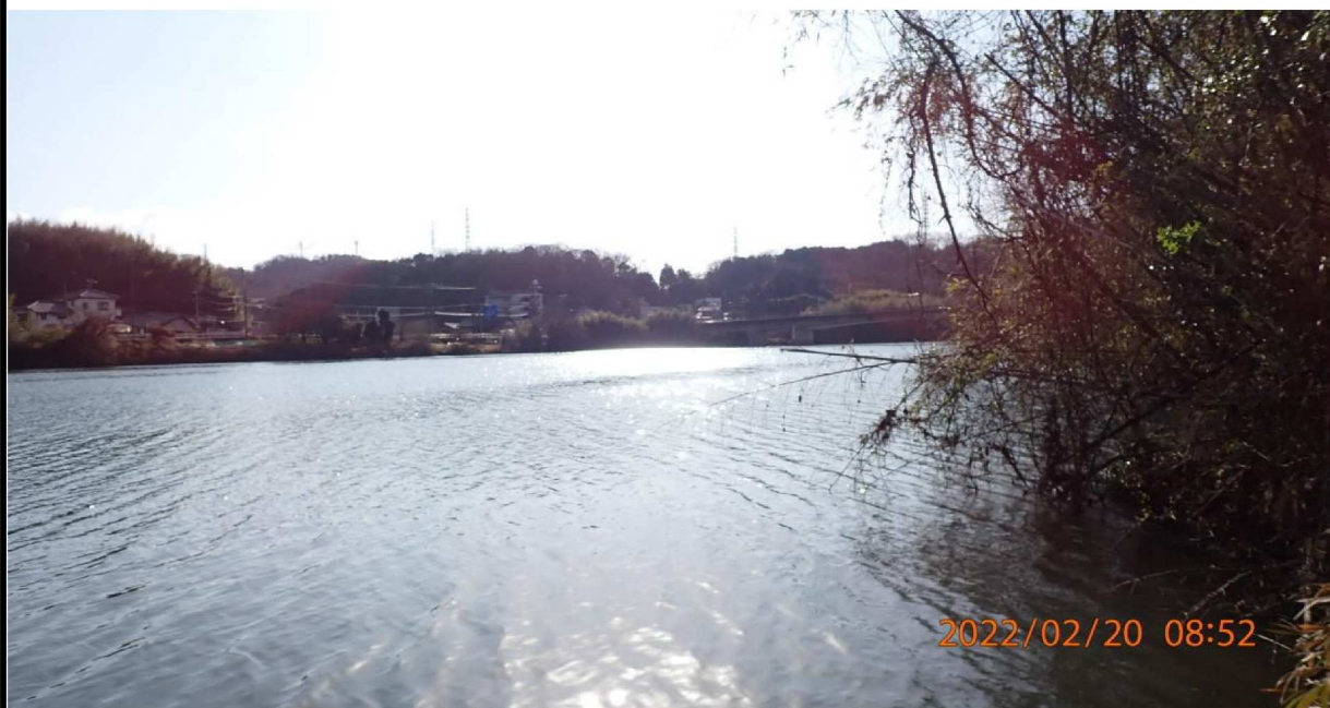
右岸36.4km付近より下流の様子。