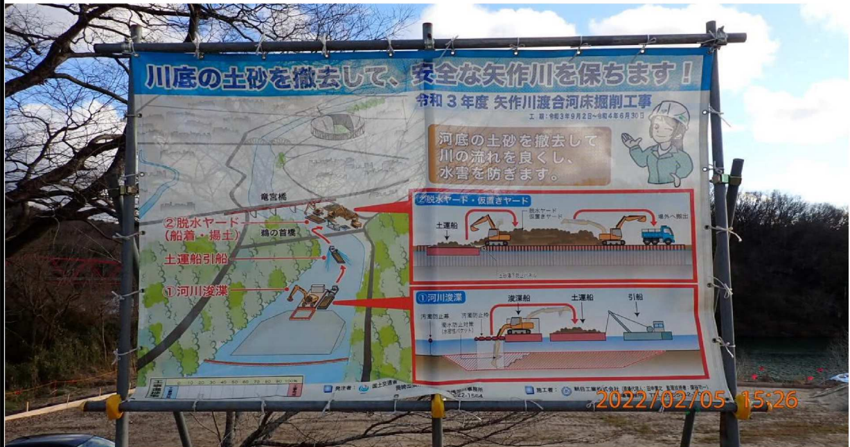
左岸37.5km付近の工事看板。