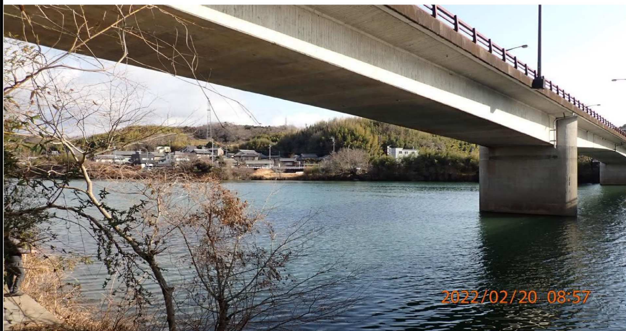
右岸36.4km付近 山室橋より上流を撮影。