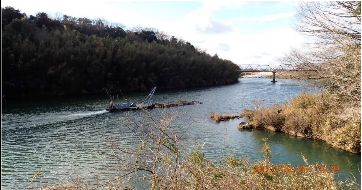
左岸37.2km付近 流入する用水より上流の様子。