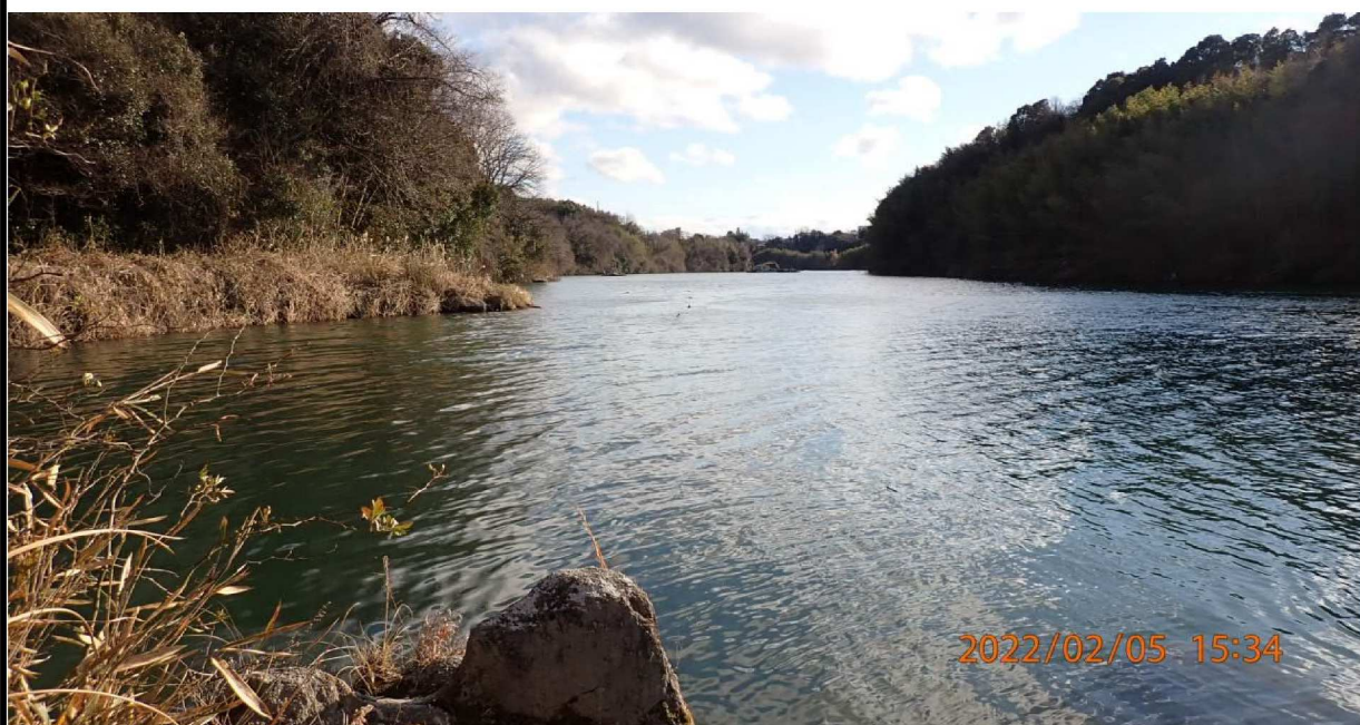
左岸37.2km付近より下流の様子。