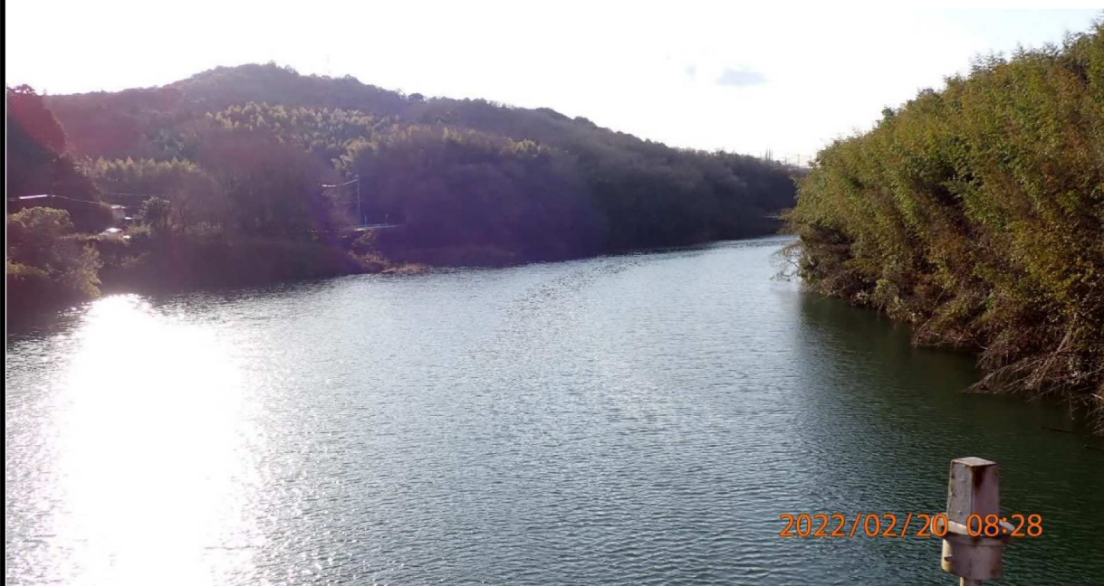
鵜の首橋から上流を撮影。竜宮橋と工事の様子が見える。