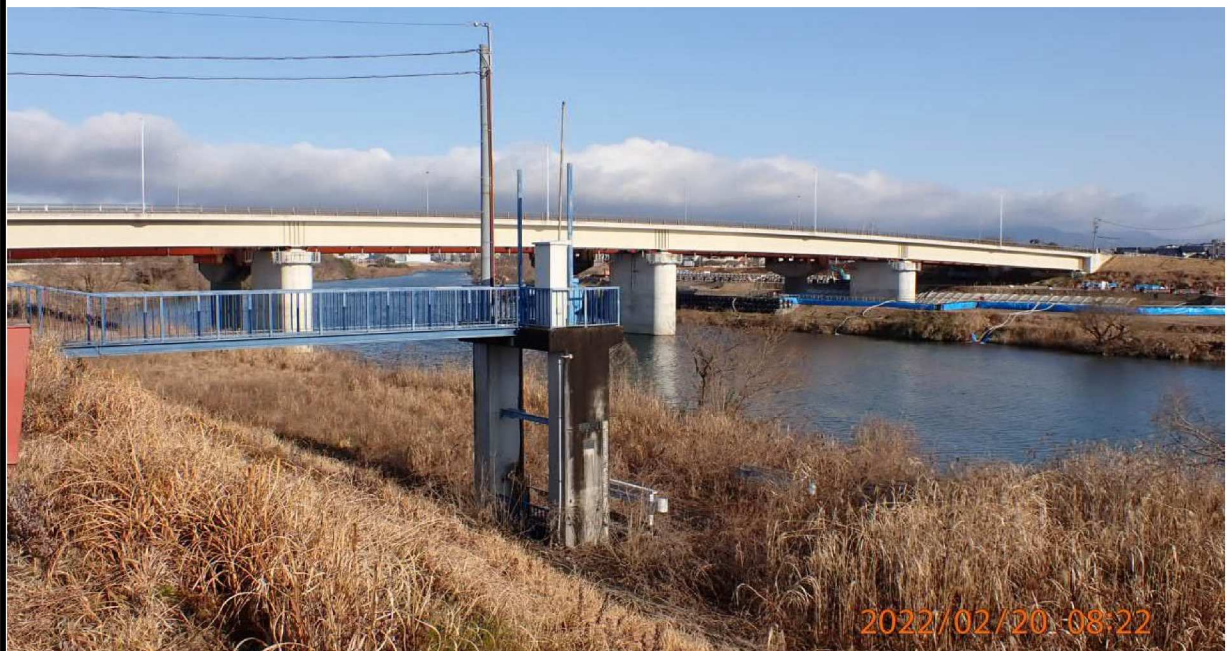
右岸37.5km付近より上流の様子。新しい竜宮橋が見える。