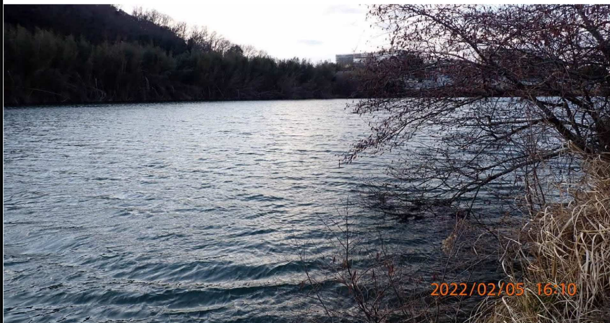
左岸36.3km付近より上流の様子。