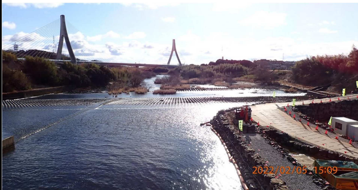
水源橋より下流を撮影。