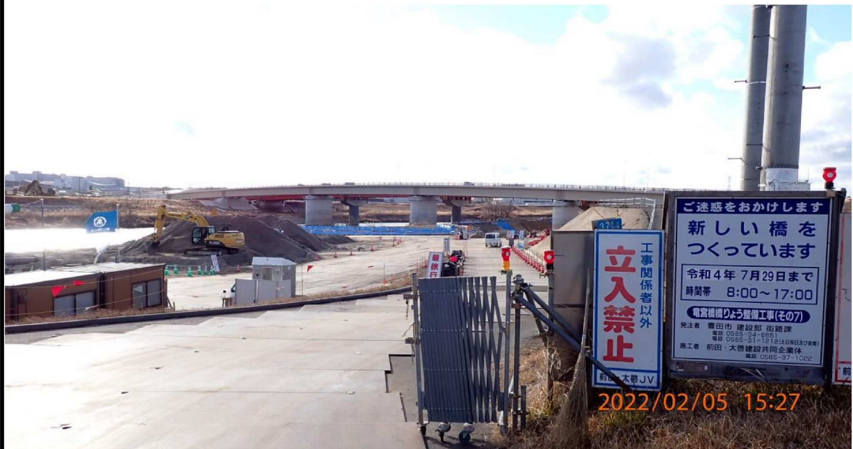
左岸では工事の準備が進められている。