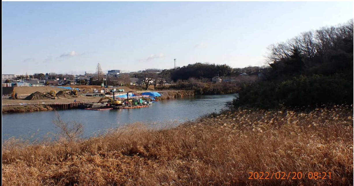
右岸37.5km付近の様子。対岸では工事の準備が行われている。