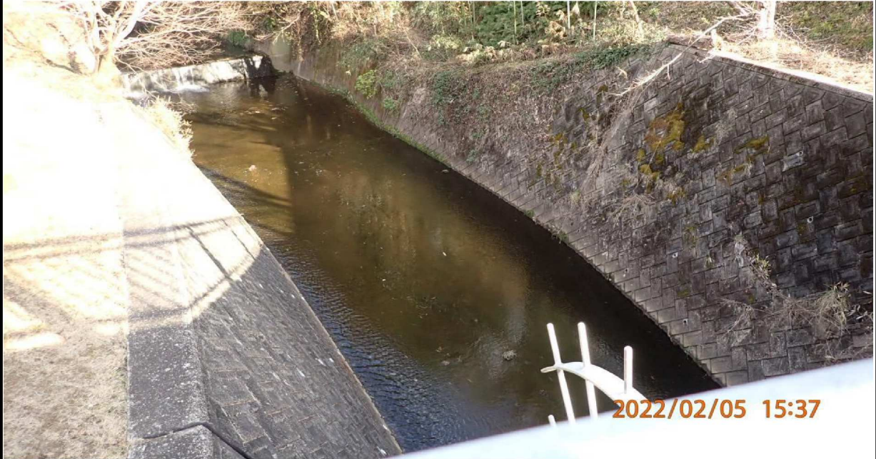
左岸37.2km付近 矢作川へ流入する用水の様子。