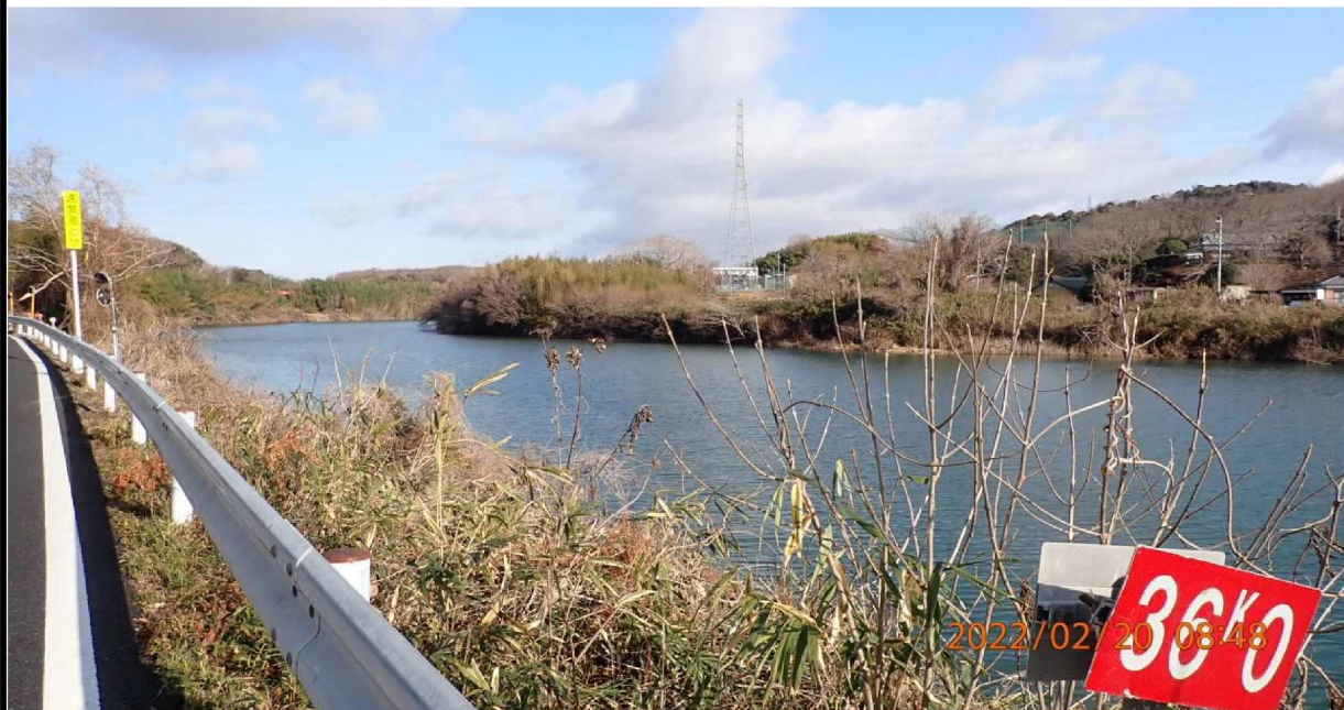
右岸36.0km付近より上流の様子。