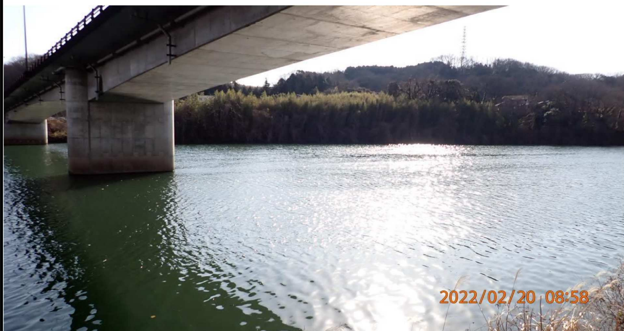
右岸36.4km付近 山室橋より下流を撮影。 この時期の河川は何処も冷たく静かな印象でした。 以上で2月の報告を終わります。