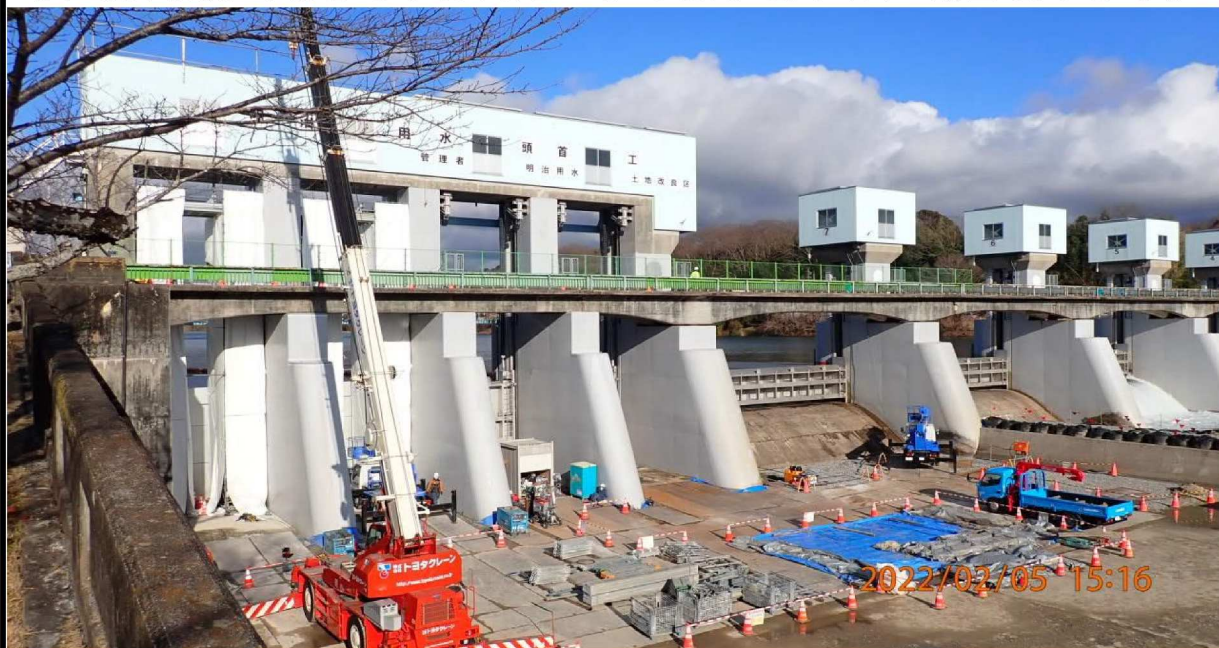
右岸 水源橋工事の様子。

【第8回】竜宮橋～山室間 今回は対象区間内でみられた工事の様子を中心に報告をします。