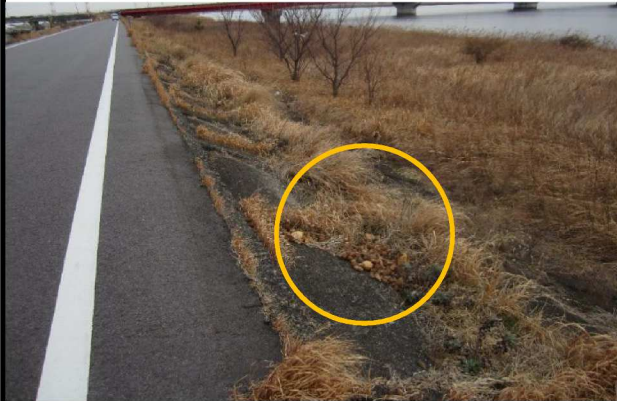
右岸2.1 km付近表のり遠景