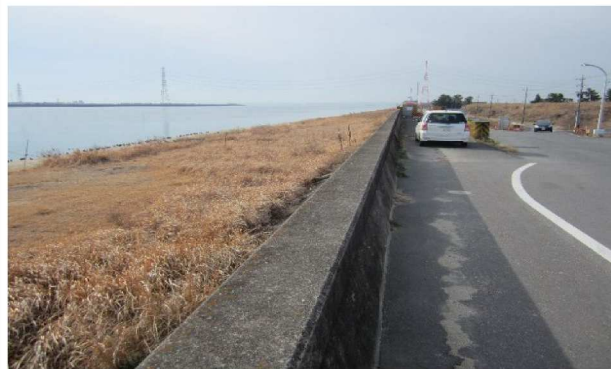
右岸国土交通省の管理界表のり