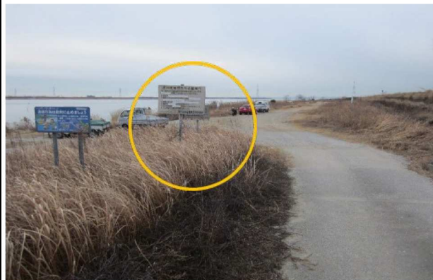
右岸1.9 km付近高水敷遠景