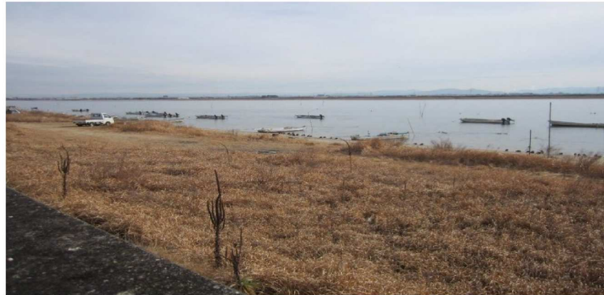
河川沿いには漁師さんの船が50艘程度停泊されていました。↑