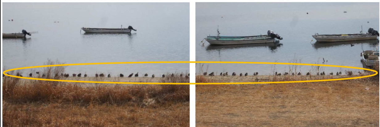
名前は分かりませんが、水鳥が岸に沿って一列に並び、日なたぼっこしている様です。