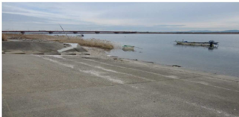
船舶利用のため緩やかなコンクリートスロープになっている