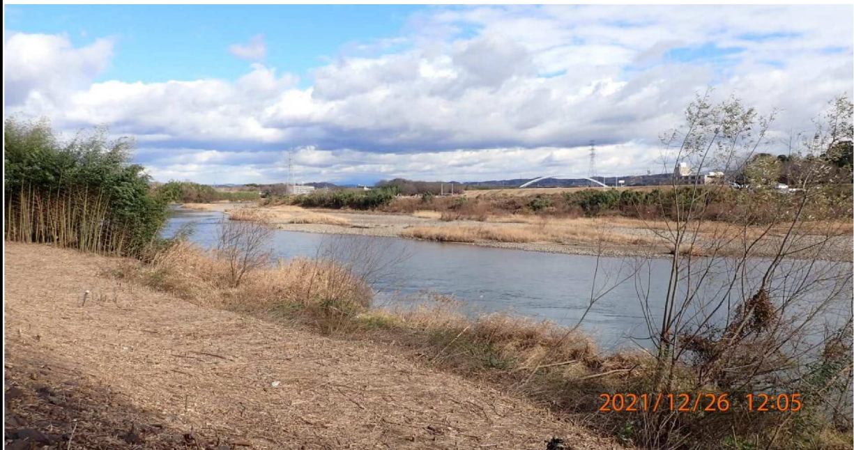
右岸40.8km付近の河川敷より上流の様子。