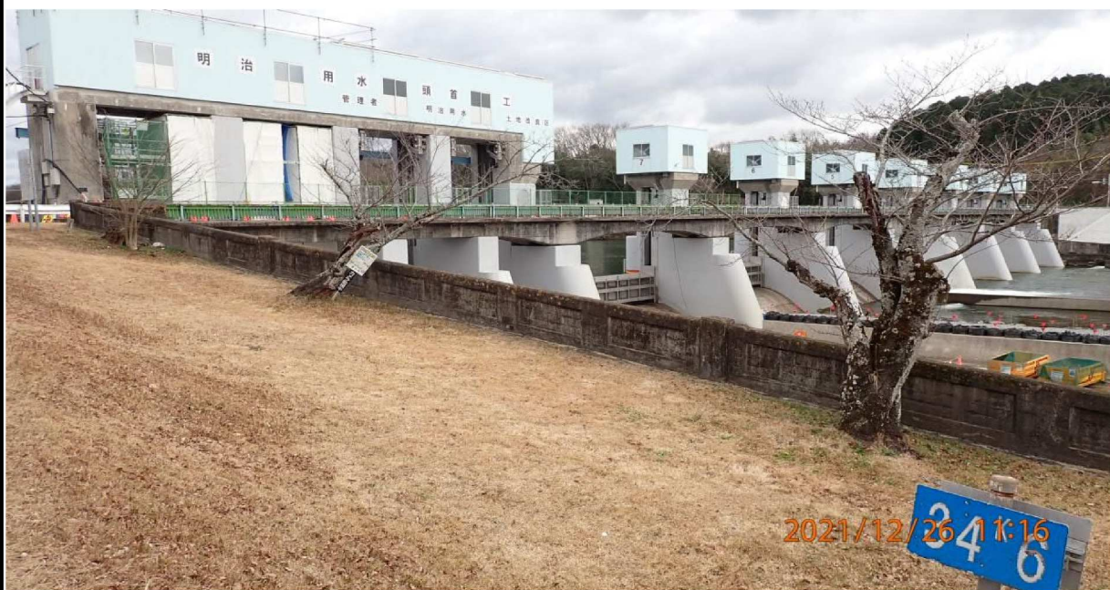
右岸34.6km付近の水源橋を撮影。