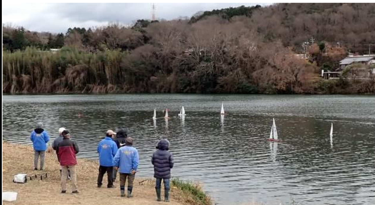
空気は澄んで、水面は穏やかでした。