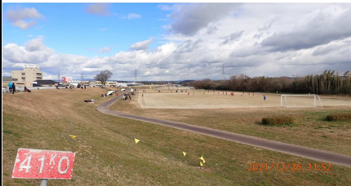
右岸41.0km付近より上流を撮影。