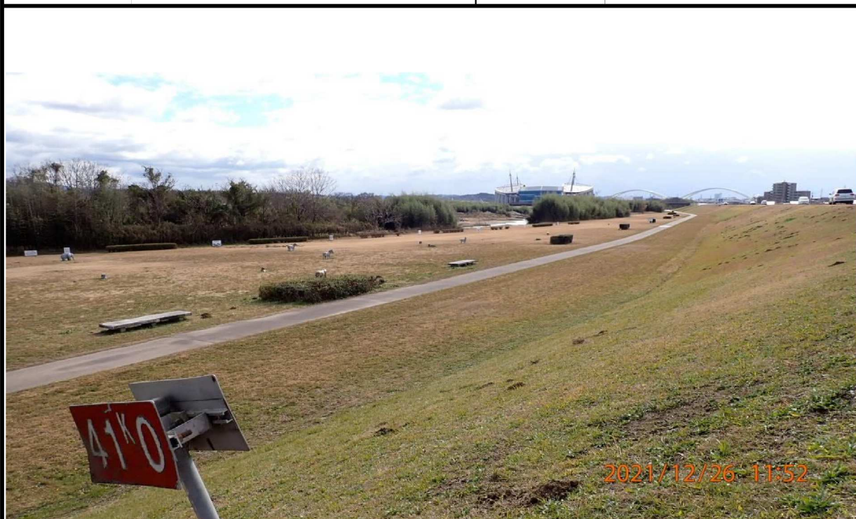
右岸41.0km付近から下流を撮影。 遠方には豊田スタジアムと豊田大橋が見える。