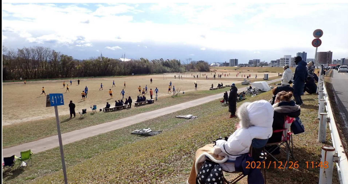
右岸41.2km付近の様子。本日は少年サッカーの大会が開催されていた。