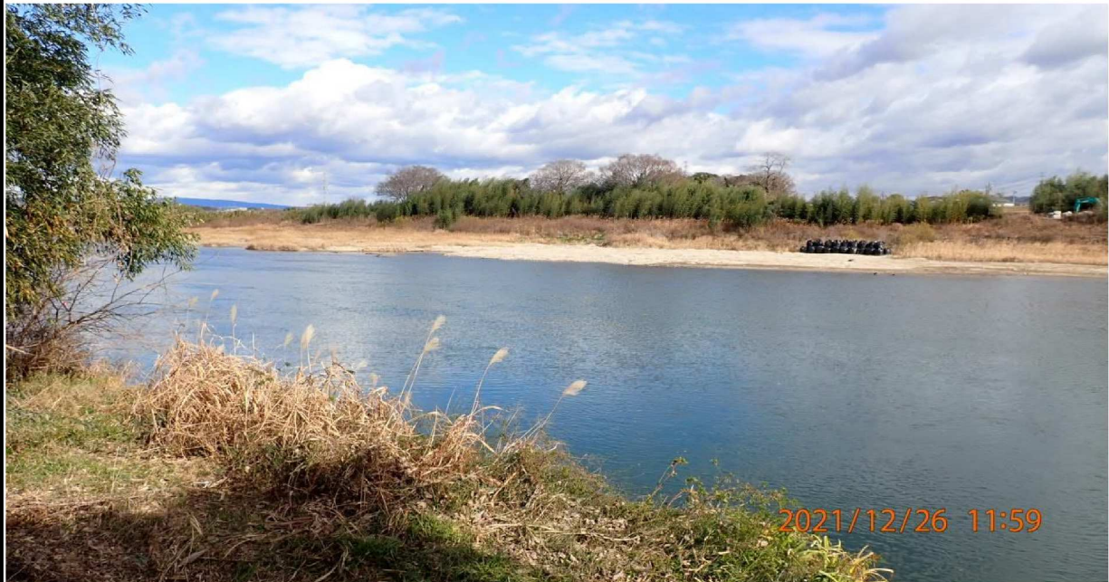
右岸40.7km付近の河川敷より上流の様子。