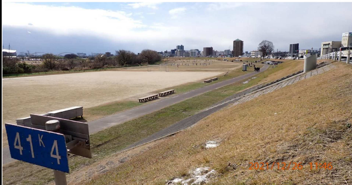
右岸41.4km付近の川端公園サッカー場の様子。