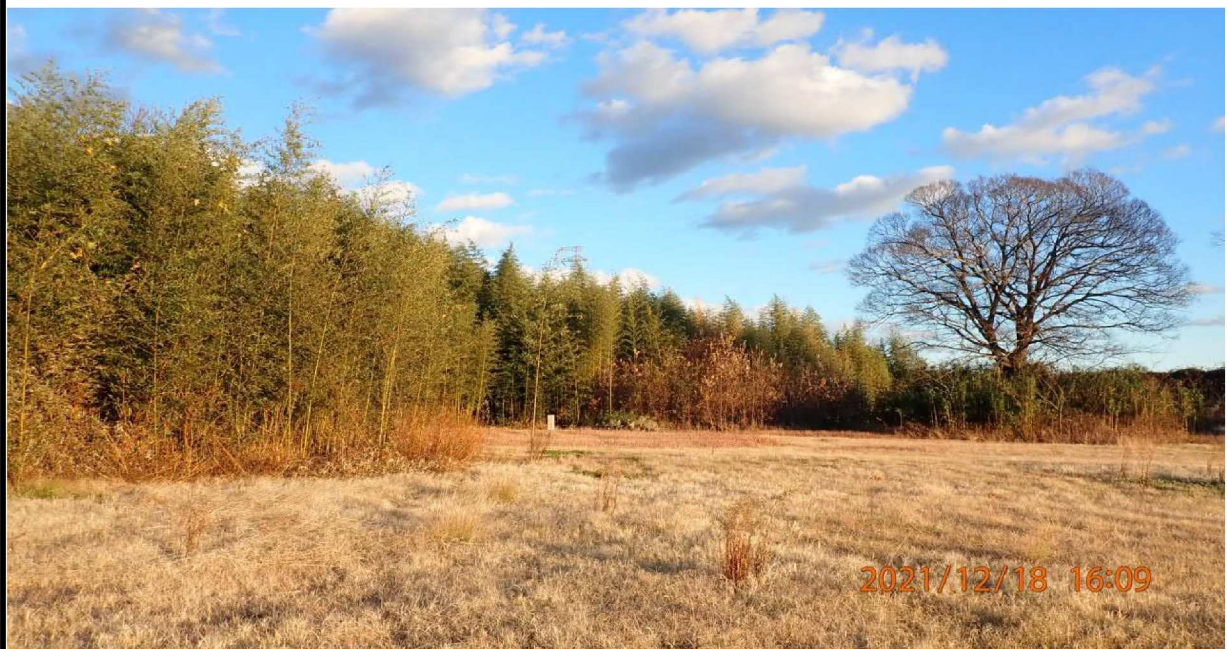
左岸41.5km付近の川田公園芝生広場の様子。