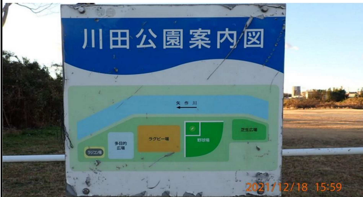
左岸40.8km付近の川田公園案内図。