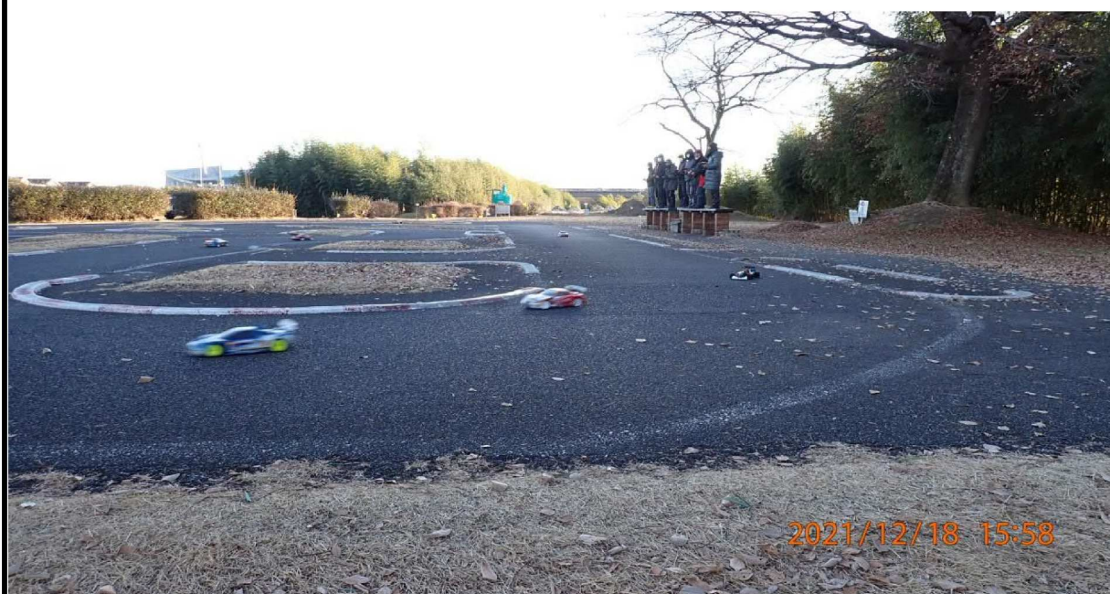
寒空の中、ラジオカーで走行を楽しむ人々の様子。