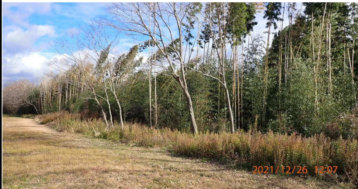
右岸40.9km付近の様子。 この辺りは雑木林により水面は見えない。