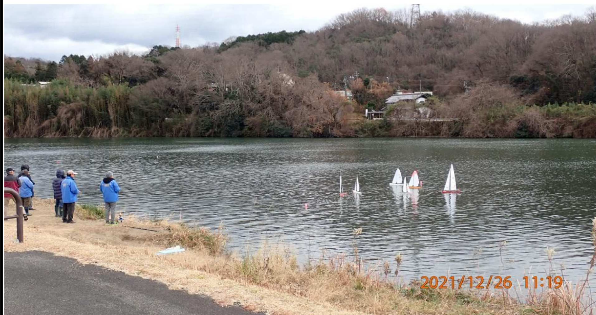
右岸34.8km付近の様子。ﾗﾝﾞ ｺﾝﾖｯﾄを楽しむ人々。