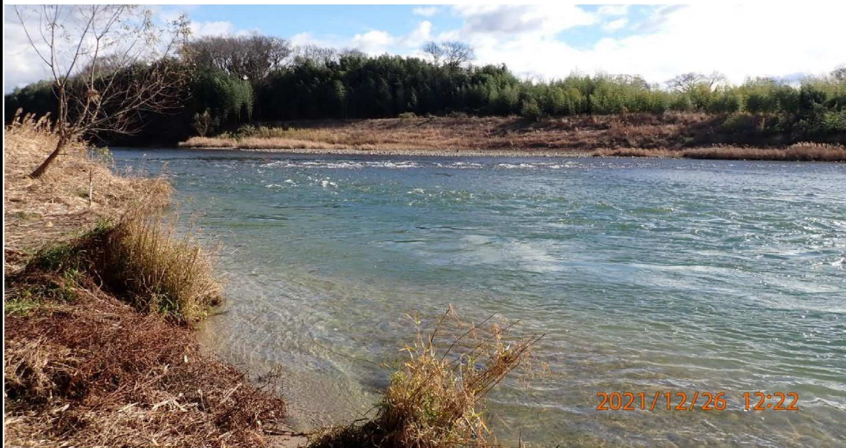
右岸41.6km付近の籠川合流点を撮影。