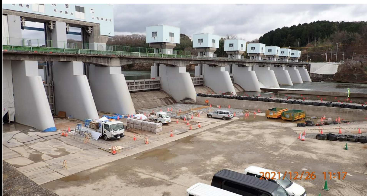
右岸34.5km付近の水源橋工事の様子。