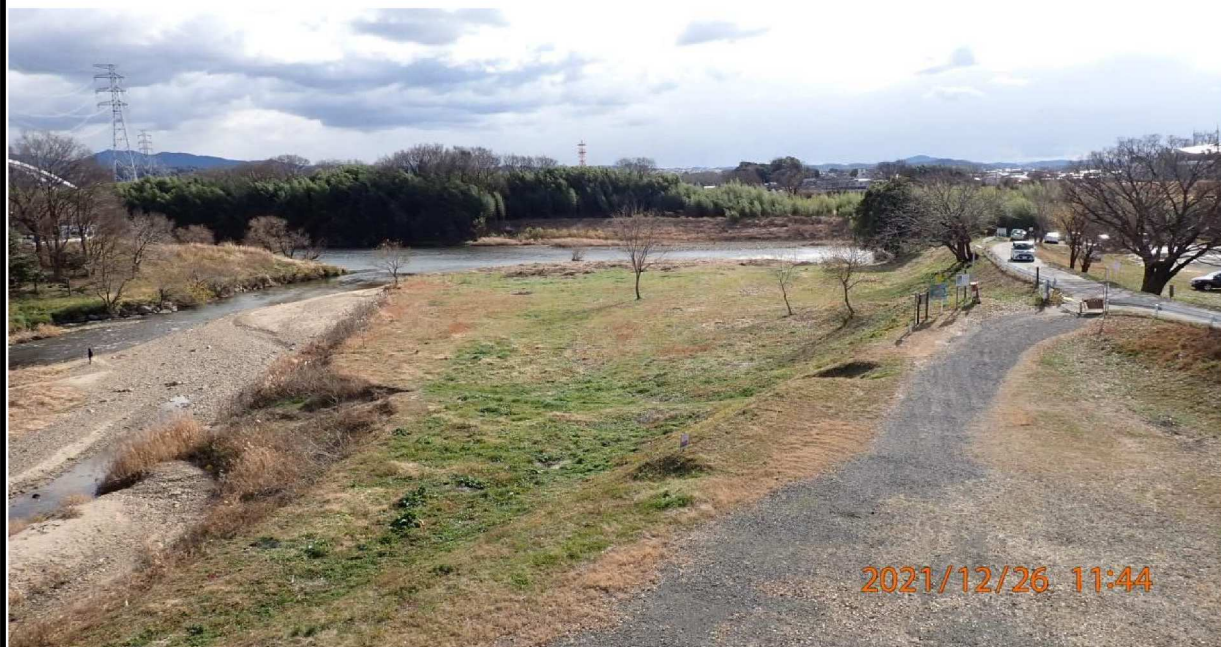
右岸41.6km付近の籠川合流点の様子。