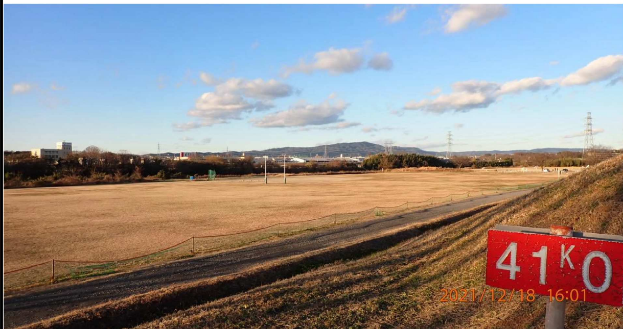
左岸41 km付近の川田公園ゴルフ場の様子。