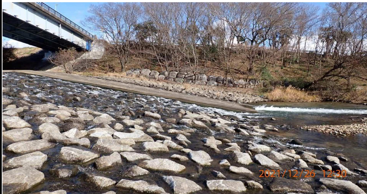
右岸41.6km付近。籠川の河原。