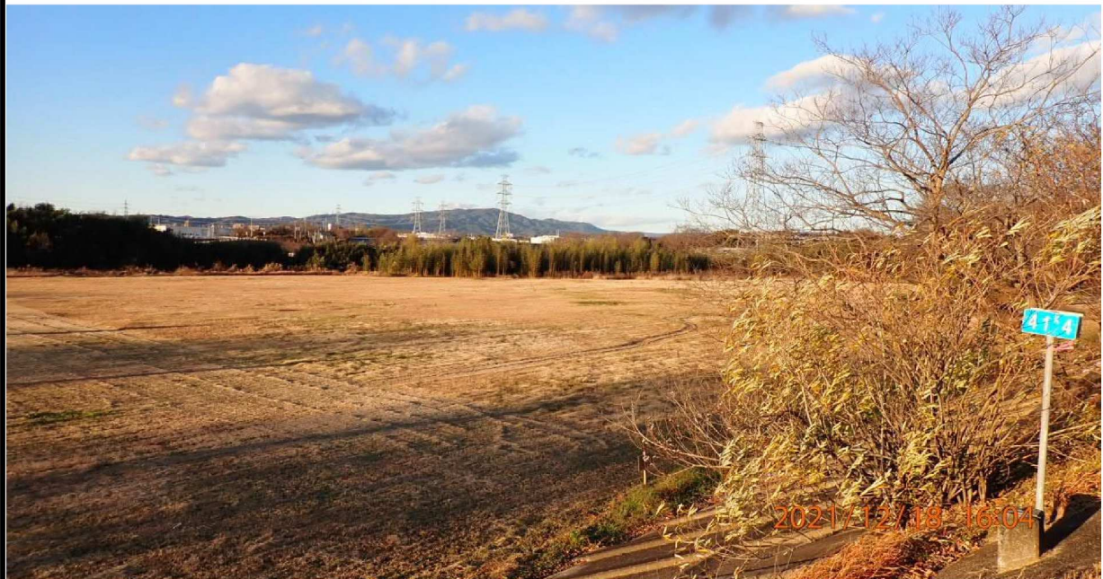
左岸41.4km付近の川田公園野球場の様子。