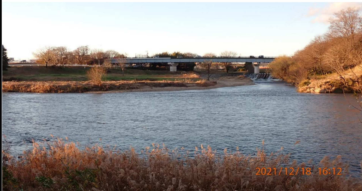
左岸41.6km付近の籠川合流点より対岸を撮影。