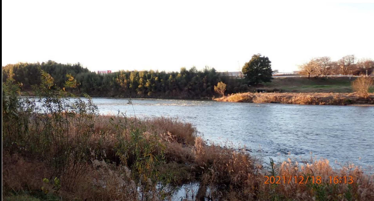
左岸41.6km付近の籠川合流点より下流を撮影。