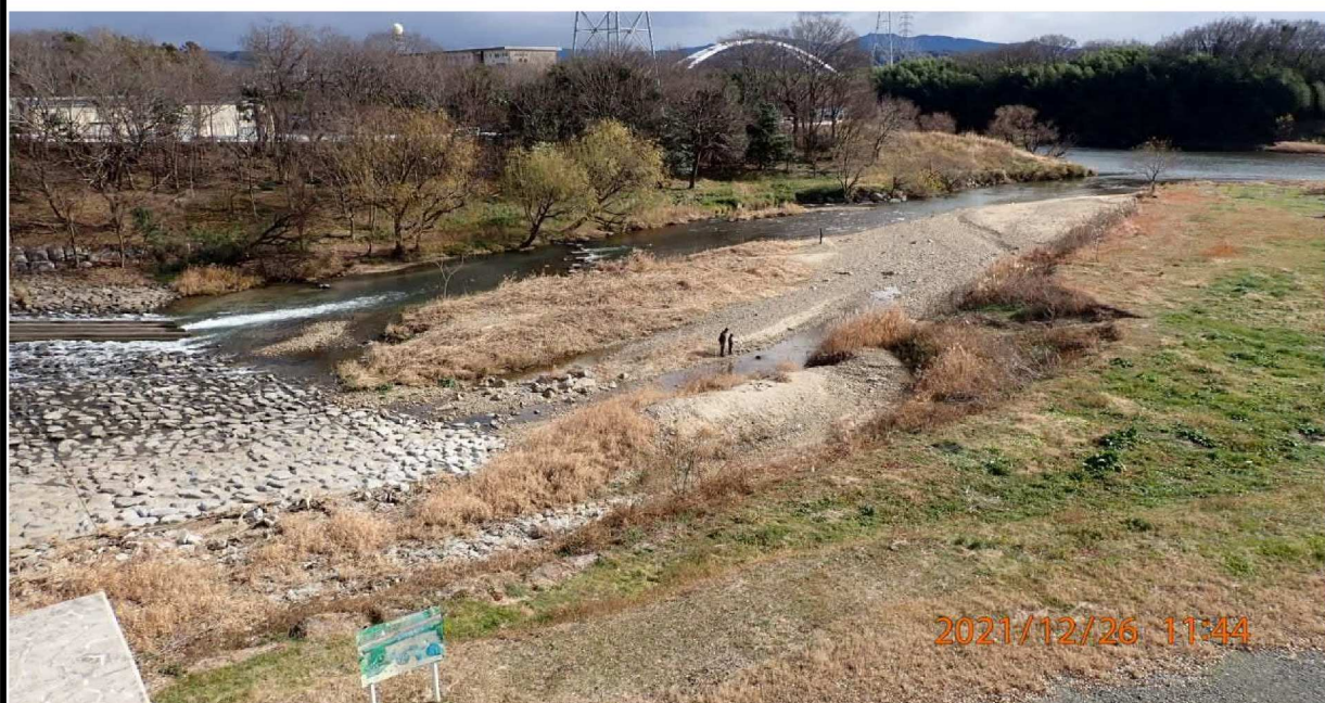
河原には人影も見えた。