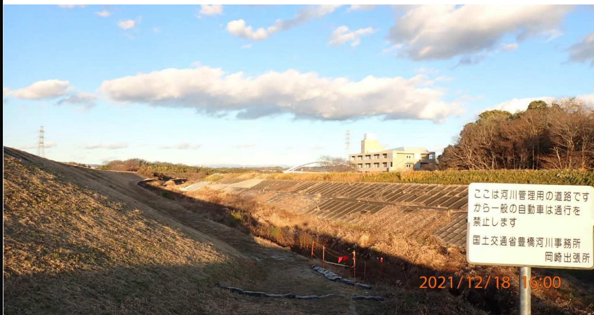
ゴルフ場から見た左岸の水路。