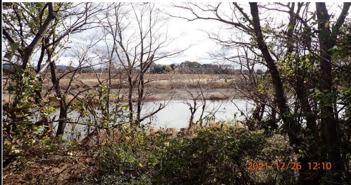
右岸41.0km付近の雑木林より対岸を撮影。 遠方のカビ-場では練習をする人々が見えた。