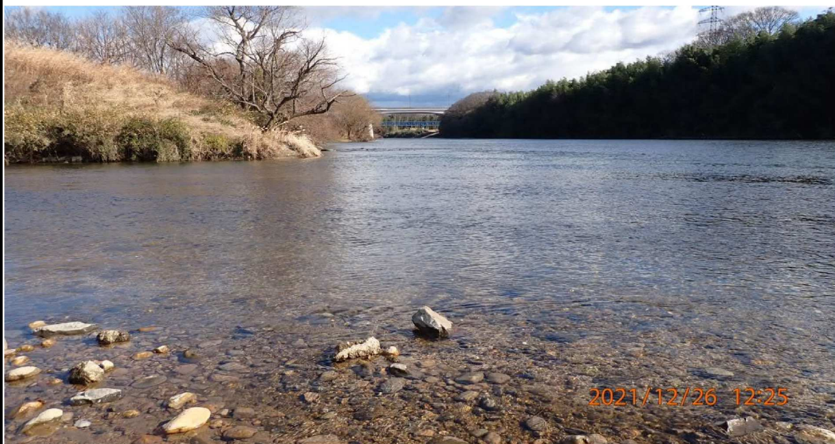
右岸41.6km付近の籠川合流点。川幅が広がり穏やかに澄んでいる様子。