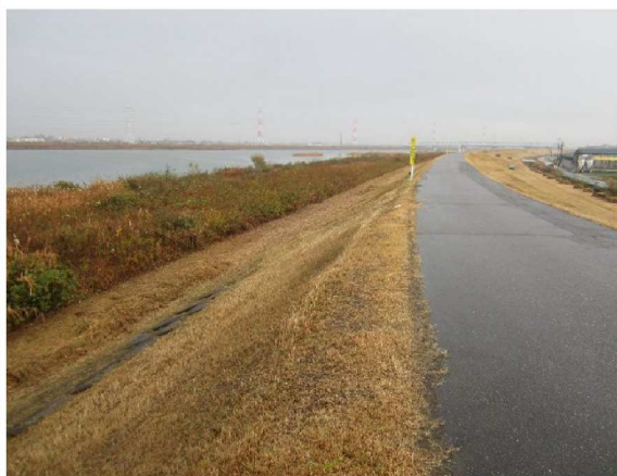
左岸測点3.4 km付近から表のり上流方向