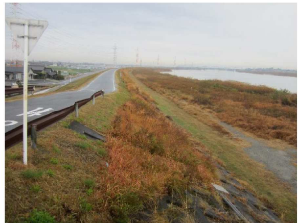
同左測点3.4 km付近から表のり上流方向