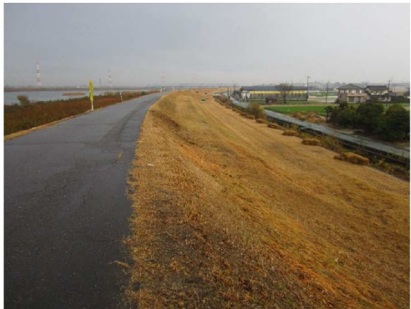
同左測点3.4 km付近から裏のり上流方向