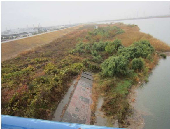
右岸測点 4.4 kmから表のり下流方向