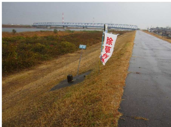
左岸測点4.2 kmから表のり上流方向