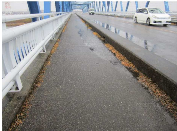
同左測点 4.4 kmから裏のり下流方向