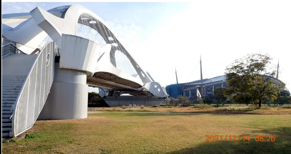
右岸40km付近の豊田大橋（下流側）を撮影。