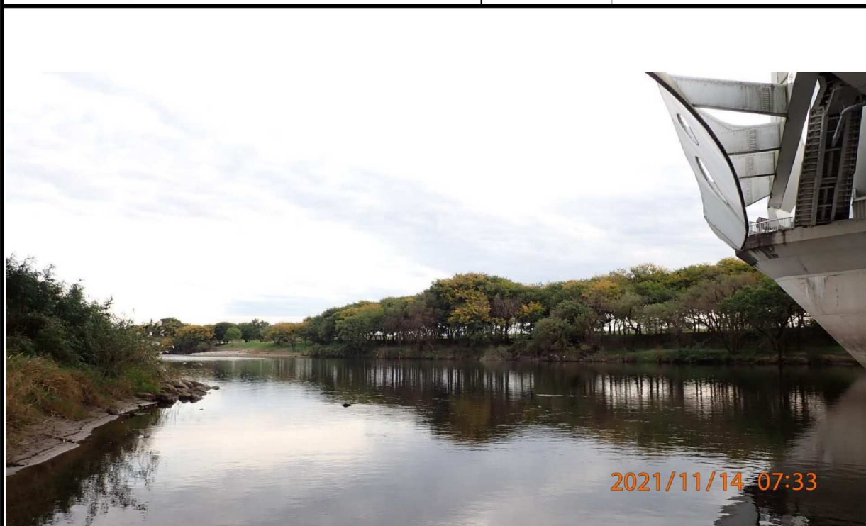
右岸40km付近の豊田大橋下から上流を撮影。