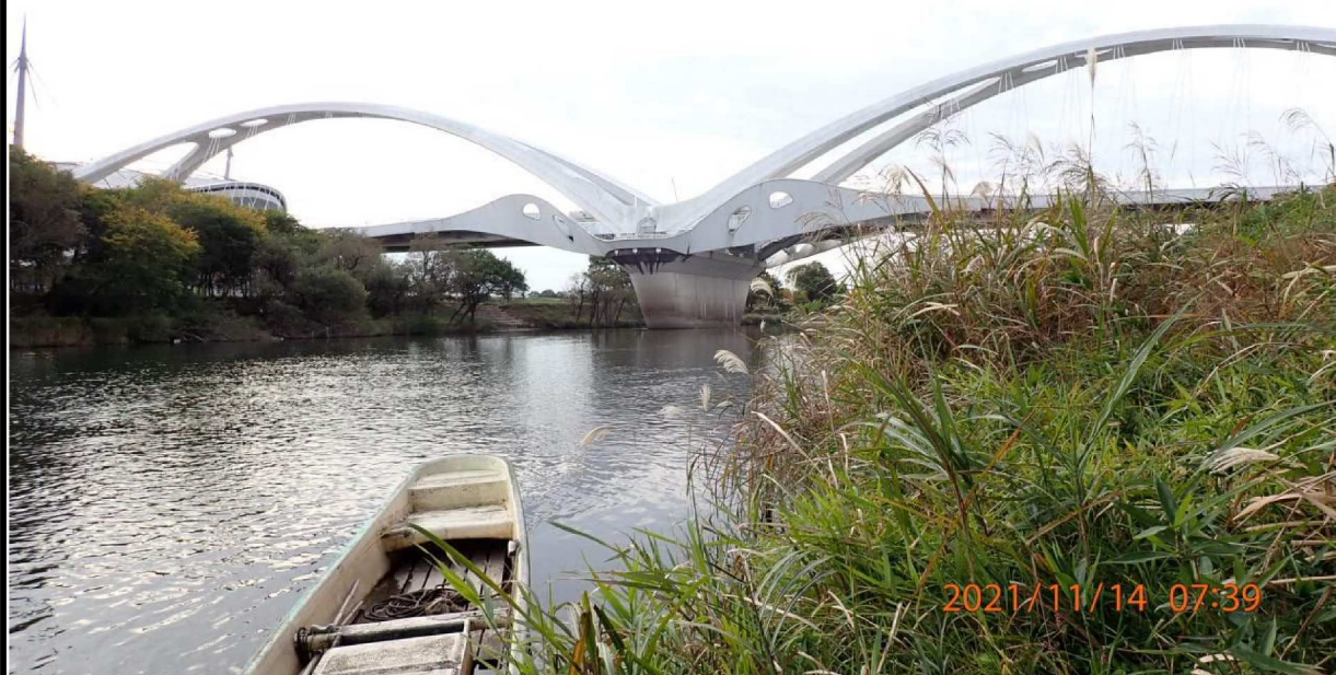
右岸41km付近の野道から下流を撮影。