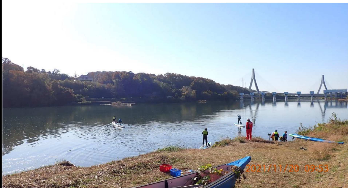
右岸34.8km付近より下流を撮影。水上ｽｰｯ活動の様子が見えました。