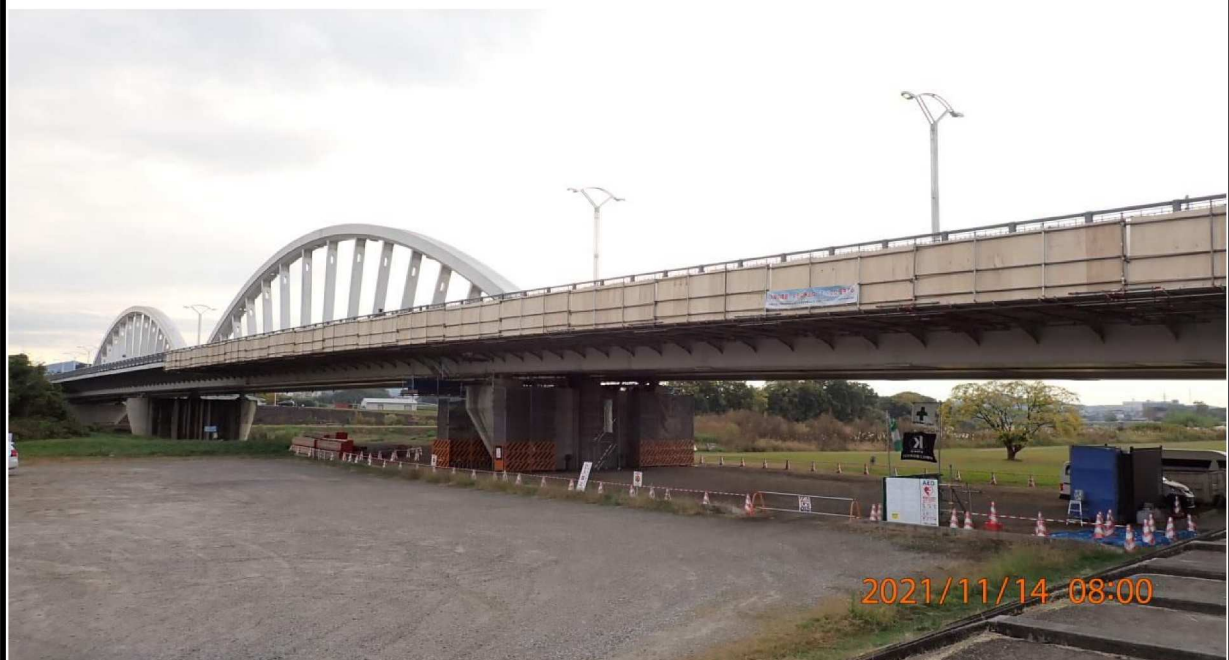
右岸39.6km付近より下流を撮影。 河川敷への入り口にはボランティア活動の説明看板があります。