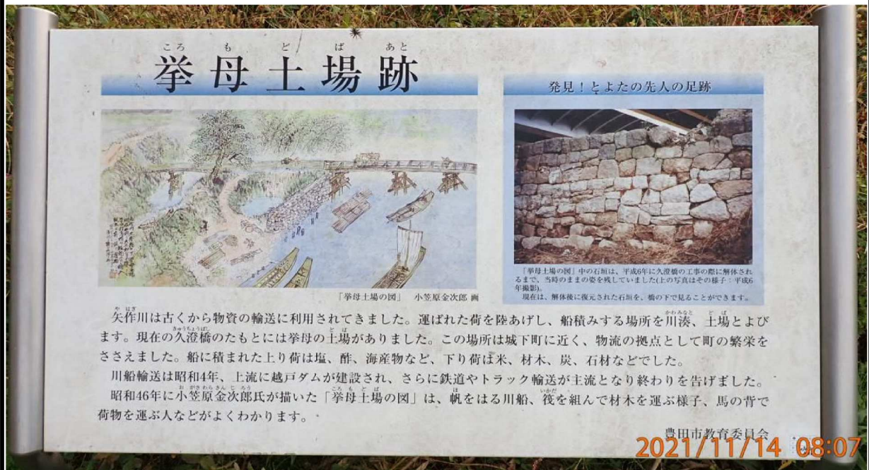
久澄橋下にある挙母土場跡の説明看板。