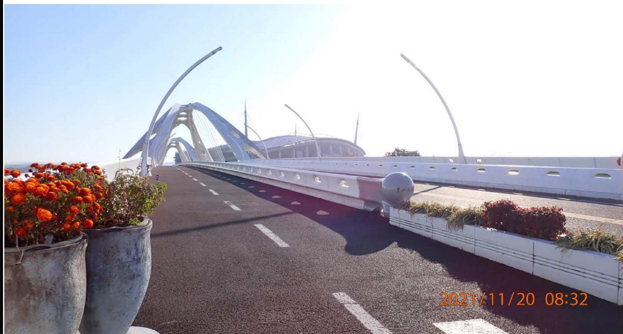
右岸の豊田大橋より対岸を撮影。 遠方には豊田スタジアムが見える。