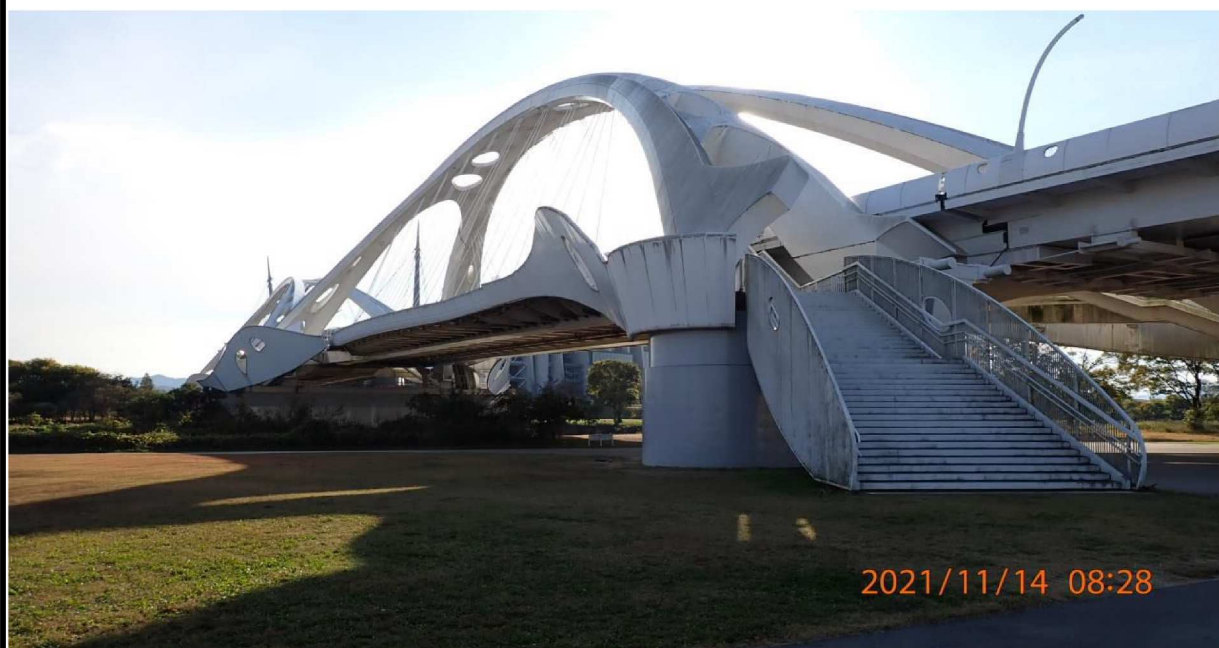
右岸40km付近の豊田大橋（上流側）を撮影。 豊田大橋は河川敷からの階段があり橋を渡ることが出来ます。