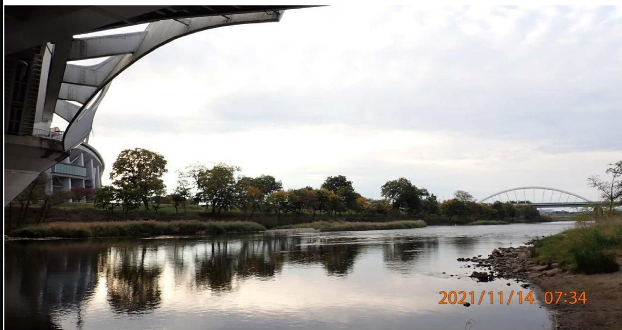
右岸40km付近の豊田大橋下から下流を撮影。 遠方には久澄橋が見える。