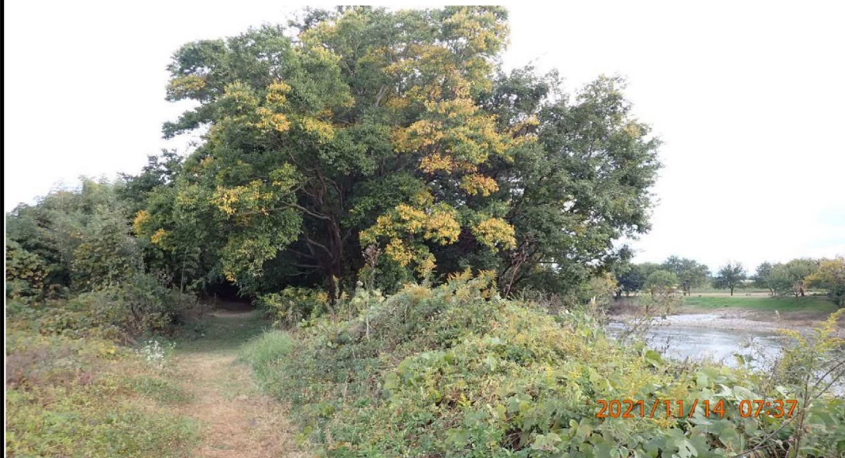
右岸40km付近豊田大橋より上流に向かう野道を撮影。