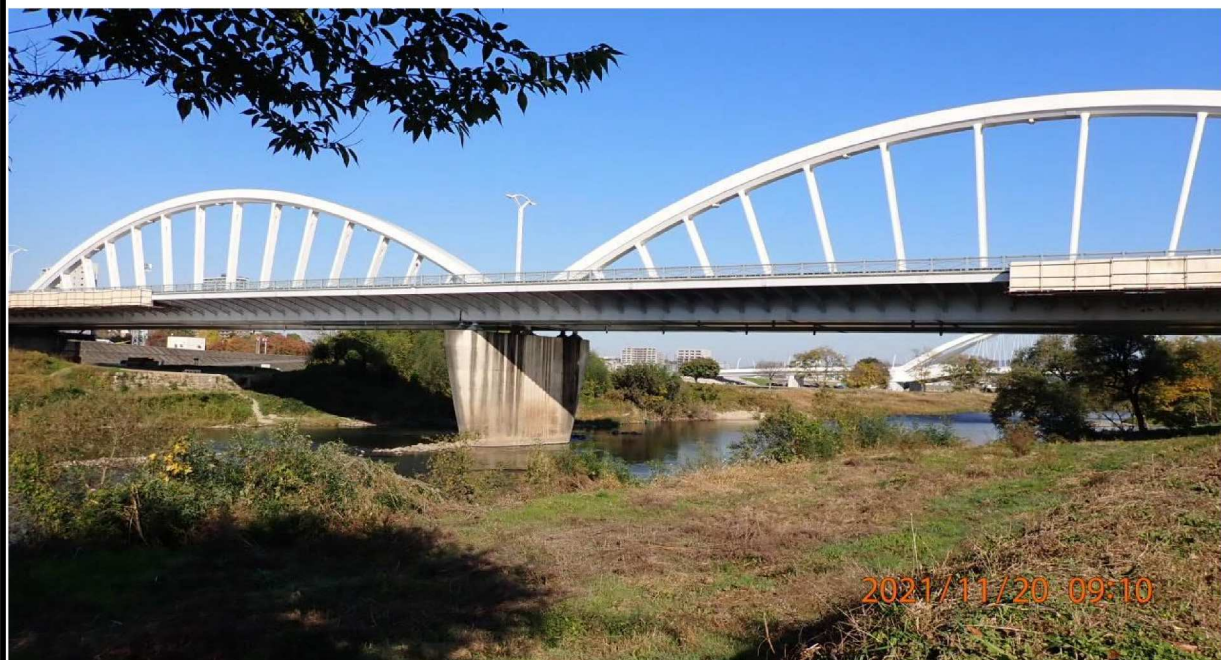
左岸39.4km付近の河川敷より上流の久澄橋を撮影。