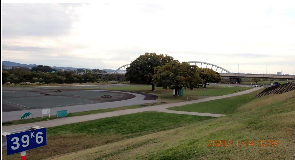
右岸39.6km付近より下流の久澄橋を撮影。