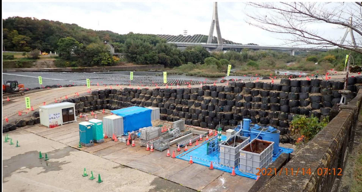
右岸より見た水源橋下流の工事風景。