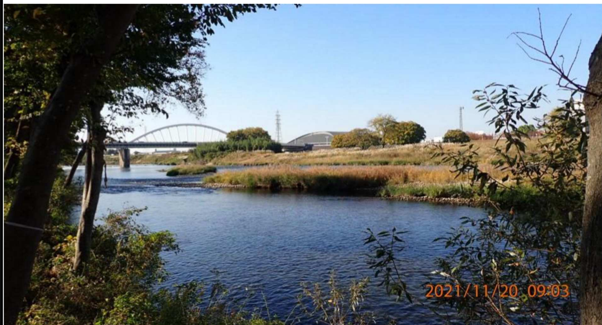
左岸39.6km付近の河川敷より下流の久澄橋を撮影。