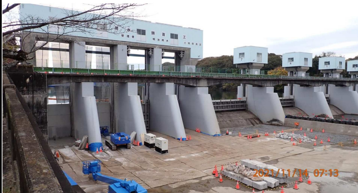
右岸34.6km付近より通行止めとなった水源橋の様子。