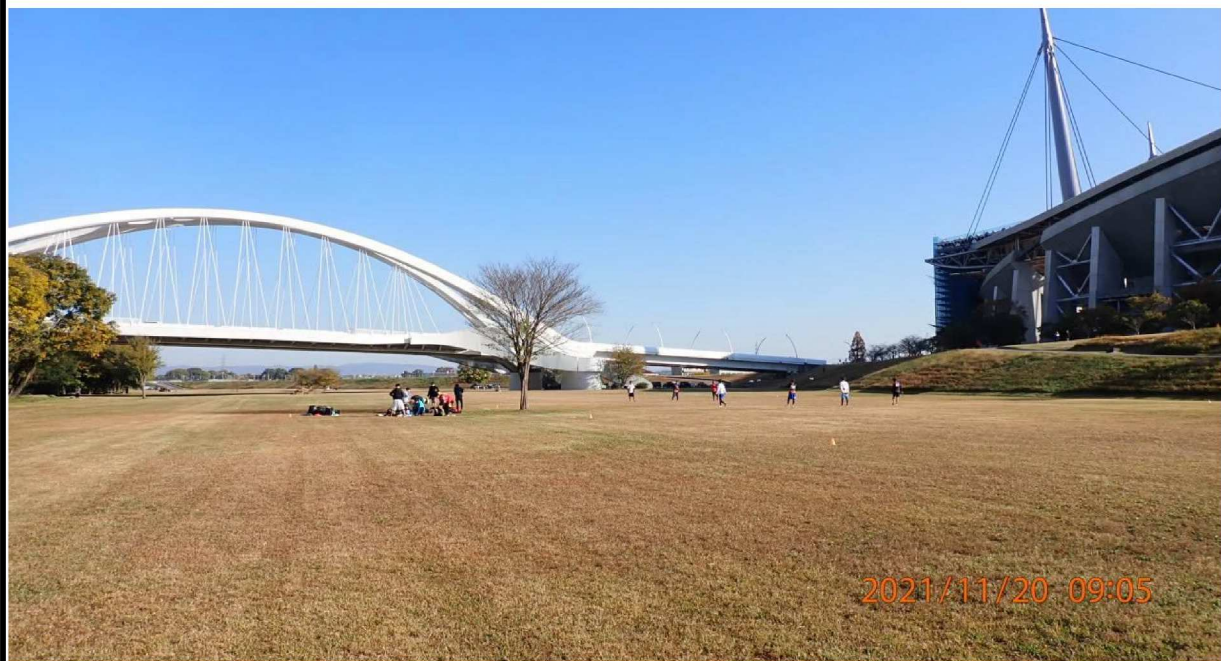
左岸39.6km付近の河川敷より上流の豊田大橋を撮影。 河川敷では木っツ活動の様子が見えました。