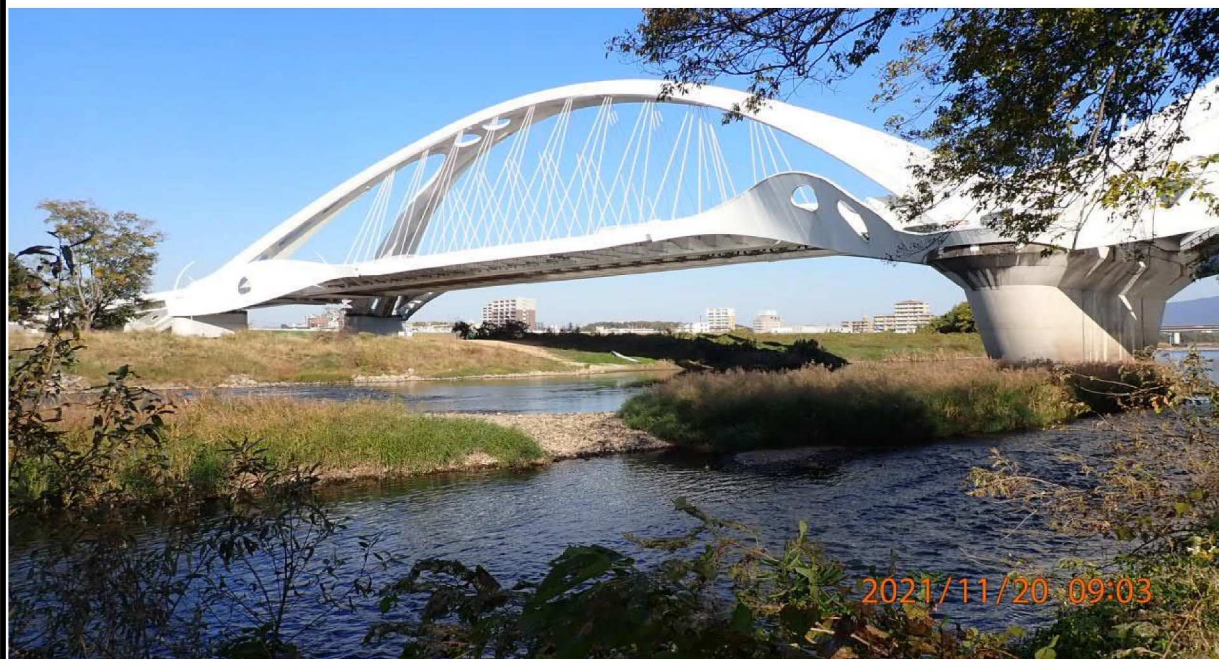
左岸39.6km付近の河川敷より上流の豊田大橋を撮影。