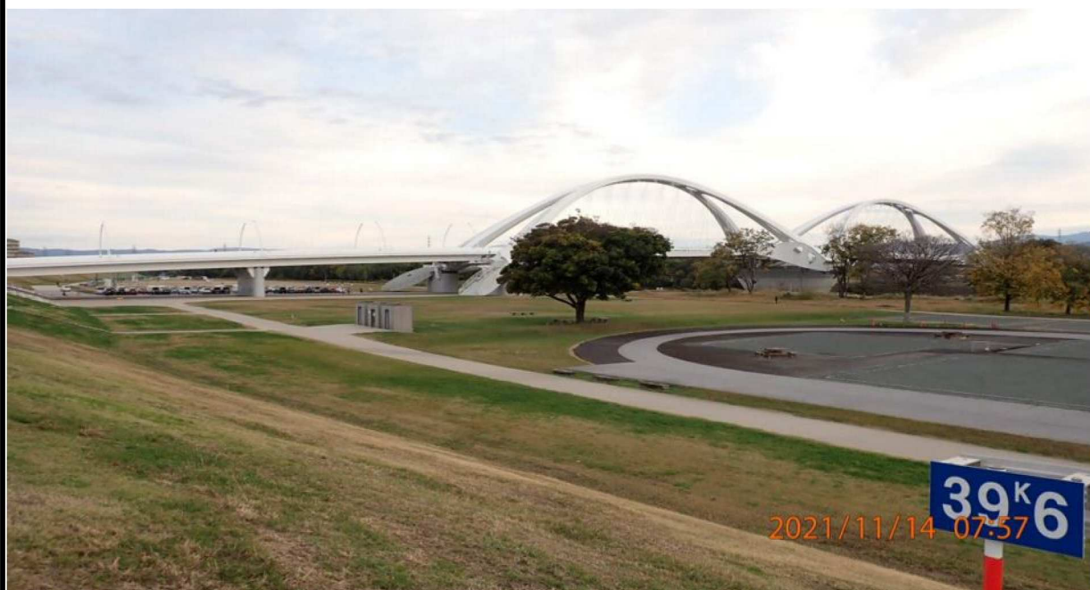
右岸39.6km付近より上流の豊田大橋を撮影。