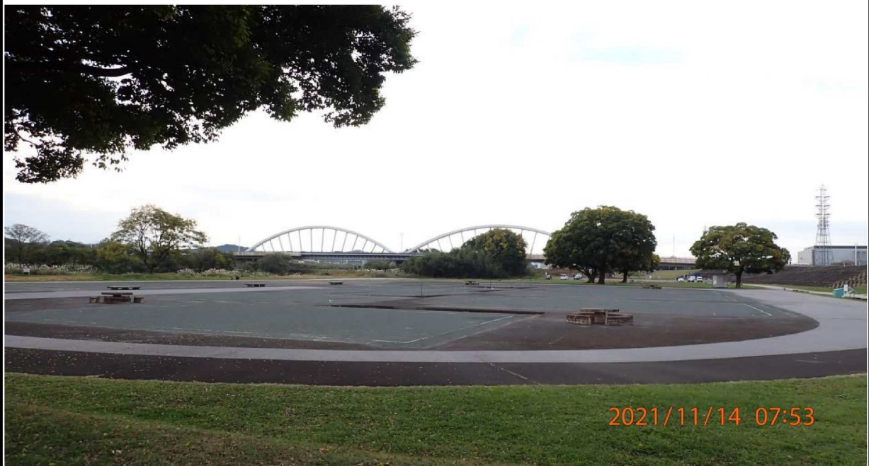
右岸39.6km付近の白浜公園ゲートボール場より下流を撮影。 遠方には久澄橋が見える。