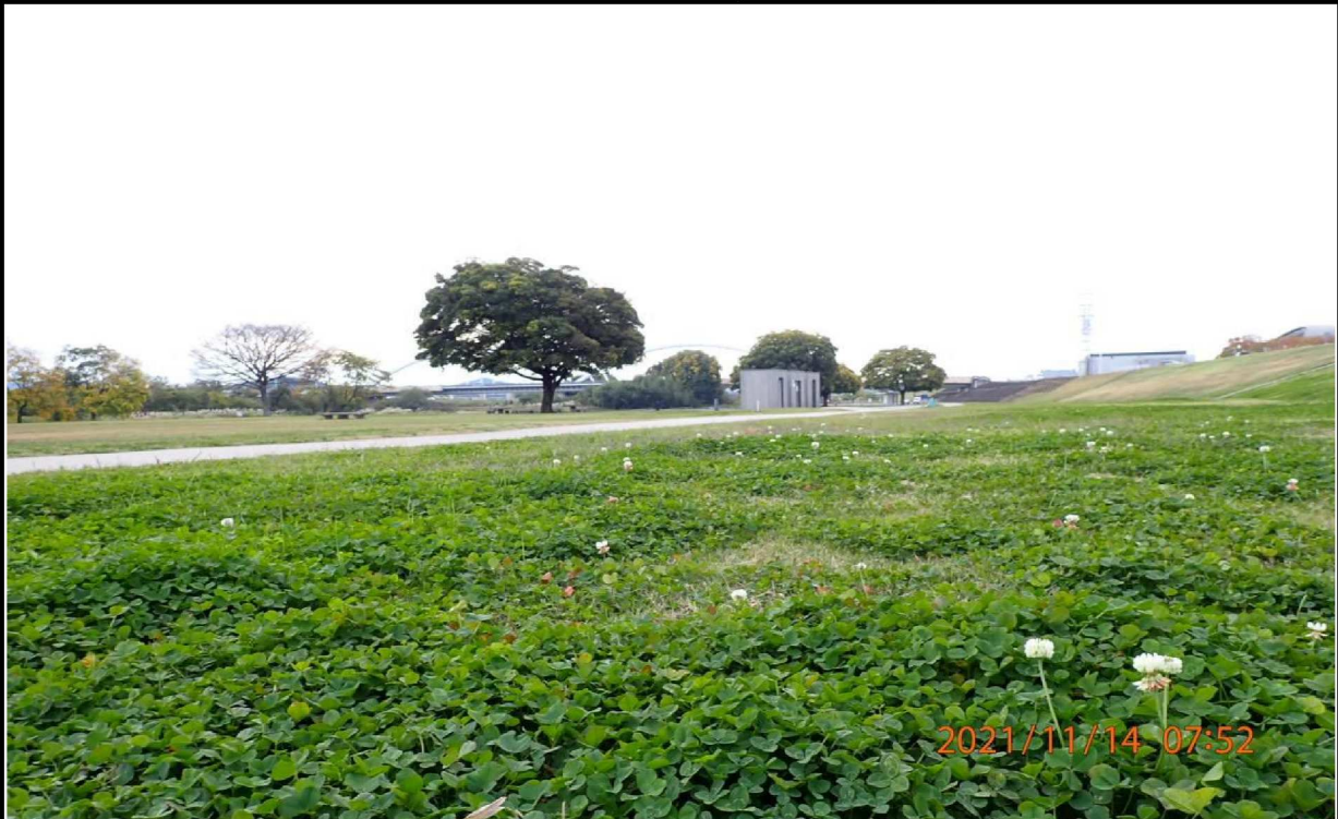
右岸39.8km付近の河川敷より下流の白浜公園ゲートボール場を撮影。