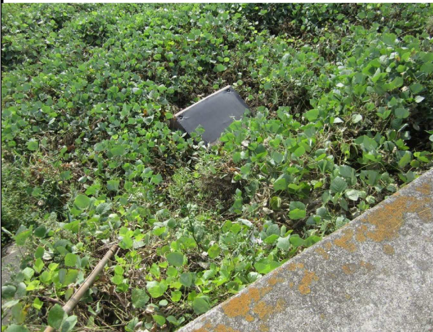
右岸下流方向0.7km付近

ソファのようなものの不法投棄あり、繁茂している草の中にはもっと沢山棄てられていると思われる。誠に残念