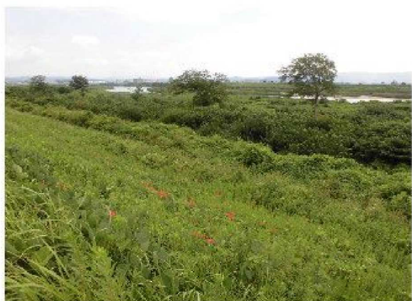
◆この辺りの法面には雑草に混じって彼岸花が咲いていました。赤い点々が可愛らしいです。