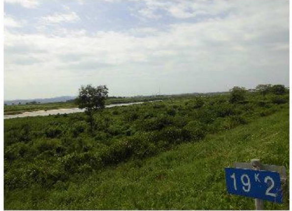
◆19.2km地点から、河口側(左)と上流側(右)を望む。河川の草木が成長著しいです。