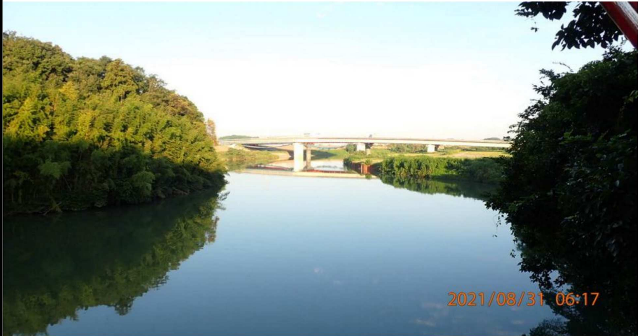
鵜の首橋中央付近より上流を撮影。竜宮橋が見える。