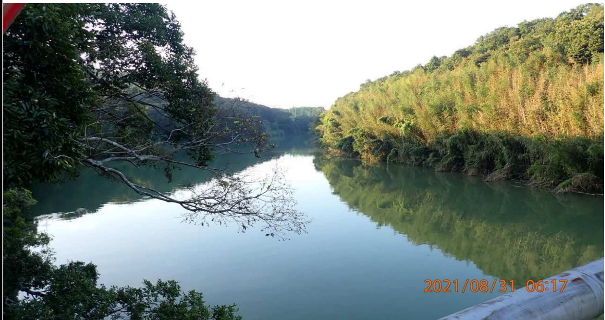
鵜の首橋中央付近より下流を撮影。