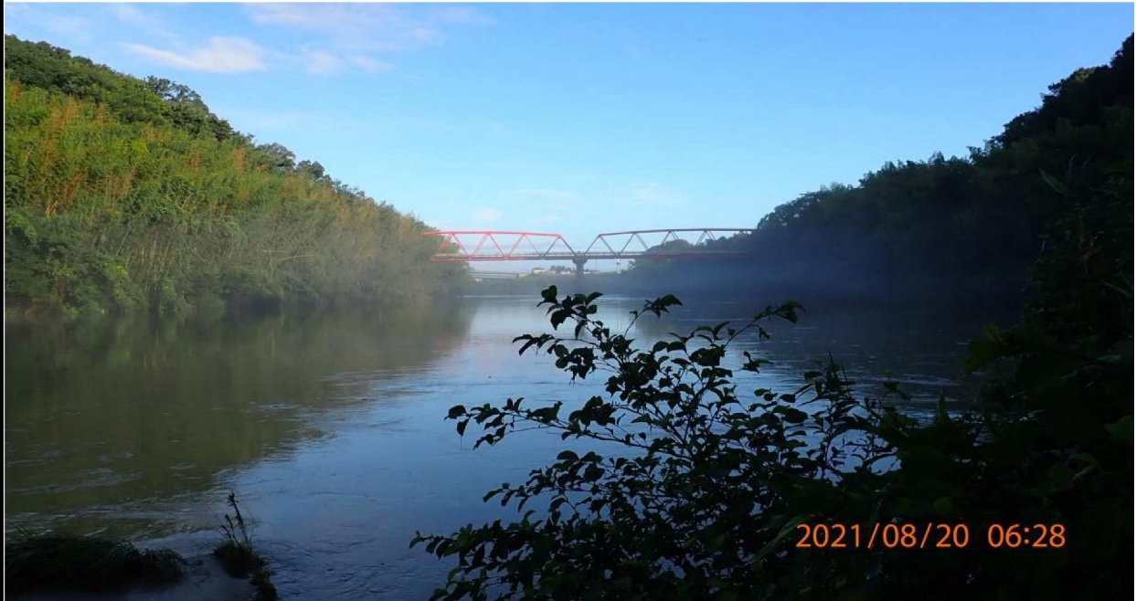
左岸37km付近の河岸より上流の鶴の首橋を撮影。