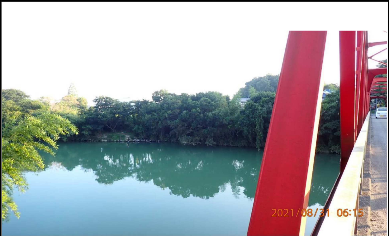
鵜の首橋の右岸より上流を撮影。