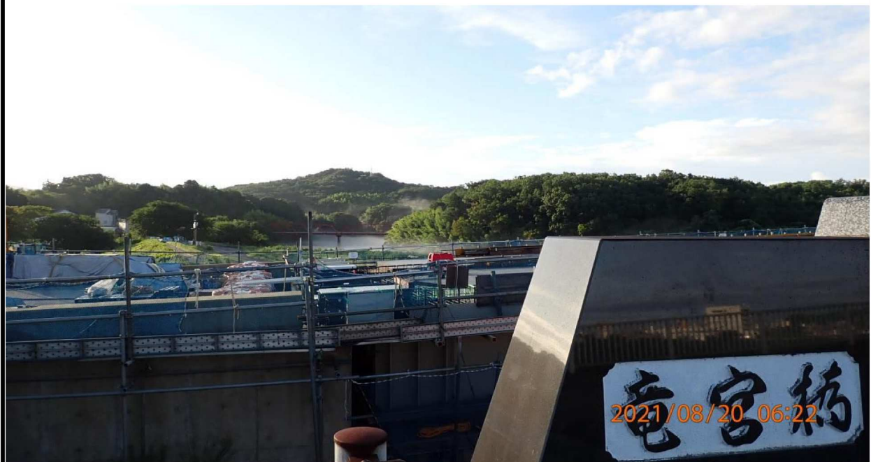
現在の竜宮橋の下流に新しい橋を建設している。