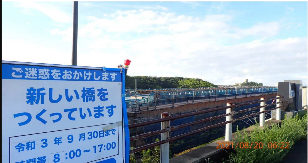
左岸37.6km付近の竜宮橋付近を撮影。