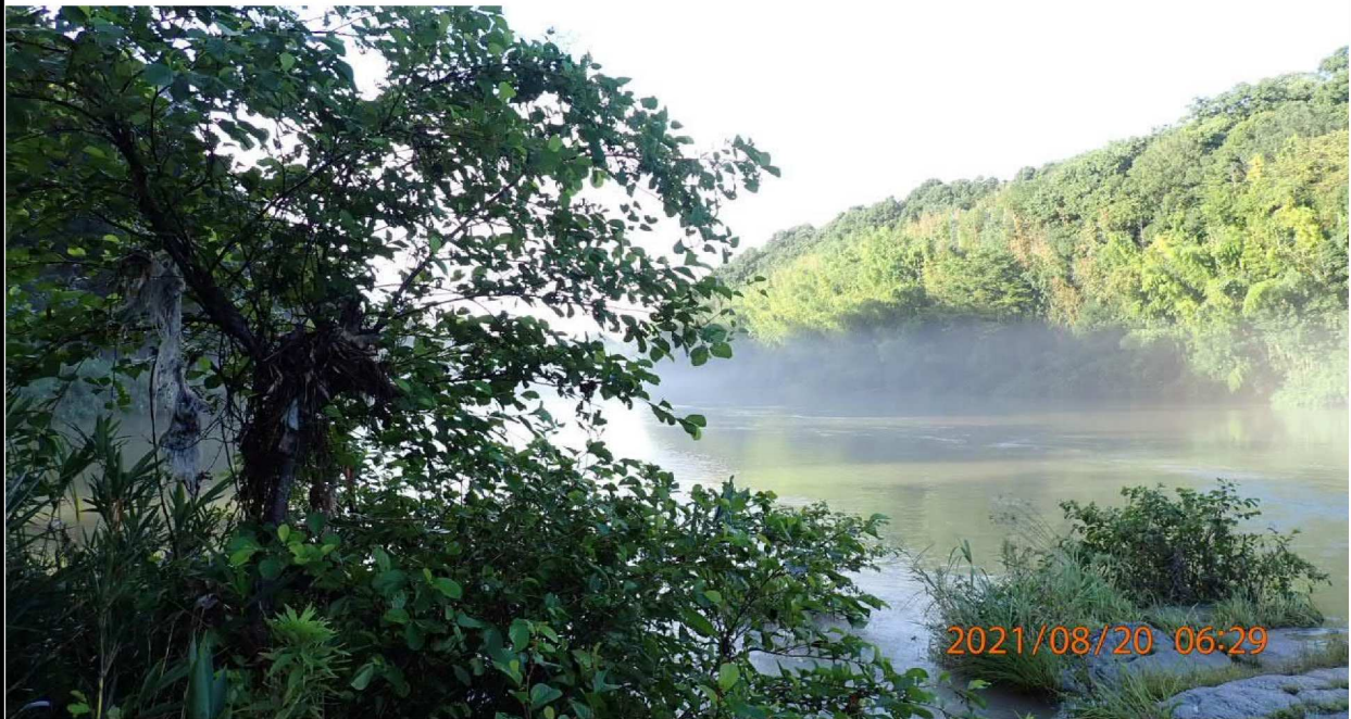
左岸37km付近の河岸より下流を撮影。 左側の枝に漂流物があり増水時の水位がうかがえる。