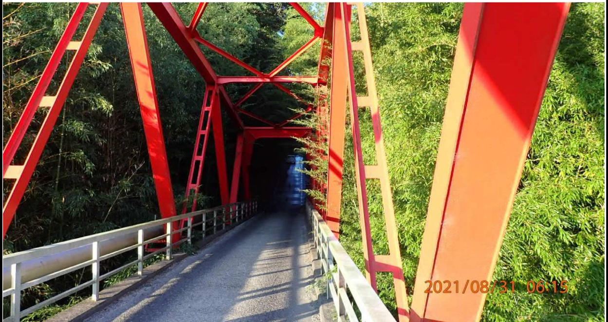
鵜の首橋の途中から右岸を撮影。周りは緑が多く茂っている。