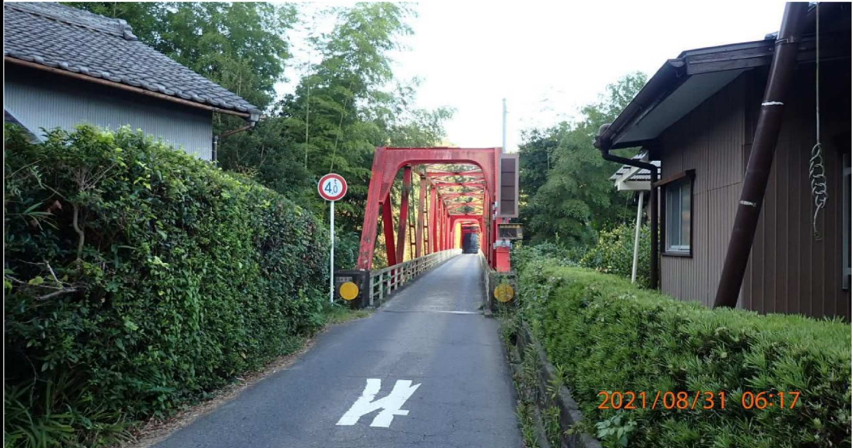
左岸より上鶴の首橋入り口を撮影。こちらは住宅の合間にある。