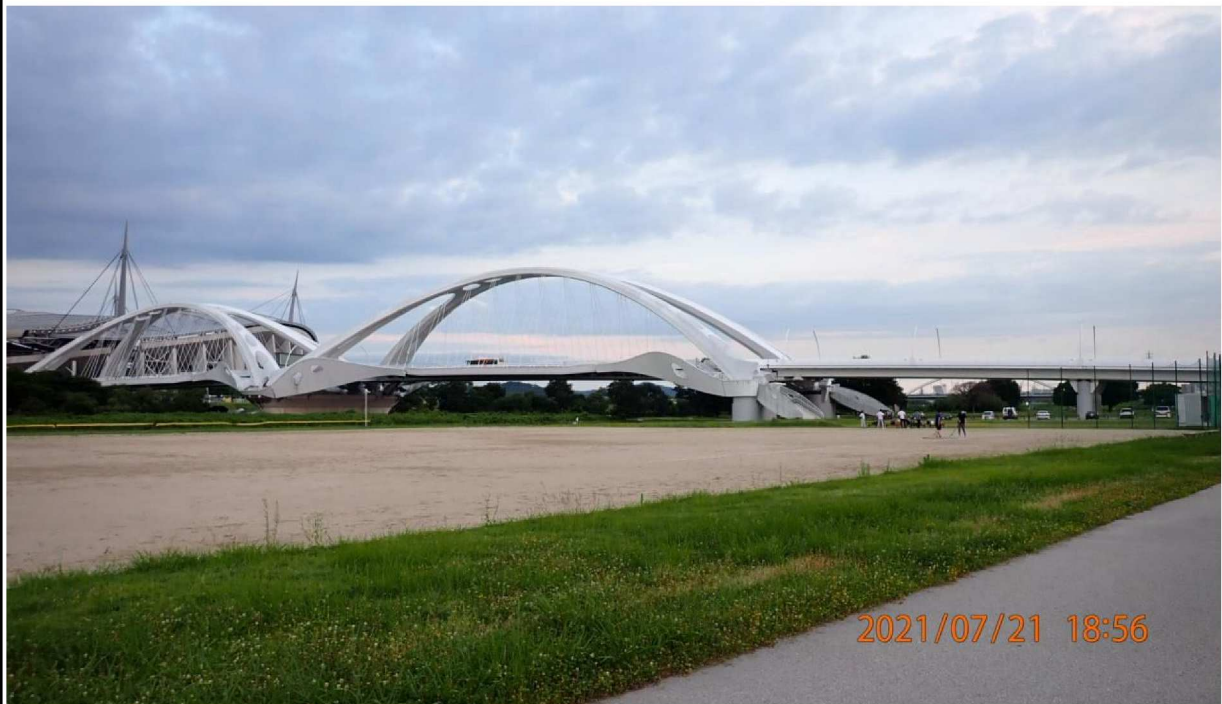
右岸40.0km付近より豊田大橋を撮影。