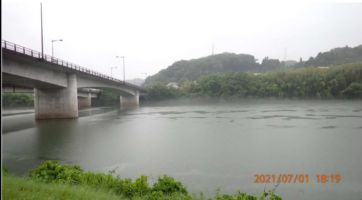
右岸35.2 k m付近の山室橋より対岸を撮影。