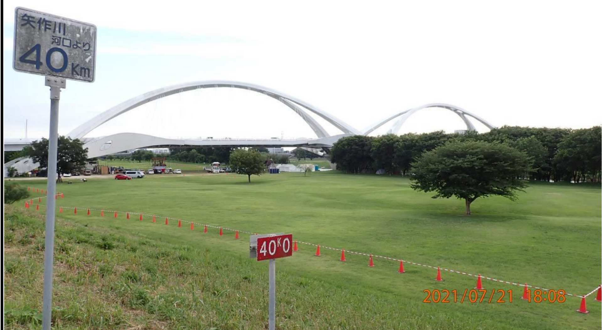
左岸40.0km付近より下流を撮影。