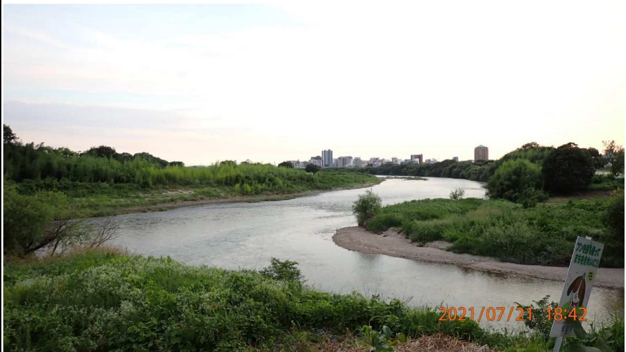
右岸41.6km付近の籠川合流地点より下流を撮影。