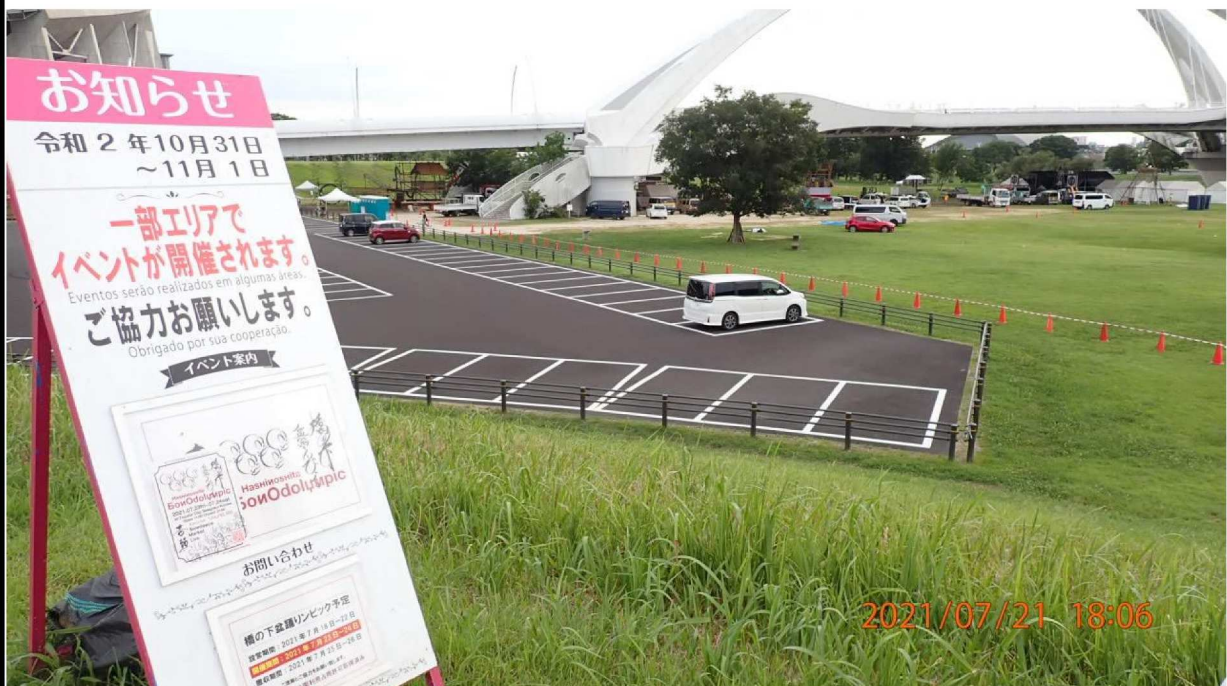
左岸40km付近より下流の豊田大橋を撮影。