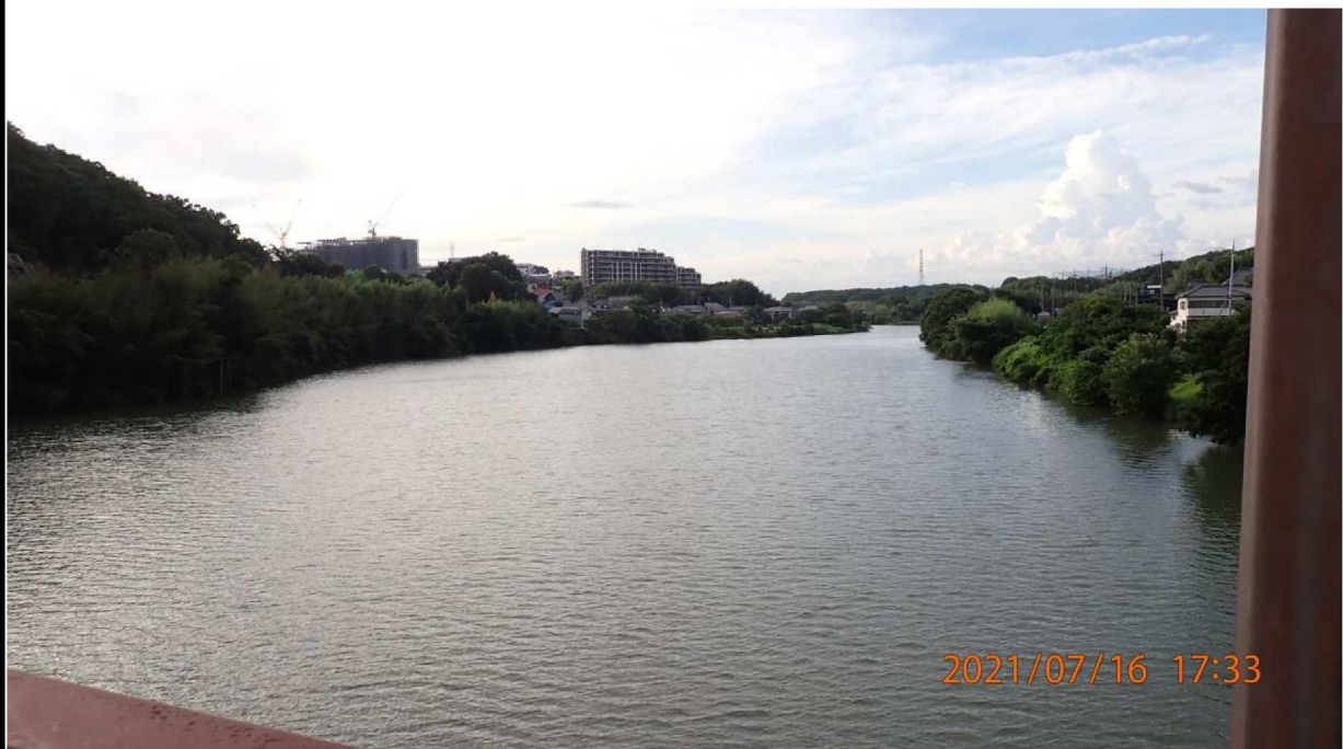
35.2km付近の山室橋より上流を撮影。