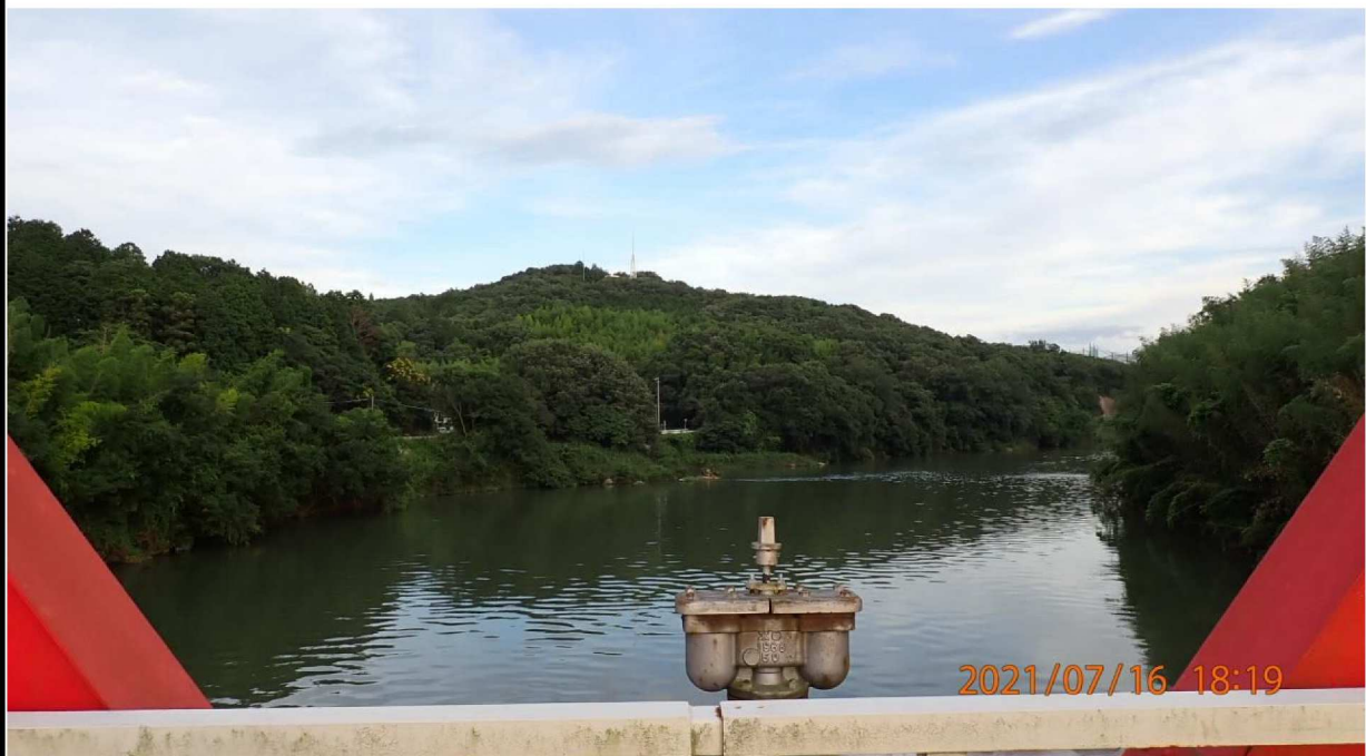
37.4km付近の鶺の首橋より下流を撮影。 山間に架かるつり橋のようなイェヅを感じた。