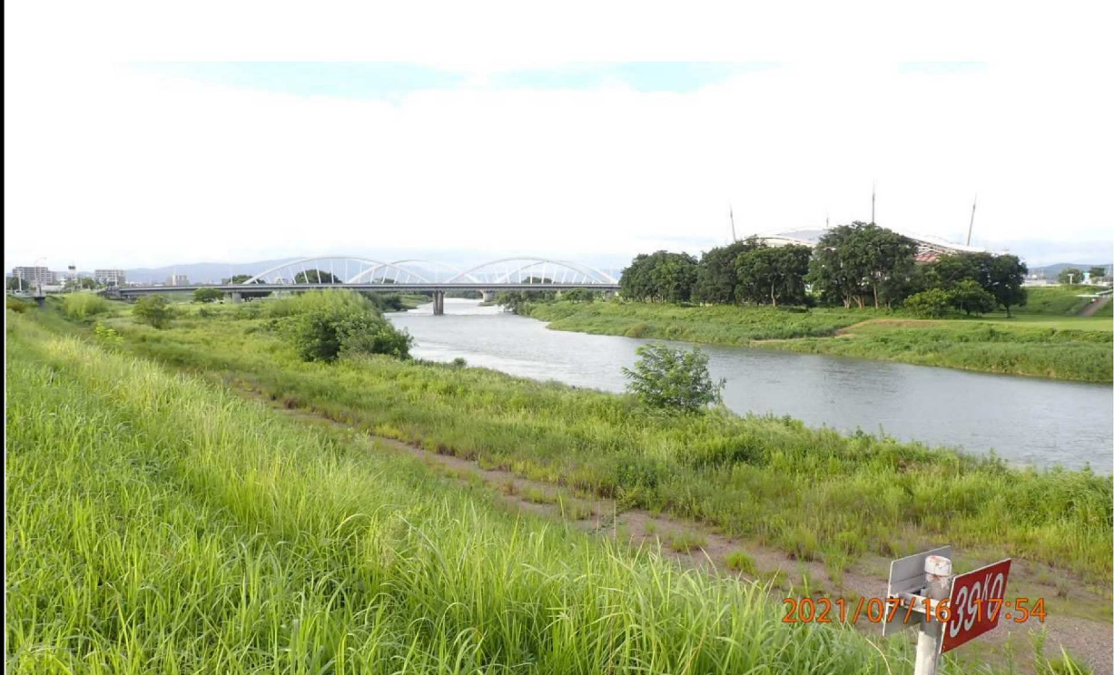
右岸39.0km付近より上流を撮影。久澄橋と上流に豊田大橋が見える。