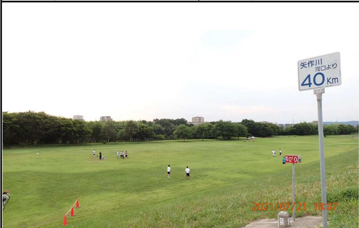
左岸40.0km付近より上流を撮影。広大な芝生が広がっている。