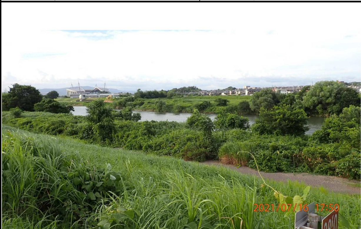
右岸38.0km付近より上流を撮影。遠方に豊田スタジアムが見える。