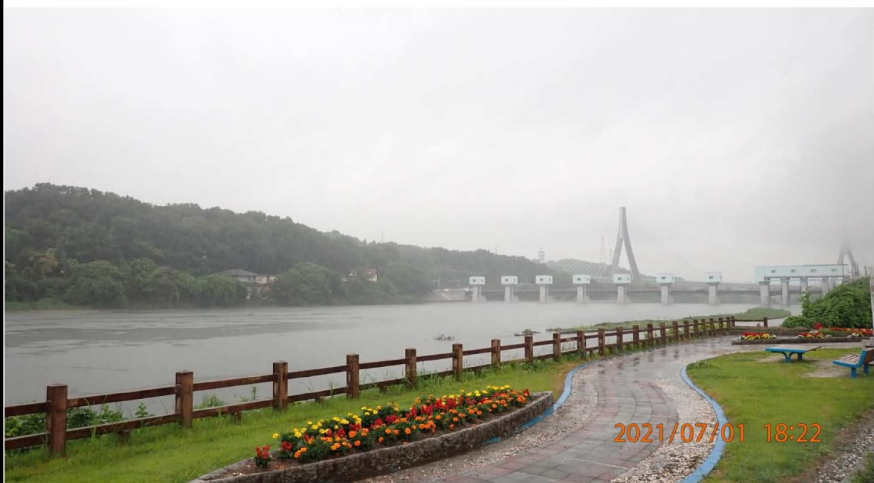
右岸35.0 k m付近より下流を撮影。