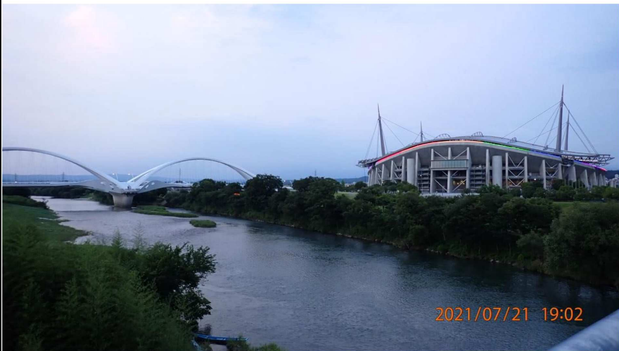
右岸40.0km付近の久澄橋より上流を撮影。 豊田スタジアムは夕刻になりはライトアップされていた。