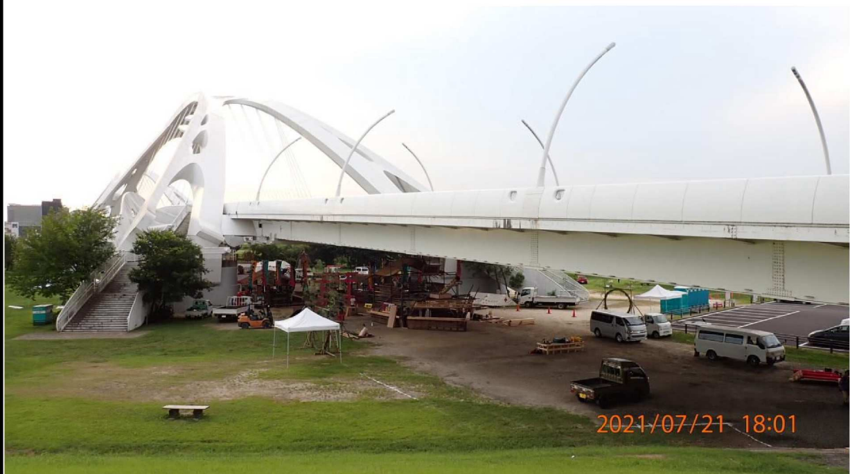
左岸40km付近からの豊田大橋。河川敷ではイベントの準備が行われていた。