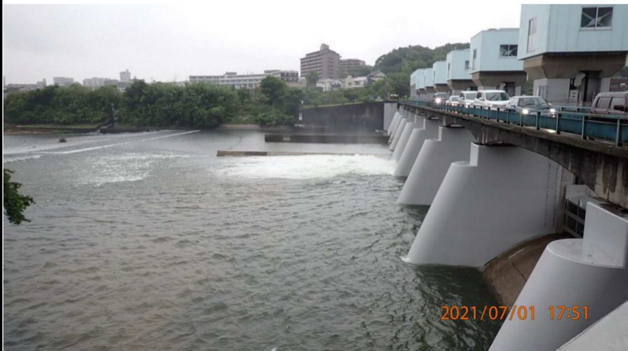
左岸34.6 k m付近の水源橋より対岸を撮影。