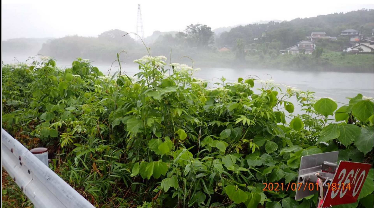
右岸36.0 k m付近より上流を撮影。本日は雨模様。