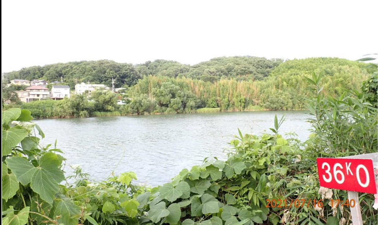
左岸36.0km付近より対岸を撮影。