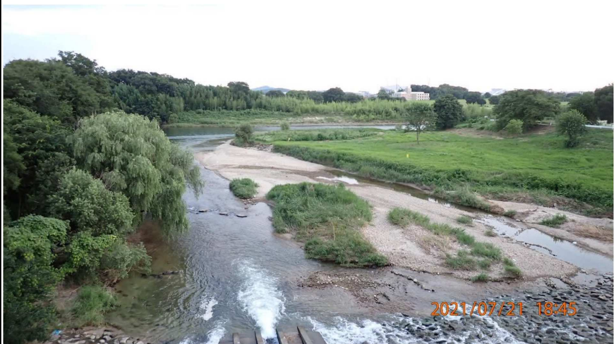
右岸41.6km付近の荒井橋より対岸を撮影。