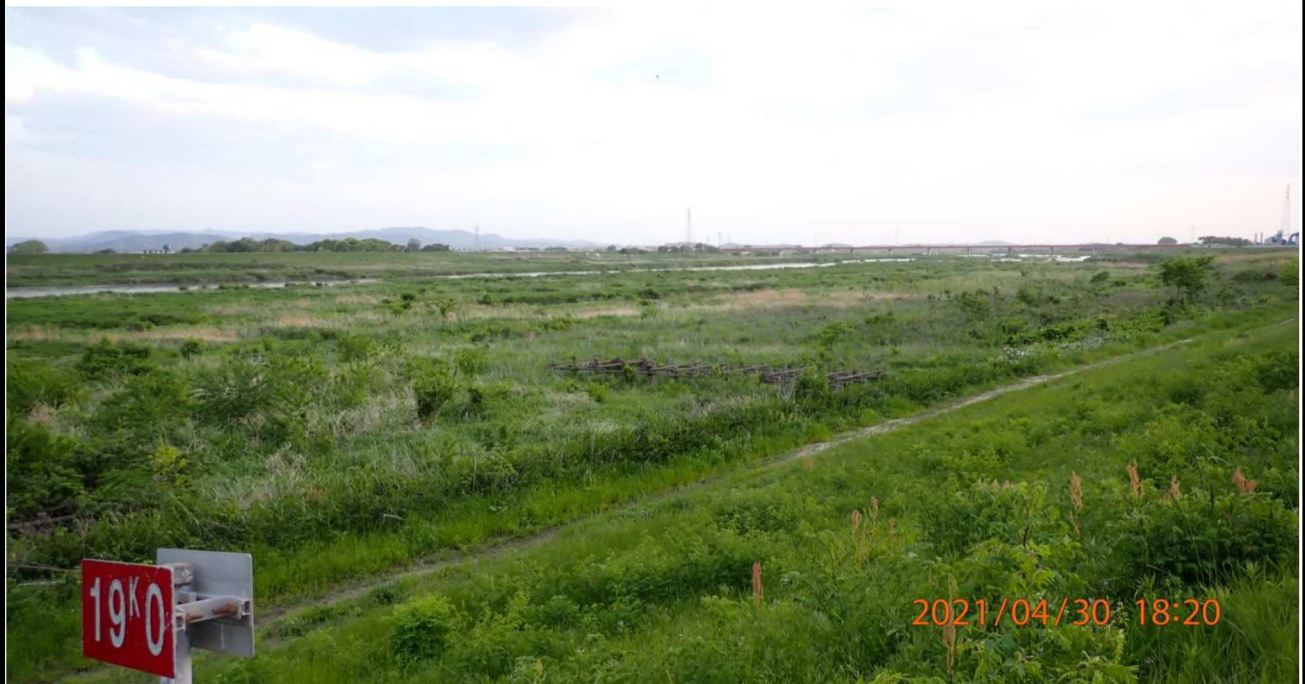
右岸19.km付近より下流を撮影。 多くの緑がよく見えた。