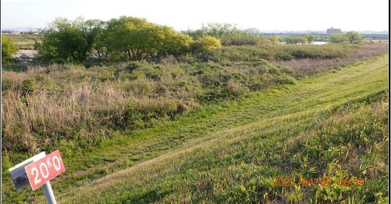
左岸20km付近より上流を撮影。