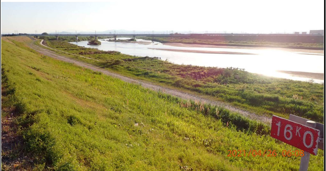
右岸16km付近より上流を撮影。