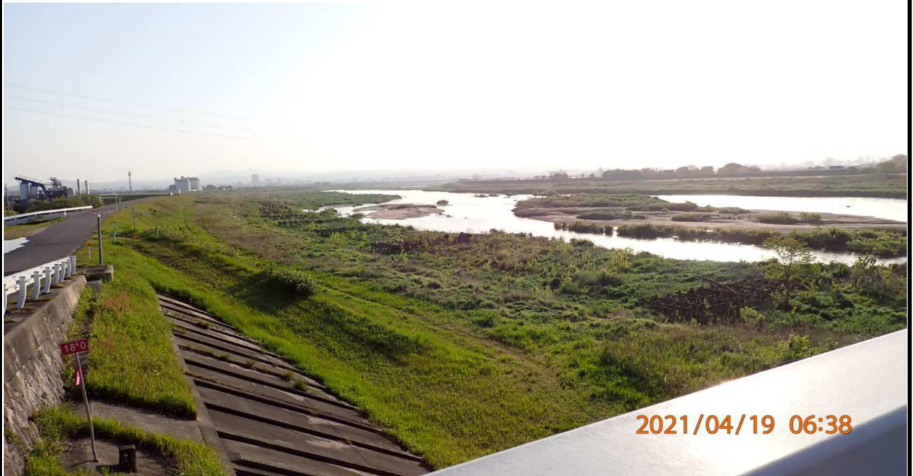
右岸18km付近の美矢井橋より上流を撮影。