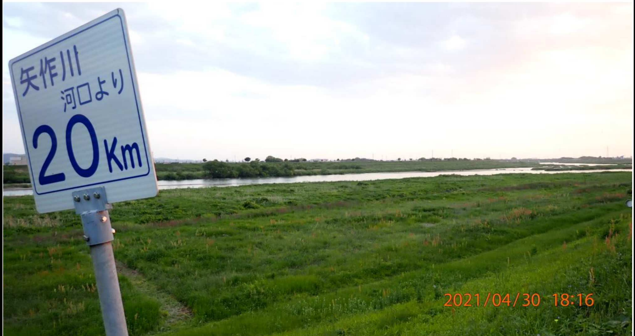
右岸20.km付近より下流を撮影。