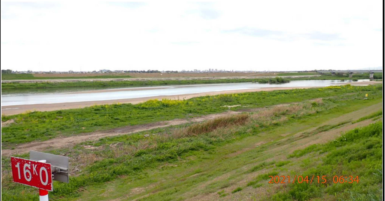
左岸16km付近より上流を撮影。