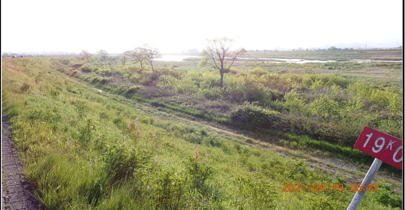
右岸19km付近より上流を撮影。 多くの雑草が茂っている。