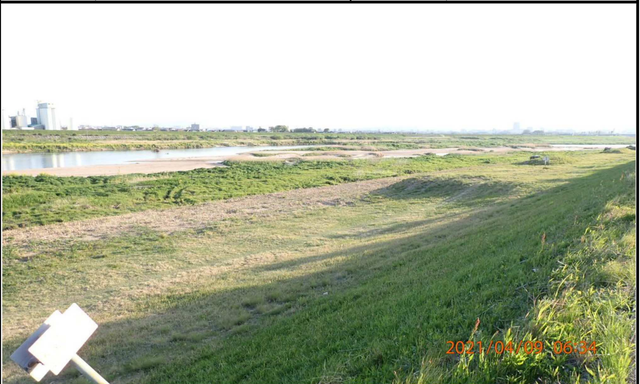
左岸19km付近より上流を撮影。