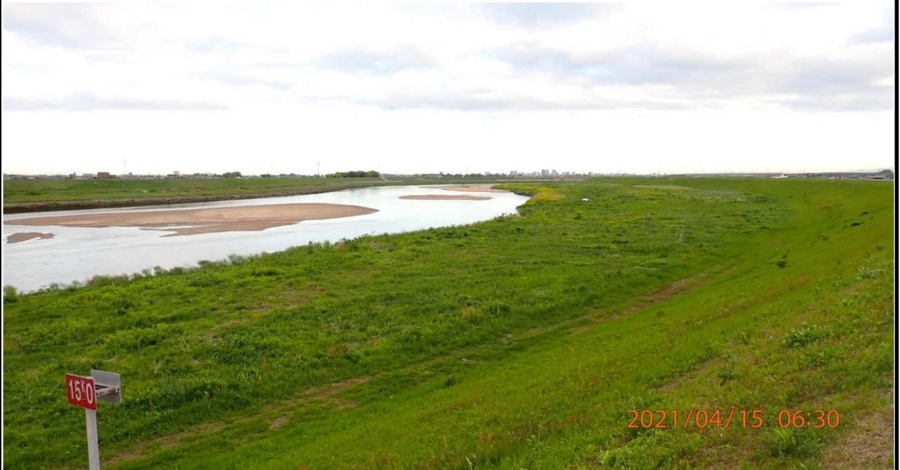
左岸15km付近より上流を撮影。 河川敷は緑一面であった。