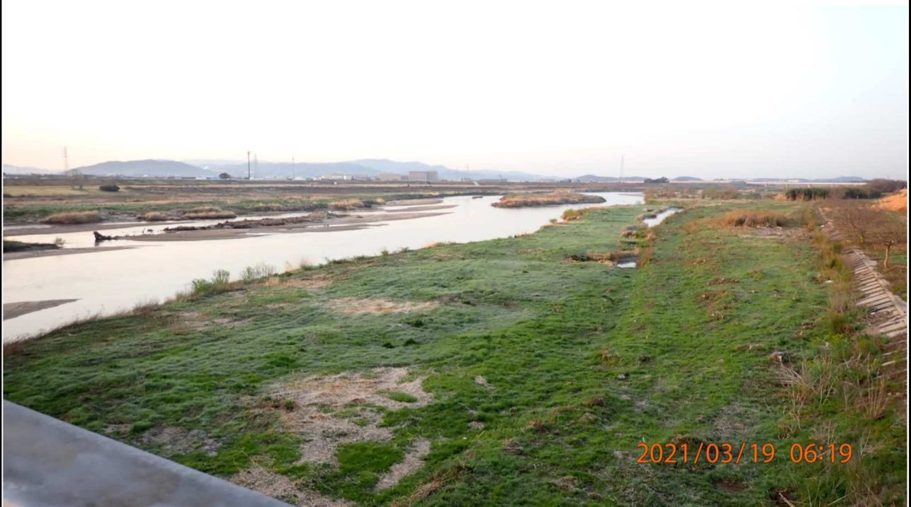
右岸18km付近より下流を撮影。