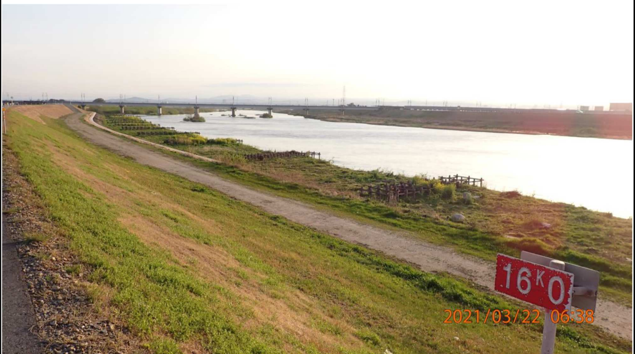
右岸18km付近より上流を撮影。