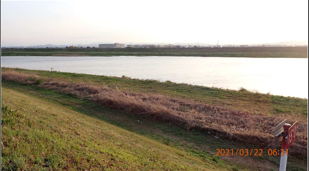
右岸15km付近より上流を撮影。 雨による増水がみえる。