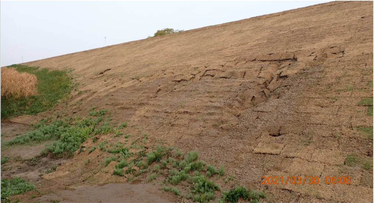
右岸17.3km付近の河川敷から斜面を撮影