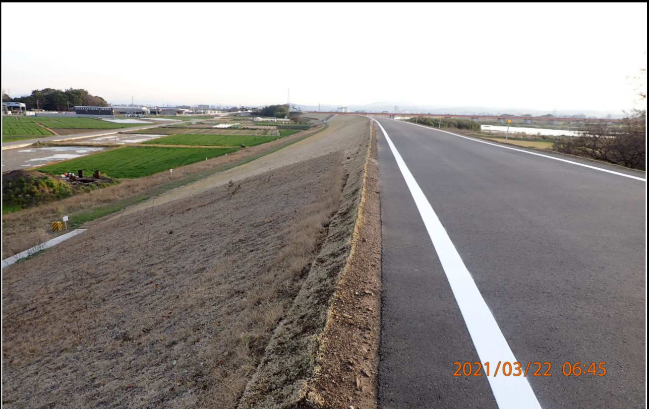
通行止めが解除された右岸17km付近の様子。 斜面が造成されている。