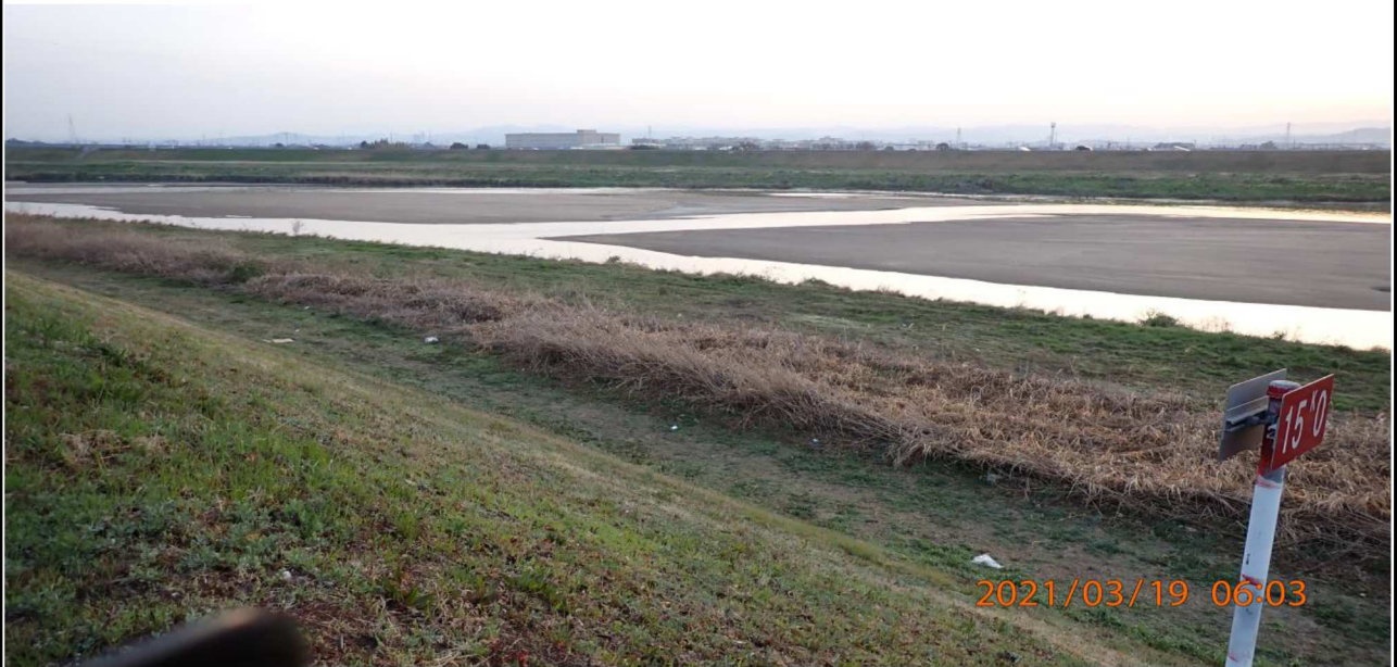
右岸15km付近より上流を撮影。