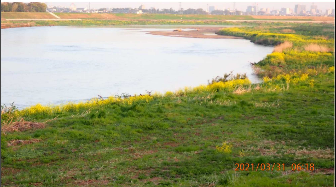
左岸15.km付近より上流を撮影。