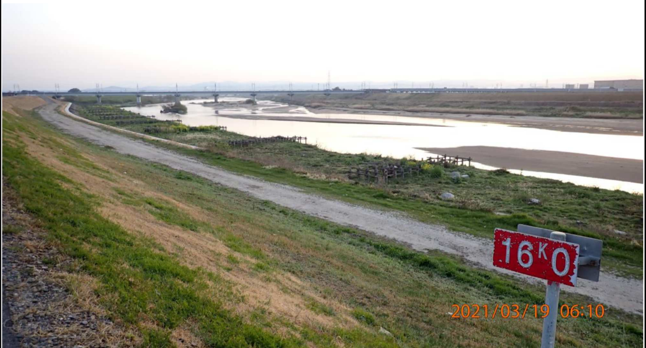
右岸16km付近より上流を撮影。 斜面も緑の広がりがみえる。