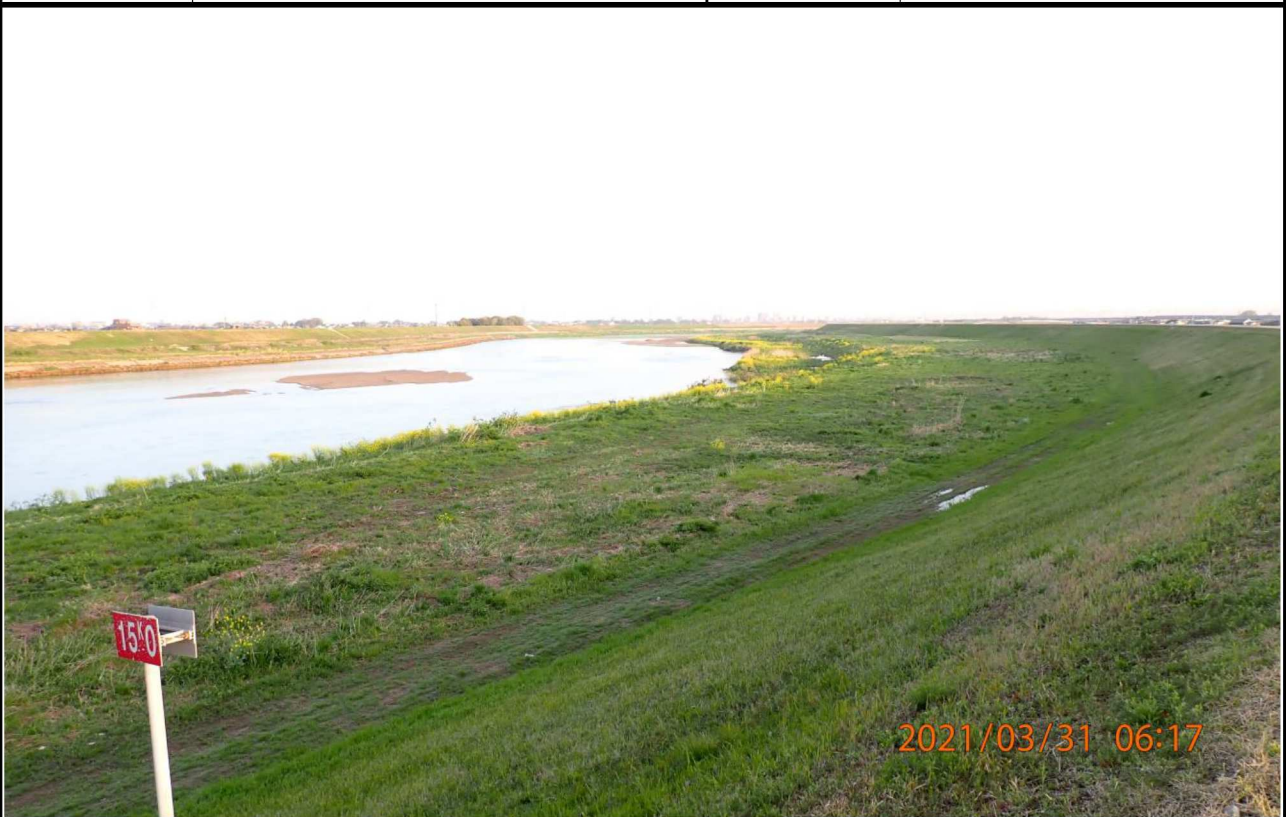
左岸15km付近より上流を撮影。 多くの緑に覆われている。