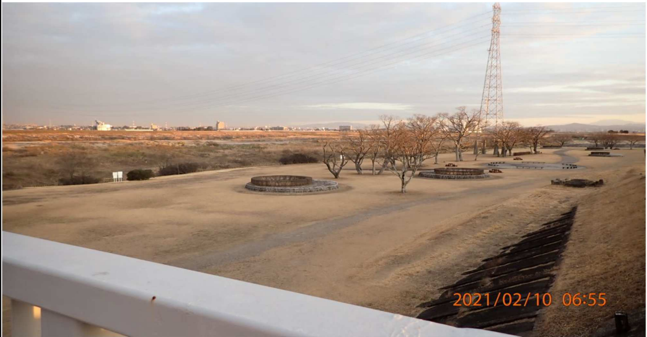
左岸18km付近より上流を撮影。