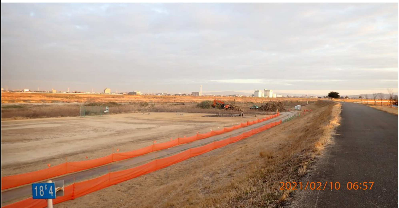
左岸18.4km付近より上流を撮影。