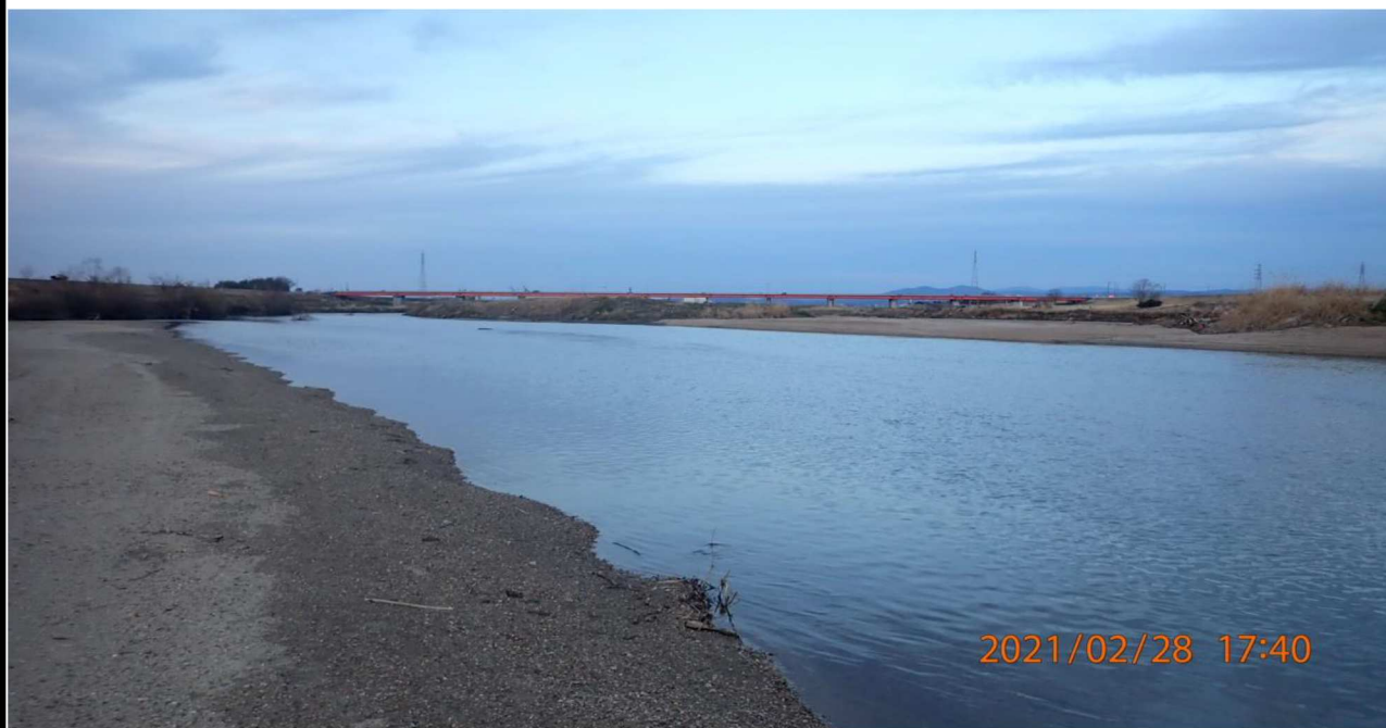
右岸15.6km付近より下流を撮影。 夕暮れ前の様子。