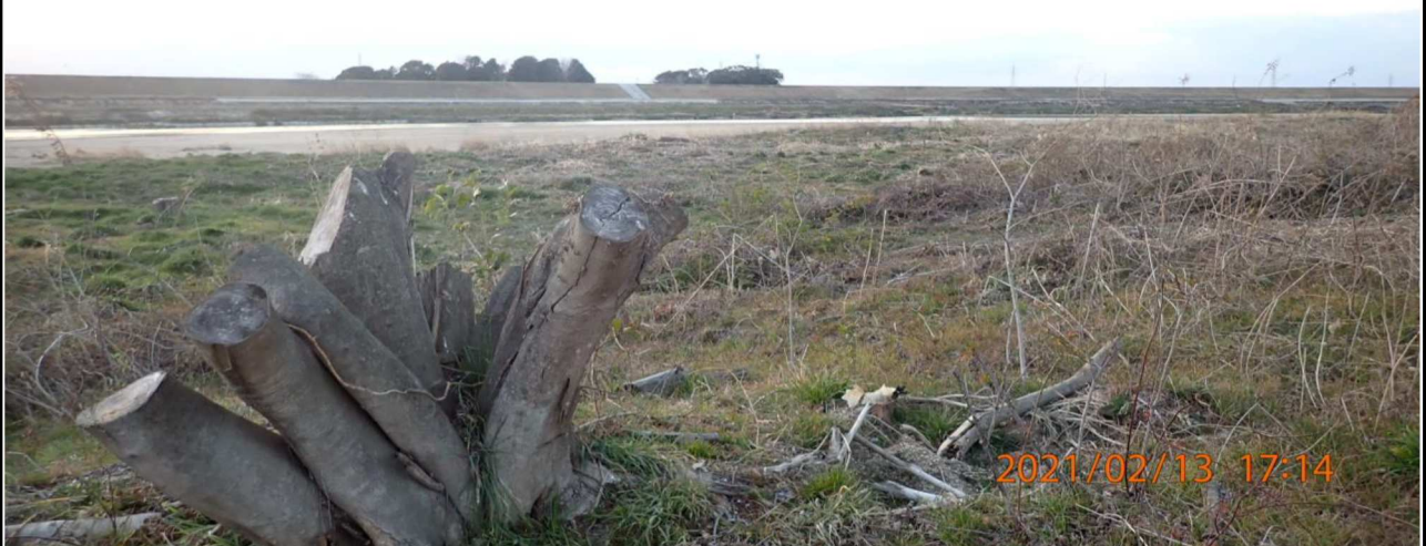
左岸15.2km付近より対岸を撮影。