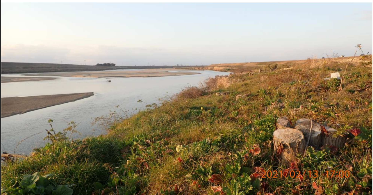
左岸15.km付近より上流を撮影。