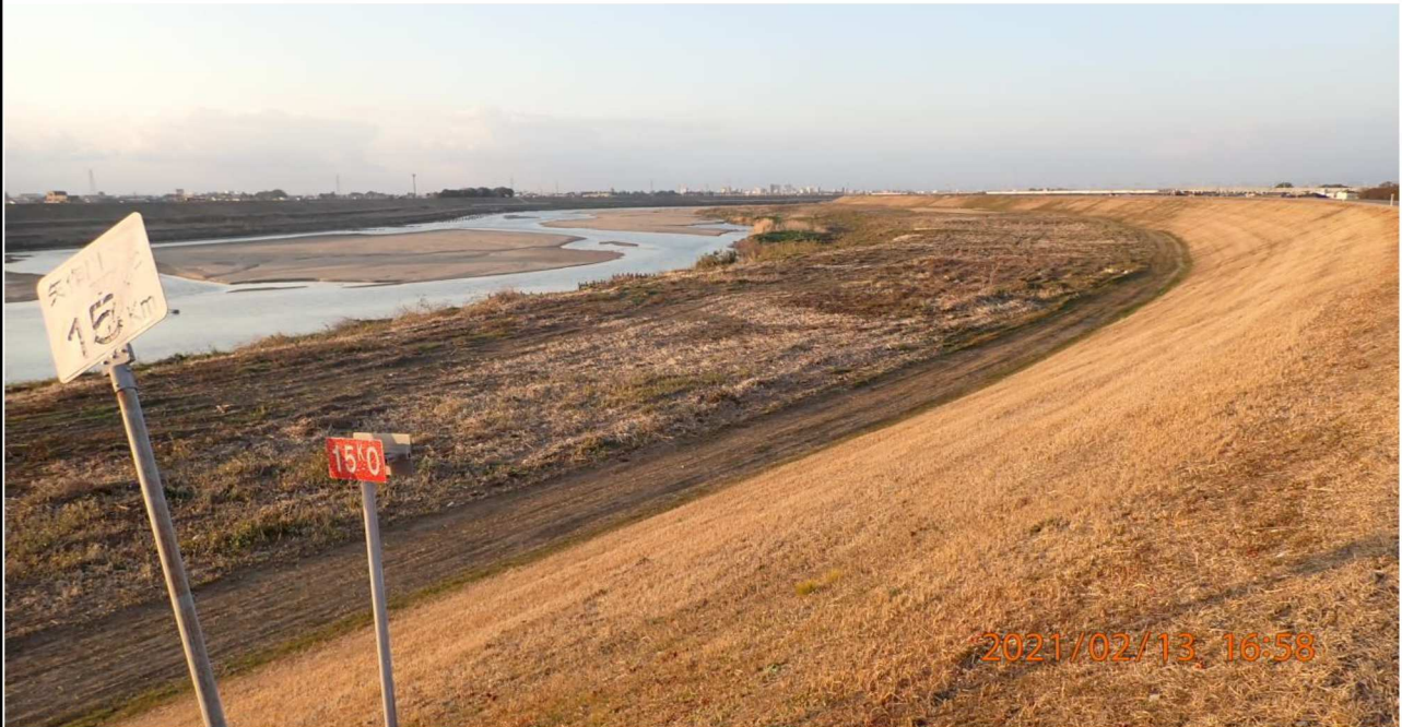
左岸15km付近より上流を撮影。