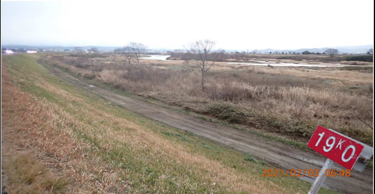
右岸19km付近より上流を撮影。