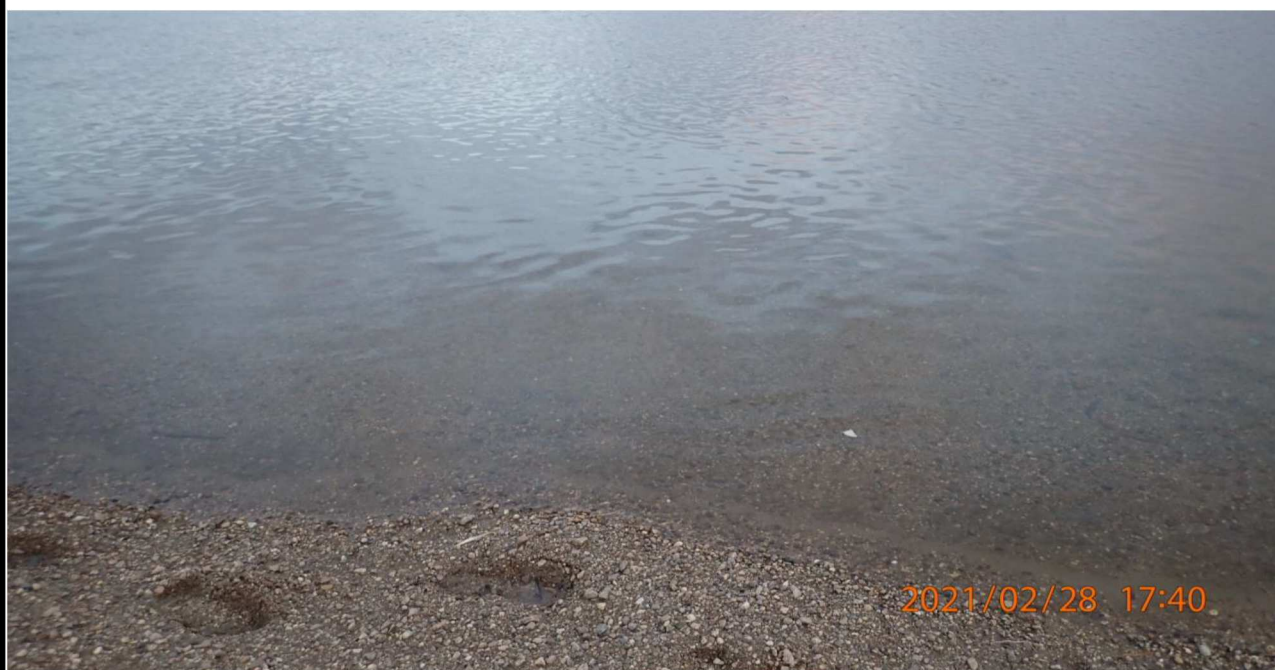
右岸15.6km付近の水面を撮影。