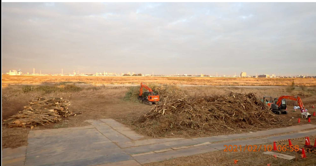
左岸18.5km付近の様子。 伐採した樹木を集めている。