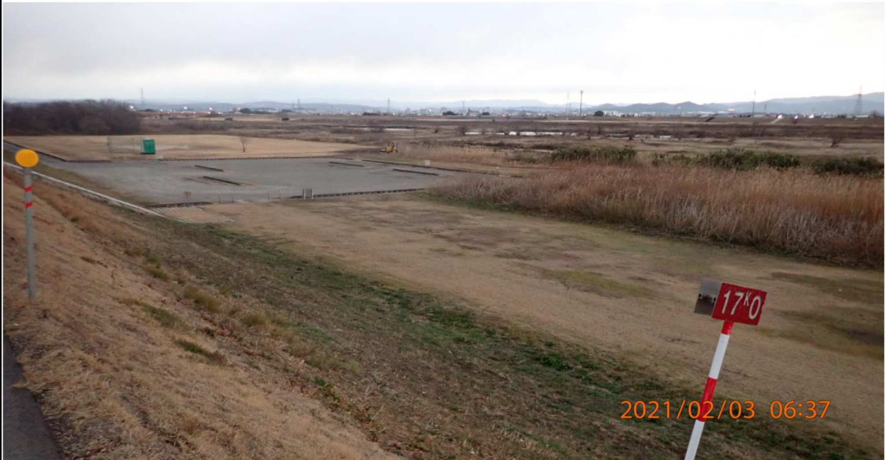
右岸17km付近より下流を撮影。