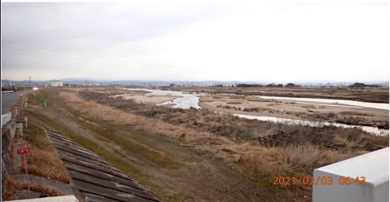
右岸18km付近より上流を撮影。