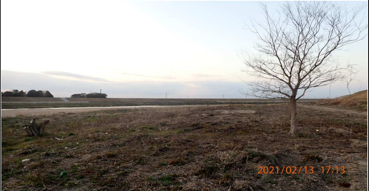
左岸15.2km付近より上流を撮影。 伐採の跡地。