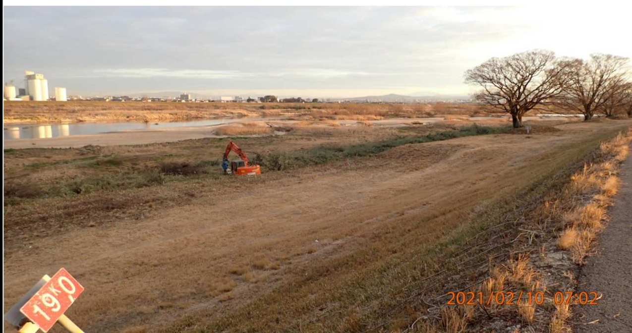
左岸19km付近より上流を撮影。 右の遠方に見える大きな樹木も伐採対象であった。