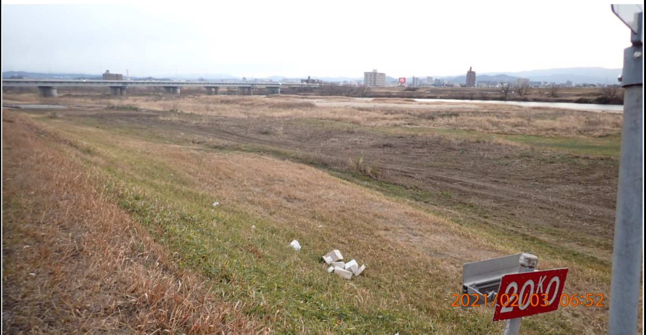
右岸20km付近より上流を撮影。