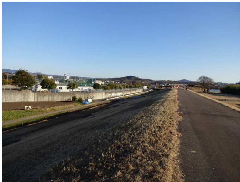
<令和3年1月31日撮影> 御立公園の下流部で、令和2年度矢作川森地区堤防補強工事が進んでおり、堤内の堤防下端に仮設道路が作られている。