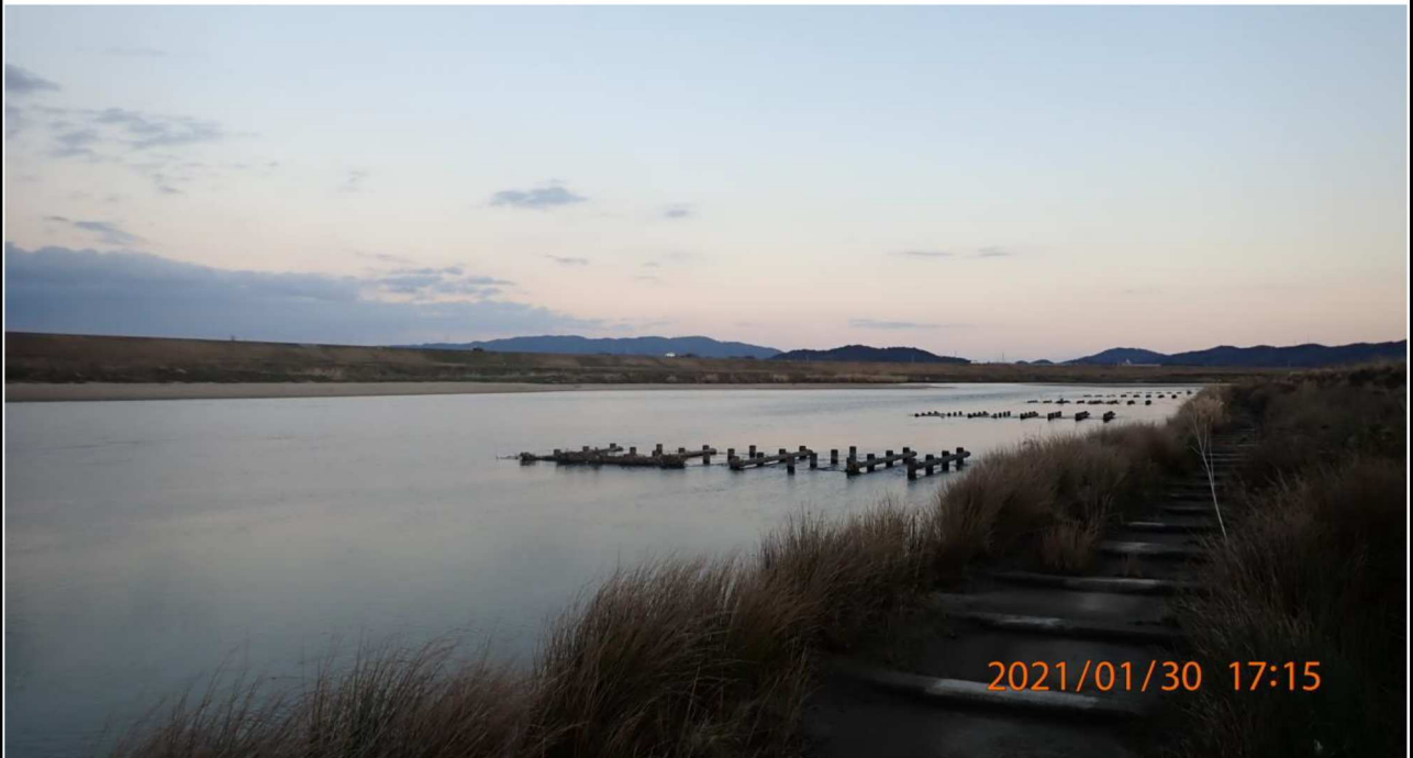
右岸15.6km付近より下流を撮影。 夕暮れ前の様子。