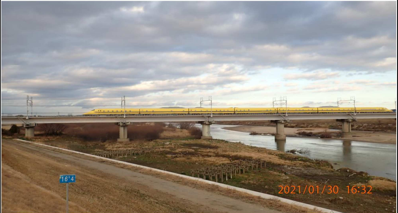
右岸16.4 km付近より上流を撮影。 ドクターイエローに遭遇した。