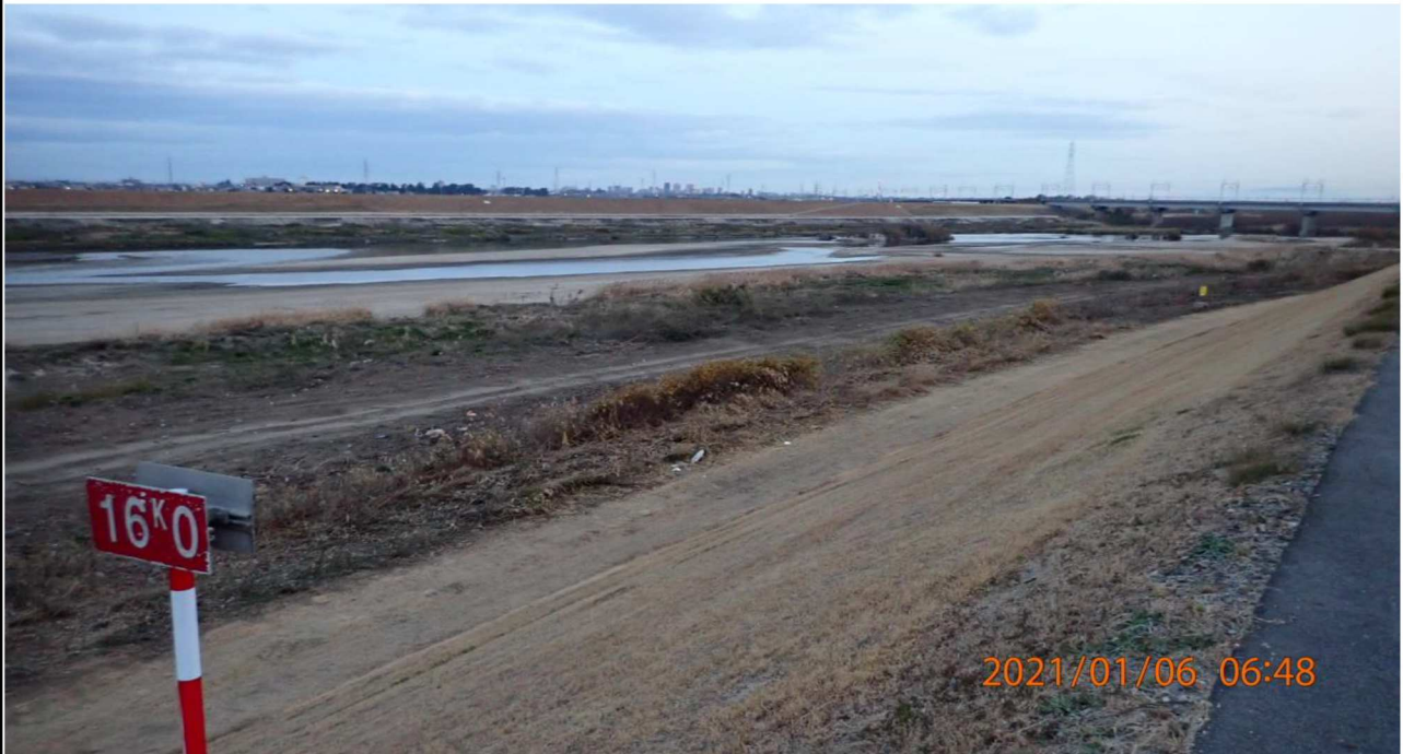
右岸16km付近より下流を撮影。 河川の幅も狭くなっている。