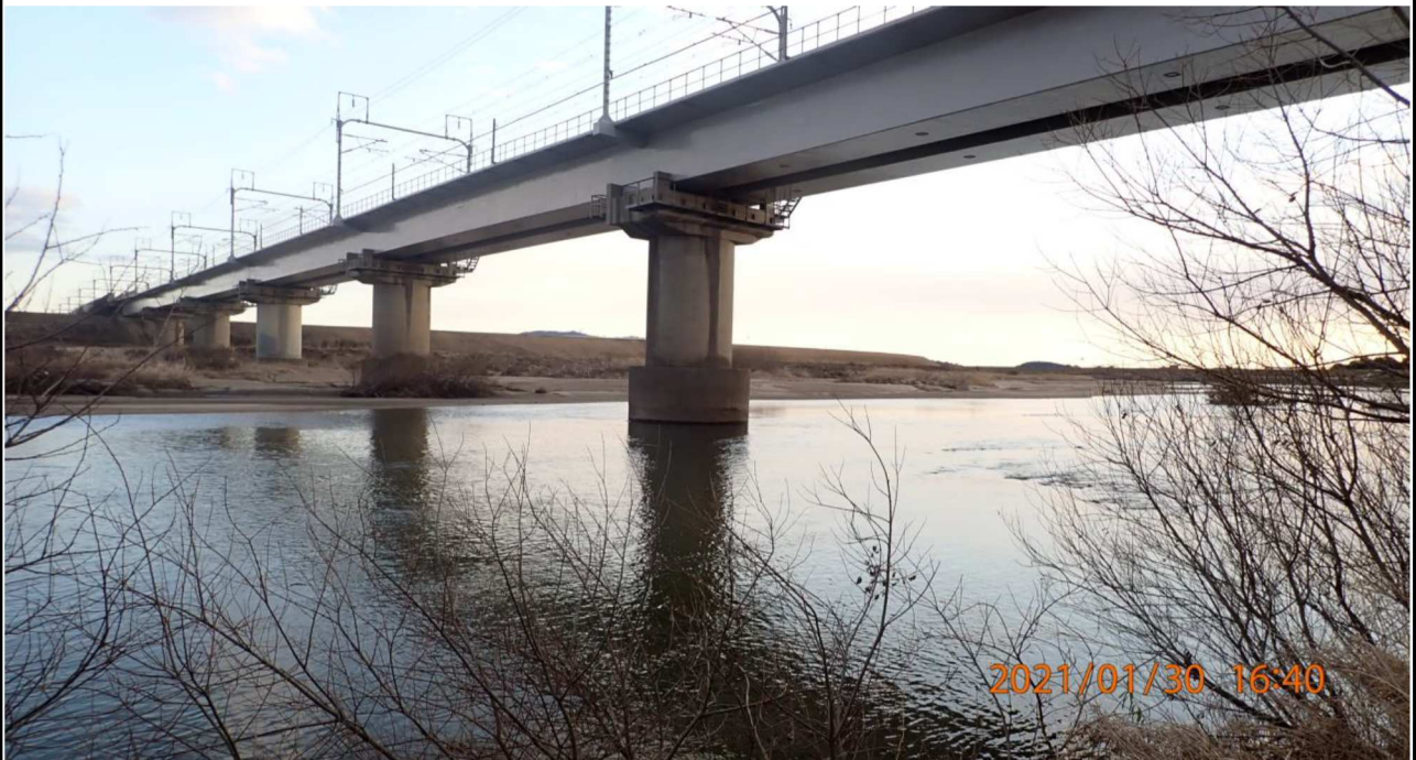
右岸16.5 km付近より下流を撮影。 河川敷に降りて撮影。