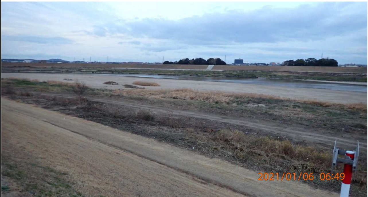
右岸16km付近より上流を撮影。