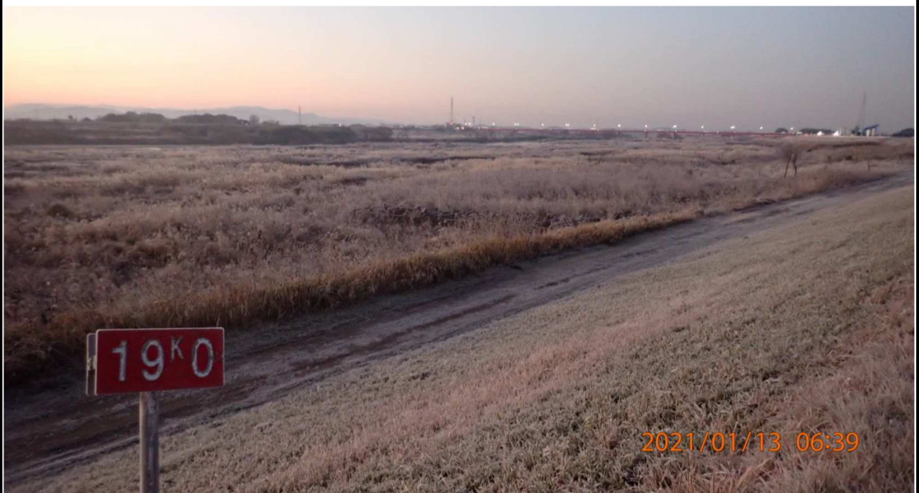
右岸19km付近より下流を撮影。