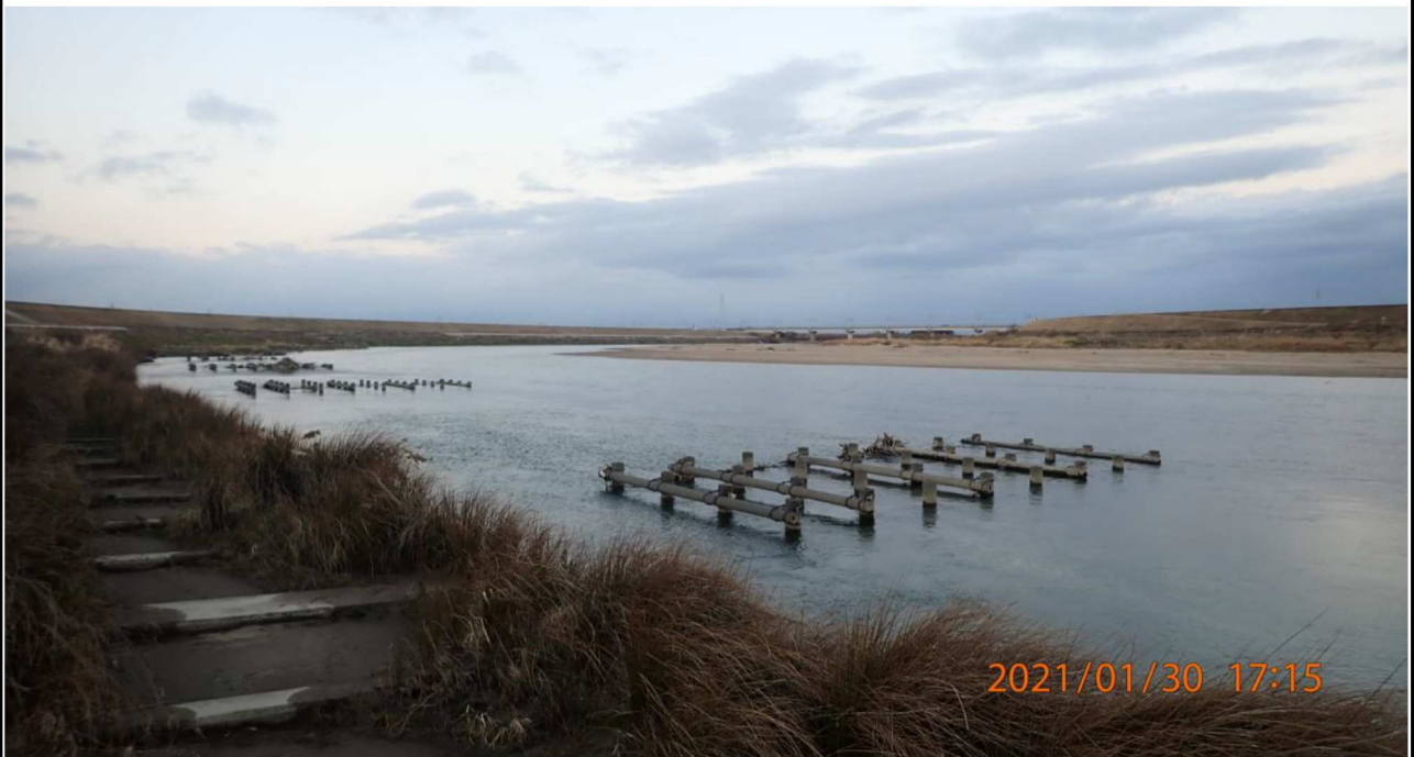
右岸15.6km付近より上流を撮影。