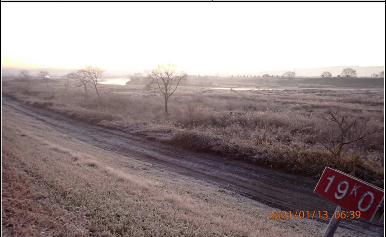
右岸19km付近より上流を撮影。 霧で視界が悪くなっていた。