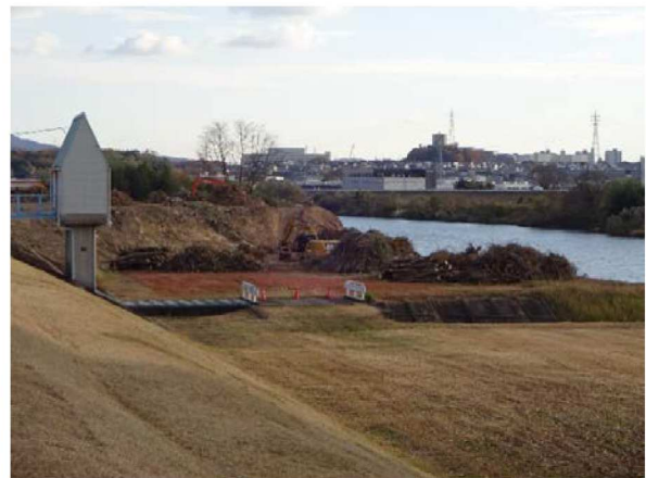
＜令和2年12月12日撮影＞ 御立公園の下流部で、令和2年度矢作川森地区堤防補強工事が始まっており、堤外の河畔林が伐採されていた。