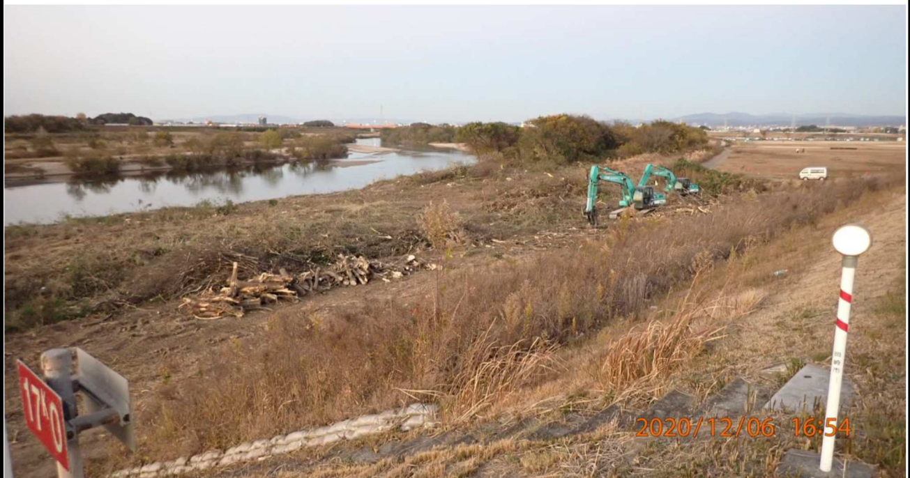
右岸17km付近より上流を撮影。重機による伐採の様子。