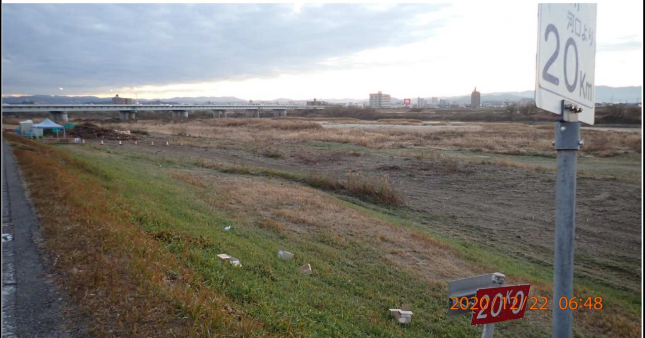
右岸20km付近より上流を撮影。