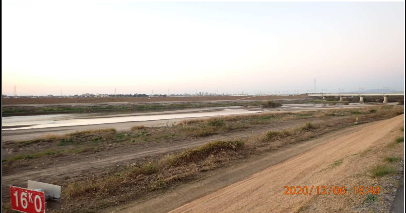
左岸16km付近より上流を撮影。