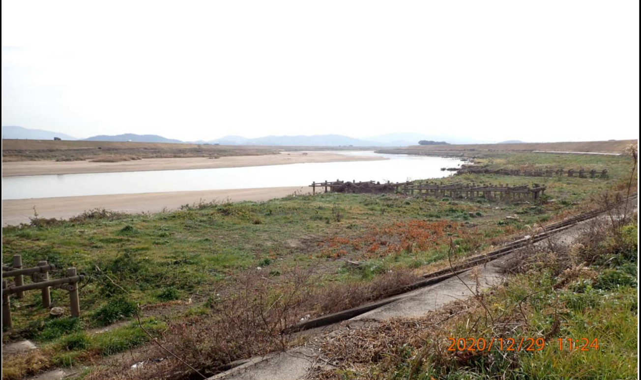
右岸16km付近より下流を撮影。