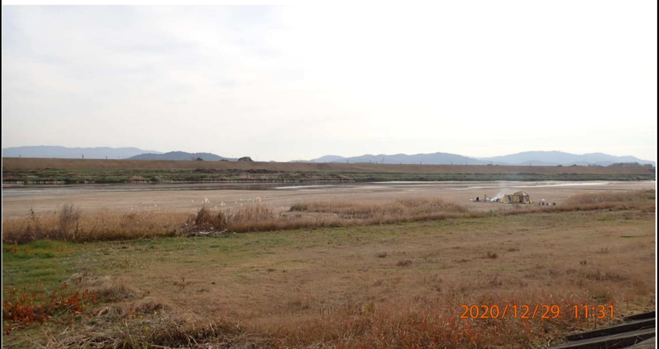
右岸15km付近より下流を撮影。河川でキャンプする人達が見える。