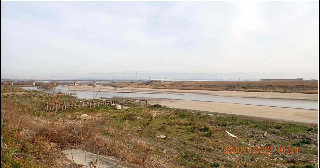
右岸16km付近より対岸を撮影。