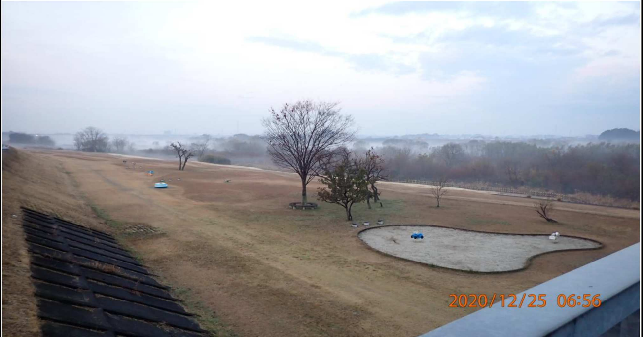
左岸18km付近の美矢井橋より下流を撮影。霧が発生している。