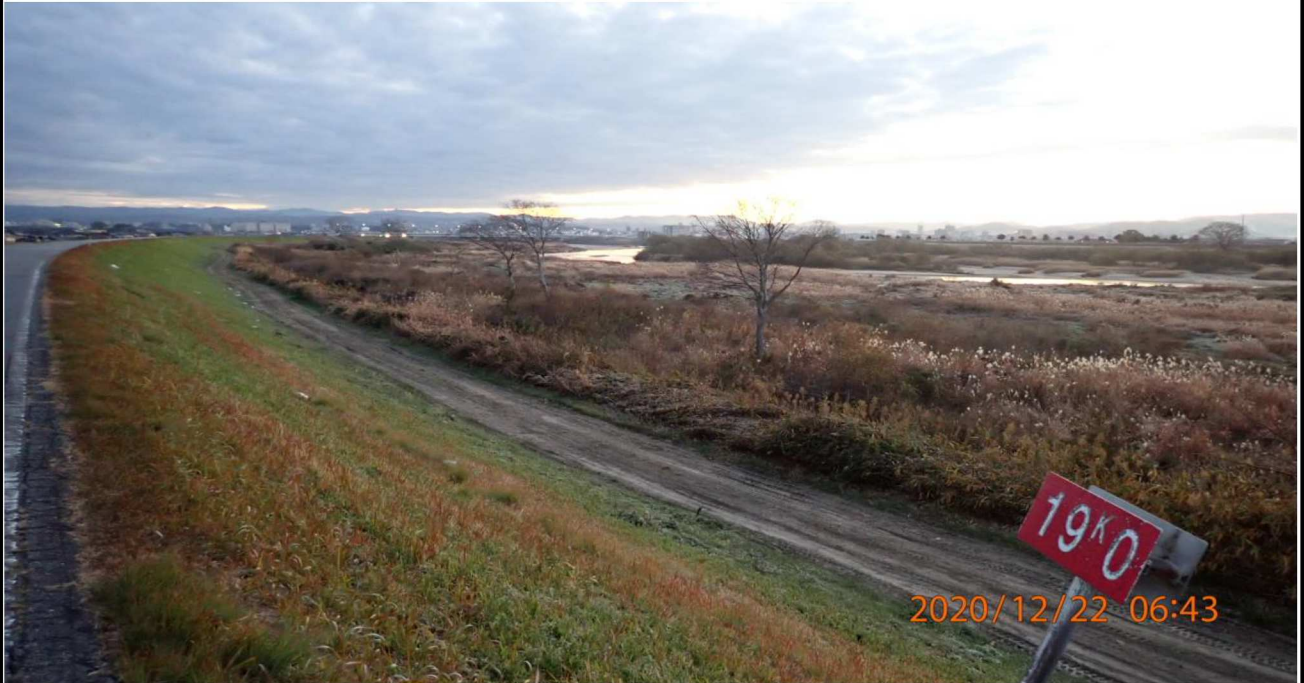
右岸19km付近より上流を撮影。