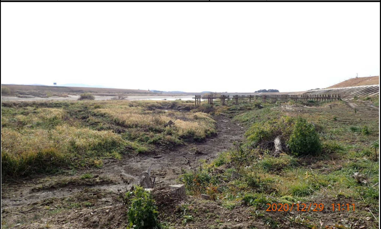
右岸16.8km付近より下流を撮影。水量が少ない様子。