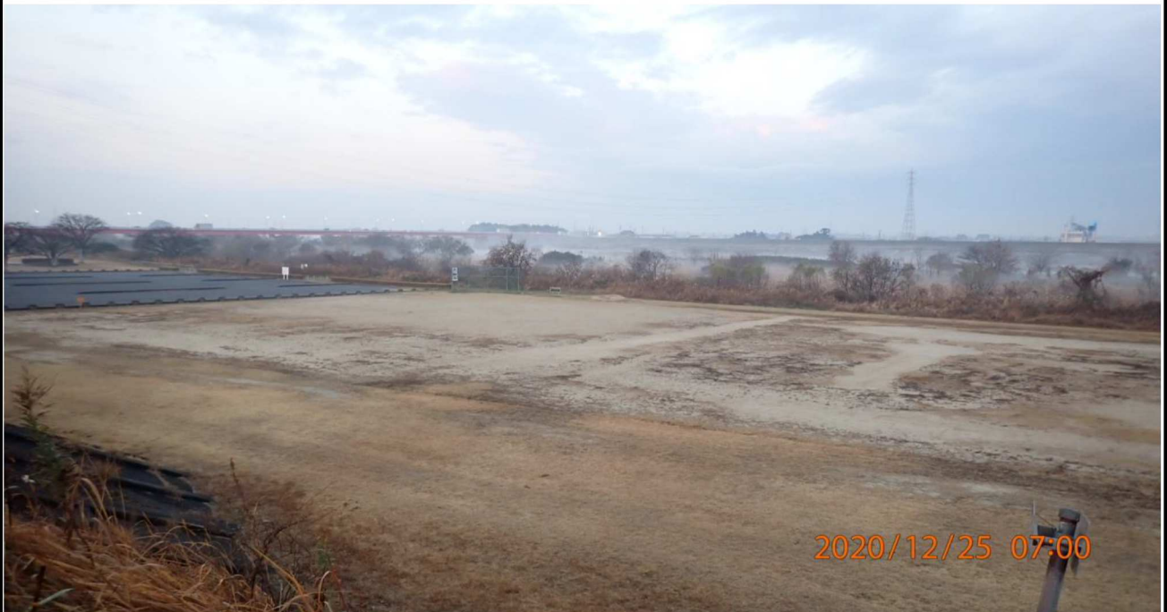
左岸18.4km付近より下流を撮影。河川には霧が溜まっている。