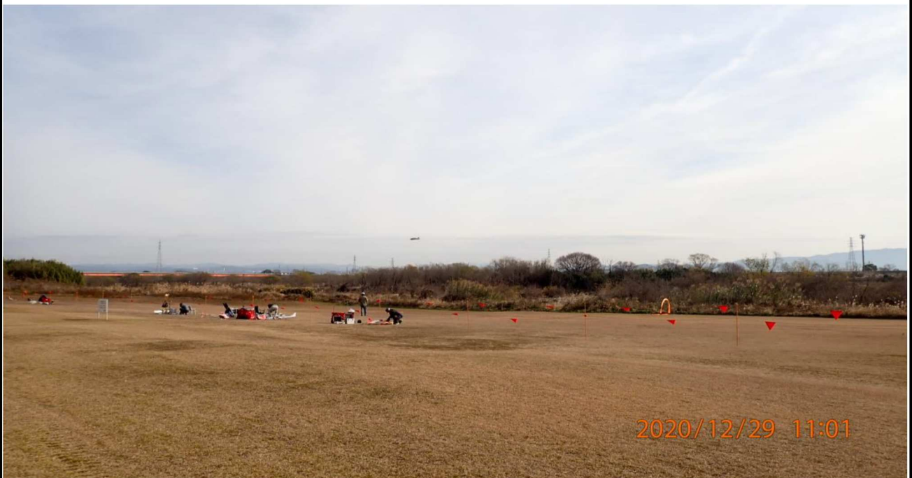
右岸18km付近より対岸を撮影。UAV飛行機を操縦する人達が見える。