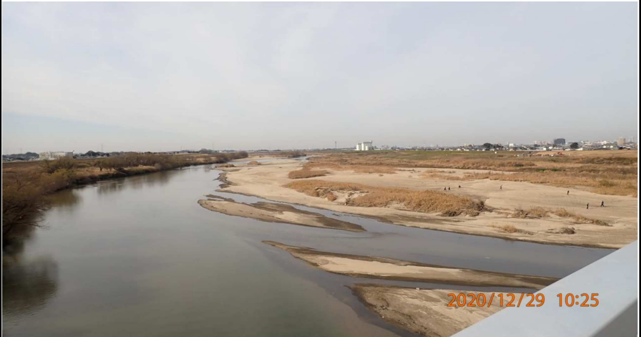
左岸20km付近の渡橋より下流を撮影。 右側の中洲でトレーニングする人達が見える。